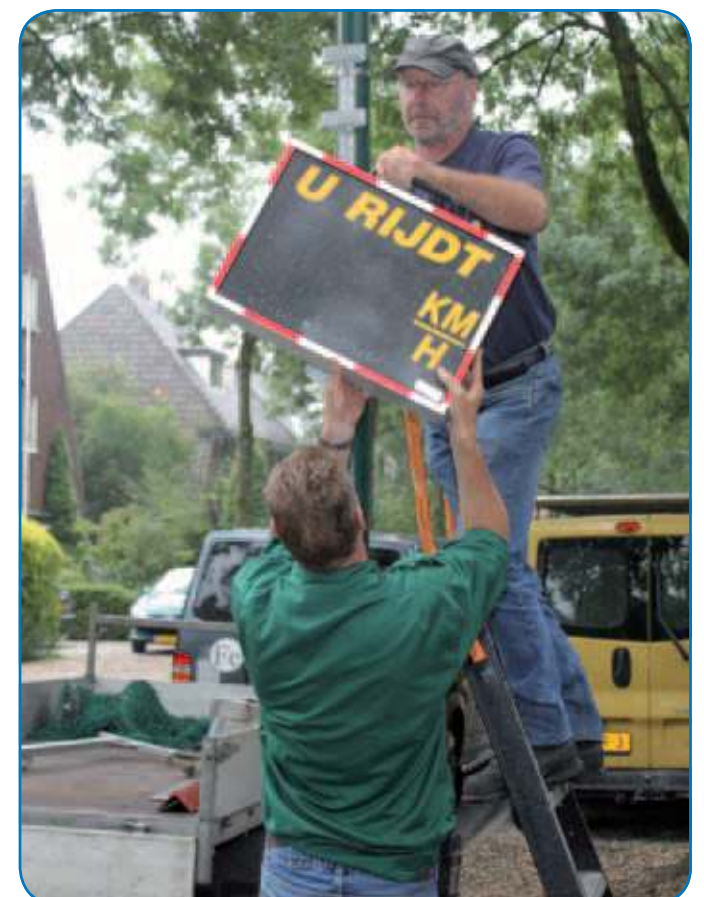
Woensdag 24 augustus werd (voor 14 dagen) op de Spoorlaan een snelheidsmeter geplaatst.

Verder hoopt VHR dat er ook snelheidsmeters op Dennenlaan en Vuursche Dreef geplaatst worden, evenals mogelijke borden nabij school qua parkeergedrag en attentie voor spelende kinderen.