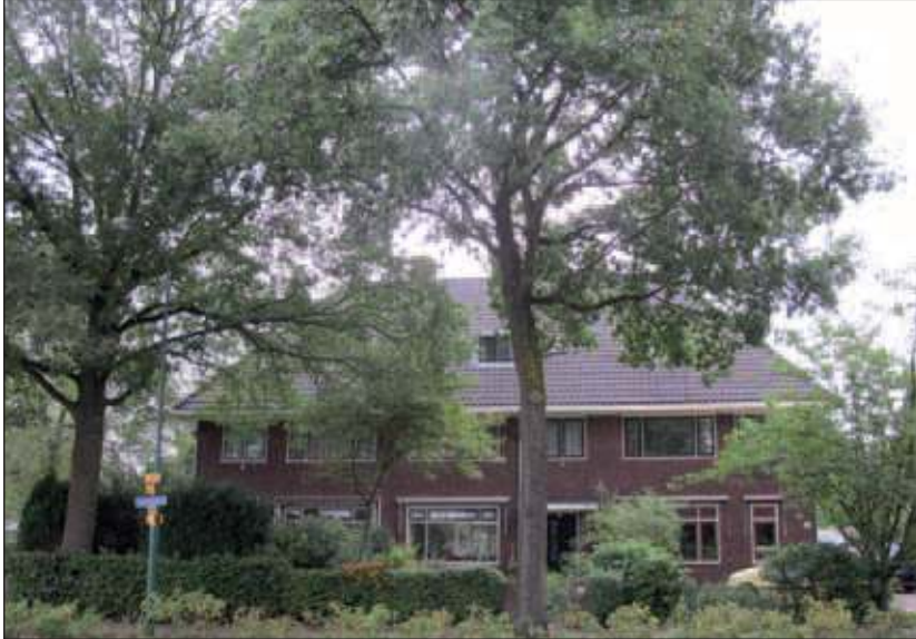
De drie panden aan de Leijenseweg blijven waarschijnlijk gespaard.

Dat er meer haast bij de ondertunneling van de overweg Leijenseweg is gekomen, is ook te lezen in De Provinciale Ruimtelijke Structuurvisie van de Bestuursregio Utrecht van juni 2011: 'Gezien de veiligheidsproblematiek en de ontwikkeling van Randstadrail is het daarnaast zeer wenselijk ook de spoor kruising met de Leijenseweg te ondertunnelen. De gemeente voert daarover gesprekken met betrokken partijen om dit zo snel mogelijk gerealiseerd te krijgen.' Mogelijk gaat het College van B en W terugrijpen op een inventarisatie