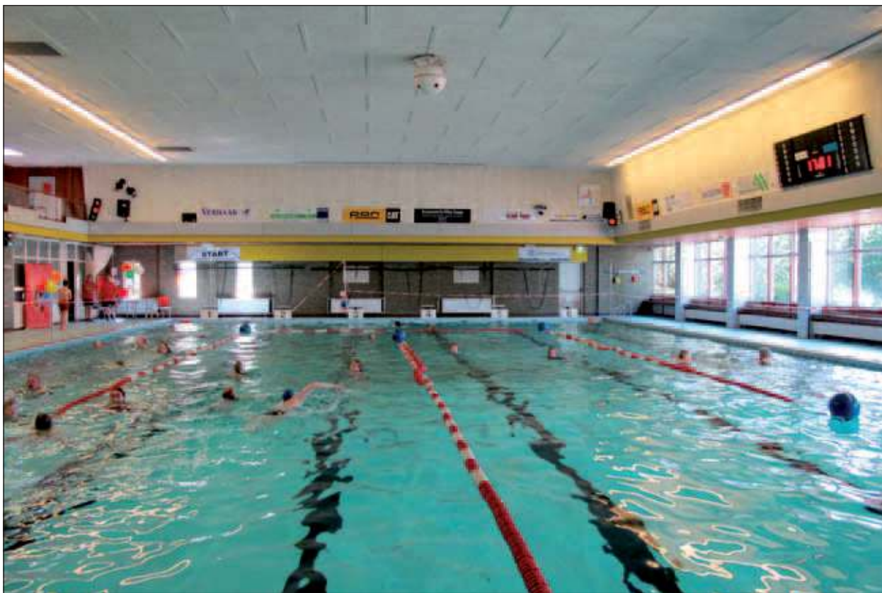
Een geliefde activiteit in Zwembad Brandenburg is de jaarlijkse zwemvierdaagse, waaraan door zowel senioren als volwassenen, kinderen en soms zelfs hele gezinnen wordt deelgenomen.

September is de maand dat Combibad Brandenburg 35 jaar geopend is. Het feestjaar wordt ingeluid met het besluit om de tarieven niet met de jaarlijkse index te verhogen. In september wordt er op verschillende manieren aandacht besteed aan het lustrum. Iedere zondag in september mogen gezinnen voor € 5 per gezin komen zwemmen. Op zondag is het bad van 10.00 tot 12.00 uur open voor banen zwemmen en 's middags tussen 12.00 en 14.00 uur is er speelmiddag met speelgoed in het water. Voor de vroege zwemmers staat er op 5, 6, 8 en 9 september van 7.30 tot 8.30 uur een gratis ontbijt klaar. Van 12 tot en met 16 september mag iedereen die deelneemt aan een doelgroep gratis een introductie meenemen om gezellig samen te sporten. Dit geldt alleen voor een introductie die niet eerder aan het zwemmen voor doelgroepen heeft meegedaan. Op maandag 19, dinsdag 20 en donderdag 22 september van 12.00 tot 13.30 uur mogen zwemmers aanschuiven bij een gratis lunch. Van 26 t/m 30 september is er voor alle bezoekers koffie met cake. Ten slotte organiseert Zwembad Brandenburg in de herfstvakantie op woensdag 19 oktober van 13.00 tot 16.00 uur een speciaal kinderfeest speelmiddag.