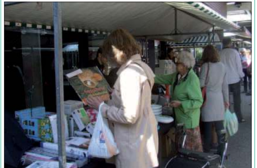
De zon die de voorgaande dagen verstek had laten gaan kwam tijdens de braderie in De Kwinkelier weer af en toe tevoorschijn. Daardoor werd het toch nog gezellig druk bij de kraampjes.