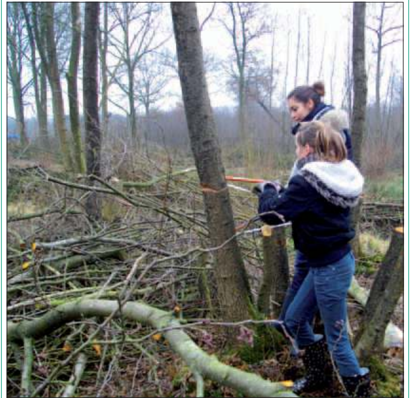
Jaarlijks gaan zo'n 1.600 leerlingen aan de slag in het landschap.

Jaarlijks gaan zo'n 1.600 leerlingen aan de slag in het landschap. Zij ondersteunen boeren en particuliere grondeigenaren bij het onderhoud van kleine landschapselementen, zoals knobbomen, houtsingels en hakhoutbosjes. Het doel hiervan is om jongeren actief te betrekken bij vrijwilligerswerk. Bovendien helpen zij zo mee aan de instandhouding van natuur en landschap in de provincie Utrecht.