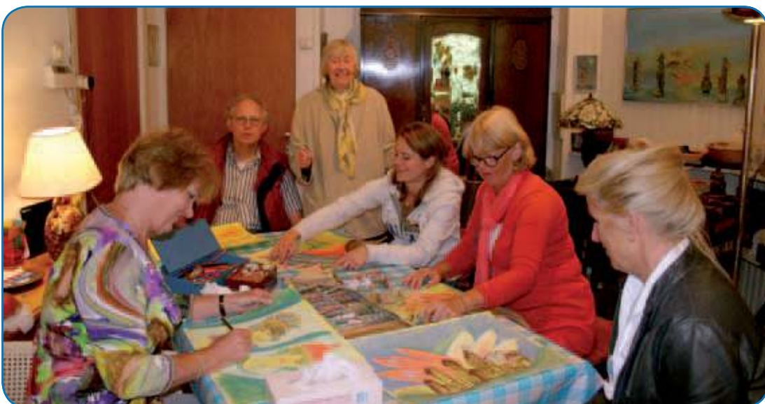
Verrassende resultaten tijdens het schilderen bij Ansèl.