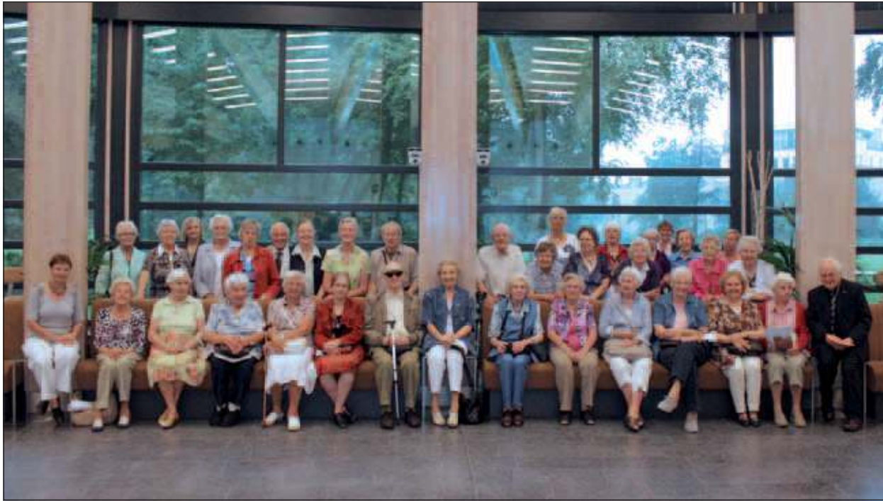
Met maar liefst 31 deelnemers werd het 'rondje gemeentehuis' afgesloten.

Ook in de zomer van 2011 organiseerde de gemeente De Bilt voor ouderen drie rondleidingen in het gemeentehuis op verzoek van en in samenwerking met de Stichting Dag van de Ouderen.