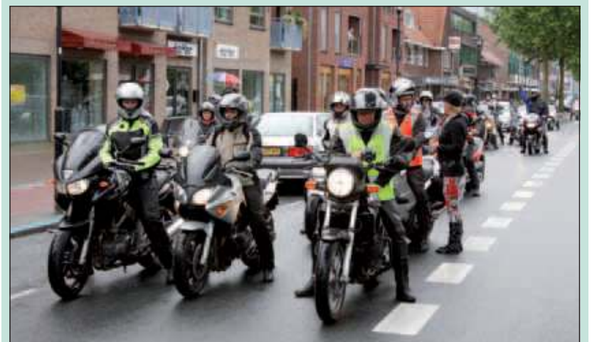
Afgelopen zondag verzamelden zich 's ochtends zo'n 50 motorrijders van de Biltse Motorrijders Vereniging (BMV) voor de 17e 'Grote Biltse Motor Toertocht' vanuit en vanaf de Qwibus in De Bilt. Het aantal lag beduidend lager dan verwacht en dat had vermoedelijk te maken met de slechte weersomstandigheden. Ook tijdens de tour viel er veel water uit de hemel. [Reyn Schuurman]