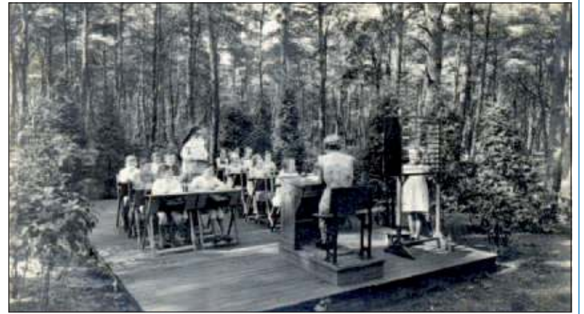
De openluchtschool van Berg en Bosch in 1942.

Hoe ging het er gewoonlijk aan toe, wat heeft een onuitwisbare herinnering achtergelaten, wat heeft u meegenomen uw verdere leven in?