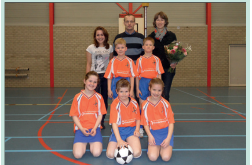
Op de shirts van het allerjongste team van DOS prijkt nu de naam en logo van dit Tienhovens bedrijf.

Het bestuur van DOS is blij met deze lokale sponsor. Ook de spelers van de F2 hadden het naar hun zin in de mooie nieuwe shirts en wonnen hun thuiswedstrijd met 5-2 van Animo.