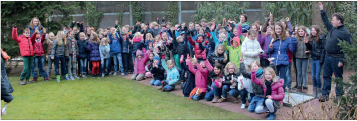
Voor de afslag van het jubileumseizoen waren alle leerlingen van de groepen 4A t/m 8B van de Theresiaschool uit Bilthoven vrijdag 22 maart uitgenodigd te komen midgetgolven. Op de foto de groepen 4B, 6A en 8B van de in totaal 270 kinderen, die in groepsverband de balletjes over het parcours van 18 holes met zo min mogelijk slagen aflegden.

Midgetgolf is een sport en meer dan een populaire vakantiebezigheid. De start van het jubileum van Midgetgolf Bilthoven, gelegen in de mooie bosrijke omgeving van de Julianalaan op de grens met Bosch en Duin vond afgelopen vrijdag plaats onder 'ijzige' weersomstandigheden. Omdat de vooruitzichten op een snelle weersomslag uiterst onzeker zijn is de gezellige dag ter gelegenheid van het jubileum verschoven naar april, maar het seizoen is al wel gestart.