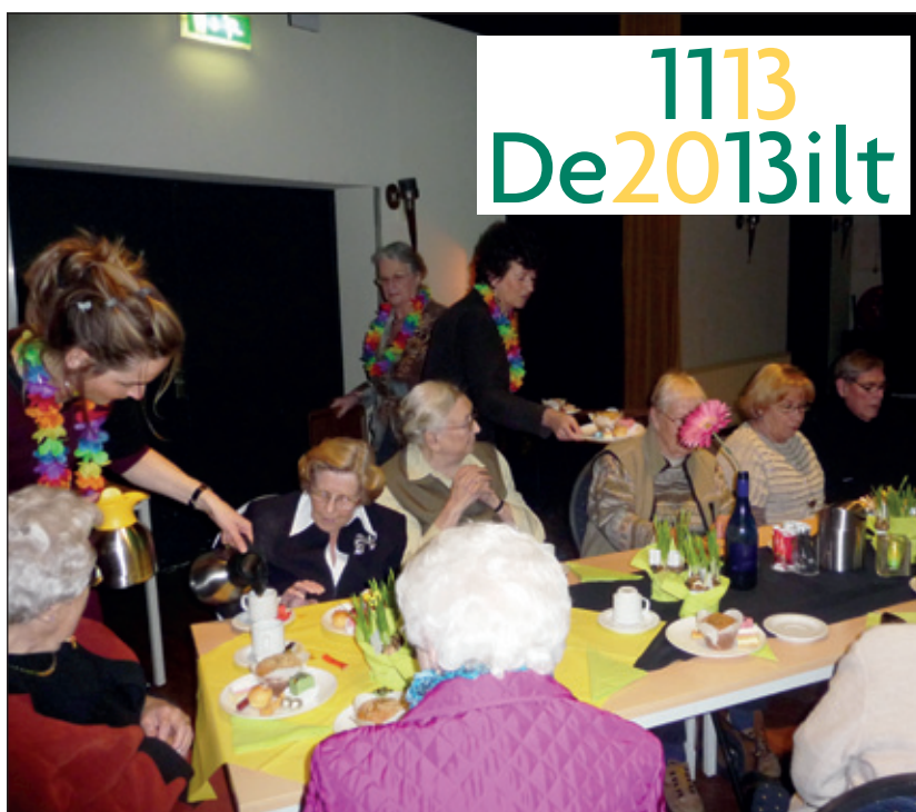
Bewoners van Dijkstate in Maartensdijk genieten van de High Tea.

Naast een optreden van respectievelijke Zang Veredelt De Bilt en het Groenekans Muze Koor werd er genoten van de gezelligheid en het lekkers op tafel. Na afloop werden op alle locaties ballonnen opgelaten. Vanwege de kou bleven velen binnen. Toch was het een mooi gezicht: ballonnen in de gemeentekleuren geel en groen.