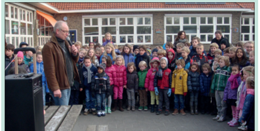
De kinderen hebben erg hun best gedaan en heel veel stroopwafels verkocht. Er is ruim 1000 euro opgehaald voor stichting Haarwensen, een groot compliment naar alle kinderen!

De kinderen van de Groen van Prinstererschool in De Bilt hebben een stroopwafelactie gehouden. Door het verkopen van pakjes stroopwafels werd er geld opgehaald voor een goed doel. Het goede doel was samen met de kinderen uitgekozen en het geld van de actie ging naar stichting Haarwensen. Stichting Haarwensen is er voor kinderen tot en met 18 jaar, die door medische behandelingen of een andere vorm van alopecia (kaalhoofdigheid) in aanmerking komen voor een haarwerk of pruik. (Eline Polman)