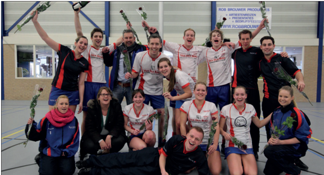
Ook Nova 1 promoveert naar de 2e klasse in de zaalcompetitie.

provocerende spel van VIKO maar bleef gedisciplineerd korfballen. Uiteindelijk werd de spannende wedstrijd beëindigd met een 13-11 stand. Zowel Nova 1 als Nova 2 speelt dus volgende jaar 2e klas, waar Nova 1 op het veld al actief is.