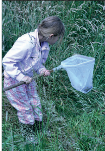
Tegen de zomer staat er watersafari op het programma bij de IVN.

Info: Rob Timmer (06 10896796). Zie ook www.ivndebilt.nl en www.scharrelkids.nl .