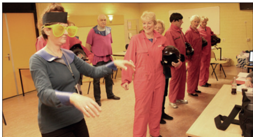
Woensdag 20 maart mochten we een kijkje komen nemen bij de repetitieavond van de Mars-gangers.

Er zijn voorstellingen op vrijdag 5 (première) en zaterdag 6, vrijdag 12, zaterdag 13, vrijdag 19 en za 20 april 2013 in Multifunctioneel-centrum De Vierstee te Maartensdijk. Telefonisch reserveren is mogelijk, dagelijks van 19.00 tot 21.00 uur tel. 035 5771669 (Jannie Rigter) of dag en nacht via www.sojater.nl .