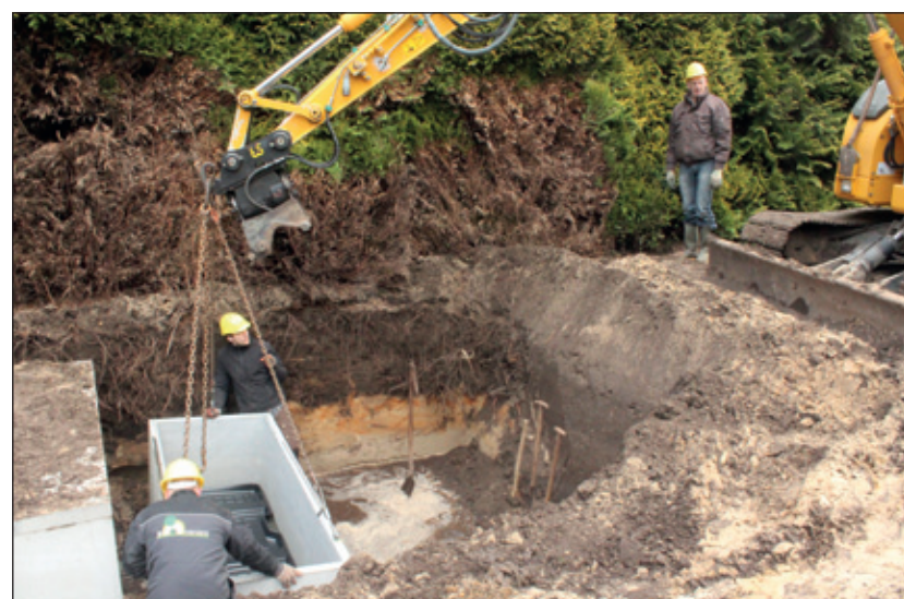
Met grote precisie wordt het onderste deel van het negende keldergraf in het water waterpas gezet.