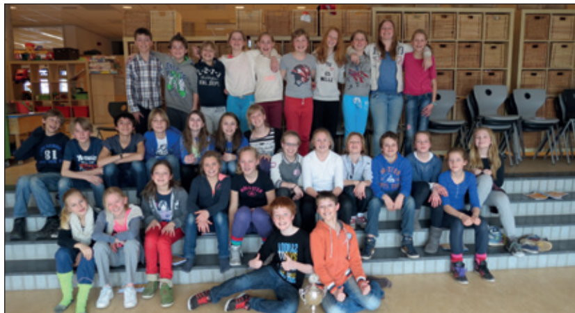
De winnende groep 8a van de Julianaschool in Bilthoven.

De vragen in de quiz gingen over het thema van de Dag van de Leerplicht: 'School? Bekijk 't eens anders!' Het recht om te leren en naar school te gaan stond daarbij centraal.