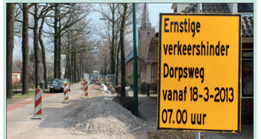
Op de Dorpsweg geldt gedurende de werkzaamheden gedeeltelijk eenrichtingsverkeer.

De tweede fase betreft het traject van de Koningin Julianalaan tot aan de Dierenriem. Binnen de gemeente zijn veel plekken die toe zijn aan een herinrichting. Volgorderlijk worden de werkzaamheden aan de Dorpsweg in Maartensdijk in 2014 uitgevoerd. Voorafgaand aan de herinrichting wordt op een deel van de Dorpsweg de waterleiding vervangen. Op het gedeelte van de Dierenriem tot aan de Nachtegaallaan is de waterleiding zodanig verouderd dat vervanging noodzakelijk is. [HvdB]