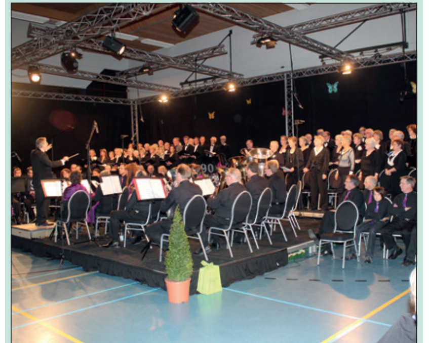
Jl. zaterdag 23 maart vierde de Maartensdijkse Harmonie Kunst en Genoegen haar 90-jarig jubileum in De Vierstee in Maartensdijk. Zij deed dit onder andere met een concert samen met het Algemeen Zangkoor Maartensdijk. In een goed gevulde voor het concert omgebouwde sportzaal van De Vierstee genoten de Maartensdijkse muzikliefhebbers en tal van genodigden van een goed samengesteld programma; een jubilaris waardig. [HvdB]