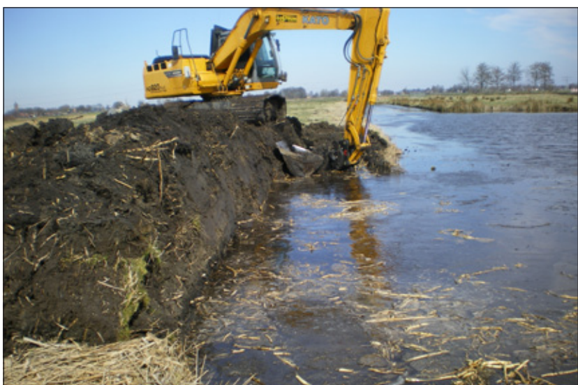
Van Oostrum uit Westbroek realiseerde de steile oeverwand.