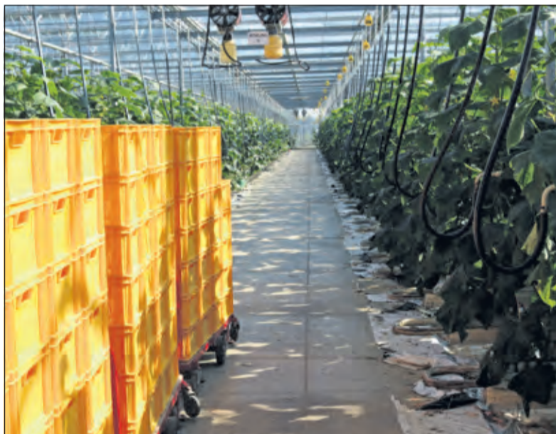
Komkommers klaar om geplukt te worden.

In 2008 is het oude gedeelte van het complex vernieuwd en is een aantal nieuwe ontwikkelingen doorgevoerd. Het interne transport in de kas gaat nu efficiënt met een robotkar. 'We hebben toen ook een energiemotor aangeschaft waarmee we elektriciteit aan het net leveren. De warmte die daarvan vrijkomt gebruiken we zelf. We zijn dus ook een soort stroomproducent. Zo ga je gunstig om met de ener-