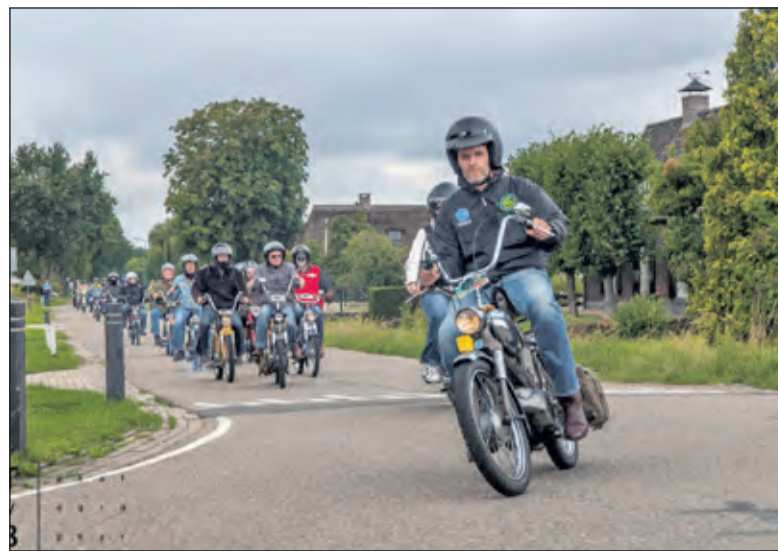
De Puch en Tomosclub rijdt op schone brandstof.

ingezameld voor de Stichting Alpe d'Huzes/KWF. Om die reden ook staat als trekpleister op 22 augustus een speciale oplegger van NedCargo in de kleuren van Alpe d'Huzes dicht bij het terrein van Agger Martini. Een zestal motorverkeersregelaars zorgt ervoor dat de kruispunten en rotondes veilig kunnen worden gepasseerd.