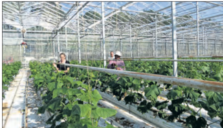
Jonge planten worden ingedraaid om rechtop door te kunnen groeien.

'Eind van het jaar hebben we de teeltwisseling en wordt alles opge-