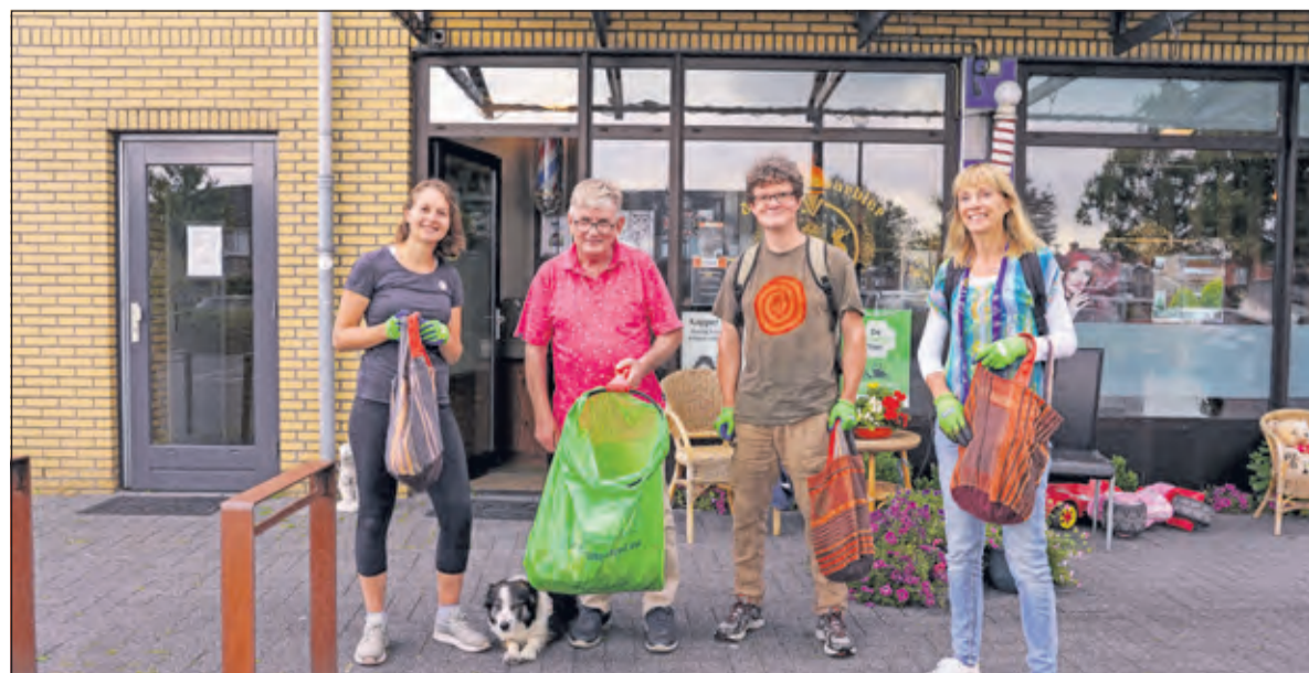
Aankomst van de Groene Toer bij Kapper Hans.

meelopen of alleen meedoen met de lokale opruimactie op het plein in Maartensdijk; dit is voor kinderen ook erg leuk. Voor opruimspullen wordt gezorgd. Inschrijven kan op www.sportiefinhetgroen.nl .