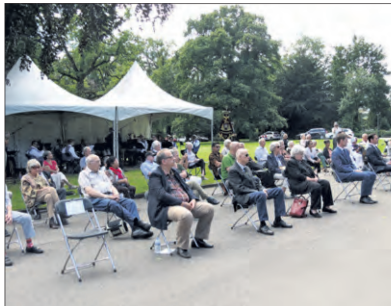
De bezoekers woonden de herdenking op afstand van elkaar bij.