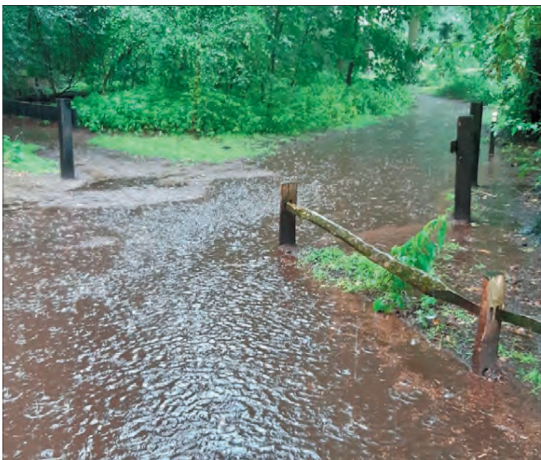
Dinsdagmiddag 10 augustus veranderde het wandelpad bij de Vissersteeg in De Bilt in korte tijd in een riviertje.