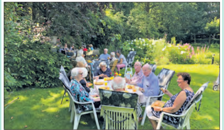
Zonnebloemgasten genieten van een tuinlunch.

Op 12 augustus organiseerde de Zonnebloem (De Bilt-Bilthoven) een tuinlunch bij één van de vrijwilligers. Er namen 20 gasten aan deel. De lunch was bereid door 4 vrijwilligers en bestond uit heerlijke soep, diverse belegde broodjes en als toetje ijs met vruchten en slagroom. Tenslotte was er ook nog een kop koffie of thee. Na bijna 3 uur genieten van zon, prachtige tuin en ontmoeting en gesprek met elkaar en de vrijwilligers werd het gezelschap voor de terugreis weer opgehaald door de zonnebloemchauffeurs. (Lout Bracke)