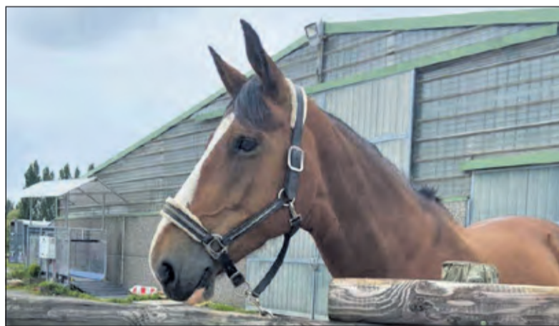
De negenjarige Selle Français merrie Cocktail uit De Bilt wacht nog op een vriendelijke en consequente rijder.

Sinds de coronapandemie zijn er meer paarden verkocht. Mensen hadden immers opeens meer vrije tijd en dan wordt een eigen paard steeds aantrekkelijker. Echter, nu de samenleving weer op gang begint te komen, wordt deze vrije tijd