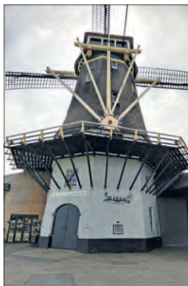
Er zijn in Nederland nog ongeveer 1200 molens over; één daarvan staat in Westbroek.

Tot 2023 bezoekt Papineau Salm honderd molens. 'De Kraai is de 18e molen die ik bezoek', vertelt hij. Omdat de vereniging bijna honderd jaar bestaat, bezoek ik al deze