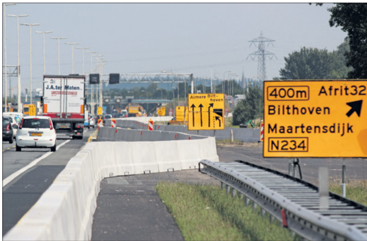
Het is momenteel even puzzelen waar en hoe je precies moet rijden.

Deze houdt de weggebruiker actief op de hoogte van de hindergevendende werkzaamheden in de buurt. Iedereen kan zich aanmelden via: https://www.verbredinga27a1.nl/hinderkalender .