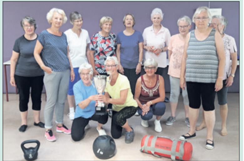
Eén van de drie trainingsgroepen.

Nathalie vervolgt: 'Al decennia lang lezen we regelmatig dat onze generatie weer ouder wordt dan de vorige. Alhoewel er sprake is van een zekere afvlakking is het einde nog niet in zicht. Met het opschuiven van de leeftijdsgrens dienen zich ook nieuwe omstandigheden aan. Veel aandacht gaat er nog steeds uit naar het functioneren van het hart en de longen, maar een belangrijke beperking ligt er ook in de afname van spierkracht, stabiliteit en coördinatie. Te geringe kracht is een directe beperking die zich meteen uit in de handelingen die men in het dagelijks leven verricht. Toch willen we nog graag zo lang mogelijk en onafhankelijk thuis wonen en zelf de boodschappen kunnen blijven doen. We realiseren ons vaak nog niet dat bij ongetrainde, inactieve mensen de afname van spieren al vanaf het 30ste levensjaar plaatsvindt. Zo rond het vijftigste levensjaar zijn we ongeveer 10% van de oorspronkelijke spiermassa kwijt en rond het tachtigste levensjaar is dat al ongeveer 50%'. [HvdB]