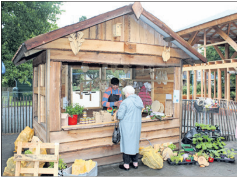
De 'skihut' op de foto is het permanente verkooppunt van groenten, planten en bloemen die op eigen terrein gekweekt worden. Verder ook allerlei producten van afvalhout, aanmaakhoutjes en openhaardhout.

Het weer was helaas niet echt zomers, maar de stemming zeker wel. Een gezellige dag, mede dankzij de enthousiaste inzet van vrijwilligers en collega's van Het Lichtruim.