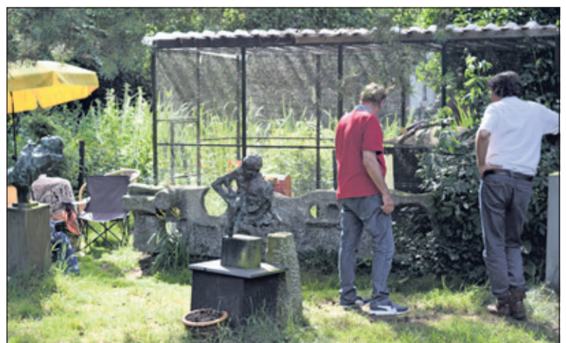
De aangrenzende beeldentuin wordt bezocht.

Velen van de belangstellenden tijdens de open dagen, bezochten tevens het beeldentuin op het Landgoed Beerschoten. Dat bleek een goede gedachte want het Utrechts Landschap is voornemens op termijn tot een andere indeling van het park te komen, waarbij het denkbaar is dat de beelden in overleg met de Stichting Jits Bakker Collectie op het park een andere plek krijgen.