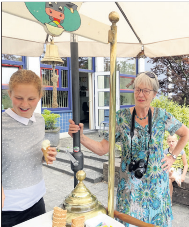
Voor alle kinderen was er een lekker ijsje