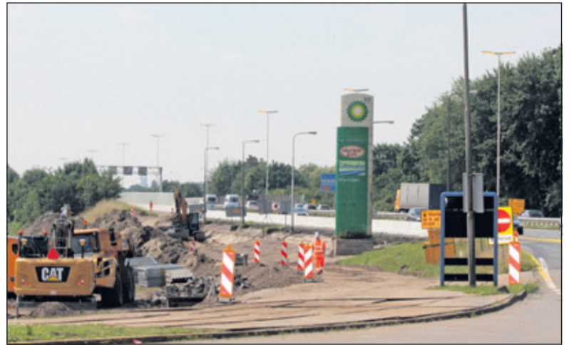
Aan de oostzijde van de A27 wordt achter de schermen voorbereidend werk verricht.