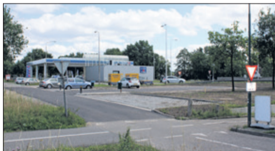
De carpoolplaats Maartensdijk is vergroot met 9 extra plaatsen, waarmee het totaal op 49 komt.

De bestaande carpoolplaats Maartensdijk (aan de A27/ Nieuwe Weteringseweg) is onlangs vergroot en verbeterd. Met deze en andere uitbreidingen wil Goedopweg het carpoolen bevorderen om de bereikbaarheid van en in de regio te verbeteren. De parkeerplaatsen op deze carpoolplaats waren regelmatig allemaal bezet. De uitbreiding gebeurde in opdracht van Goedopweg, het samenwerkingsverband van overheden en werkgevers om de regio Midden-Nederland bereikbaar te houden. Begin juli worden er op deze carpoolplaats nog twee nieuwe lichtmasten geplaatst.