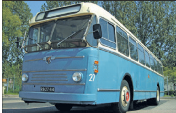
Bus 27 verzorgt op 9 september weer twee ritten.

Ook dit jaar kan men tijdens de Oldtimerdag in De Bilt op zaterdag 9 september zowel 's ochtends als 's middags meereijden met Bus27. Bus 27 maakte deel uit van een serie van 15 bussen van het type Worldmaster van het merk Leyland. Bus27 heeft ook jarenlang dienst gedaan als safari-bus in de Beekse Bergen. Na een complete restauratie rijdt de bus nu weer rond. Bus27 rijdt mee in de stoet met oldtimers. De route is ca. 70 kilometer en gaat door de mooiste plekjes van onze regio. De tocht start om ca 10.30 uur vanaf de Dorpsstraat en duurt ongeveer 2 uur. Om 14.30 uur rijdt Bus27 nog een mooie route door de gemeente De Bilt. Deze route is ca 30 km en duurt ongeveer een uur. Kaarten bestellen kan via website www.oldtimerdagdebilt.nl .