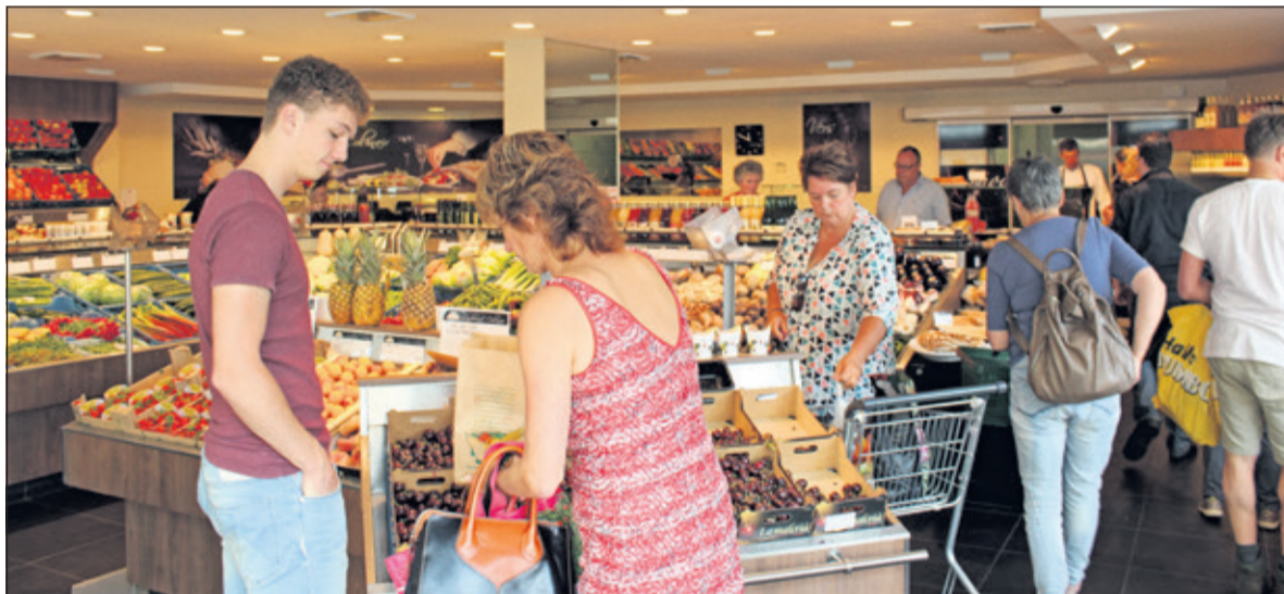
De winkel wordt vergroot en het assortiment wordt sterk uitgebreid; alles dagvers.

'uitje' kan gaan worden. Nieuw is ook het thee-assortiment, waarbij de nadruk zal komen te liggen op theesoorten, die elders niet worden aangeboden. Er zullen een gescheiden in- en uitgang komen, waardoor de doorstroming beter kan zijn. Donderdag 3 augustus zal de laatste dag zijn, dat de huidige winkel is geopend; uiteraard gekoppeld aan een grote uitverkoopactie. De feestelijke (her-)opening staat gepland op donderdag 31 augustus en ook nu zal een aantal reclameacties niet ontbreken. De winkel is dus gesloten van 4 augustus tot en met 30 augustus.