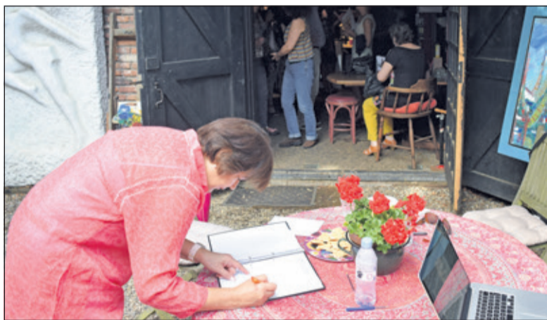
Het gastenboek wordt getekend.