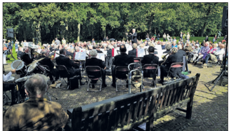
Na de pauze treedt het Knollenkoor op.

plezier en vrolijkheid, een heerlijk lied uit de oude tijd, dus zing maar met ons mee'.