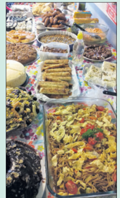
Deelnemers aan de cursus Nederlands sluiten af met een tafel vol traditionele gerechten.

Voor informatie: servicentrumdebilt@mensdebilt.nl