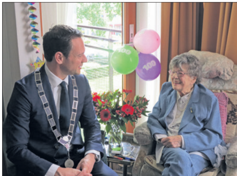
Het klikte meteen met de burgemeester. Beiden groeiden op in dezelfde Brabantse streek.

'Het voelt heel vreemd om honderd te zijn. Ik kan het me niet voorstellen dat ik dat gehaald heb. Gelukkig ben ik nog goed gezond en bij de tijd en dat is heel belangrijk.' Wat zij adviseert om zo oud te worden is proberen zo braaf mogelijk te wezen. Ze had een zwager die daags voordat hij 104 jaar werd overleed. 'Op 1 november overleed hij en 2 november op Allerzielen was hij