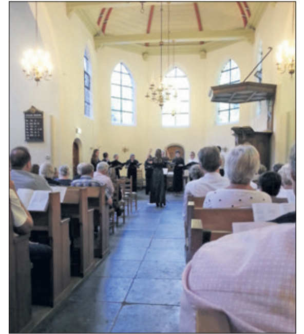
Het concert in de Stulpkerk in Lage Vuursche is goed bezocht.