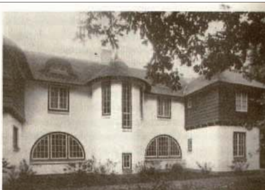
In het boek ook een afbeelding van de andere zijde.

De achterkant van het landhuis met in de linker uitbouw de keuken, in het midden het trappenhuis naar de eerste verdieping en de zolder, en in de rechter uitbouw de garderobe, die naast de voordeur aan de Aanlegsteeg lag.