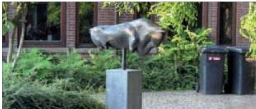
'De Stier' is weg.

dijk de 'Opwaartse Vlucht' (voor De Vierstee) maakte; leraar en leerling troffen elkaar dus in Maartensdijk. Cobbenhagen heeft meerdere beelden in ons land 'geplaatst'. Van hem zijn ook 'Europa' en 'De Stier' voor het hoofdkantoor van de SHV in Utrecht. In de jaren tachtig en negentig van de vorige eeuw werden in Maartensdijk, Groenekan, Westbroek en Hollandsche Rading beelden van dieren geplaatst. Plaatsing van een vervangend exemplaar betekent dat dit beeldenensemble compleet blijft.