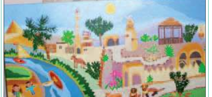
Vrijdag 28 januari is o.a. dit schilderij te bezichtigen in Hotel De Biltsche Hoek, De Holle Bilt 1 te De Bilt.