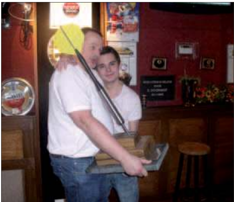
De volwassen winnaars hebben hun enorme trofee in ontvangst genomen.

Afgelopen zaterdag vond de 7de de editie van het SVM darttoernooi voor koppels plaats. Tien dartbanen met zo'n 150 enthousiaste darters zorgden voor een heerlijke dartsfeer.