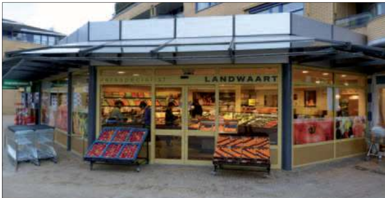
Landwaart Culinair is als 42ste deelnemer in de provincie Utrecht toegetreden tot de Odin-keten.