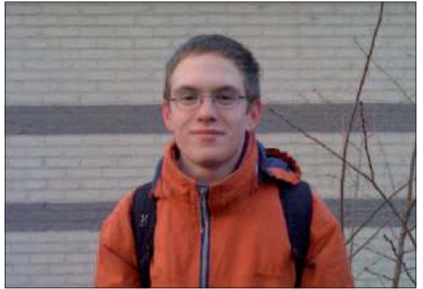
'Ik kijk nu heel anders tegen debatteren aan'.