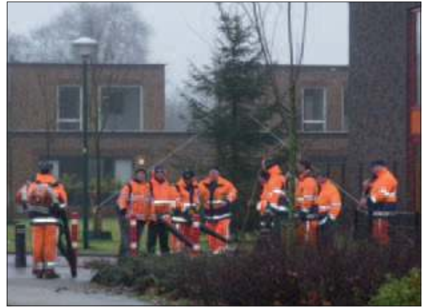
Elf WU'ers in de wijk achter Zwembad Brandenburg zouden afval moeten ruimen, maar hebben niets te doen.

Ook opvallend was, dat het zo lang duurde voordat de afvalbakken na de jaarwisseling open waren. Bij de bakken langs het Kees Boekepad ontstond een flinke afvalberg, die er het derde weekend van januari nog steeds ligt. Ook zijn op diverse plaatsen in de gemeente nog dozen vuurwerkafval en losse vuurwerkresten te zien langs de trottoirs en in de bosjes. In andere gemeentes gaan op 2 januari,