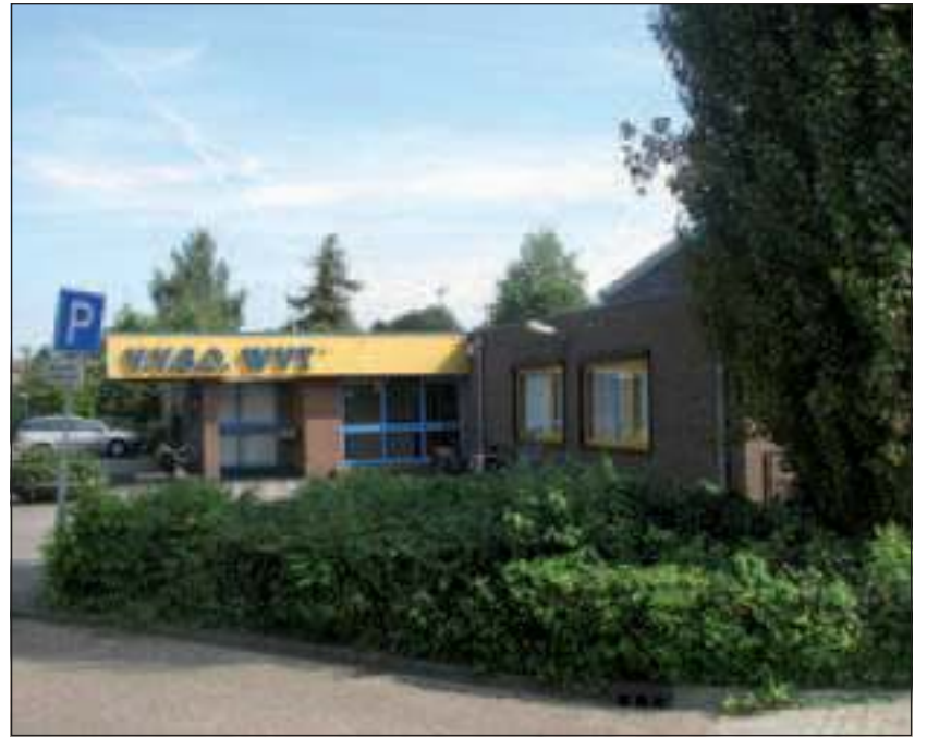
De ruimte in het WVT-gebouw van de Vereniging voor Samenlevingsopbouw aan de Talinglaan biedt Reinaerde volop mogelijkheden om dingen te doen.

Reinaerde is actief in de regio Utrecht met ondersteuning en zorg voor kinderen, jongeren en volwassenen met uiteenlopende zorgvragen. Naast dag-