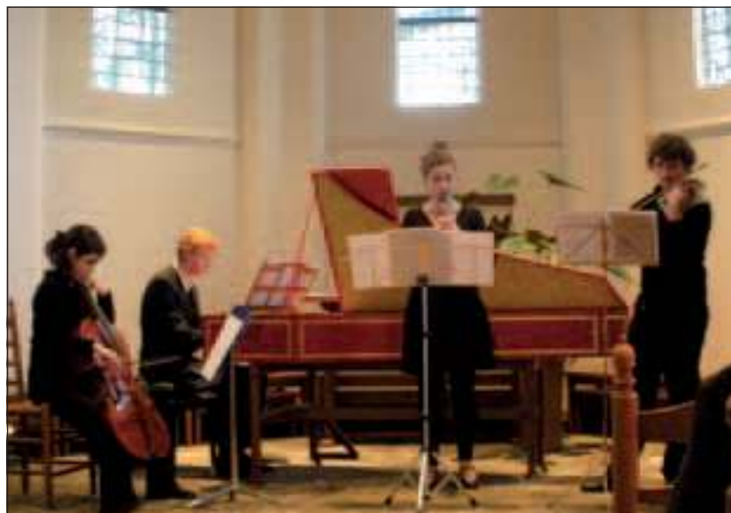
Het ensemble geconcentreerd in actie.

Na de pauze nam een jeugdig internationaal ensemble, bestaande uit kla-