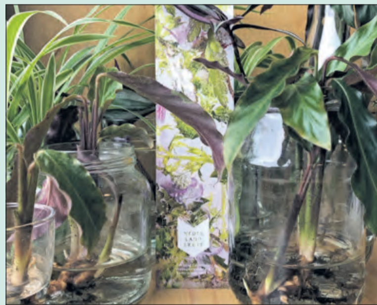
De hele maand november is het mooi groen in de bibliotheek in Bilthoven. Breng een stekje en neem een stekje mee.