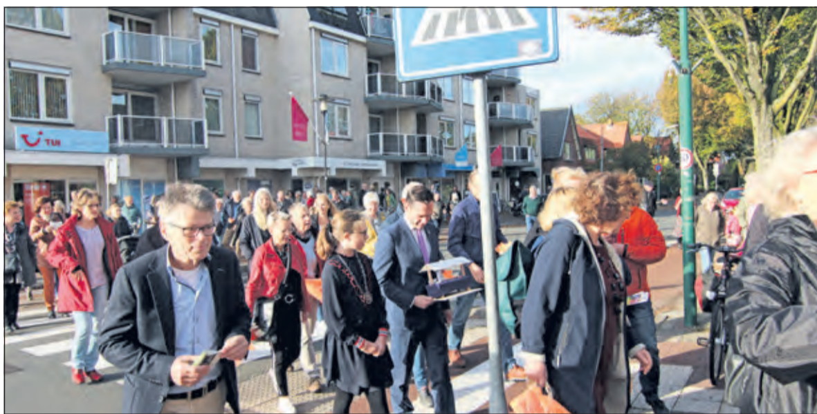
Medewerkers van de Wereldwinkel en de vele belangstellenden worden al zingend naar de nieuwe locatie op de Hessenweg begeleid.

meerdere delen. Eerst werd met een kort optreden aan de Hessenhof afscheid van het oude pand genomen om vervolgens de medewerkers van de Wereldwinkel al zingend