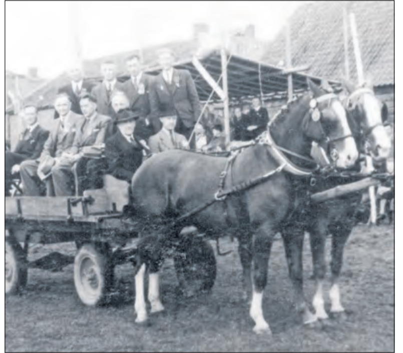
Bestuur Oranjefeest 1947 met paard en wagen.