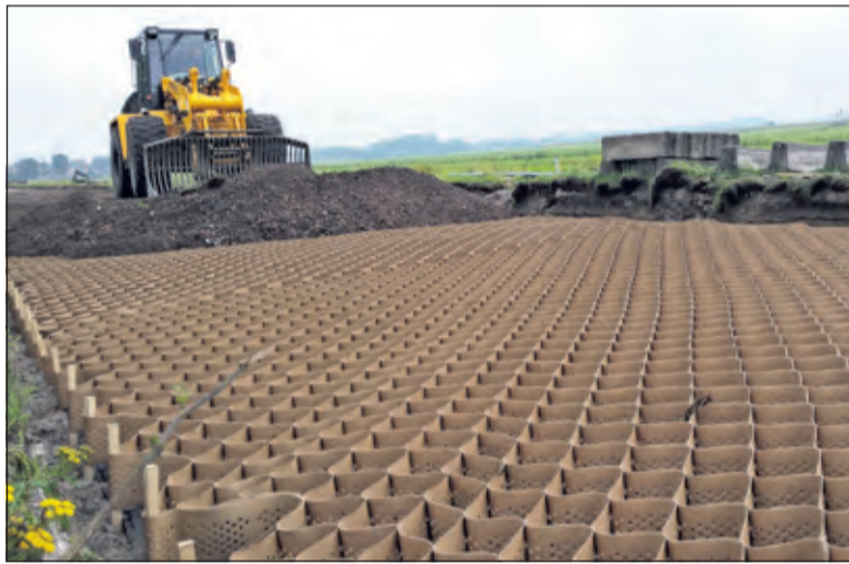
Bestrating Burgemeester Huydecoperweg in 2017.

Dinsdag 5 november wordt de film getoond tijdens Westbroek Ontmoet. U bent daarvoor van harte welkom van 14.30 tot 16.30u. in Het Dorpshuis van Westbroek, Prinses Christinastraat 2. De kosten zijn 3,50 euro, inclusief koffie of thee. Wanneer u wél wil komen, maar niet weet hoe, kan vervoer geregeld worden via de familie Kalisvaart, tel. 0346 281181. Ook wanneer u niet in Westbroek woont, bent u van harte welkom.