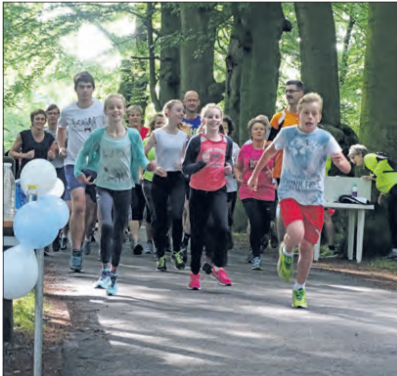
De Fit-afdelingen van Fraternitas bestaan 50 jaar.

Het vijftigjarig bestaan van Keep Fit, RunFit en WalkFit wordt op zaterdag 2 november gevierd. Voor de actieve leden is er 's middags een activiteit, om 18.30 uur zijn leden en oud-leden welkom bij het IJsmeeetje.