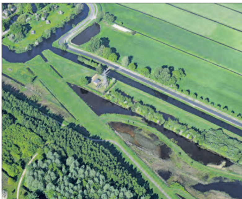
Een luchtfoto uit (mei) 2018 toont het zuidelijkste - buiten Westbroek gelegen - van de weg.