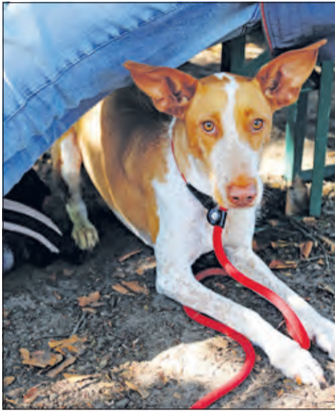
Hond en baas rusten even uit.