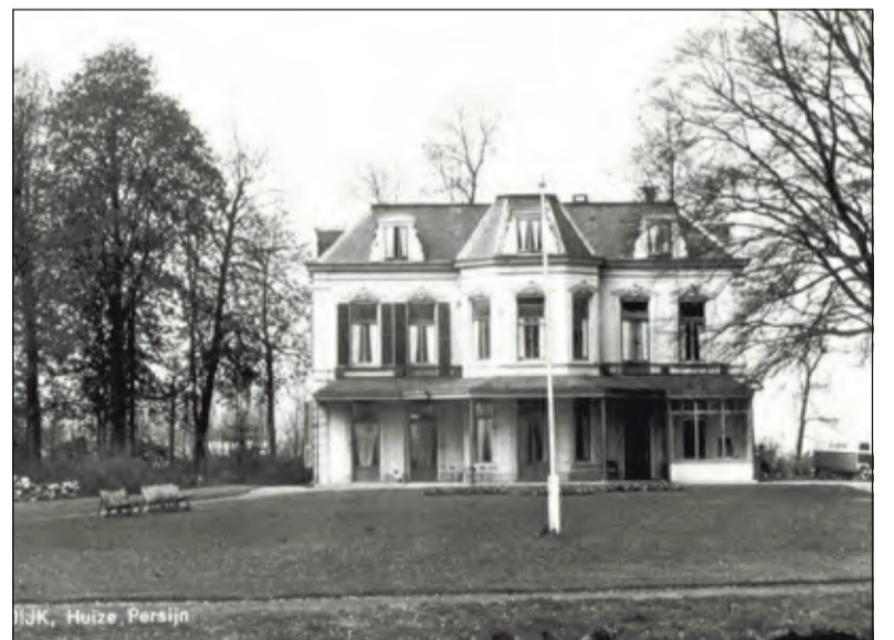
Het echtpaar Huydecoper - Steengracht van Oostcapelle woonde drie jaar op Persijn in de Achter Wetering. [foto uit de digitale verzameling van Rienk Miedema].

Vooral de laatste jaren van zijn ambtsperiode zijn er nog veel nieuwe zaken in het dorp tot stand gekomen, zoals het nieuwe dorps- huis en een aantal gemeentewoningen. Per 1 juli 1957 werden de taken door de gemeente Maartensdijk over genomen. Burgemeester Huydecoper, bijna 70 jaar, ging na een dienstverband van 44 jaar met pensioen. Eenmaal thuis wist hij niet goed wat hij met z'n vrije tijd aan moest. Hij bekleedde daarna nog een bestuurlijke functie bij het Waterschap van Maarsseveen. In 1969 overleed burgermeester Huydecoper. Het enige in het dorp, dat