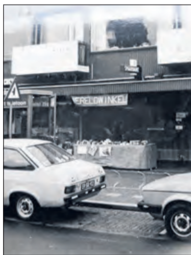
In 1981 stond de wereldwinkelkraam al voor nummer 166 op de Hessenweg.

te laten zien. Met die campagne wordt wereldwijd gewerkt aan de 17 duurzame ontwikkelingsdoelen van de VN om de grote problemen in de wereld - zoals armoede, ongelijkheid, discriminatie, oneerlijke handel, klimaatverandering - aan te pakken en een werkelijk duurzame ontwikkeling te bereiken. Op de website www.duurzaamdebilt.nl is daarover meer informatie te vinden.