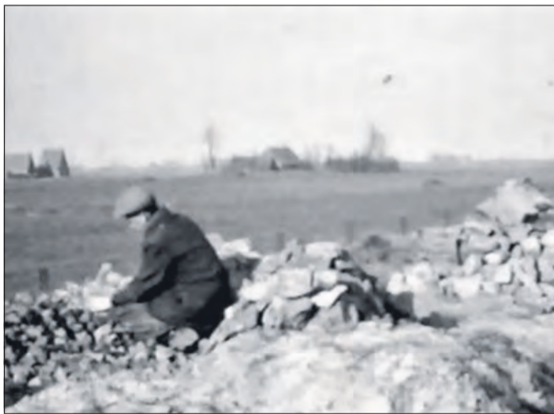
Bestrating (Kerkeindsche Vaartdijk) in 1947.

Mechanisatie maakte op velerlei gebied arbeid gemakkelijker. Karien vervolgt: 'Werkzaamheden op de boerderij werden geautomatiseerd en het boerenbedrijf veranderde in een onderneming. Melken in de zeventiger jaren aan een weidewagen in het land vroeg om een andere dagindeling dan nu op een modern melkveebedrijf met melkrobots'. Zij vervolgt: 'Ook bijv. de positie van de burgemeester veranderde in de loop van de tijd. Huizenbouw hervormde het dorp, voorzieningen verdwenen, maar Sinterklaas werd en wordt ieder jaar uitbundig binnen gehaald. Opvallend zijn ook de protestacties van de boeren, van bescheiden in het verleden naar groots georganiseerd, afgelopen maand'.