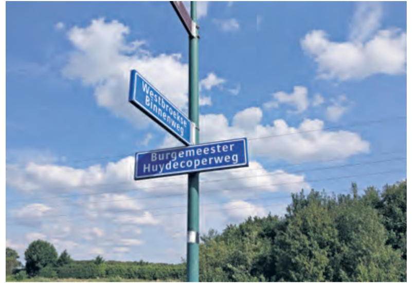
Het naambordje duidt er op, dat weg 'gewoon loopt' vanuit Westbroek naar Utrecht-Overvecht.

De gemeentesecretaris van Vliet deelde met ambtenaren de kamer. Met z'n vieren in de linker voorkamer van het gemeentehuis aan de Kerkdijk vervulden zij alle taken van het gemeenteapparaat binnen het dorp. Er werd voor de dorpen Achttienhoven en Westbroek een dubbele administratie bijgehouden. Wanneer iemand van Westbroek naar Achttienhoven verhuisde moest hij uit- en opnieuw weer ingeschreven worden. Ook de financiën van beide dorpen was gescheiden. De brandweer was verdeeld, 5/8 voor Westbroek en 3/8 voor Achttienhoven.