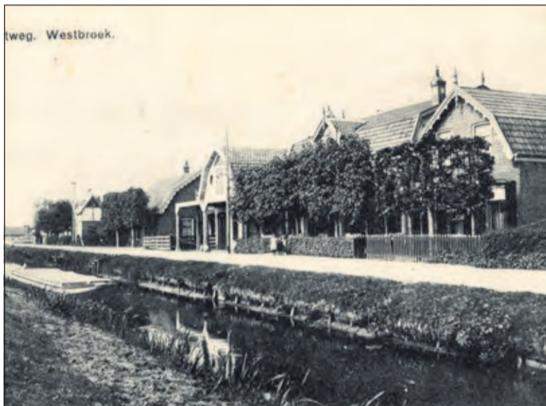
De bebouwing aan de Vaartweg 16 -22 in Westbroek verhuisde in 1960 naar de Burgemeester Huydecoperweg in Westbroek. [foto uit de digitale verzameling van Rienk Miedema].

Vanaf Beerschoten in De Bilt kwam hij met een T-Ford naar zijn werk. Daarna heeft hij jarenlang