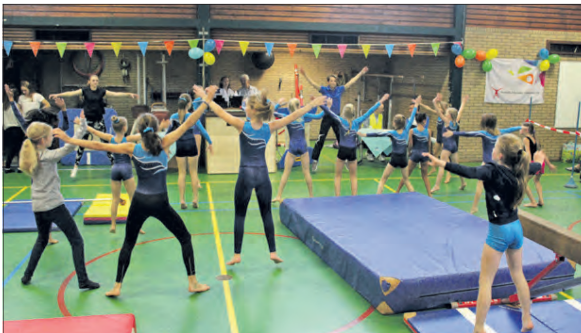
Op zaterdag 12 oktober heeft CSV Fraternitas De Bilt voor het eerst een 'Diploma Turn-dag' georganiseerd in de gymzaal aan de Marie Curieweg in De Bilt. Aan het einde van de turn-dag waren er nog dans-demo's van de dansgroepen van Fraternitas. Er was veel belangstelling van ouders en andere familieleden die kwamen kijken. Voor meer informatie of belangstelling: zie www.fraternitasdebilt.nl . (Yvonne Vermeulen)