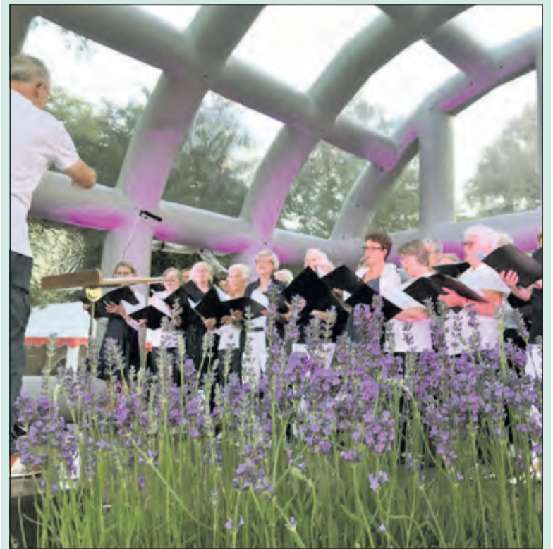
AZM tijdens de SamenLoop voor Hoop-actie bij Jagtlust te Bilthoven.

De St. Maartenskerk is geopend vanaf 14.30 uur. Het concert begint om 15.00 uur. Kaarten zijn te verkrijgen via website: www.zangkoorkaartensdijk.nl , bij Primera in Maartensdijk aan het Maertensplein en in Bilthoven bij de Bilthovense Boekhandel, Julianalaan 1. Na afloop van het concert is er een receptie in ontmoetingscentrum De Mantel, naast de St. Maartenskerk.