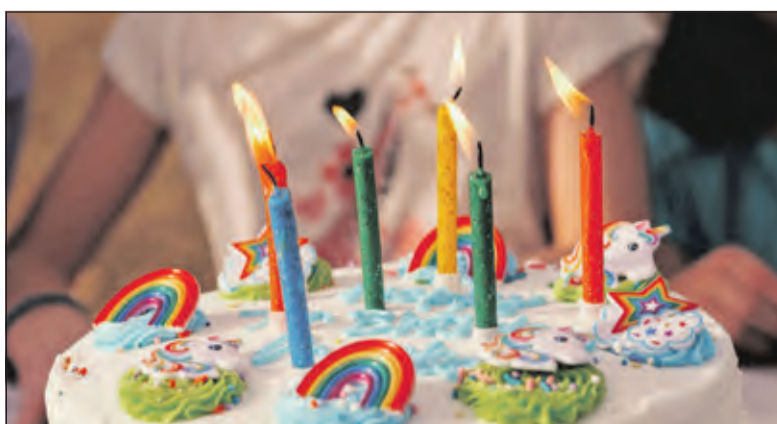
Hobbybakkers maken taarten voor jarige kinderen.

Nederland kunnen zich aanmelden als hobbybakker. Inmiddels zijn er ongeveer 250 van hen aangesloten bij het Platform. In de loop van dit jaar ontstond het idee om een goed doel te koppelen aan Gebakplaats. Dit werd de Voedselbank. Als dit initiatief goed loopt, hoopt Kortekaas ook andere voedselbanken in de regio te benaderen. Hiervoor zijn natuurlijk nog meer hobbybakkers nodig. Daarom deze oproep: iedereen die het leuk vindt taarten te bakken, kan zich aanmelden bij Gebakplaats.nl als ‘Hobbybakker voor een jarig kind’. Voor meer informatie: www.gebakplaats.nl/ minima