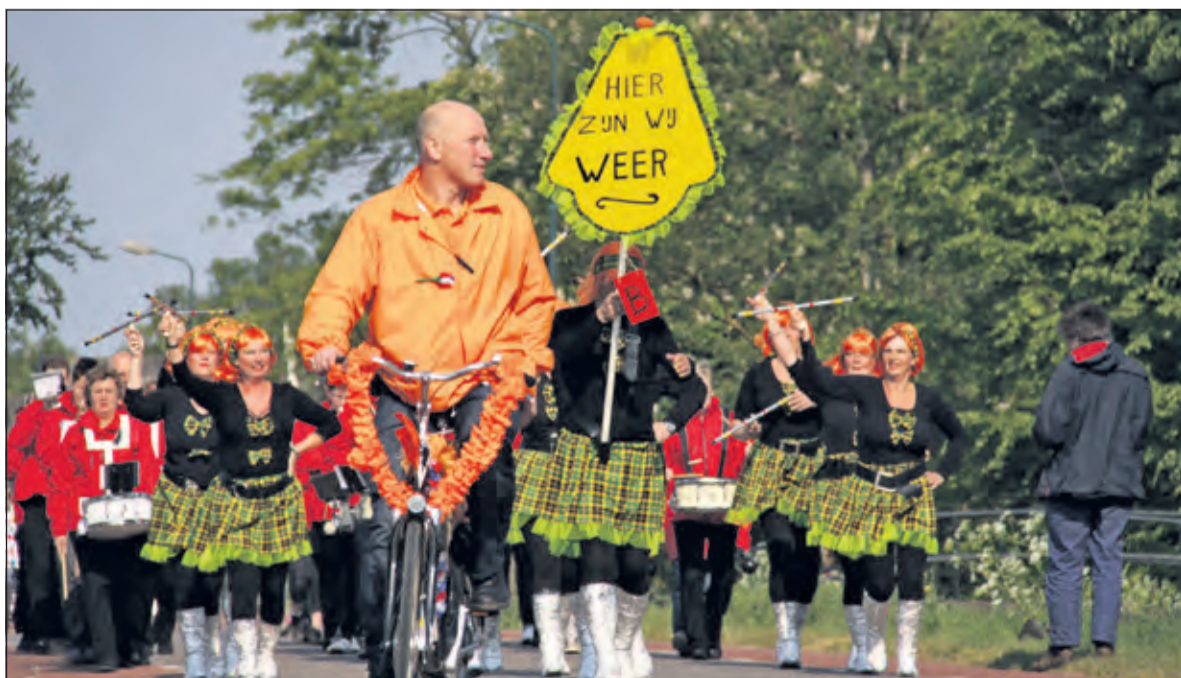
Bestuur Oranjefeest 2017.