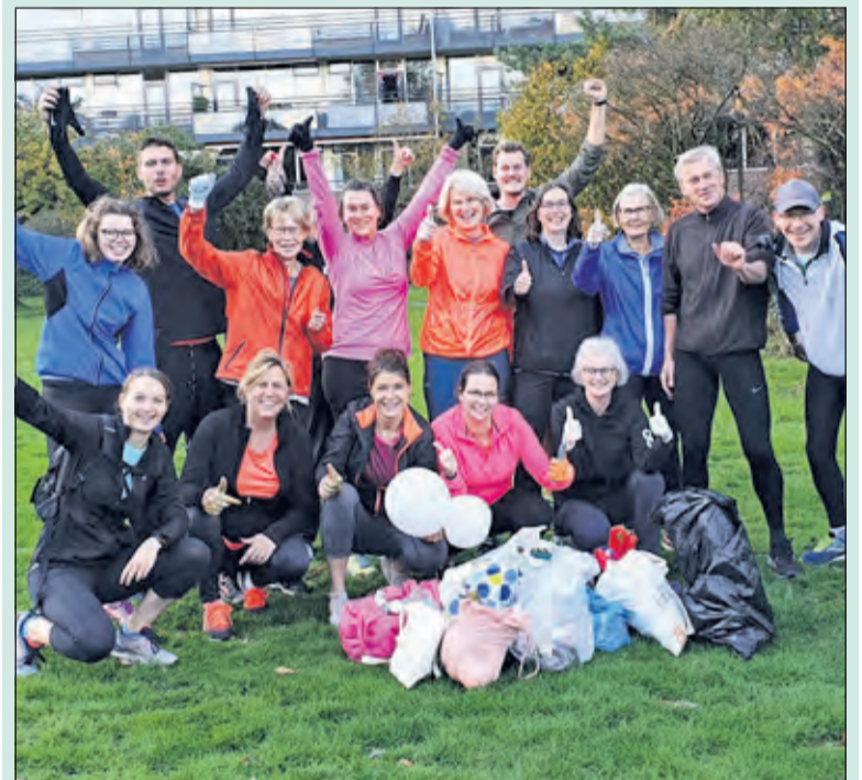
Alle deelnemers en een deel van het opgeruimde afval.

Ook geïnteresseerd om ook af en toe mee te doen aan het ploggen? Aanmelden kan via anke.hazeleger@gmail.com .