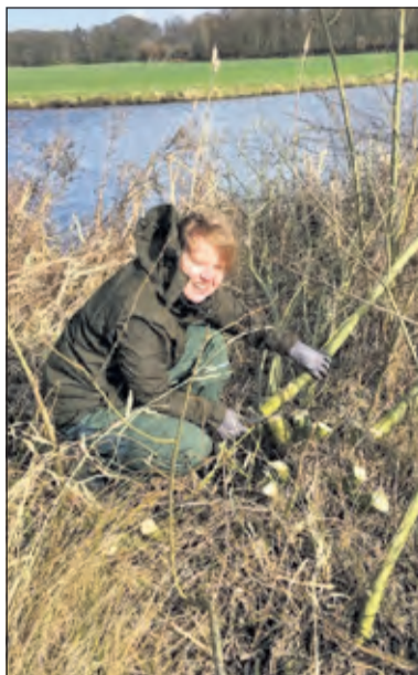
Aan de waterkant wordt de zwarte els gekortwiekt.

Voor alle deelnemers aan de Natuurwerkdag is er na afloop soep.