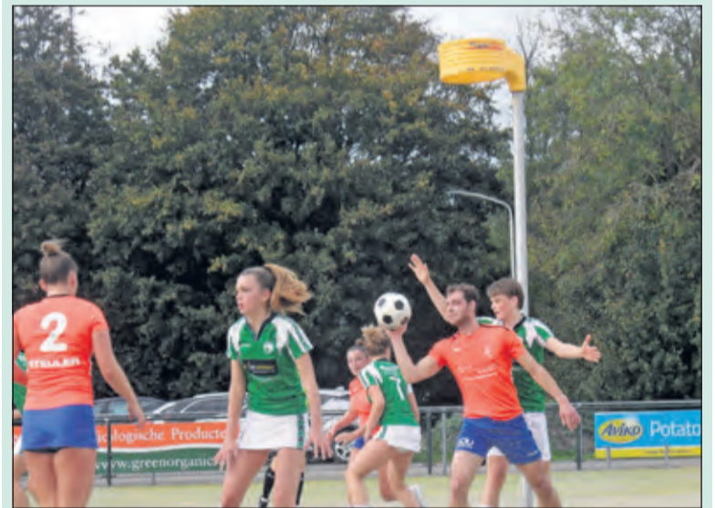
Ondanks windkracht 5 werden er wel 34 doelpunten genoteerd op het veld in Dronten.

DOS gaat zich nu voorbereiden op de zaalcompetitie, die start op zaterdag 23 november met een uitwedstrijd tegen AVO in Assen.