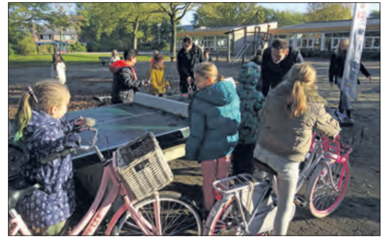
Leerlingen laten hun verlichting

dig wordt ter plekke en kosteloos een reparatie uitgevoerd. De meer Maartensplein. [KD] bewerkelijke reparaties vinden