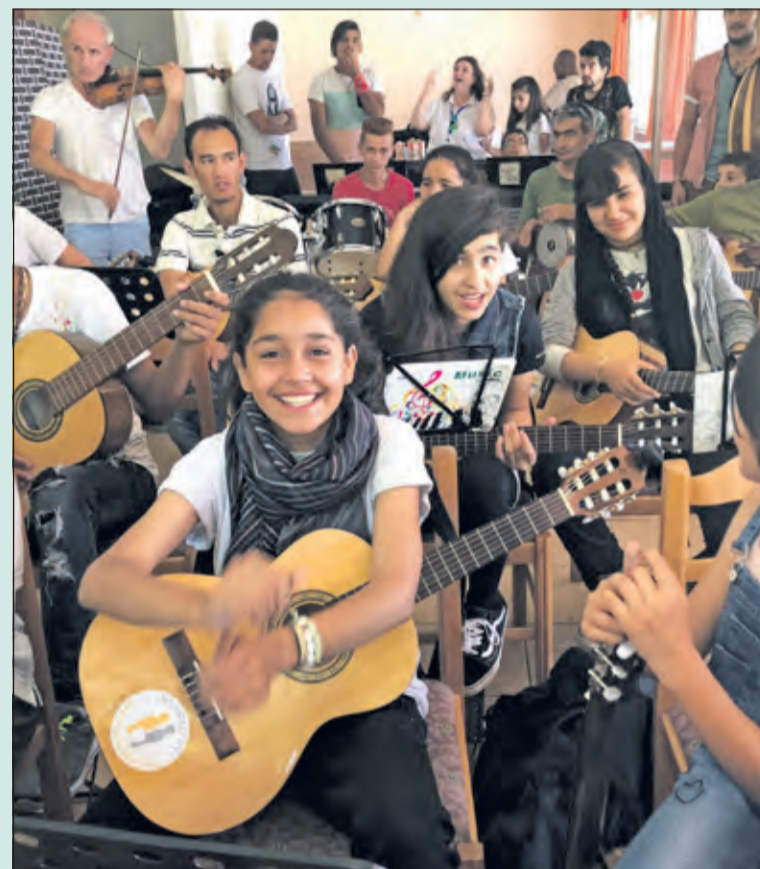
De opbrengst komt ten goede aan Connect by Music.

Entreekaart(en) aan de zaal, reserveren via soroptimistdebiltbilthoven@gmail.com , verkrijgbaar bij De Bilthovense boekhandel, Juliana-laan 1 te Bilthoven en/of Kooklust, Hessenweg 155 te De Bilt. Aanvang 20.00 uur.