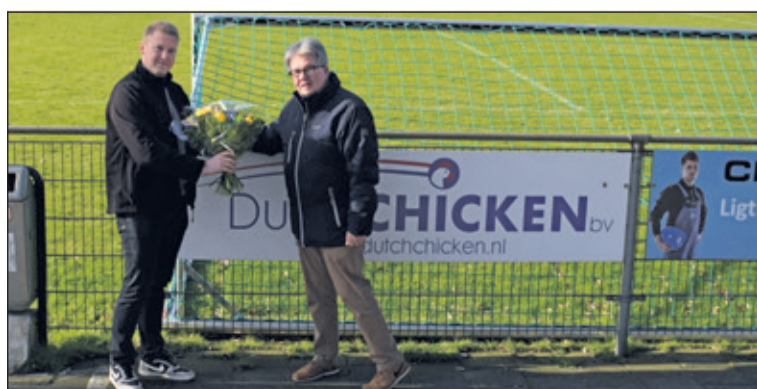
Ook Dutch Chicken uit Maartensdijk steunt SVM als bordssponsor.