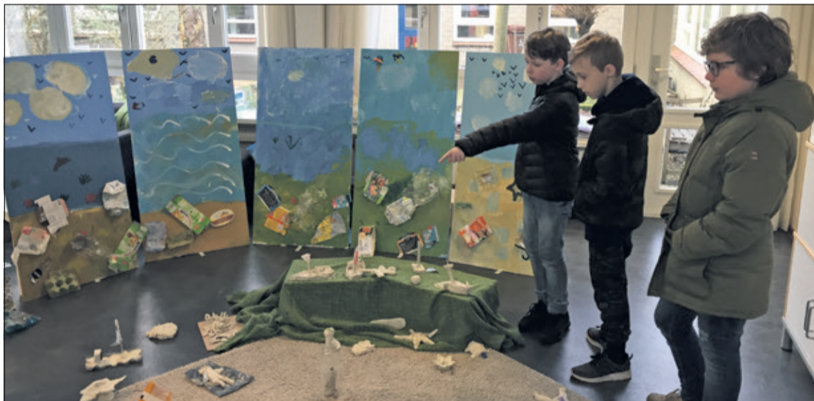
Leerlingen bekijken de MLKing versie van panorama Mesdag. Hierbij is de relatie gelegd tussen de Gouden Eeuw en de tijd waarin wij nu leven.