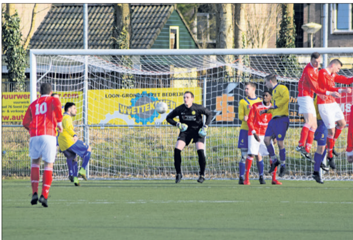
Ook tegen SC Everstein verzamelde SVM geen punt.

de gelijkmaker op de 2-3 voor-sprong komen. Even later kwam ook de 2-4 op het scorebord. Mike de Kok was dicht bij de aansluitingstreffer, maar de bal wist het net niet te vinden. SC Everstein kreeg de laatste 15 minuten zoveel vrijheid en liet ook nog de 2-5 op het scorebord zetten en nam zo de volle winst mee naar huis; SVM met lege handen achter latend. De komende (uit-)wedstrijd tegen het lager geklasseerde Voorwaarts (Utrecht) en die daarna zullen de punten hard nodig zijn om uit de gevaarzone te blijven; het zal een moeilijke opgave worden de degradatiezone te ontworstelen.