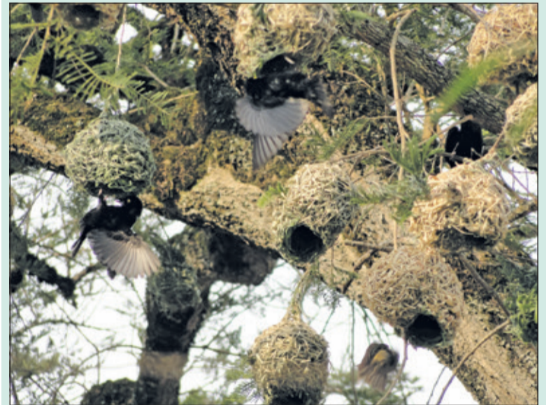
Weefvogels maken deze prachtige nesten helemaal zelf.

Er is wat lekkers met limonade. Leeftijd: 6 t/m 10 jaar. Tijd: 14.30 tot 16.30 uur. Plaats: Paviljoen Beerschoten, De Holle Bilt 6 in De Bilt. Aanmelden per email kan tot en met zaterdag 17 februari via kindernatuuractiviteiten@gmail.com .