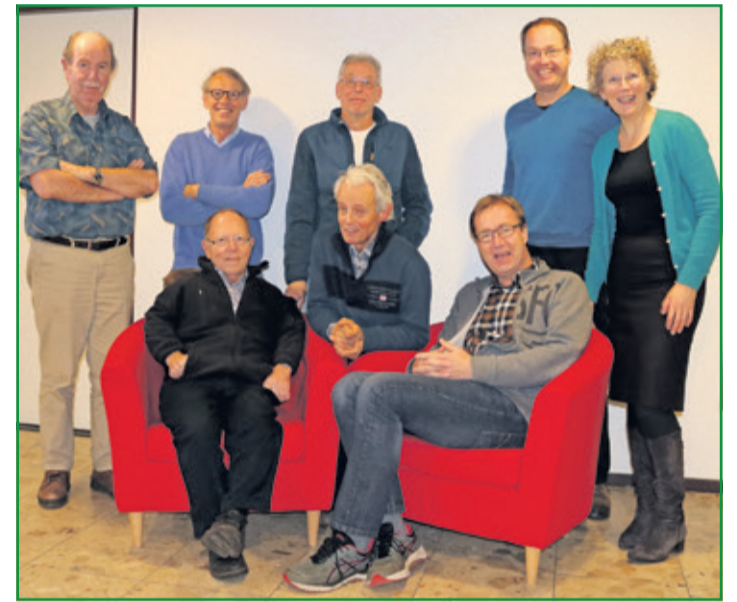
Het team energieambassadeurs van BENG! organiseert bespaaracties voor de inwoners van gemeente De Bilt.