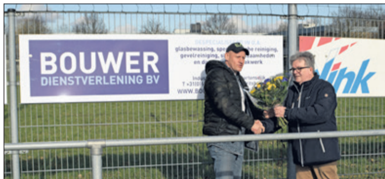
Bouwer Dienstverlening is nieuwe bordssponsor van SVM.