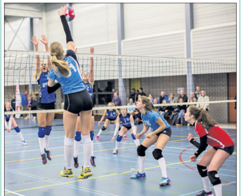
De Irene meiden stevenen af op de titel.