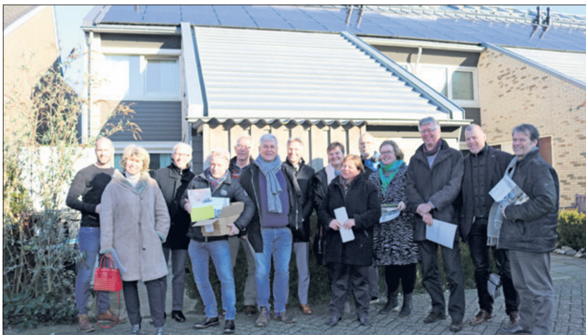
De excursiegroep voor een duurzaam gerenoveerde huurwoning in Montfoort.

In de huiskamer van Bram vertelde Ronald Hofstede van Woningbouwcorporatie SSW meer over de resultaten van de twee (bijna) nul-op-de-meter huur-flats aan de Henrica van Erpweg en de Mr. Samuel van Houtenweg. SSW richt zich ook bij nieuwe renovatieplannen op een zo hoog mogelijke ambitie richting (bijna) energieneutraal. (Jenny Senhorst)