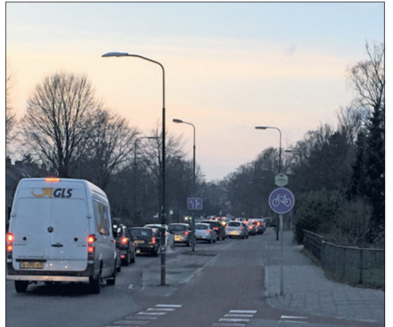
De Groenekansweg wordt het maximum aantal verkeersbewegingen tijdens de avondspits ruim overschreden.

Kasper: 'Wij vinden dat de gemeente in dit proces veel te snel gaat. Er moet goed gekeken worden naar de gevolgen van de plannen op de omgeving. Het terrein wordt door vier wegen omringd; wegen waarop veel verkeer voorkomt. Bebouwing van het terrein gaat meer verkeer opleveren, ongeacht voor welk scenario wordt gekozen. Wat is het effect van de nieuwe bebouwing op de verkeersoverlast in de omgeving? De Groenekansweg zit nu al boven de door de gemeente vastgestelde norm. Waar komen de aansluitingen op de bestaande wegen? Wat betekenen de plannen voor het welzijn, de veiligheid en de gezondheid (luchtverontreiniging); zeker nu het aantal vrachtwagens steeds meer toeneemt. Belangrijk zijn zeker ook de landschappelijke en eco-