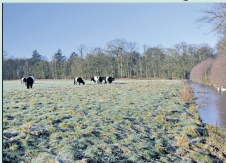
Het bevroren landschap deert de koeien op landgoed Houdringhe niet.