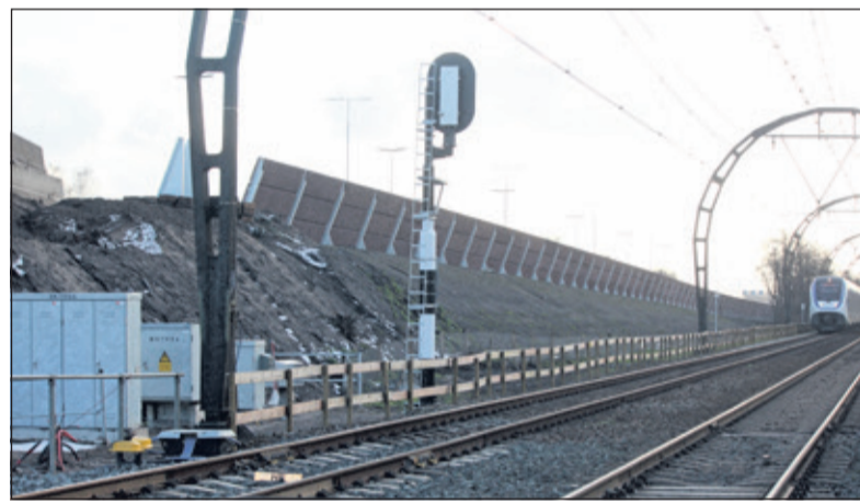
Het scherm aan de westkant van A27 tussen de weg en het spoor. Het scherm is aan twee kanten bekleed met akoestisch materiaal.