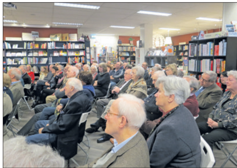
Voor de lezingen bestond grote belangstelling.