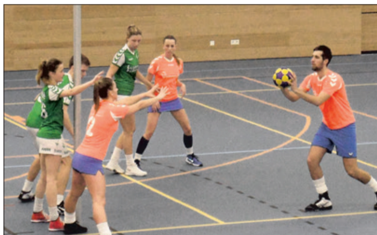
DOS probeerde het, maar zette te laat de inhaalrace in.

In de beginfase van de wedstrijd had DOS geen geluk in de afronding waardoor de overtuiging in de schoten steeds minder werd. Teveel aanvallen resulteerden in één-schotsaanvallen. Ook BEP had moeite in de afronding, maar halverwege was er een kleine 12-10 voorsprong voor de thuisclub.