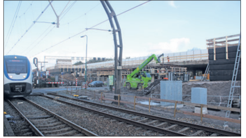
Het nog te bouwen scherm ter hoogte van de Vuurse Dreef wordt m.u.v. de onderste 3 meter transparant uitgevoerd.

Henk vervolgt: 'Wat ook bleek is dat er voor de bouw van een achterover-