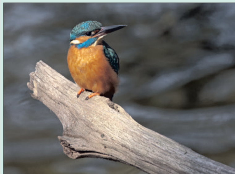
De ijsvogel is in de winter gemakkelijker te ontdekken.

IJsvogels hebben dankzij de storm van 18 januari meer nestmogelijkheden gekregen in de natuurgebieden van Utrechts Landschap. De vele omgevallen bomen bieden ijsvogelpaartjes meer mogelijkheden om hun nest tussen de wortels van de bomen uit te graven. Dat komt goed uit, want het broedseizoen van de ijsvogel start deze maand. 'IJsvogels nestelen in de provincie Utrecht in de buurt van stromend en stilstaand water, met langs de oever enkele struiken en bomen,' aldus boswachter Joris Hellevoort. 'Ze gebruiken overhangende takken als uitvalsbasis voor hun zoektocht naar voedsel, kleine visjes en waterinsecten. Hun nesten maken ze tussen de wortels van bomen door tunnels te graven, soms wel een halve meter diep.'