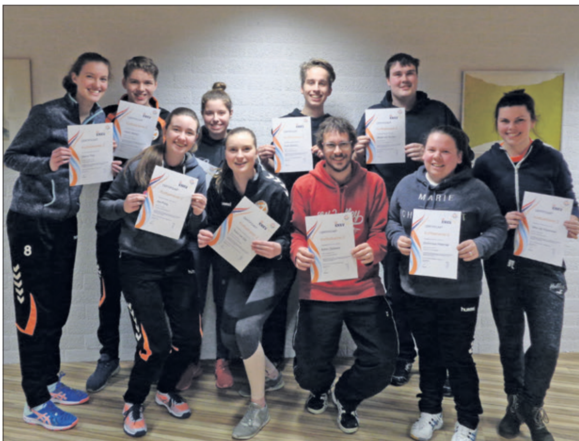
Donderdag 1 februari kregen 10 TZ-ers hun certificaat uitgereikt.

deren. De door het KNKV aangestelde cursusleider Klaas Otten nam de cursisten 4 avonden bij de hand in de wereld van training geven en wat daar allemaal bij komt kijken.