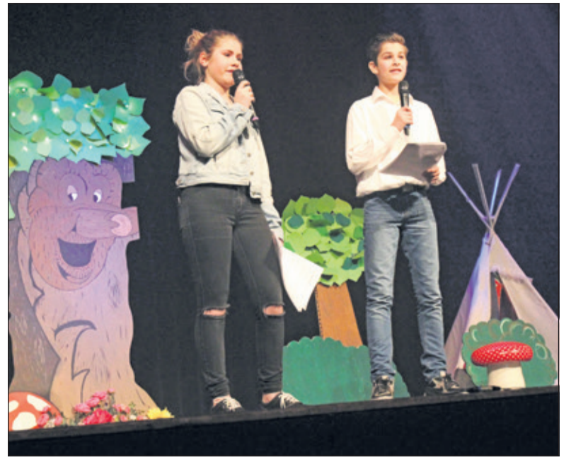
Vorig jaar zette Musikids ook een verrassende voorstelling op het toneel.

Dit jaar zal Musikids haar voorlopig laatste productie brengen. Deze vindt plaats op 17 en 18 februari om 14.00 uur in Theater het Lichtruim aan het Planetenplein 2b in Bilthoven. De afsluiting van drie jaar Musikids heet 'Musikids in wonderland', het is een eigen bewerking van het sprookje van Alice in wonderland voorzien van eigen liedjes, dans en eigentijdse humor. Dit jaar is de boodschap achter het verhaal dat niets onmogelijk is