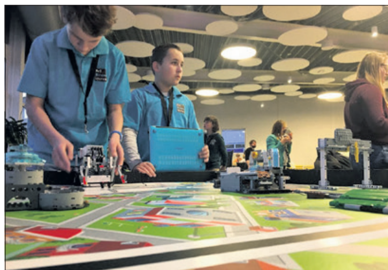
Leerlingen van Het Nieuwe Lyceum nemen deel aan de Beneluxfinale.

De First Lego League is een robotwedstrijd waarbij binnen twee