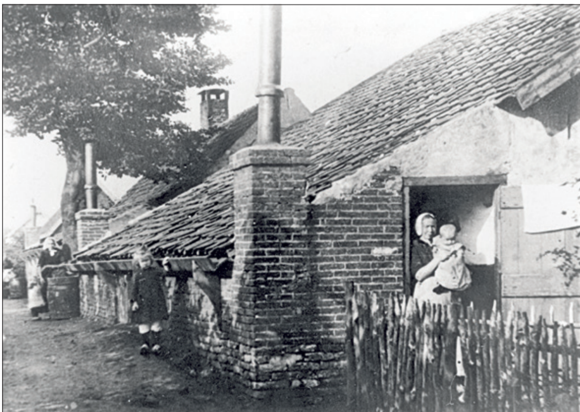
Een van de woningen aan de Akker midden vorige eeuw.