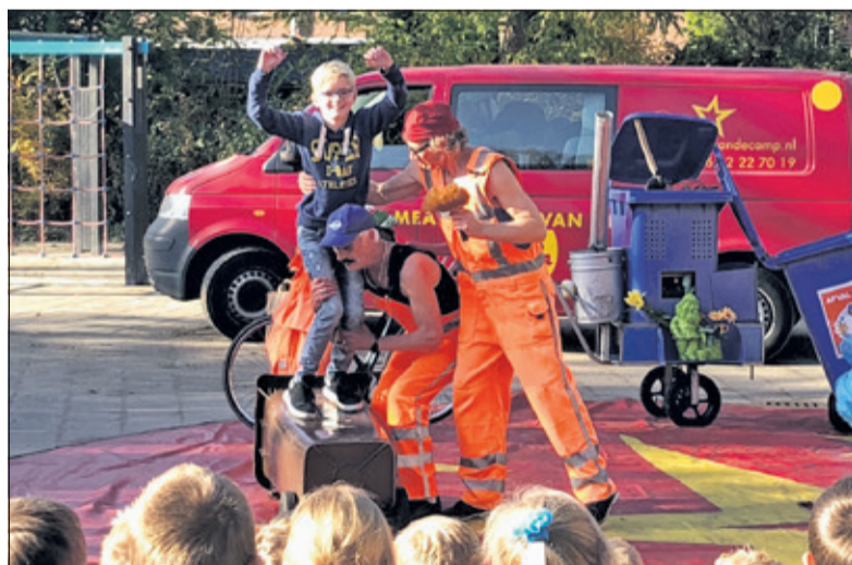
De Vuilnismannen bij de Martin Luther Kingschool.

Na de Julianaschool, gingen de Verrukkelijke Vuilnismannen nog langs bij de Theresiaschool en de Martin Luther Kingschool in Maartensdijk. Hollander: 'Het viel mij op dat de Martin Luther Kingschool voorheen vijf tot zes containers vol PMD had, maar nu nog maar twee. Alle leerlingen kregen vanuit school een bidon, zodat het aantal drinkpakjes daar enorm is afgenomen. Kortom, alle drie scholen zijn goed bezig. Een mooi voorbeeld voor andere scholen'.