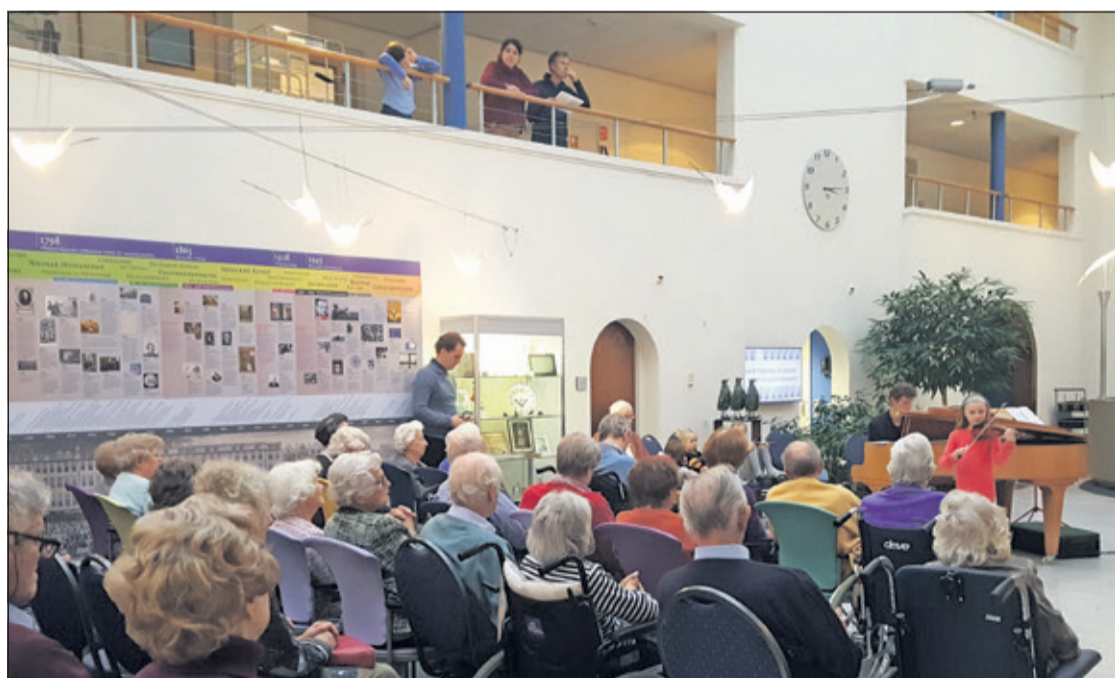
Jeugdige leerlingen musiceren voor bewoners van Huize het Oosten.

Zaterdag 10 november was het Atrium in Huize Het Oosten in Bilthoven goed gevuld met bewoners van dit huis. Jeugdige leerlingen van De Academia Filarmonica Utrecht speelden stukken van o.a. Telemann, Bach, Beethoven en Vivaldi, maar ook een bekend repertoire met bekende Nederlandse liedjes.