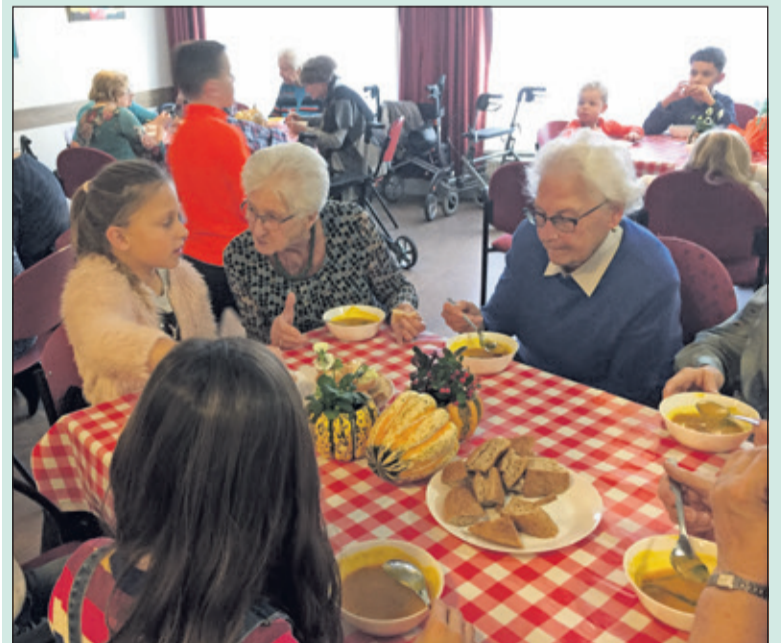
Kinderen van BSO de Paddestoel op bezoek in Dijkstate.