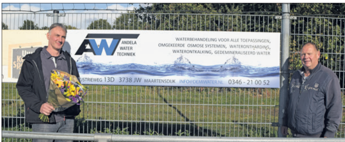
Andela Watertechniek Maartensdijk (AWT)