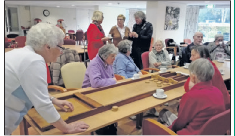
Elke maandag wordt er in De Bremhorst gesjoeld.

Maandag 5 november waren de jaarlijkse eindscores van de bewoners die elke week kwamen sjoelen, bekend en werden de trofeeën uitgereikt. De gouden Duim omhoog was voor mevrouw Uiterwijk; de zilveren voor mevrouw Scharwachter en de bronzen voor mevrouw Tinnemans. Iedereen die mee deed aan de sjoelcompetitie kreeg een prachtige roos. Met een hapje en drankje erbij werd het een feestelijke middag. (Berber Holwerda)