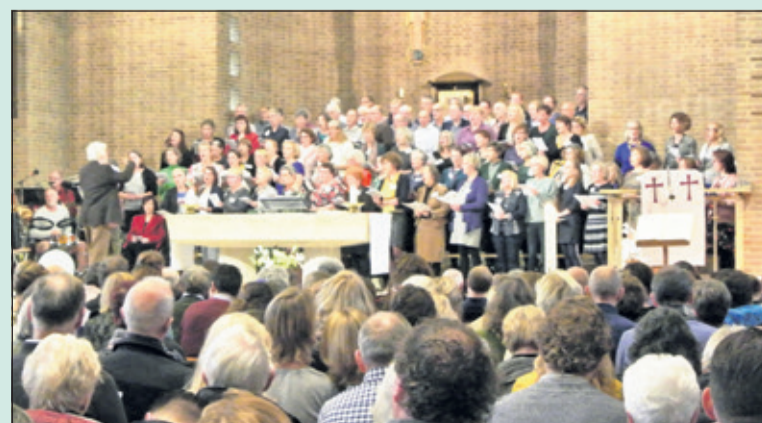
Een goed gevulde kerk beleeft de revival mee.

De voorganger sprak teksten uit over vooral hoop, vrede en verdraagzaamheid. Deze bijeenkomst gaf de kerkgangers een gevoel van saamenzijn in één familie. Ook sprak men over het weer ervaren van een traditie. De bezoekers bleven nog lang napraten onder genot van koffie of thee. (Frans Poot)