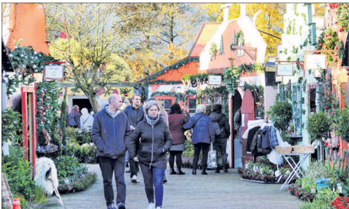
Het terrein van 't Vaarderhoogt is ingewisseld voor een prachtig, nostalgisch winkeldorp.

Naast het dorp vindt u in de overdekte kassen van 't Vaarderhoogt een zeer uitgebreide fonkelende kerstshow, boordevol prachtige decors en duizenden kerstartikelen De Warme Witte Winter Weken aan de Dorresteinweg 72b te Soest is elke dag open; vrijdag tot 21.00 uur.