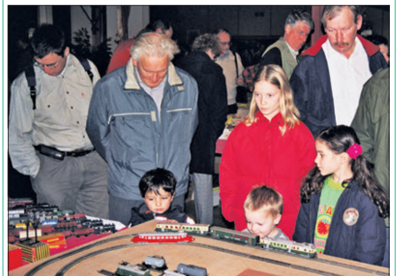
Jong en oud kijkt weer uit naar de Trix Express clubdag.

De donateurs van de Stichting Trix Express nemen weer de mooiste stukken uit hun verzamelingen mee om er echt de hele sporthal mee te vullen. Er zijn vele demonstratiebanen want rijden is nog steeds belangrijk. Kinderen mogen zelf aan de knoppen draaien en ook zelf hun emplacement bouwen. Daarvoor zijn stapels rails en wagons aanwezig. Voor de ouderen herleven de tijden dat al dat moois vrijwel onbereikbaar in de etalages lag. Nu echter blijkt, dat die dromen toch realiseerbaar zijn. Veel prijzen liggen rond de toenmalige catalogusprijzen maar dan nu in euro's. En heeft u een exemplaar dat het niet meer doet: Er is een ervaren reparatieploeg aanwezig. Nergens meer verkrijgbare onderdelen vindt u hier ook in voldoende mate. Trix Express werkt nog analoog: Het hoeft met Trix Express allemaal niet duur, ingewikkeld en geavanceerd te zijn: de techniek met relais, draaiknoppen en hefboompjes werkt nog steeds en is eenvoudig aan te leren. Inlichtingen clubdag: 06 21571565, j.w.leguit@online.nl