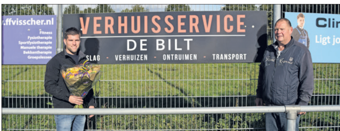
Verhuisservice De Bilt.