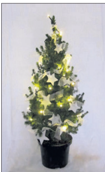
De 90 cm hoge kerstboompjes van Lions worden jaarlijks met veel zorg versierd.

Prinses Maxima Manege biedt hippische activiteiten aan mensen met en zonder beperking om vooruitgang te bevorderen in hun welzijn en maatschappelijke mogelijkheden. De Stichting Hulphond leidt jonge honden op om te worden ingezet als hulphond bij mensen met een handicap en ook worden de getrainde honden ingezet bij gezinnen met kinderen met een angststoornis en/of kinderen die gepest worden. Een klein deel van de boompjes wordt thuis bezorgd bij ouderen die zelf geen vervoer hebben om het boompje te komen halen. Bestellen kan via Lionskerstbomen@gmail.com of telefonisch via 06-19496318. Ophalen kan op vrijdag 7 tussen 15.00-18.00 uur en zaterdag 8 december van 10.00 uur-15.00 uur.