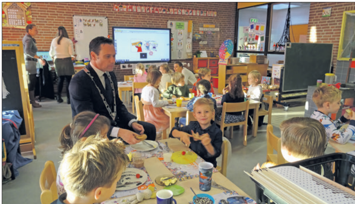
Burgemeester Sjoerd Potters genoot zichtbaar van het ontbijt met de kids van groep 1 en 2.

De burgemeester kwam niet met lege handen. Hij overhandigde een cheque van 250 euro bestemd voor een goed doel. Het goede doel verbonden aan het Nationaal Ontbijt is dit jaar de Kinderpostzegels maar de Bosbergschool kan het bedrag ook aan een ander goed doel besteden.