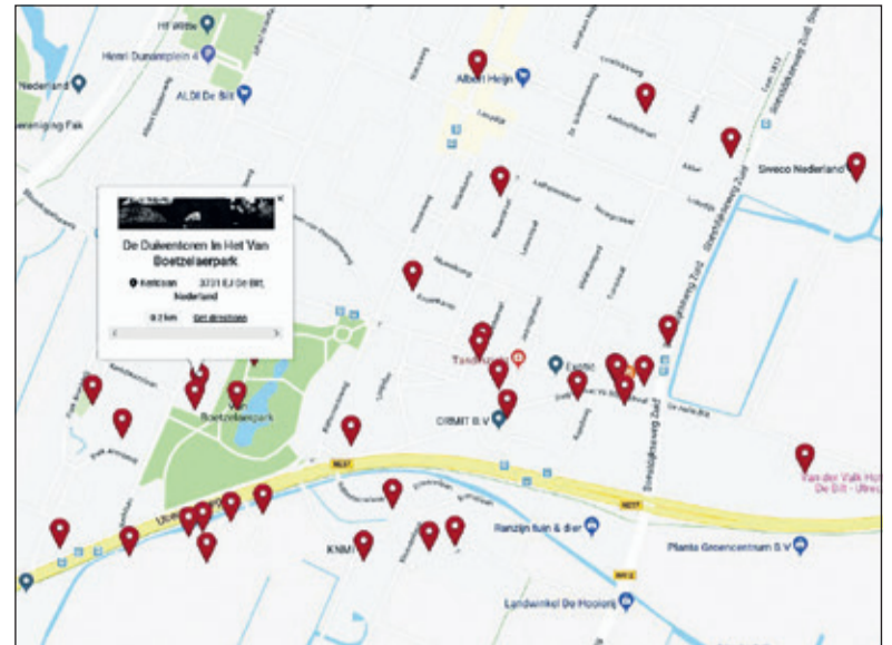
Op je telefoon zie je wat er om je heen interessant is

Vanaf 1 december 2018 is in overleg en samenwerking met de Universiteit Utrecht een stagiair actief (historica in opleiding), die de redactie ter zijde staat. De redactie plaatste tot 5 november (ijk-datum) 390 berichten en artikelen. Een aantal objecten werd voorzien van geo-tagging voor hen die het cultuurbezit van De Bilt fysiek willen verkennen met behulp van hun mobiele telefoon. Nieuwe items betreffen de 35 heren van Achttienhoven (en drie opvallende), en de sloop van Vrouwenklooster en Oostbroek omstreeks 1580. Doedens: 'Bestuur