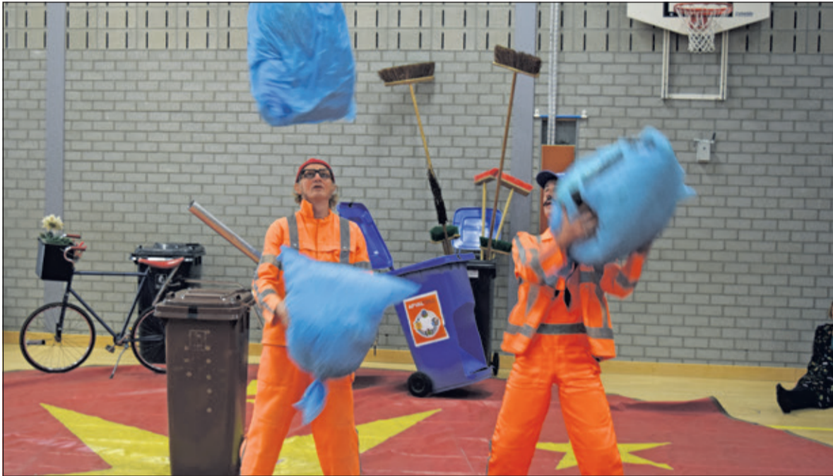
De Verrukkelijke Vuilnismannen maakten er een rommeltje van op de Julianaschool en Theresiaschool in Bilthoven.