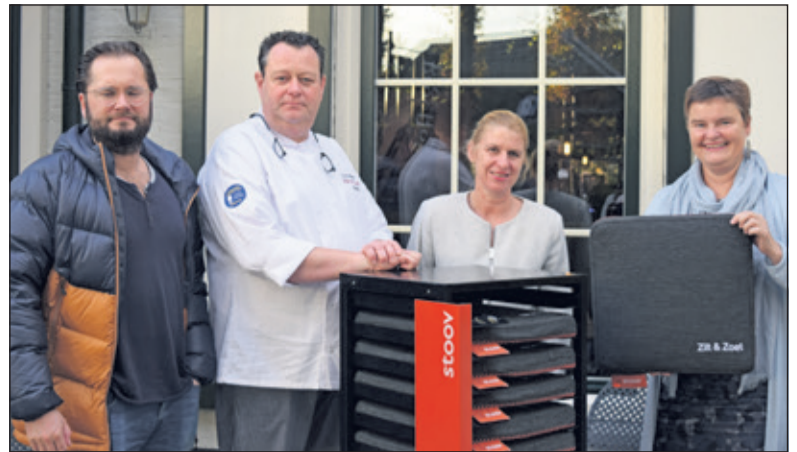
Zilt & Zoet is blij met alle aandacht voor hun restaurant.

Tijdens een wandeling in Limburg kreeg Brommersma een verwarmd stoelkussentje aangereikt op een terras. Toevallig bleek dit een product van een bedrijf uit Bilthoven, Stooov. Dit bleek uiteindelijk een mooie prijs voor de winnende horeca in