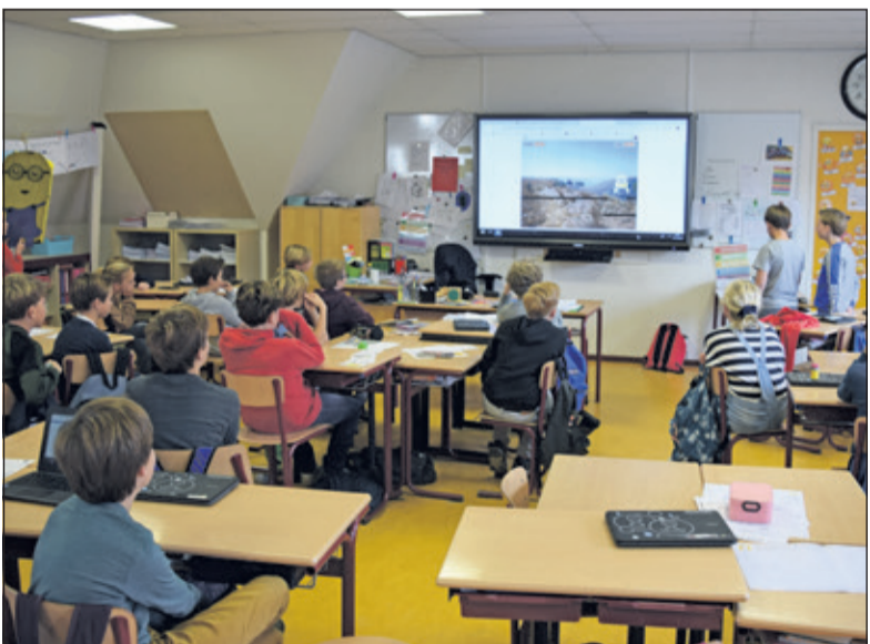
Leerlingen presenteren hun oplossing voor de klas.