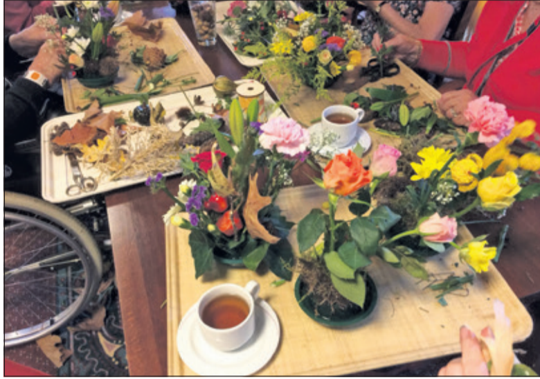
Bewoners van de Schutsmantel maken herfststukjes.