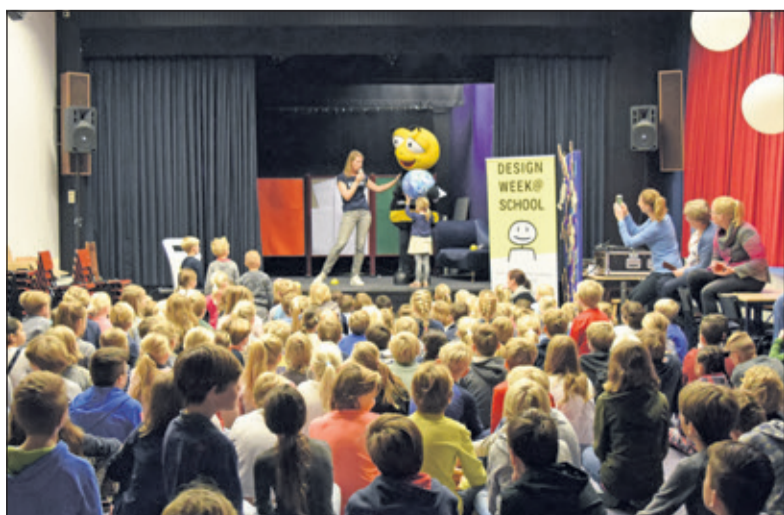
Opening van de Designweek@school op de Van Dijkschool.

Aan het eind van de week volgden presentaties van de diverse groepjes leerlingen. Zij hadden verschillende oplossingen bedacht: het maken van een website over verbetering van het milieu met diverse tips, een robot die kinderen aanspreekt als zij rommel achterlaten, een app voor de elektrische auto, vanuit een mindmap werd een app gebouwd over het 'verraden' van hangjongeren die iets weggooien, een app tegen stropen, een vliegende auto voor zakenmensen, een game om kinderen te helpen met het verwijderen van plastic, een game voor een beter vervoer van mensen en een app waarbij mensen alleen dat