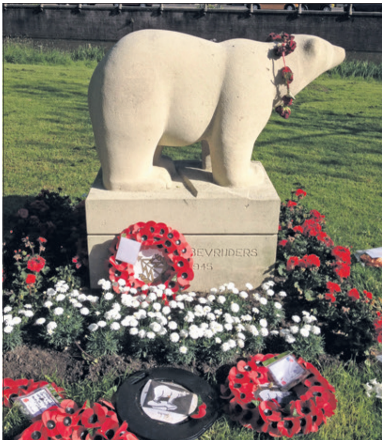
Het Polar Bear Monument in de bloemen tijdens een herdenking in 2015.

We lezen verder in de Tentoonstellingsagenda van het Museumtijdschrift: 'Kracht en leven, die associaties roepen de beelden van Marie-José Wessels op. Mens en dier, neergezet in plastische, volle, vaak gesloten vormen. We zouden haar beelden ook 'aards' of 'baasaal' kunnen noemen. Haar werk is figuratief en ondubbelzinnig. De beelden zijn wat we zien: een robuuste vrouw, een alerte otter, scharrelende kippen. Sfeer en spanning zijn de uiteindelijke inspiratiebron voor ieder beeld. Die sfeer is voor Marie-José het uitgangspunt, de oervorm. Want elk beeld begint met de sfeer die het onderwerp bij haar oproept. Vanuit dat gevoel en die spanning zoekt zij naar het moment, de beweging die zij uiteindelijk wil vastleggen in steen, was of klei. In het Hogelandse Park aan de Biltstraat bij De Berekuil in Utrecht staat van haar het beeld Polar Bear Monument. Het beeld is ter herinnering aan 7 mei 1945 toen Utrecht werd bevrijd door het Engelse 49ste Regiment Verkenningsstroepen Polar Bears. De expositie is van 18-11 t/m 15-01-2019 tijdens kantooruren in het gemeentehuis Jagtlust te zien.