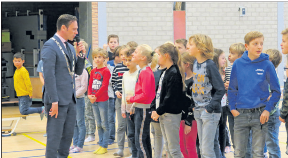
Spelleider burgemeester Sjoerd Potters weet iedereen te betrekken.