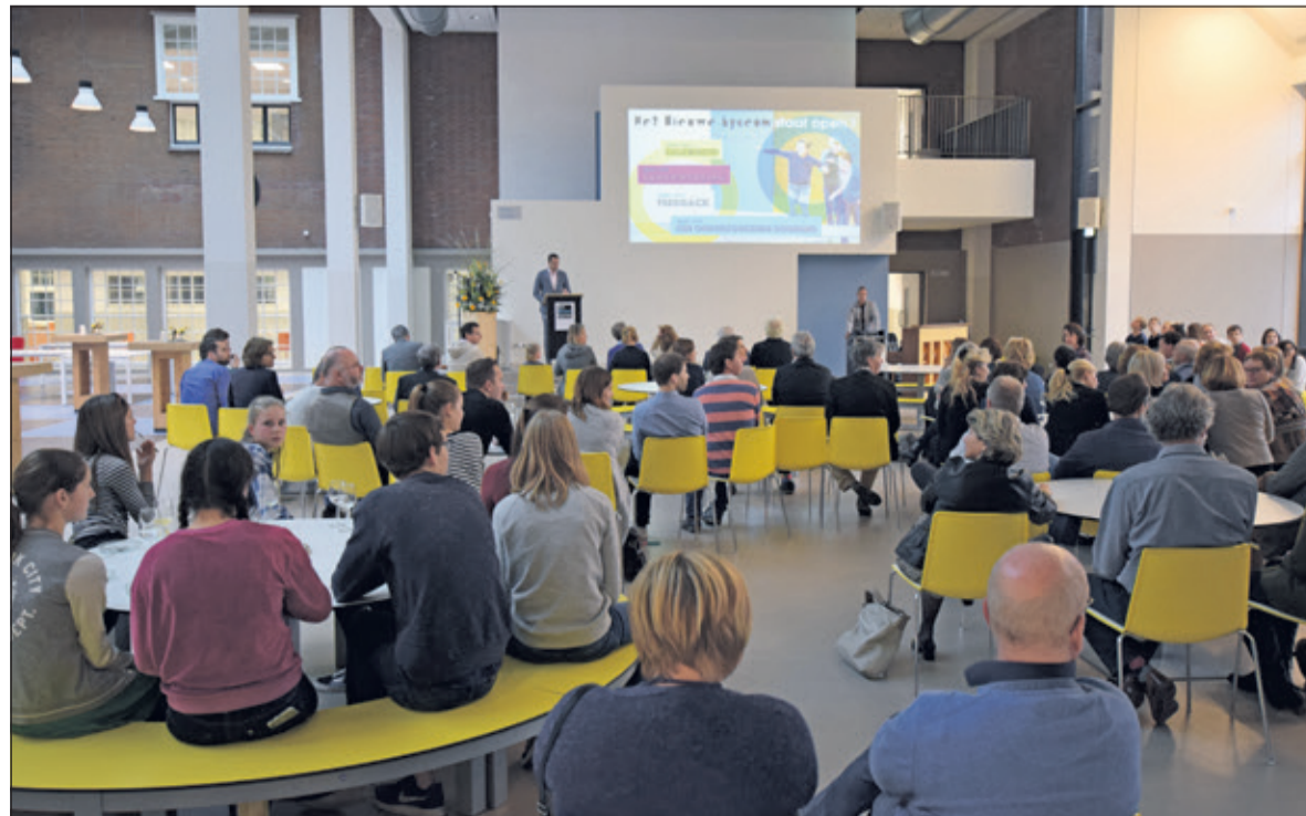
In de centrale open ruimte vindt, anderhalf jaar na de start van de bouw, de officiële opening plaats.