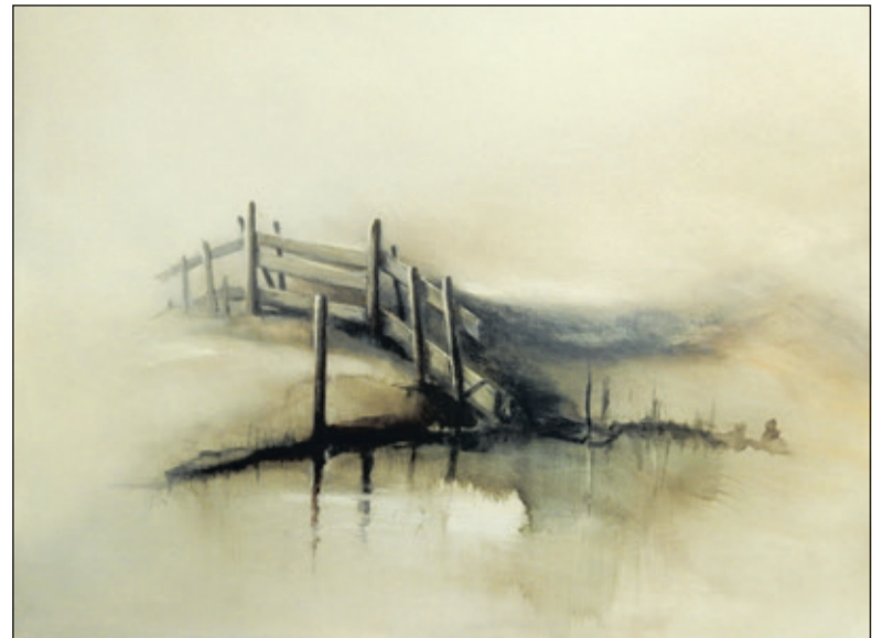
Hekje in het Noorderpark.