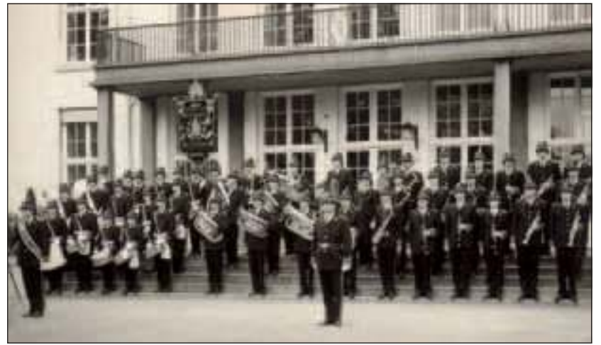
Staatsiefoto van de VVBB uit de jaren '70, voor het gemeentehuis van De Bilt.