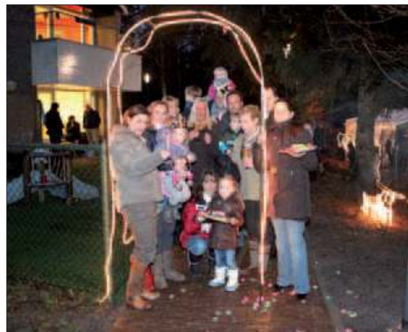
Het was vrijdag 20 januari al avond bij de officiële heropening. Reuze spannend.

Kinderdagverblijf de Bosuiltjes is een van de 12 vestigingen van Kinderop-