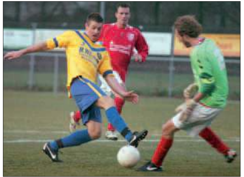
SVM heeft de wedstrijd tegen hekkensluiter Sterrenwijk met maar liefst 8-0 gewonnen.

Volgende week in Amersfoort tegen Posthoorn wordt er hopelijk een goed vervolg aan deze voortvarende doorstart gegeven. [HvdB]