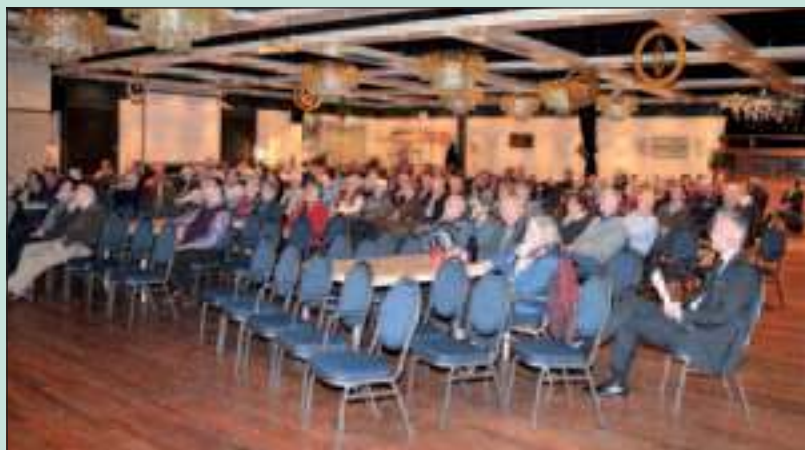
Belangenvereniging Weltevreden kan terugkijken op een goed bezochte thema-avond over inbraakpreventie en veiligheid. Lees meer op pag. 2