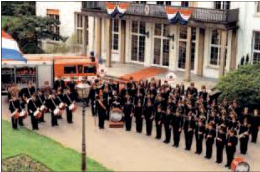
In 2000 poseerde de volledige harmonie opnieuw voor het gemeentehuis in vol ornaat.