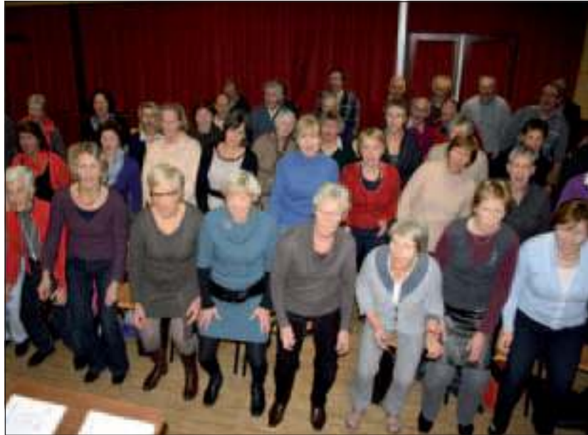
Bij AZM is men al druk aan het oefenen.

Het AZM heeft voor dit stuk besloten af te stappen van de vertrouwde, gebaande pad die het gezelschap meestal bewandelt. 'Mensen zijn van AZM klassieke muziek gewend. Tijdens dit concert spelen we lichtere muziek', legt Hintzen uit. Dus niet bijvoorbeeld Mozarts Requiem, maar Queens Bohemian Rhapsody. 'Het is erg leuk het eens in een andere stijl dan gebruikelijk te proberen. Het vraagt een andere tekstbeleving. Ook doet het meer een beroep op de eigen beleving van de zangers dan klassieke muziek dat doet. De leden van ons koor worden daardoor gedwongen meer karakter te tonen. Erg mooi om te zien dat het er ook inzit.