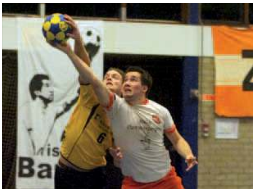
TZ heeft de thuiswedstrijd tegen koploper Tempo met 15-17 verloren.

Na de rust eenzelfde spelbeeld. TZ miste enkele goede kansen en Tempo liep langzaam verder uit. In de tiende minuut na de rust kwam Wouter van Brenk in het veld voor Joep Gerritsen. Dat gaf nieuwe aanvullende impulsen en TZ kwam naderbij. Bij een 14-12 voorsprong miste Tempo drie achter elkaar gegeven strafwerpen. Tweemaal Zes profiteerde hiervan en kwam door twee treffers van Wouter van Brenk weer op gelijke hoogte. Een verrassing leek mogelijk. Het eerste aanvalsvak van TZ had in de tweede helft van de wedstrijd echter moeite met scoren. Met nog zes minuten speeltijd op de klok waren