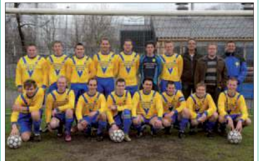
Dankzij sponsoring van Verschuur Constructiebouw uit Groenekan zijn de mannen van SVM 7 voorzien van geheel nieuwe tenues.