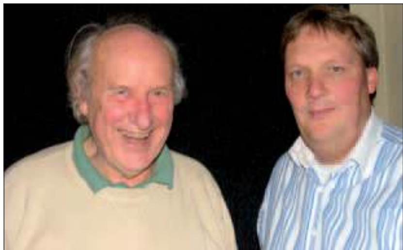
Onmoeting tussen twee Olympische deelnemers uit Bilthoven.