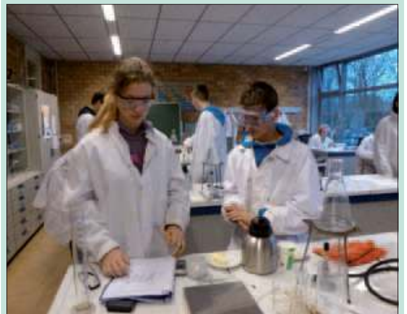
Wetenschappers in de dop bij het Groenhorstcollege.