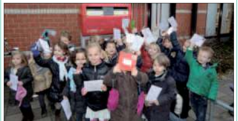
Aan enthousiasme geen gebrek bij de deelnemers.