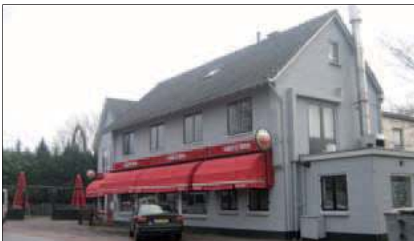
Het Wapen wacht op een nieuwe eigenaar.

Problemen, onlangs in en rond het café aan het begin van de Dorpsweg in Maartensdijk, waar omwonenden ook in het verleden menigmaal last van hadden, hebben ervoor gezorgd dat de licentie van de eigenaar is ingetrokken. Het café is weer te koop.