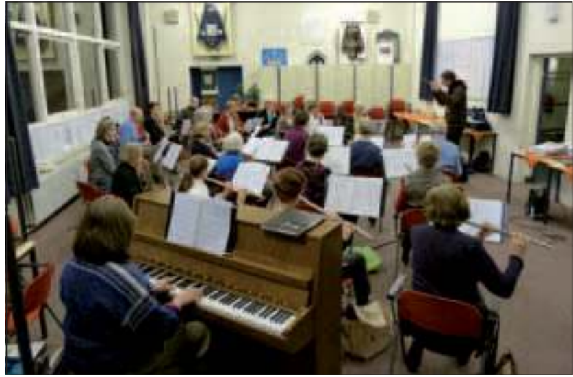
Woensdag 19 januari jl. oefende Samuze in het gebouw aan de Jasmijnstraat 6 te De Bilt.