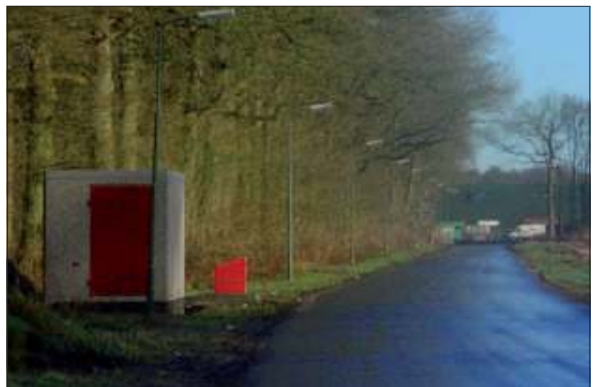
Ook de grote noord-zuidlaan is 'verfraaid'. In het gat aan het eind van de laan stond de boom van de eerste foto.

Dit is het Biltse laanbomenbeleid in de praktijk. Op papier ziet dat er wel anders uit. Mede dank zij fraaie nota's als het Landschapontwikkelingsplan kon de gemeente trots melden dat ze