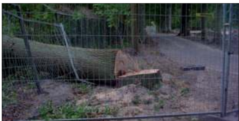
Eerdere kap op de oost-west laan. Een groot gat ontstaat als een forse gezonde boom wordt gekapt terwijl zijn burens (erachter) dood en (rechts buiten beeld) zwaar beschadigd zijn.

de verantwoordelijke partijen - raad en college - zich eens over de kwestie buigen en kritische vragen - ook over het eigen functioneren - niet schuwen. Dan zou er toch nog iets goeds voortkomen uit deze trieste toestand en wordt verdere schade voorkomen. Want er staan nog dertien andere laanbomen en ruim dertig andere joekels in de groenstrook op de nominatie om gekapt te worden.