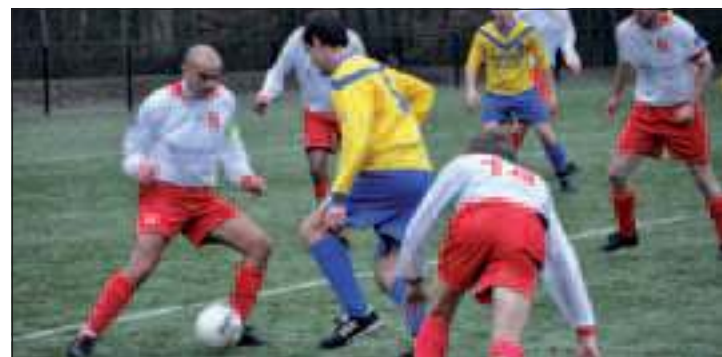
Candia verdedigde met man en macht.

Door het verlies zakte SVM weer een plaatsje op de ranglijst. De afstand tot de middenmoot is nog te overzien, maar dan moet SVM wel weer gaan winnen. De eerstvolgende mogelijkheid is a.s. zaterdag als op eigen terrein gespeeld wordt tegen Hees. De ploeg uit Soest heeft dit seizoen nog maar 3 punten bijeen gesprokkeld. Voor SVM dus een uitstekende gelegenheid het zelfvertrouwen weer wat op te vijzelen.