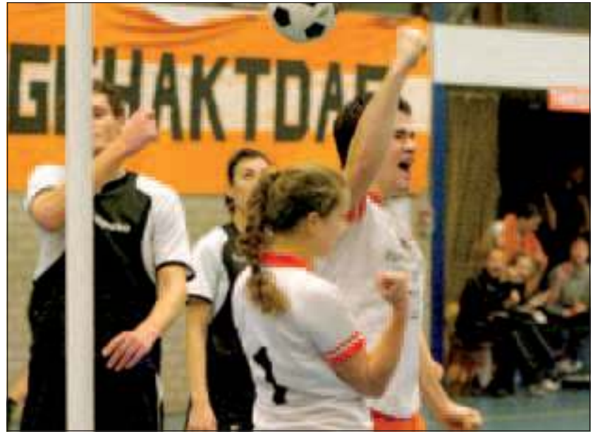
TZ heeft goede zaken gedaan door het duel met concurrent KCC met 17-14 te winnen.

Ook na rust was het de thuisploeg die als eerste weer scoorde (10-6). Hoewel in het vak van Van Brenk beide heren op hem waren gefocust was het Maik van Kouterik die daar dankbaar gebruik van maakte en met in totaal 3 treffers bleef mee scoren. Naarmate de 2de helft vorderde werd er om en om gescoord (14-11), maar daarna leek het als of KCC/Hijbeko