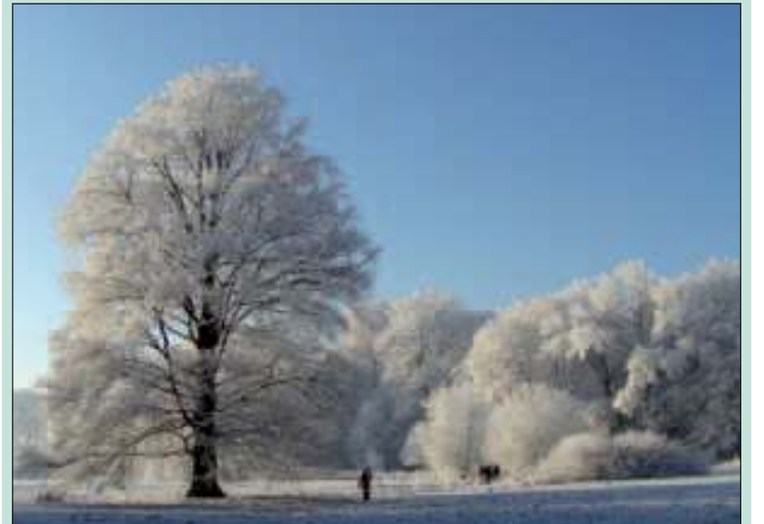
Ook zonder sneeuw belooft het een prachtige wandeling te worden.

De wandeling begint om 14.00 uur en duurt ongeveer twee uur. Het verzamelpunt is de parkeerplaats op Sandwijck. U vindt deze aan de Utrechtseweg 301, recht tegenover het Van Boetzelaerpark. Als het vochtig is, is het verstandig om stevige schoenen of laarzen aan te trekken. De rondleiding is gratis. Honden zijn (ook aangelijnd) niet toegestaan op Sandwijck.