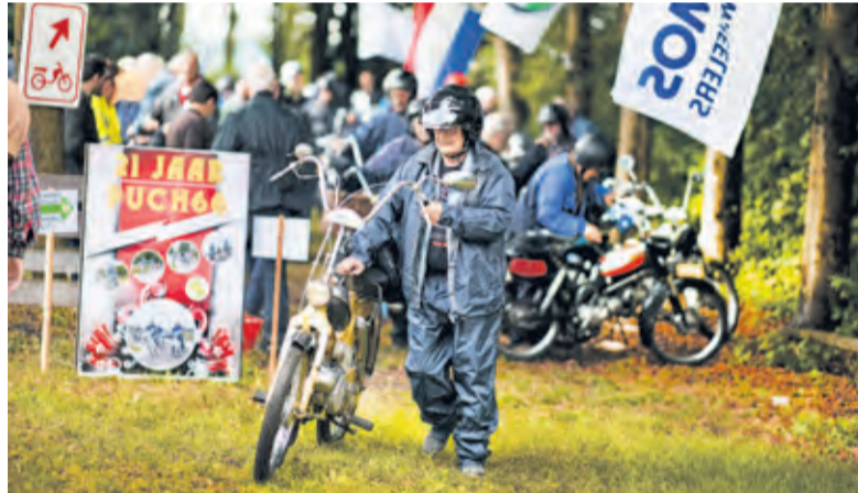
Gepast gekleed klaar voor de zomerrit.

Dat de brommerfanaten uit het goede hout zijn gesneden, bleek wel uit de min of meer spontane inzamelingsactie voor Alpe d'HuZes; die leverde bijna 1700 euro op. De rit van zo'n zestig kilometer verliep zonder noemenswaardige incidenten. Alleen bij de start bleken een paar brommertjes weigerachtig, maar de aanwezige kennis en deskundigheid wisten de probleempjes snel te tackelen. En ondanks de barre weersvoorspellingen wist de groep steeds tussen de buien door te manoeuvreren.