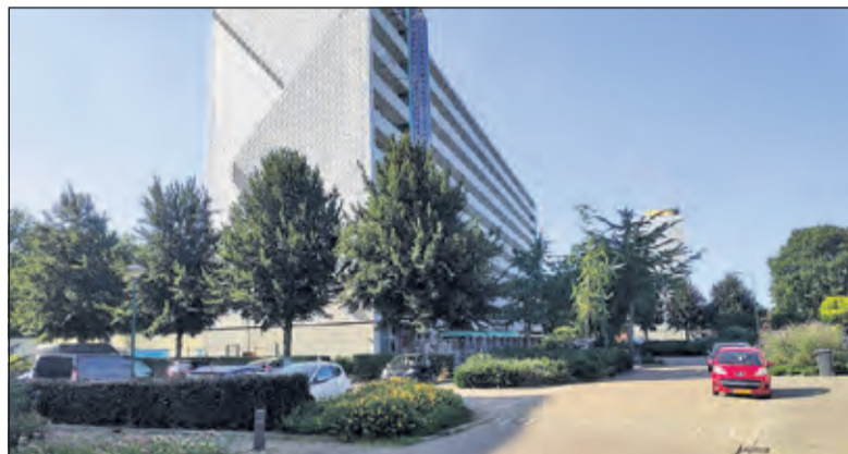
Warmtenet is in beeld voor o.a. de Kometenlaan in Bilthoven.

'Hoe zou de energierekening er uit kunnen zien? Welke aanpassingen zijn er nodig aan de woning? Hoe blijft het betaalbaar?'; allemaal open bijkomende vragen. Het is uitdrukkelijk de bedoeling dat inwoners betrokken worden en blijven bij het uitwerken van de plannen, tijdens buurtbijeenkomsten en individueel. Wanneer het warmtenet