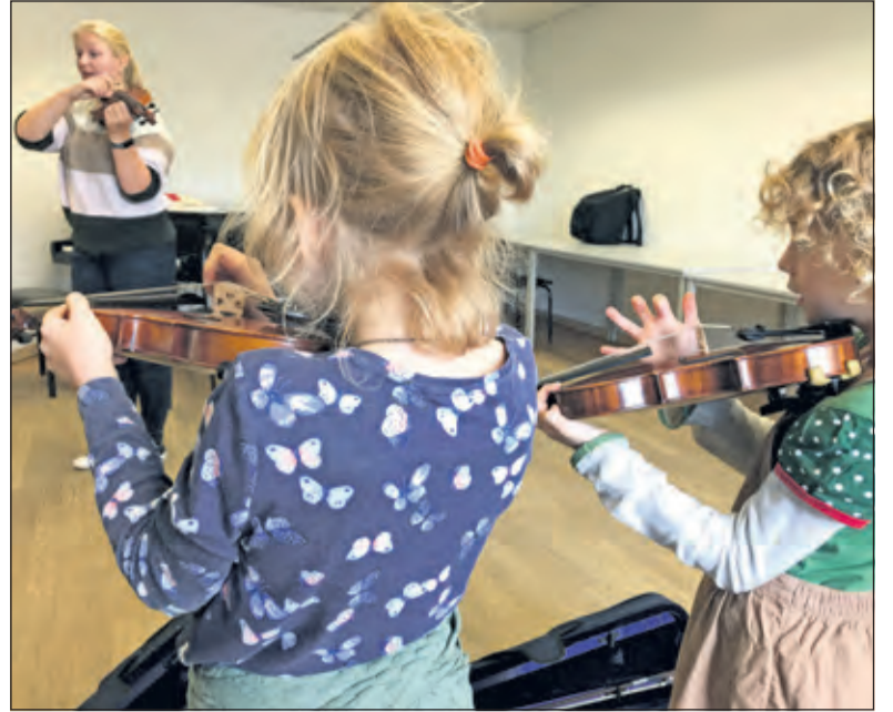
Maak kennis met verschillende muziekinstrumenten bij KunstenHuis Muziekschool. (foto Dieuwertje van Ravenswaaij).

Kennismaken met het KunstenHuis, woensdag 1 en zaterdag 4 september, info en aanmelden: www.kunstenhuis.nl/ of bel 030 6958393.