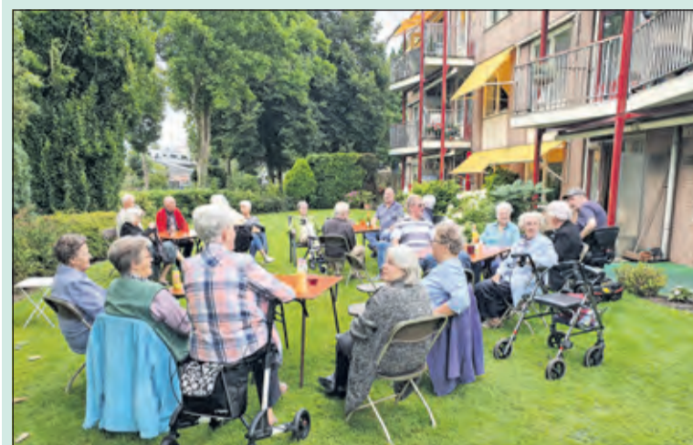
24 bewoners verzamelen zich voor hun barbecue.