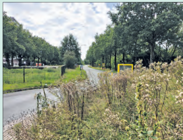
Biltse Rading t.h.v. de Martin Luther Kingweg richting Utrecht is in het weekeinde van 4 en 5 september afgesloten.

In het weekend 4-5 september ligt in de planning om het regenwaterriool door de Biltse Rading aan te brengen. Dit vooruitlopend op de toekomst, om zo het regenwater te gaan scheiden van het vuile water. Dat heeft tot gevolg dat de Biltse Rading vanaf Martin Luther Kingweg tot Blauwkapelseweg in weekend 4-5 september is afgesloten.