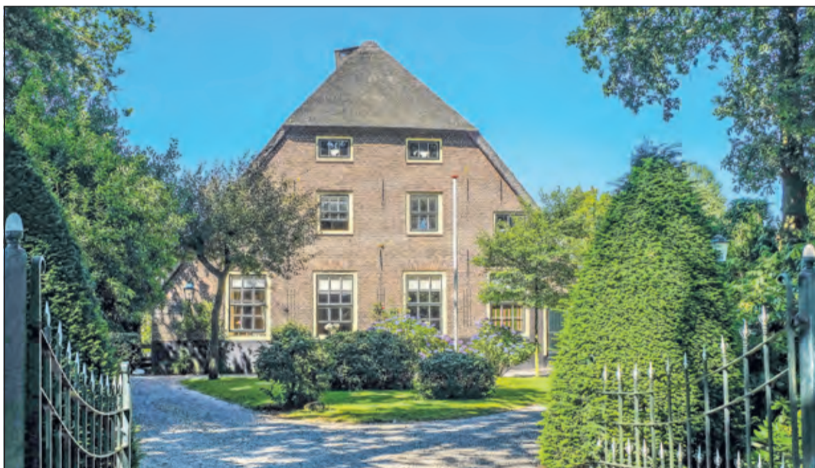
Hofstede Koddestein aan de Dorpsweg 61 is één van de oudste boerderijen van Maartensdijk.