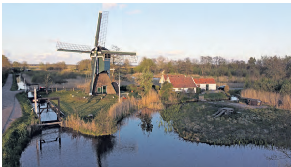
Beeld van molen De Trouwe Wachter in Tienhoven, vlak voor zonsondergang.