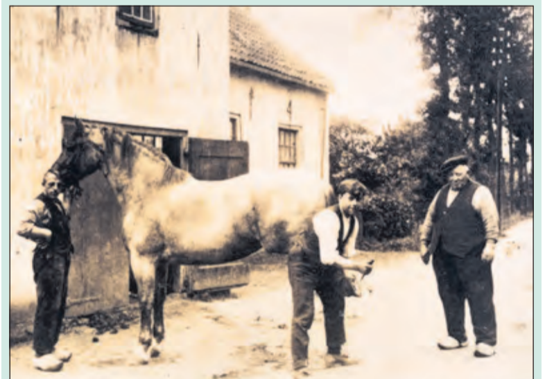
Er was aan de Dorpsweg (20-22) een hoefsmid (Bos) gevestigd, ongeveer tegenover 'het doktershuis' op nr. 23.

Er staan 208 huizen langs de Dorpsweg in Maartensdijk; aanzienlijk meer dan in de meeste andere straten. De huizen hebben als gemiddelde bouwjaar 1926: ze zijn dus relatief oud. De oudste woning heeft als bouwjaar 1565.