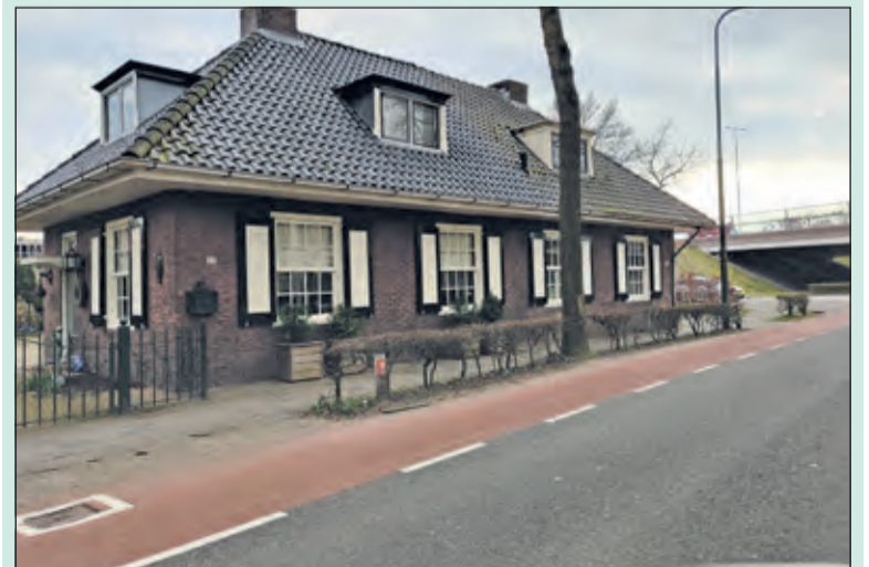
In 1932 is op de plaats van die oude hoefmederij het dubbele woonhuis Dorpsweg 22-24 verzezen. Door de aanleg van de Dierenriem is perceel 22 nu op de hoek van Dierenriem-Dorpsweg gelegen.