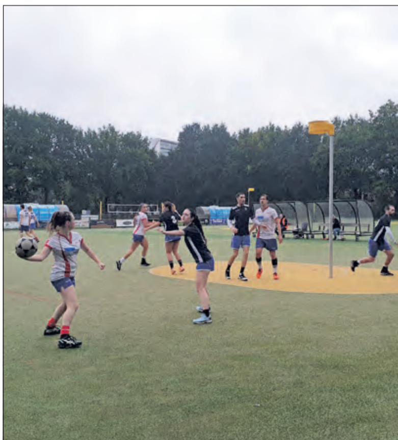
Naast dat het een mooie oefen-pot is, speelt Nova 28 augustus ook om prijzengeld.