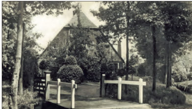
Een foto van Koddestein in 1926.

kocht. De knecht van de voormalig eigenaar Liefink, had op grond van een laatste wilsbeschikking recht op 12 jaar pacht van de boerderij. Gedurende de periode waarin boer Liefink op Koddestein woonde is het rechtergedeelte van het woonhuis (de arbeiderswoning) verhuurd aan verschillende Maartensdijkse families; hierna is het huis onbewoonbaar verklaard. Tijdens de