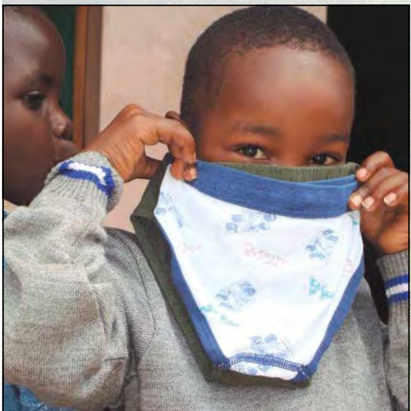
Trots op zijn nieuwe onderbroeken.