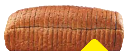
Boeren of grof volkorenbrood gesneden en verpakt heel