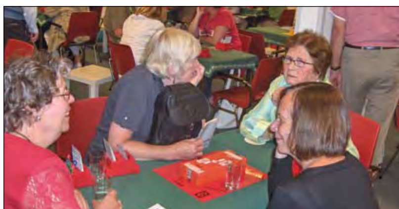
De zomerbridgeavonden boden tevens gelegenheid voor het leggen en onderhouden van contacten.