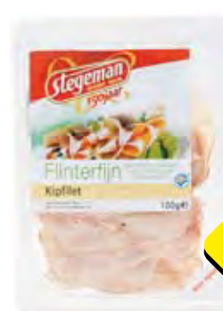
Stegeman vleeswaren flinterfijn kipfilet, achterham, rauwe ham of runderrookvlees 100 gram