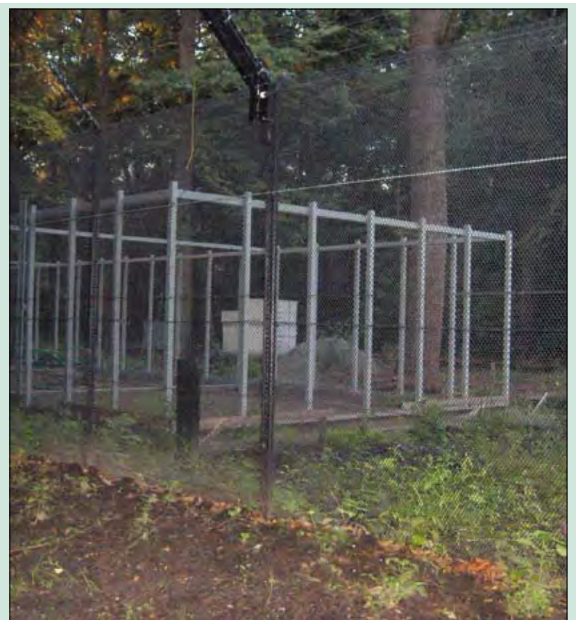
De kazerne is nog een stalen skelet, achter alweer een ijzeren hek.

kwamen er balken van ijzer. Ga zelf maar kijken. Het is geen gezicht.' Een blik door het gaas toont een eenzaam stalen skelet. Intussen is er verzet gerezen tegen de kazerne en tegen een geplande parkeerplaats voor vijftig auto's. Het bouwen is stopgezet en het wachten is nu op de rechter. Die moet beslissen en dat kan wel weer een tijd duren. De dorpsbewoners reageren nu anders dan vorig jaar. Er wordt niet veel meer over gepraat. Een deel vindt het nog steeds ontsierend. Een ander deel lijkt het te accepteren en over anderen wordt gezegd dat ze altijd wel iets te zeuren hebben.