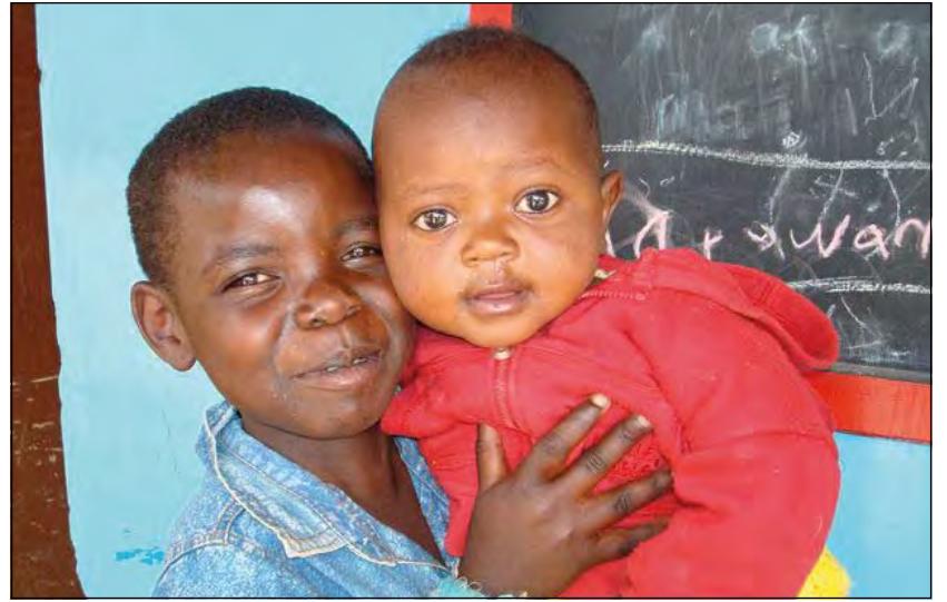
Een ouder meisje ontfermt zich over een baby.