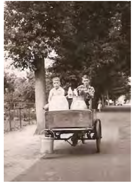
Uit 'Het Dorp' van Wim Sonneveldt: Thuis heb ik nog een ansichtkaart Waarop .....

Uit liefhebberij ging hij vanaf 1982 handelen in tweedehands goederen zoals wasmachines, hometrainers, postzegels, munten en 'prentbriefkaarten'. Overal in het land kocht en verkocht hij deze en vaak huurde hij een stand op beurzen. Alleen de ansichtkaarten van Maartensdijk en omgeving behield en bewaarde hij zelf. Ondanks het feit dat hij met het verzamelen ophoudt, kan hij het niet laten soms toch weer handel in te kopen. Daarom vraagt hij in de eerder genoemde advertentie, waarin hij vermeldt te gaan stoppen met sparen, tegelijkertijd ook nog losse oude ansichtkaarten en albums te koop. Vooralsnog is hij niet van plan zijn verzameling over Maartensdijk van de hand te doen.