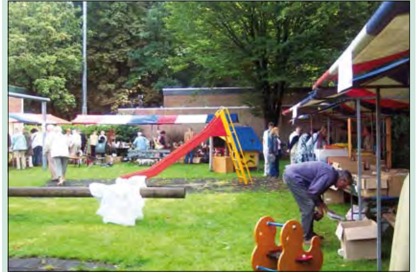
Een goede opkomst bij de kraampjes van de Zomermarkt in Lage Vuursche.