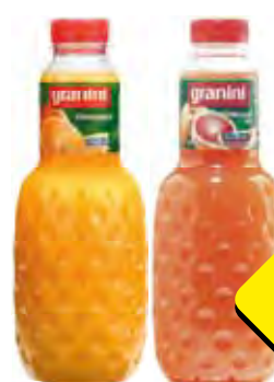
Granini vruchtnectar sinaasappel, roze pompelmoes, perzik en lychee of mango fles 1 liter