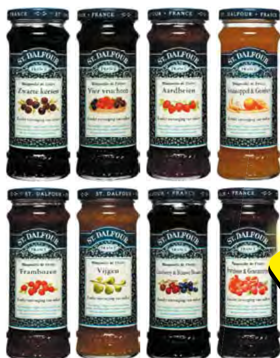
St. Dalfour jam alle smaken pot 284 gram