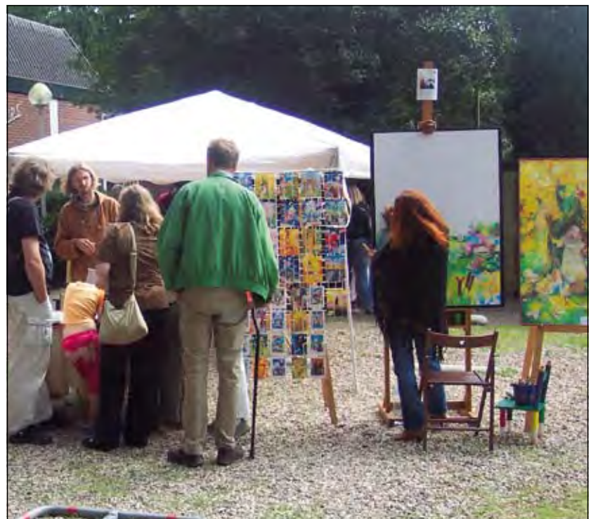
Vooral tijdens De Zomermarkt op zaterdag was het druk en de verkoop goed.