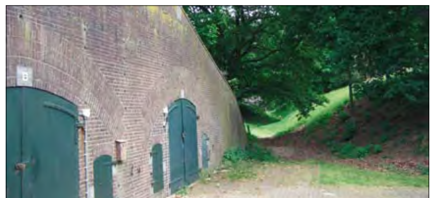
Rond het fort Ruigenhoek komen ook veel vleermuizen voor.