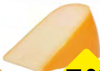
Goudse kaas 30+ jong belegen kilo