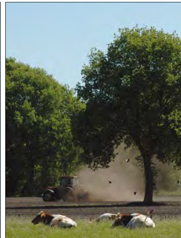
Het was ook nog wel eens droog de afgelopen tijd.