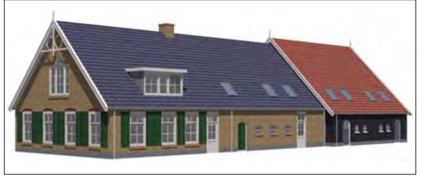
Maquette van het Thomashuis Maartensdijk.

bij een presentatie van het Thomashuis aanwezig te zijn. Men krijgt op deze avond een beeld van wat een Thomashuis is, wie er samen met hen in het huis komen wonen en waar de overkoepelende organisatie Thomas-