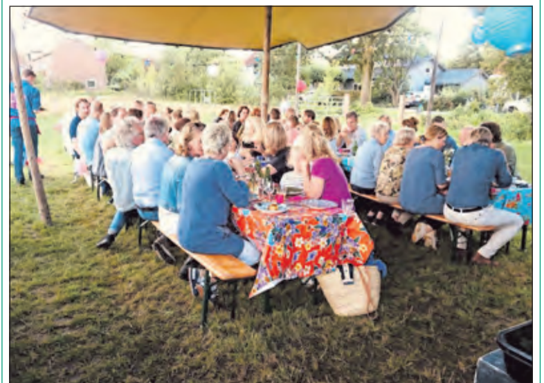
Buurttafel in de Groenekanse Veldlaan.