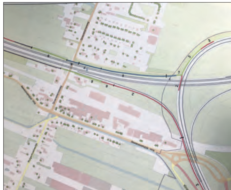
Het eerste deel van de verbreding A27 is al achter de rug; de vele gepande schermen bij deze 2e aanpassing gaan voorlopig niet door.