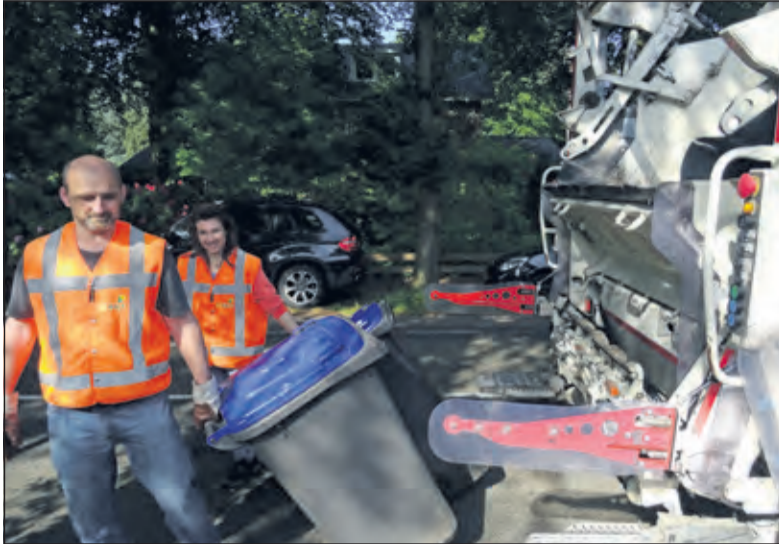
Vrijwilligers van Biltse verenigingen zijn tweemaal per maand actief om oud papier voor hun vereniging op te halen.

Maar liefst dertien verenigingen uit de gemeente De Bilt zijn aangesloten bij de Stichting Inzamelen Oud Papier De Bilt/Bilthoven (SIOP). Twee zaterdagen per maand zijn de vrijwilligers van deze verenigingen in touw om in de gemeente oud papier op te halen en zo een mooi bedrag voor hun vereniging te verdienen.