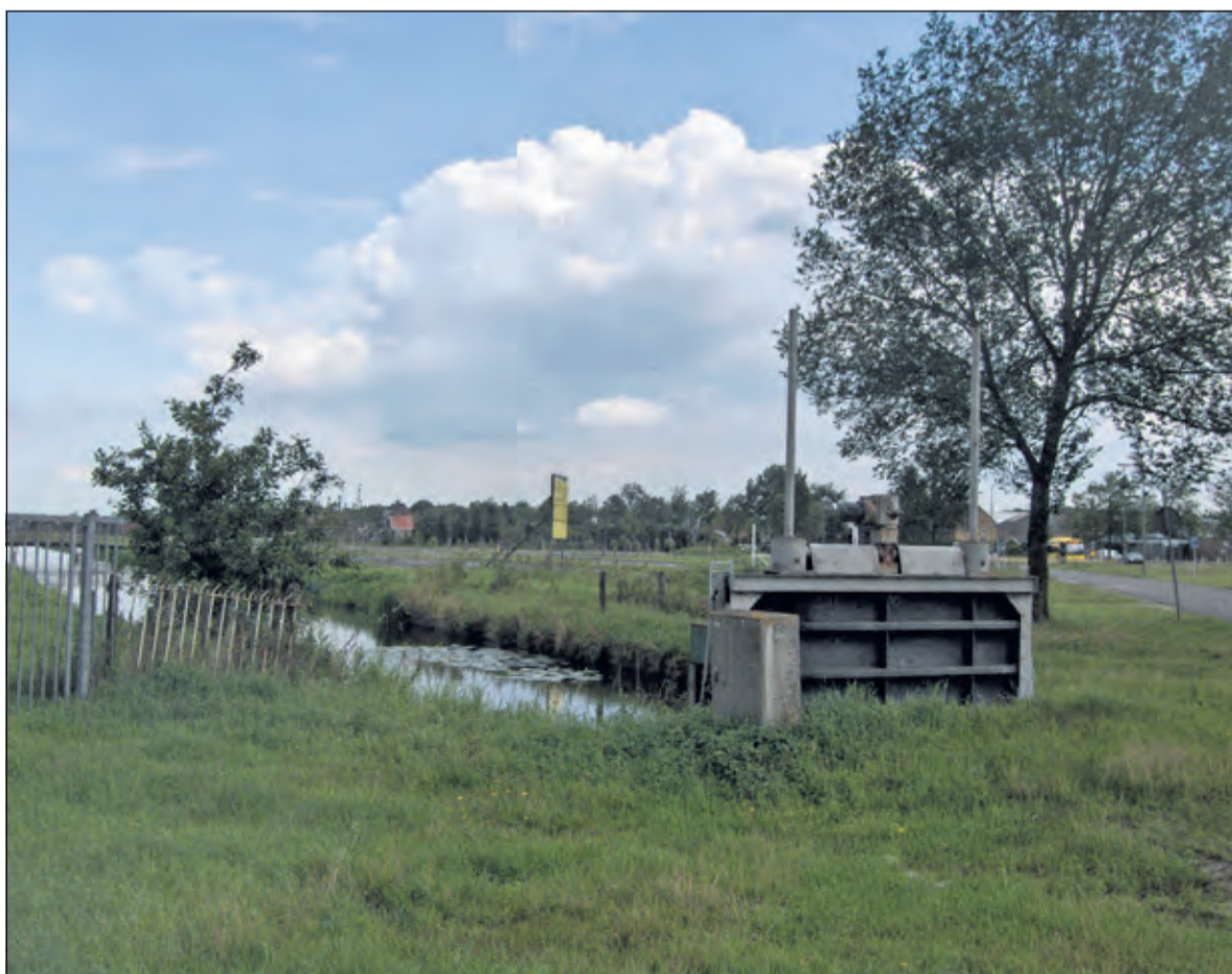
Foto 1: De schuif in de Groenevaart staat tegenwoordig altijd open.

www.naastdeburen.nl Groenekanseweg 168, Groenekan