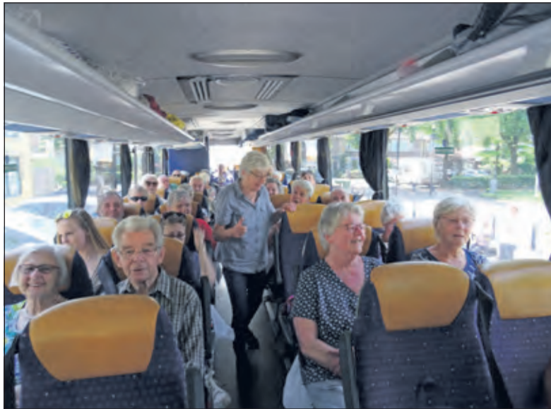
Als alle deelnemers aan de vakantieweek een plekje gevonden hebben kan de bus vertrekken naar De Rijp.

Het weekprogramma was zeer gevarieerd. Een boottocht, een rondrit met een touringcar door Schermer en Beemster, een bezoek aan het prachtige landgoed Hoenderdael in Sint Anna Paulowna en een optreden van een smartlappenkoor. Tussendoor vermaakten de gasten zich met spel-