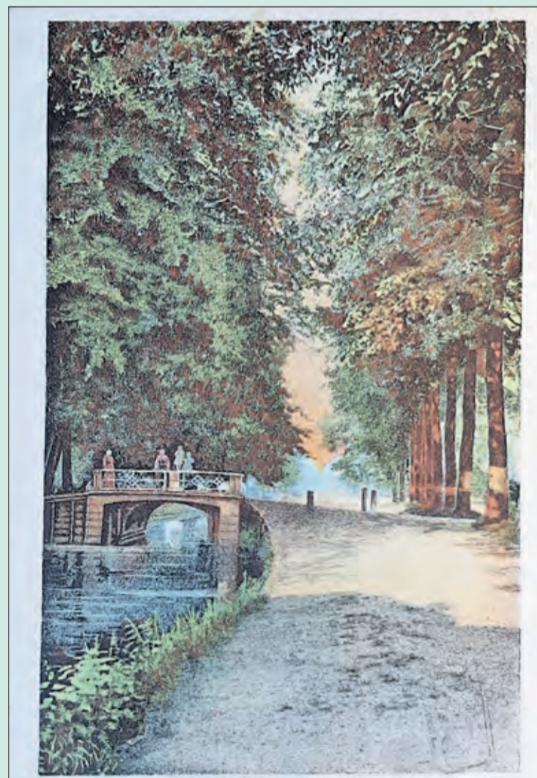
Gezicht op een bruggetje over de Biltse Grift aan de Biltsestraatweg tussen Utrecht en De Bilt.

Op weg naar campings of stranden kun je best in een file belanden maar je bent lekker vrij en wees toch maar blij smeer je wel in om niet te verbranden