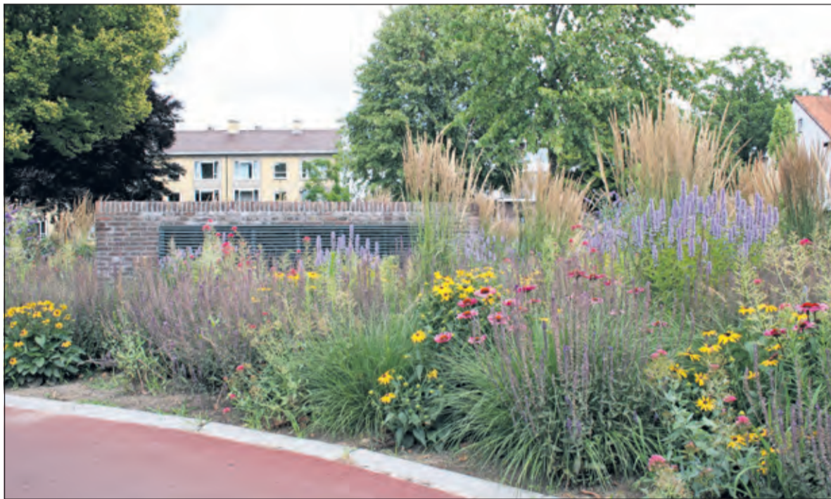
Bloemetjes en bijtjes op het Dr. Letteplein.