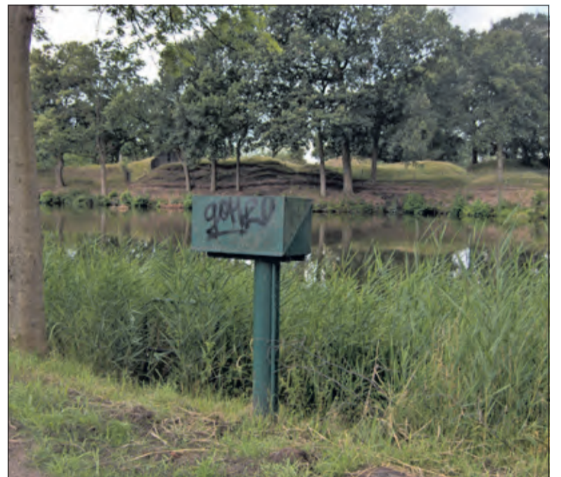
Foto 4: Een van de twee groene palen die meetapparatuur bevat om waterkwantiteit te bepalen.