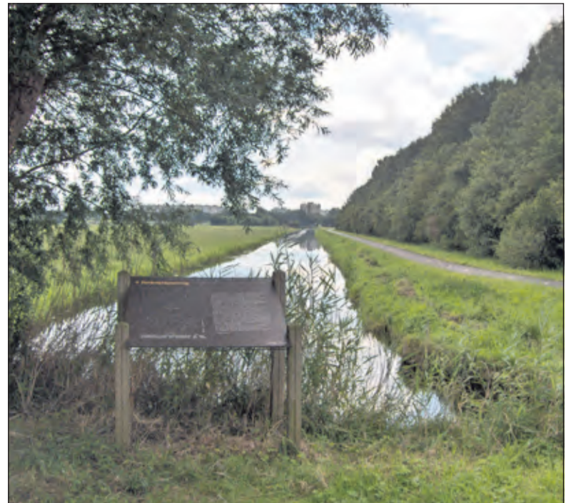
Foto 3: De brede watergang die de Ruigenhoeksedijk kruist en uitkomt bij gemaal Overvecht-Zuid.

Een volgend punt is een brede watergang die de Ruigenhoeksedijk kruist (foto 3) en uitkomt bij gemaal Overvecht-Zuid. Dit gemaal pompt overtollig water uit de polder Ruigenhoek naar Overvecht en uiteindelijk naar de Vecht. In de routefolder is een foto opgenomen van deze watergang met uitvoerig een informatiebord daarbij in beeld. Het bord vermeldt informatie over de gedeeltelijk herstelde tankversperring, die kort voor 1940 werd gebouwd. Terecht vraagt het Hoogheemraadschap op deze wijze aandacht voor die tankversperring. Het was het modernste verdedigingsmiddel van de Waterlinie. Dankzij al die sloten, weteringen etc. waar het