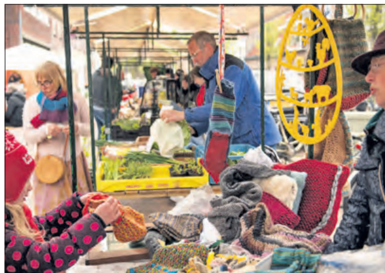
Op de Biltse streekmarkt tref je uitsluitend lokale producten aan.

Info over de Biltse Streekmarkt op de facebookpagina 'Dorpsmarkt De Bilt' en bezoek binnenkort de nieuwe website op: www.biltsestreekmarkt.nl . [WE]