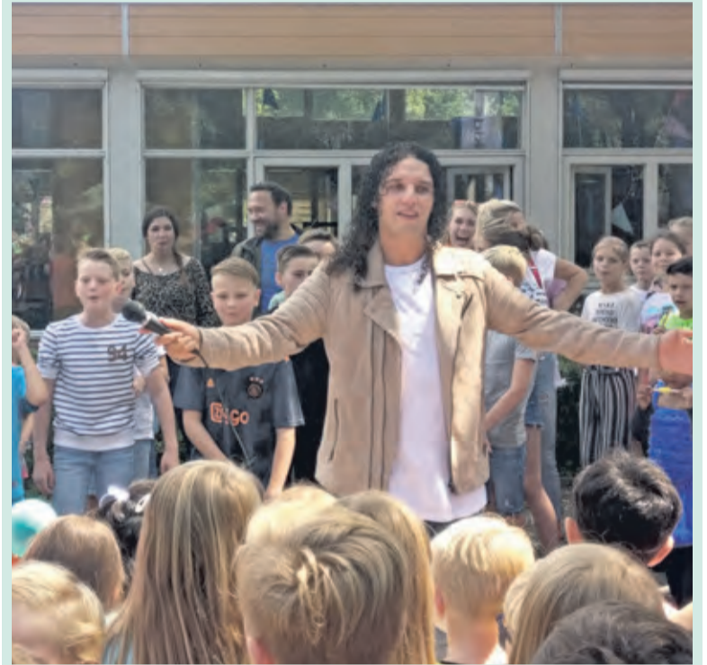
Ali B wordt door de MLK-leerlingen omringd op het schoolplein.

Tijdens de feestdag werden verschillende activiteiten voor de leerlingen georganiseerd. Zo werden er spellen gedaan en was er een groot luchtkussen waar zij heerlijk op konden spelen. Als extra verrassing kwam Ali B op bezoek. Veel leerlingen kennen Ali B door zijn rol als coach bij The Voice Kids en van het programma Jachtseizoen van StukTV. Over dit programma heeft Ali B met hen gesproken en ze kregen de gelegenheid om vragen te stellen. Als afsluiting heeft een aantal leerlingen uit groep 7 samen met Ali B het nummer 'Meli meli' gezongen.