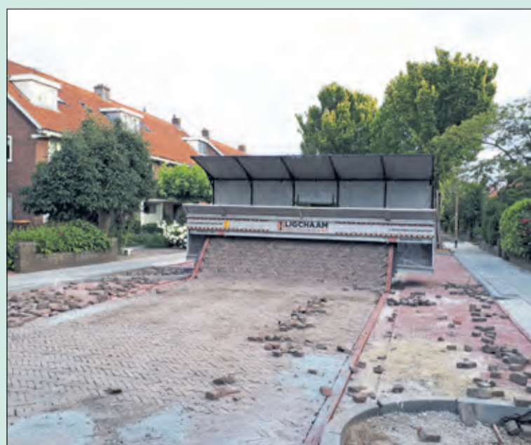
'Het lijkt wel alsof ze een stenen tapijt uitrollen bij de werkzaamheden van de stratenmakers op de Steenen Camer in De Bilt', aldus fotograaf Janny Smits.