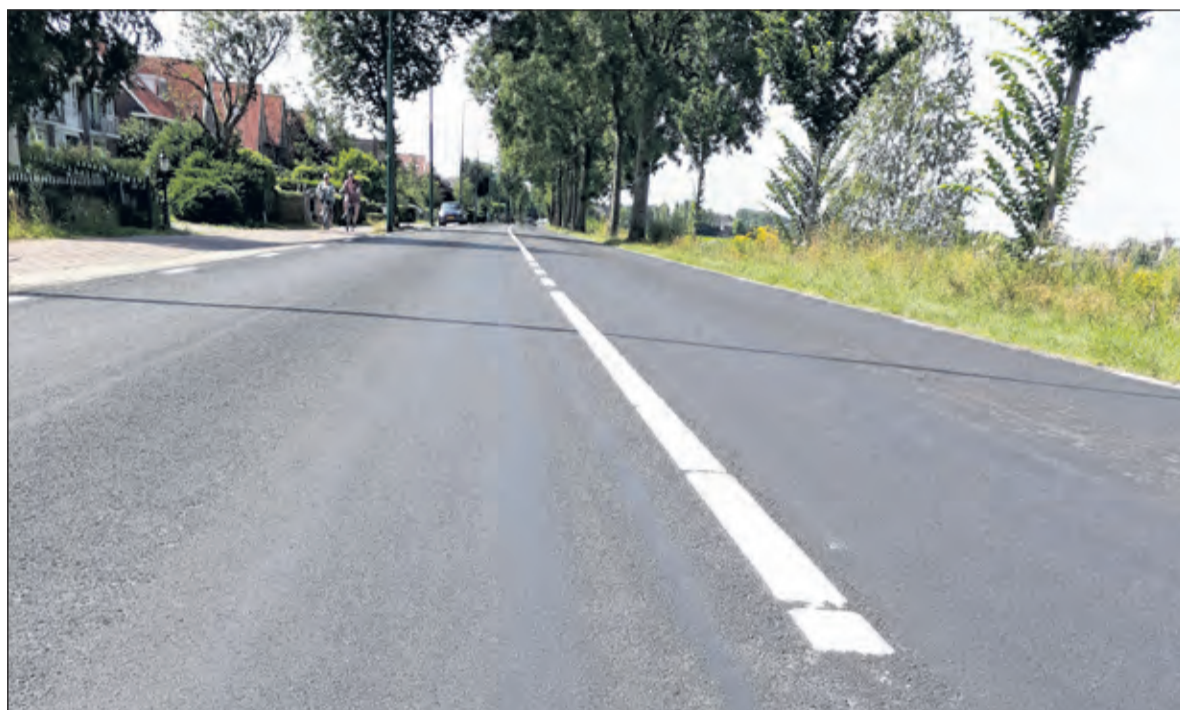
KW weg als 4e baan?

Er is inmiddels ook een werkgroep Koningin Wilhelminaweg, die samen met de gemeente De Bilt bekijkt welke maatregelen nodig en technisch mogelijk zijn om het sluipverkeer tegen te gaan. Misschien kunnen zich hier nu de Provincie en RWS bij aansluiten; immers het betreft hier (inter-)nationaal verkeer op een weg die (voor het deel buiten de bebouwde kom) en aangeduid is als erfontsluitingsweg.’