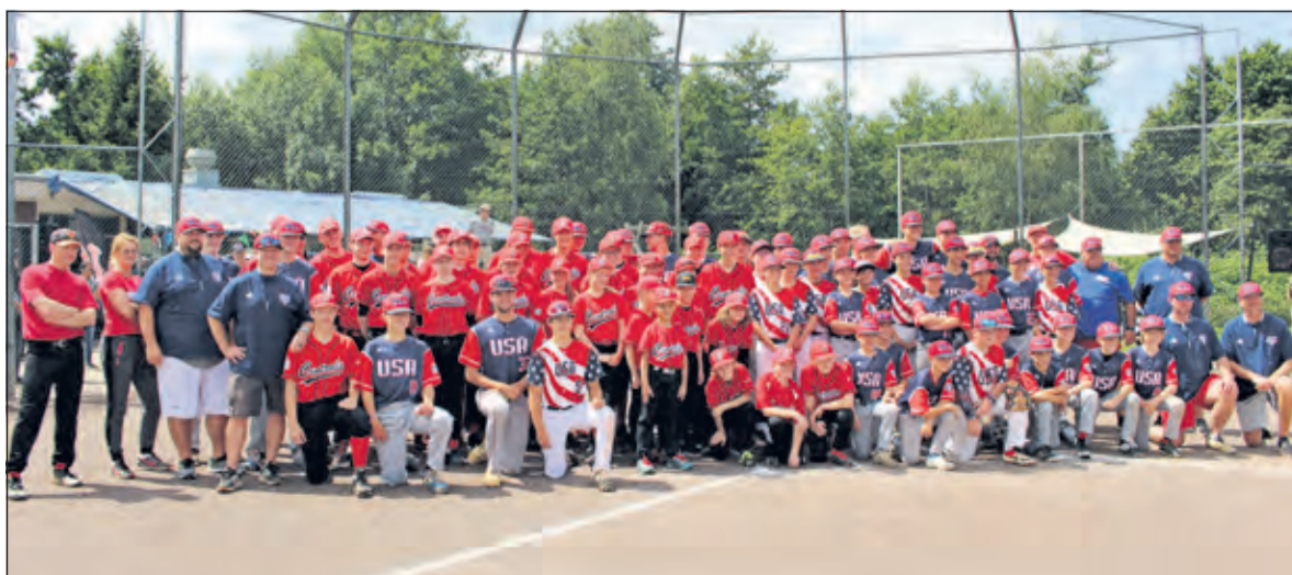
Spelers van Centrals en MVP verzameld op het veld.