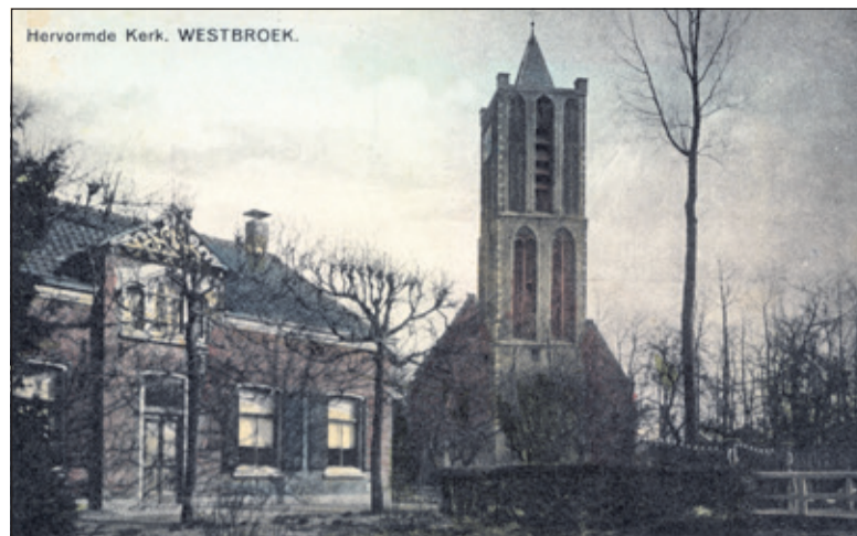
Kerkdijk 14 uit vroegere tijden.

Samenstelling van west 'westelijk gelegen' (gezien vanuit Utrecht en ten opzichte van Oostbroek onder De Bilt) en broek 'broekland, drassig grasland'. In 1840 heeft de gemeente Westbroek, die slechts het dorp omvatte, 93 huizen met 686 inwoners. Per 1-7-1957 is de ge-