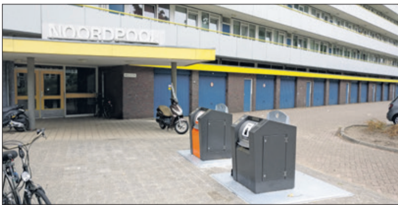
Een volle container gaat automatisch op slot. Restafval kan niet naar de gemeentewerf.