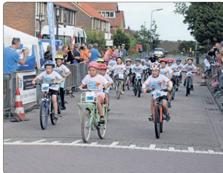
De kinderen deden hun best de tegenstanders af te troeven