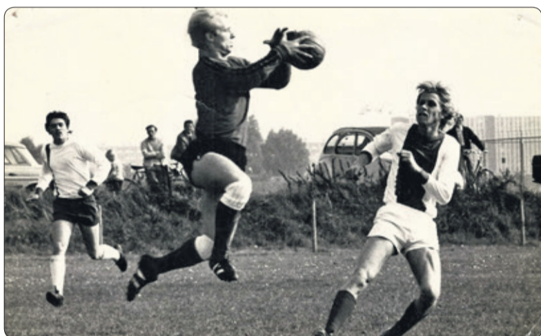
Een spelmoment van weleer: langs de Burgemeester Huydecoperweg wordt volop meegenoten.

En aantal leden - ook uit Westbroek - koos voor een andere club in Tienhoven of elders. We hadden nog slechts twee seniorteamen en één pupil-lenelftal. Dat was te weinig om te overleven, maar het ging mij enorm aan het hart om de kantine definitief te moeten sluiten. We mochten van de gemeente zeker niet direct de opstallen slopen, maar ik hoefde de restanten van ons veld aan de B.H.-weg ook niet meer te zien. Het heeft niet aan ons gelegen dat de uiteindelijke sanering 18 jaar nadien is uitgevoerd'.