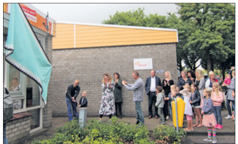
De jongste en oudste leerling onthullen het nieuwe logo.

open voor de plm. 80 leerlingen. Begonnen werd met de onthulling van een nieuw logo, waarna de ouders en leerlingen een kijkje konden nemen in de opgeknapte school: bijna alles was van een nieuw likje verf voorzien, wat een veel lichter beeld geeft. Om 10.15 uur kregen de kinderen een voorstelling van 'De Vuilmismannen'. Zij gaven een drumshow weg op vuilnisbakken, kliko's, emmers, vaten etc. Vervolgens kregen de leerlingen per klas zelf een workshop drummen (ge-