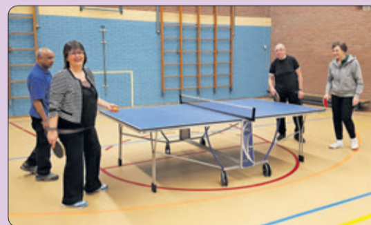
Bij Athlon '66 wordt er in gemoedelijke sfeer zonder competitiedruk gespeeld.

Athlon'66 is een kleine actieve vereniging voor 50-plussers. Zonder competitiedruk wordt er tafeltennis in een gemoedelijke sfeer. Er worden enkel- en dubbelwedstrijden gespeeld, er wordt wat onderling getraind of gewoon over en weer gespeeld. Doelstelling is sportief bewegen en sociale contacten opdoen. Man of vrouw, het maakt niet uit. Heb je altijd al gedacht om wat aan sport te doen, ga dan gewoon een keer kijken bij tafeltennisvereniging Athlon'66 en je zult zien dat je het virus zo te pakken hebt.