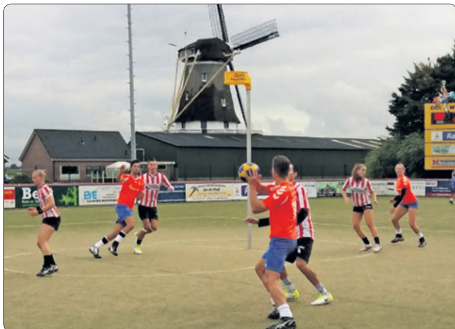
De DOS-velden liggen vlak bij de molen in Westbroek.

Kijk voor meer informatie en voor het aanmelden van de spelletjesmiddag op www.dos-westbroek.nl . Ben je verhinderd, maar wil je graag een keer kijken tijdens de trainingen of bij een wedstrijd, neem dan contact op via info@dos-westbroek.nl