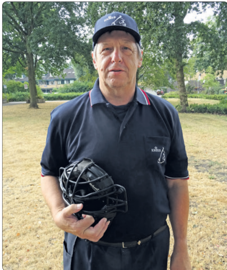
Tijdens wedstrijden dragen scheidsrechters onder hun kleding nog beenbeschermers, een toque en een borstbeschermer en natuurlijk het masker.