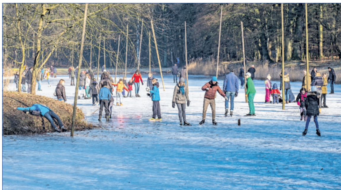
Pret op natuurijs is niet meer zo vanzelfsprekend.