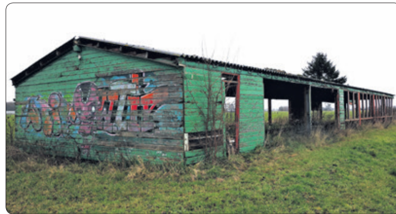
Het staketsel van planken vol graffiti.