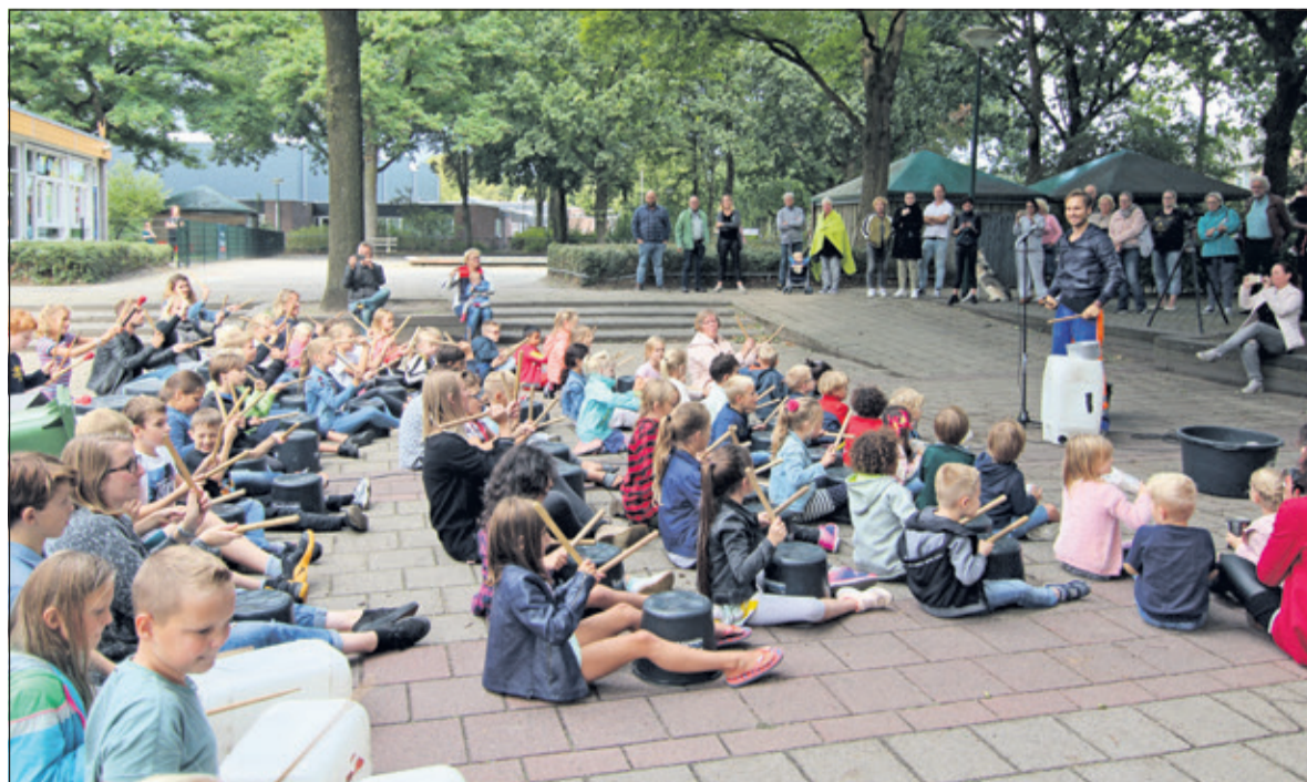
Trommelen op Rommel: tijdens de workshops werd een muziekstuk ingestudeerd, dat aan het einde van de dag door alle leerlingen werd uitgevoerd voor ouders, leerkrachten en andere genodigden.

belangstellenden om 15.00 uur op het schoolplein. Er was een filmbedrijf ingehuurd om dit alles vast te leggen, o.a. met een drone.