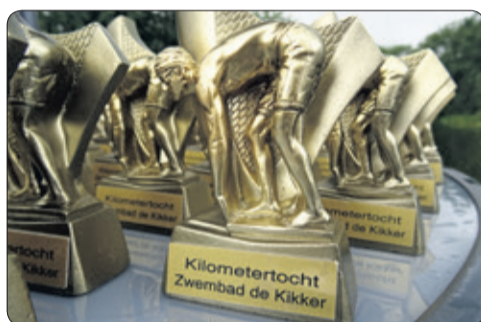
Deze mooie trofee kregen alle deelnemers direct na afloop van de prestatietocht.

Het zwemseizoen in De Kikker zit er bijna weer op. Zondag 9 september is de laatste zwemdag van dit seizoen en gaat het bad dicht tot mei 2019.