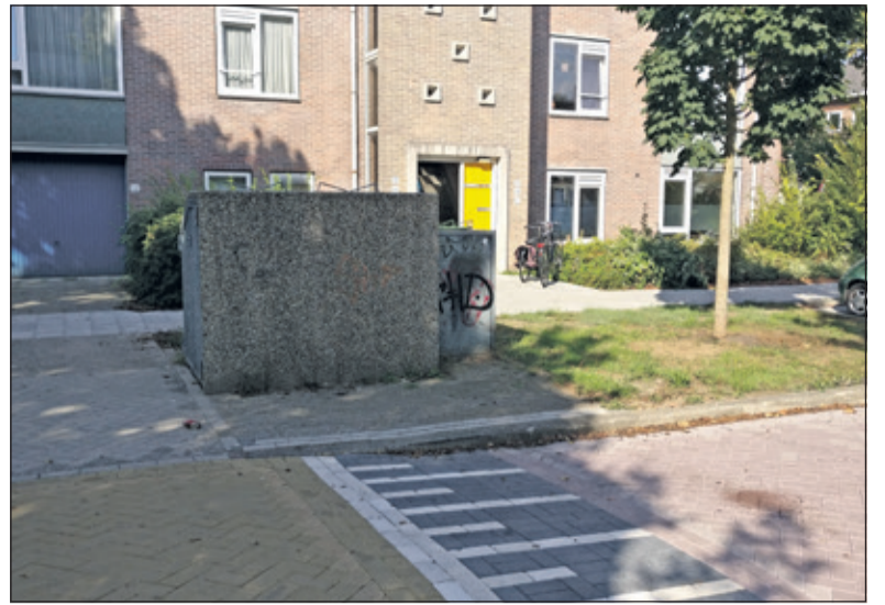
De bovengrondse container aan de Saturnuslaan kan niet vervangen worden door een ondergronds exemplaar.

150 meter van de woning staan. Die locaties zijn in het voortraject ook aan de orde geweest tijdens inspraakavonden, op basis waarvan nog enkele aanpassingen zijn gemaakt. Dat neemt niet weg dat voor sommige inwoners de loopafstand groter is en dat dit als nadelig kan worden ervaren. Uiteindelijk blijft het doel de hoeveelheid restafval ten behoeve van het milieu terug te dringen en de kosten voor afvalinzameling verder te beperken'. Wethouder Anne Brommersma: 'We zagen in de eerste drie maanden van het jaar al een daling van 30% in de hoeveelheid aangeboden restafval na de wijziging in scheiding via de kliko's. De verwachting is, dat deze daling zich dit jaar zal doorzetten dankzij de plaatsing van de ondergrondse verzamelcontainers. Met de hulp van inwoners streven we ernaar om de hoeveelheid restafval uiteindelijk te halveren. Zo werken we samen aan een duurzame gemeente en een schoner milieu'.