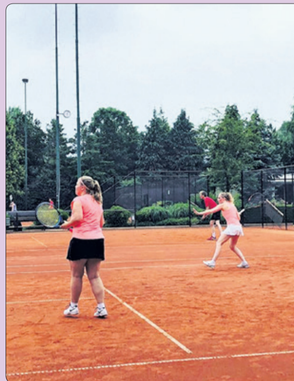
Op de in 2016 nieuw aangelegde en verlichte banen kan tot 's avonds laat gespeeld worden.

Op de hoek van de kruising Groenekaneweg en de Biltse Rading ligt het fraai aangelegde tennispark van L.T.V. Meijenhagen. Het park telt zes prestigieuze gravelbanen, die omringd worden door prachtige bomen en struiken.