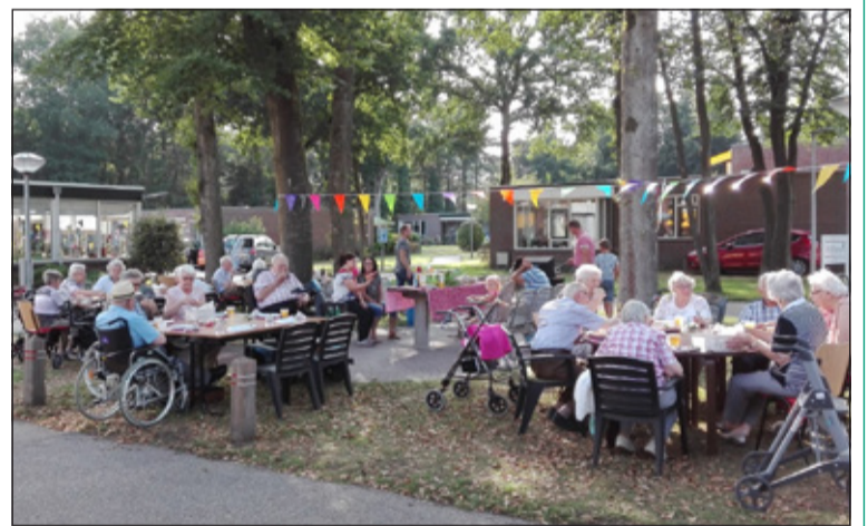
De ouderen van het woon-zorgcentrum d'Amandelboom genieten van een heerlijke barbecue. Na een lange hete zomer was het 22 augustus een prachtige dag voor een buitenactiviteit. (Tina Bolks)