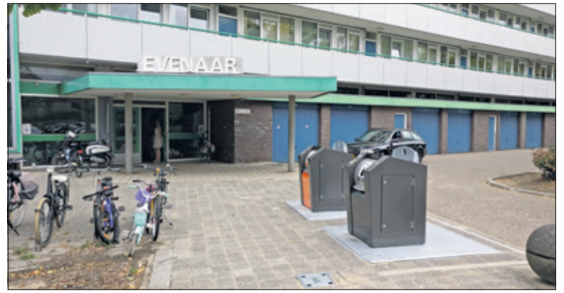
Met de milieupas zijn alle containers in de gemeente te openen.