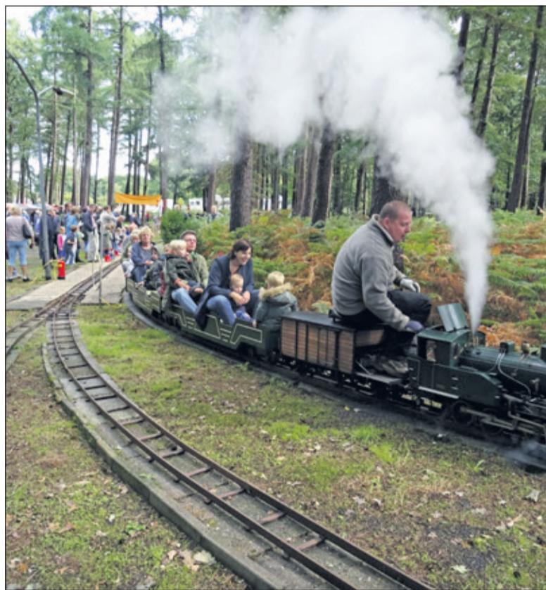
Alle ritten die werden gemaakt over het terrein door kinderen en hun begeleiders waren uitverkocht.

Er werd volop gesleuteld en onderhoud gepleegd aan de stoomlocomotieven op het 'rangeerterrein' om de locomotieven gaande en in conditie te houden. Niet alleen door de leden van Rading Spoor maar ook door gasten uit heel het land die met hun machines naar Hollandsche Rading gekomen waren. Elke woensdag komen de leden van Rading Spoor bij elkaar in het onderkomen op het terrein om onder andere aan hun modellen te werken, hierover te overleggen en onderhoud aan het terrein te plegen. Voor nadere info over Rading Spoor zie www.radingspoor.nl