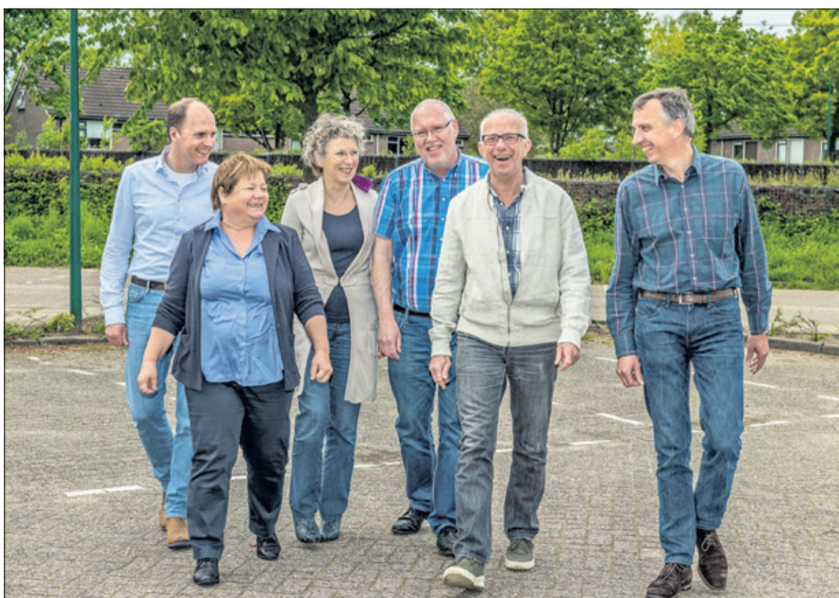
Het bestuur van BENG! in 2018.