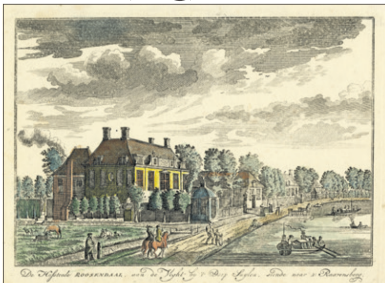
Afgebeeld is het huis Roosendaal aan de Vecht in Achttienhoven in 1718 (beeldbank Utrechts Archief; eigendom museum Flehite). Het lag ter hoogte van Vechtdijk 150 in Utrecht. Nu is deze plek onderdeel van Overvecht, het gebied dat in 1954 van de gemeente Maartensdijk naar Utrecht overging.

Op www.onlinemuseumdebilt.nl namen we alvast een kijkje; in de woonkern Westbroek treft men 'Ooit Achttienhoven: de buitenplaats Roosendaal'. In dit artikel vindt de geschiedenis van het huis Roosendaal aan de Vecht in Achttienhoven. De plaats waar Roosendaal stond, maakt nu deel uit van het Vechtzoompark. De naam Roosendaal komt al in 1541 voor in verband met een boerderij aan de Vecht, ter hoogte van de Klopdijs. Tussen 1823 en 1832 werd het huis afgebroken Van de oude buitenplaats bestaat nu nog alleen de theekoepel en het indrukwekkende toegangshek uit 1705, met borstbeelden.