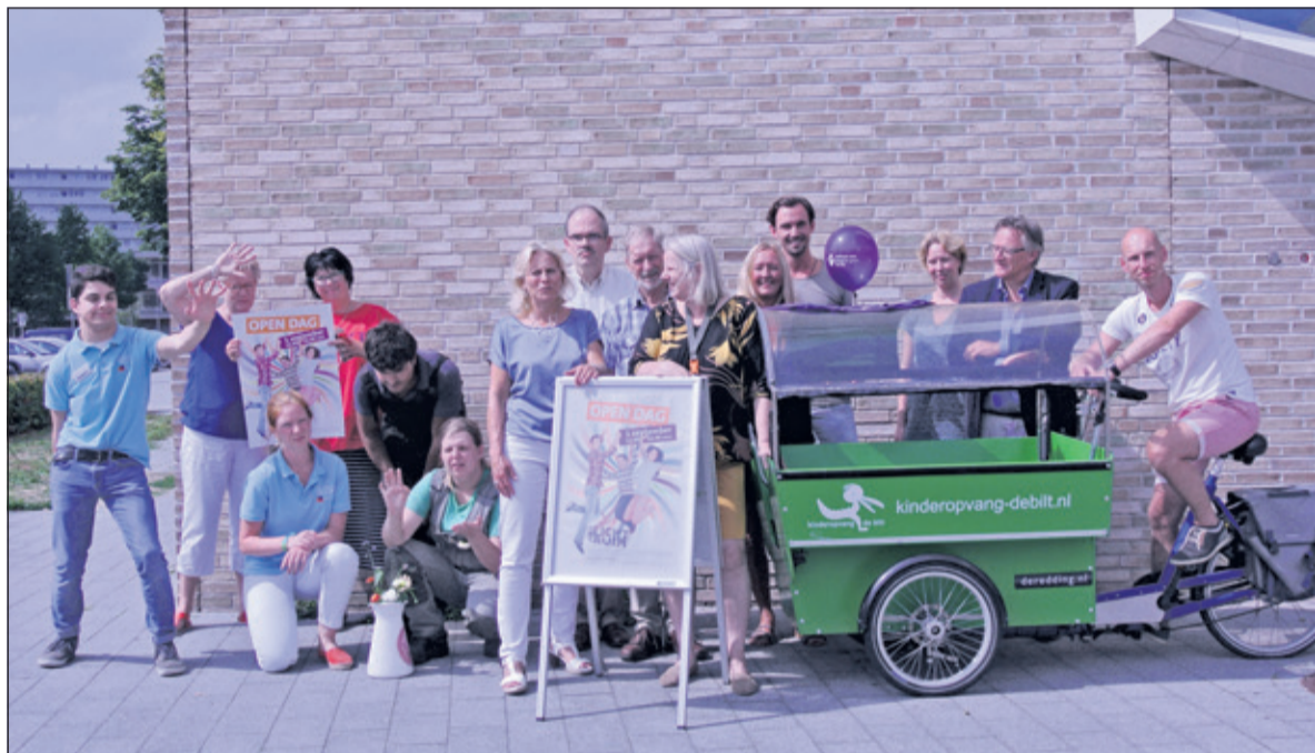
Vertegenwoordigers van o.a. Kinderopvang De Bilt, Basisschool Wereldwijs, Idea Bibliotheek en het KunstenHuis als ook huurders van de woningen staan te popelen om bezoekers wegwijs te maken bij, in en om Het Lichtruim.

Zaterdag 1 september gaat het nieuwe seizoen weer beginnen. Tussen 12.00 en 16.00 uur worden belangstellenden ontvangen in Het Lichtruim waar van alles te doen is. Aan de medewerkers zal het niet liggen. Zij staan al te popelen om iedere bezoeker wegwijs te maken bij onder andere Kinderopvang De Bilt, Basisschool Wereldwijs, Idea Bibliotheek of het KunstenHuis.