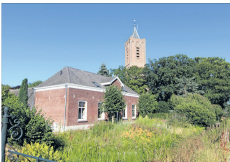
Kerkdijk 14 anno juli 2018.

14 in Westbroek. Het is één van een aantal rijksmonumenten van Westbroek, dat een beschermd dorpsgezicht heeft met daarin een aantal bijzondere boerderijen. De boerderij op Kerkdijk 14 is daar een voorbeeld van. In Maartensdijk, Geschiedenis en Architectuur (Kruidenier en van der Spek) lezen wij: 'Vermoedelijk was deze plek in de Middeleeuwen al bebouwd. Ook op de ontveningskaart van 1770 is op deze plek een langhuisboerderij te zien. Het dwarshuis is in 1872 vóór de bestaande, oudere stal gebouwd. Gelet op de telmerken in de kapconstructie dateert het achterhuis waarschijnlijk uit de 18de eeuw'.