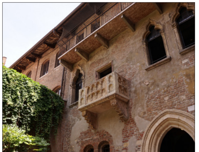
Wie kent de balkonscène niet.

Voor lezers van De Vierklank is een aantal kaarten beschikbaar. Stuur een mail naar: info@vierklank.nl met in het onderwerp 'operaplezier' om hiervoor in aanmerking te komen. De kaarten worden verloot onder de inzenders. U ontvangt tijdig bericht.