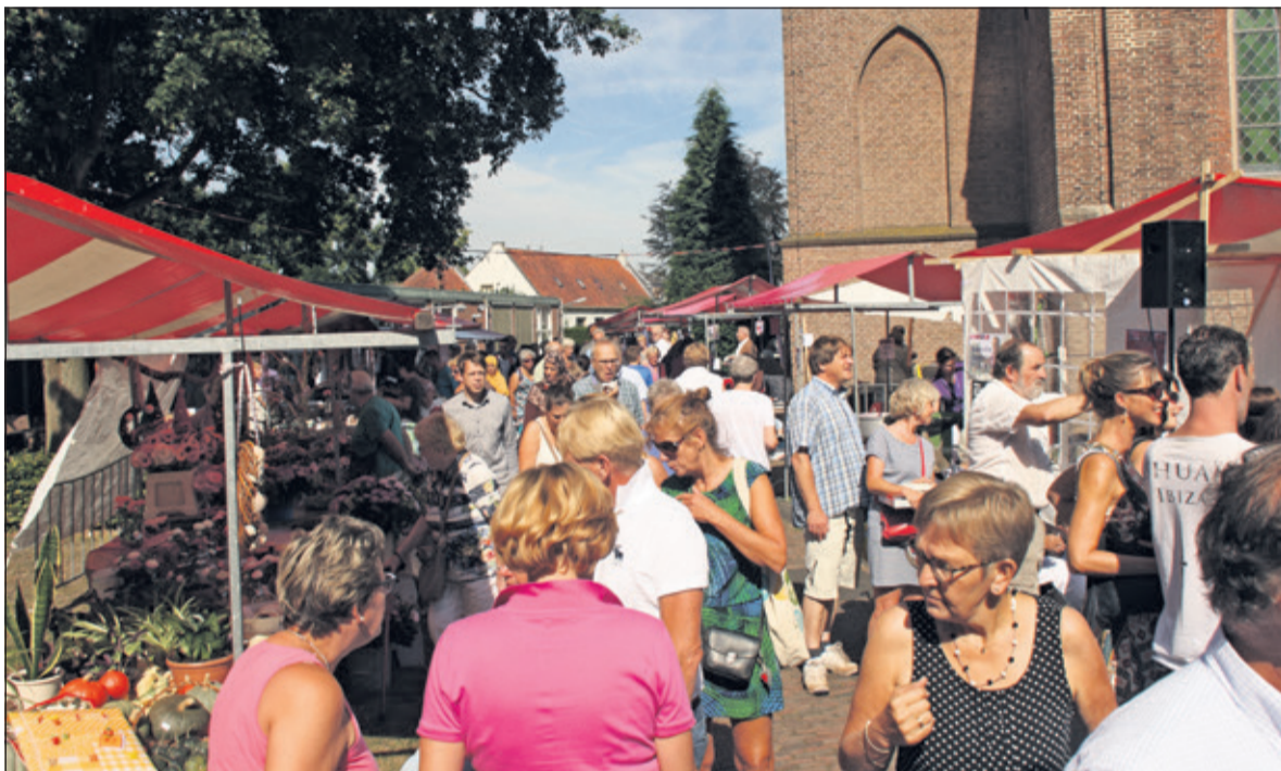
Ook in 2016 was er grote belangstelling voor de Marktdag.

Meer informatie op www.marktdagdebilt.nl