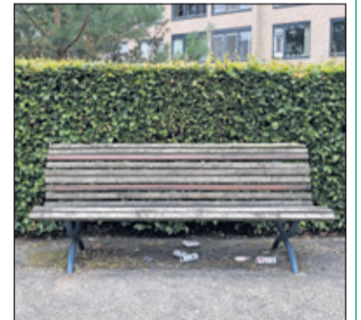
Zwerfafval in het parkje aan de Jan Provostlaan in Bilthoven is de bewoners een doorn in het oog.

'Vuilnisbakken in parkjes en speeltuinen moe(s)ten echter het veld ruimen, zodat nu meer zwerfvuil op straat blijft liggen', is een veel gehoorde opmerking.