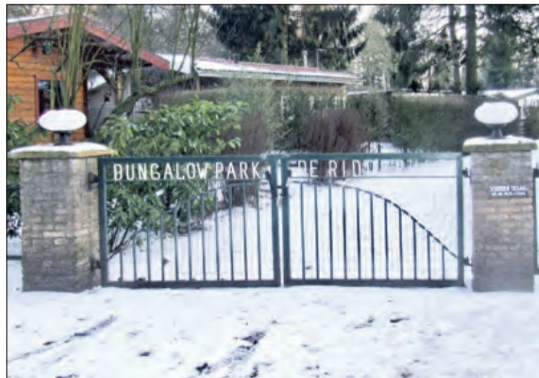
De ingang van De Ridderhof op 8 februari 2012.