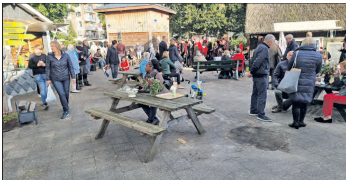
Gezellige drukte op de eerste streekmarkt na corona.

middag met diverse producten van onze boerderij, maar binnen twee uur was alles al uitverkocht. Gelukkig komt Rutger straks nog meer brengen, het loopt namelijk storm'.