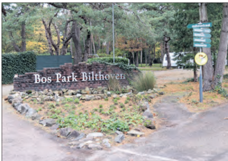
De ingang van Bos Park Bilthoven.

'Dit betekent dat de gemeente voornemens was om via een herziening het aantal toegestane verblijfsrecreatieve voorzieningen te corrigeren. Bos Park Bilthoven heeft het beroep toen ingetrokken. 'In 2014 zeggen we dus al dat er een verkeerde basis aan het bestemmingsplan ten grondslag heeft gelegen. Nu is het moment om dit te herzien. We gaan nu in ons voorstel niet terug naar de oorspronkelijke 450, maar naar 396 waarbij we bereid zijn om een differentiatie in de oppervlakte te maken en een kleine verhoging van de maximale oppervlakte toe te staan. Het aantal parkeerplaatsen bij Stal Den Eijk was eerst 30. De exploitant wilde graag 60 parkeerplaatsen hebben. Daarover is overleg geweest tussen de provincie en de gemeente die daar beide mee akkoord gaan. Vragen over handhaving horen bij de burgemeester en die kan de wethouder niet beantwoorden. Er worden moties en amendementen in de raad aangekondigd en de wethouder wacht die af.'