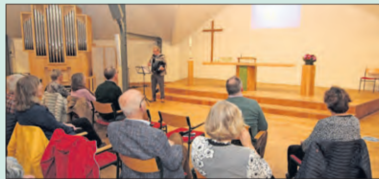
De lezing mondde uit in het gezamenlijk zingen van enkele gospels, die de inleider met zijn accordeon begeleidde.