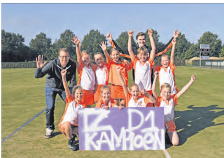
De spelers van Tweemaal Zes D1 zijn zaterdag 2 oktober kampioen geworden door met 9-4 hun wedstrijd te winnen. Het kampioenschap werd goed gevierd.