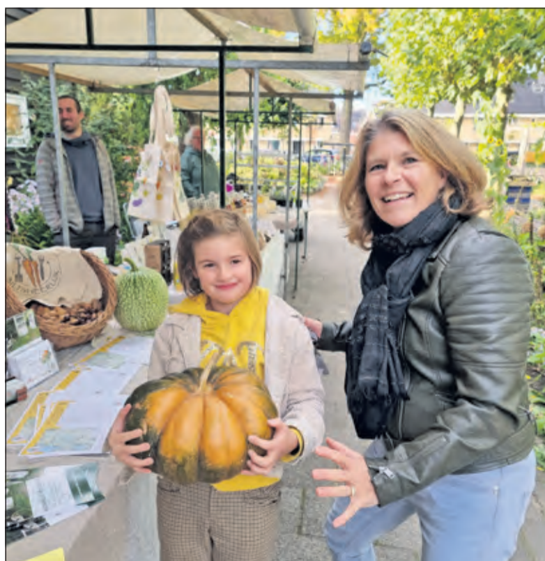
Iedereen mocht het gewicht raden van deze pompoen. Uiteindelijk bleek deze 7,25 kilo te wegen.

Naast de vele kraampjes, konden bezoekers genieten van de swingende muziek van Kebbek. Ronhaar: 'De markt is vooral een plek van ontmoeting en verbinding. Heel waardevol na het coronajaar. En muziek brengt ook verbinding tussen mensen. Wij hebben trouwens ook nog een prijs in het verschieft voor de bezoeker die het gewicht raadt van de pompoen, bij de ingang van de markt. De pompoen weegt 7,25 kilo. Eén persoon zat er het dichtstbij met 7,4 kilo en ontvangt een Biltsheerlijk-tas met walnoten.