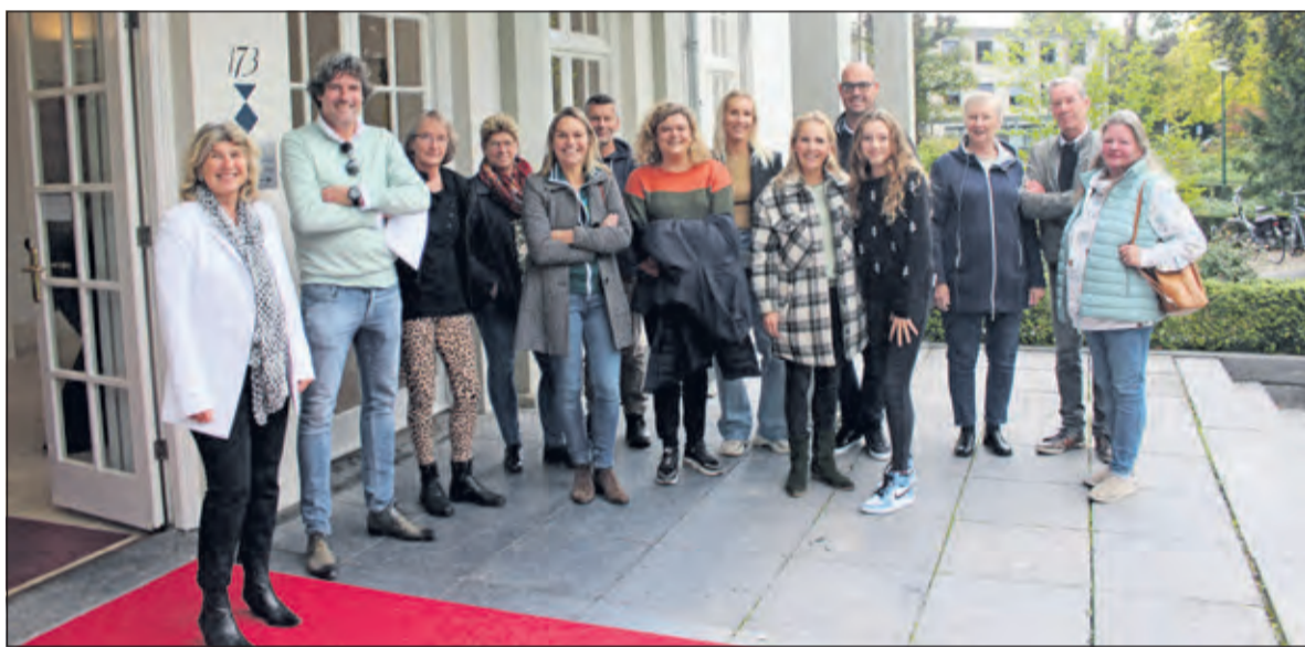
Groenekan is ongerust over de ontwikkelingen in het Noorderpark en biedt petitie aan.

Woensdag 13 oktober zou er volgens de dames om 20.00 uur een hoorzitting plaatsvinden tussen de gemeente De Bilt en hun advocaat naar aanleiding van het bezwaarschrift tegen de bouw van een golfclubhuis in park