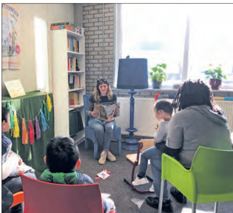
Opening van het KinderzwerfboekStation met het voorlezen van Woeste Willem .

In De Bilt is er op woensdag 6 oktober een KinderzwerfboekStation geopend op het Servicecentrum van Mens De Bilt aan de Molenkamp 60 in de Bilt. Deze middag is gestart met het voorlezen van het boek 'Woeste Willem'. Daarna hebben de kinderen de Zwerfboekenkast geopend en een boek uitgekozen om mee naar huis te nemen. Iedereen is nu welkom om bij het Servicecentrum binnen te lopen en een kinderboek uit de Zwerfboekenkast te kiezen.