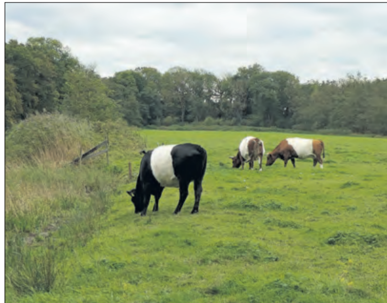
Lakenvelders op Oostbroek, runderen met cultuurhistorische waarde.

De lakenvelder is een zogenaamd tweedoelenras (melk- en vleesproductie). Nog net op tijd werd de cultuurhistorische waarde van