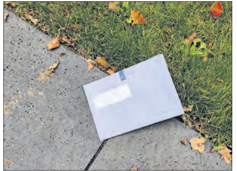
65% zegt minder tegels in de tuin te hebben en iets meer dan een derde van de inwoners vindt dat bij te nemen maatregelen de belasting extra mag stijgen.

Driekwart van de geënquêteerde inwoners vindt dat de gemeente zich meer tegen de negatieve gevolgen van klimaatverandering moet inzetten, met name voor het voorkomen van de negatieve gevolgen van droogte en van wateroverlast.