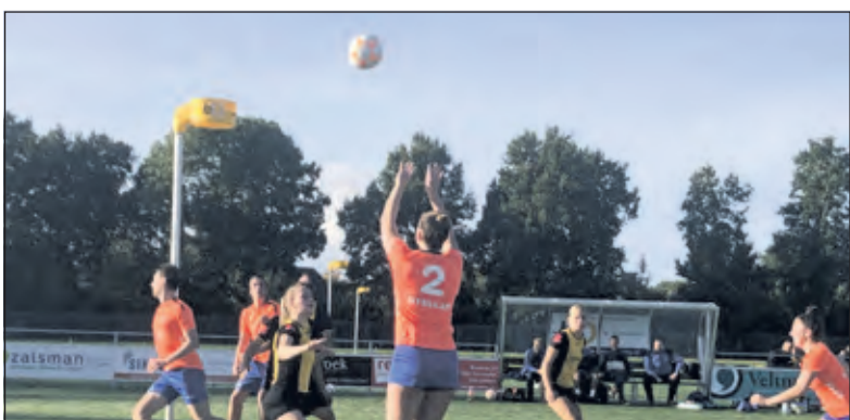
DOS W scoort tegen DOS K.

TZ Door een gelijkspel van TZ uit Maartensdijk tegen KVA, voert Dos Westbroek nu de ranglijst aan met 2 punten voorsprong op het team uit Maartensdijk. De a.s. zaterdag 23 oktober te spelen wedstrijd Dos W - TZ Maartensdijk (15.30u) is de laatste veldwedstrijd van de eerste seizoenshelft.