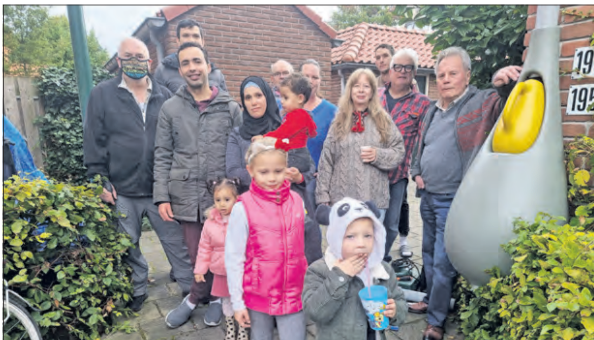
De tuintjes worden besproeid met water uit de regenton.

Het ‘Servicepunt Groen aan de Buurt’ helpt bewoners om hun buurt groener te maken. Zij helpt met praktische zaken zoals het vinden van geld of bij het maken van een uitvoeringsplan. Ook deelt zij kennis, tips en ervaringen, die zij al heeft opgedaan in pilotprojecten. Volgens de site van Groen aan de Buurt begint elk project met een goed idee. Daarna volgen nog vele stappen om tot een succesvolle uitvoering te komen. Deze stappen (Idee, Draagvlak, Plan, Geld, Uitvoering en Beheer) zijn te vinden op de website van Groen aan de Buurt: www.groenaandebuurt.nl