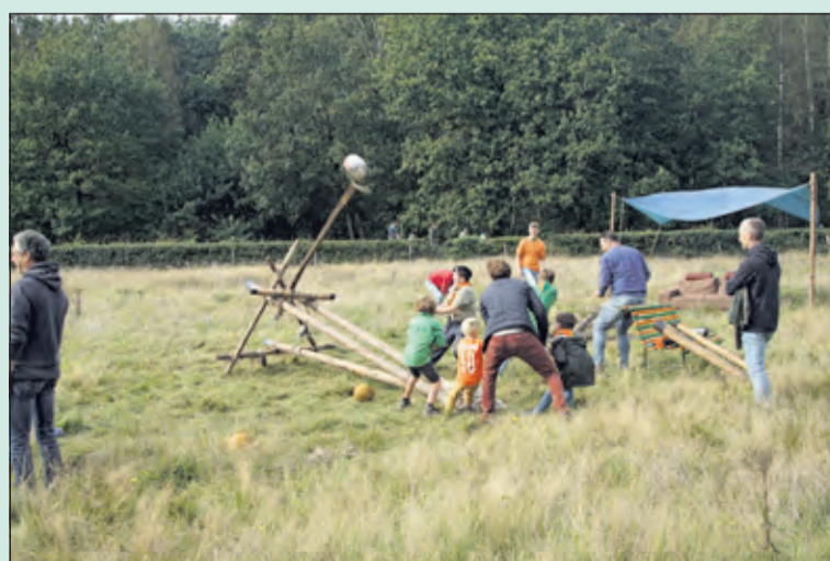
Bij Scouting Laurentiusgroep wordt er iedere zaterdagmiddag van alles georganiseerd.

Scouting Laurentiusgroep organiseert elke zaterdagmiddag vanaf 14.00 uur activiteiten voor jongens en meisjes vanaf 7 jaar. Kijk op www.laurentiusgroep.nl voor meer informatie.