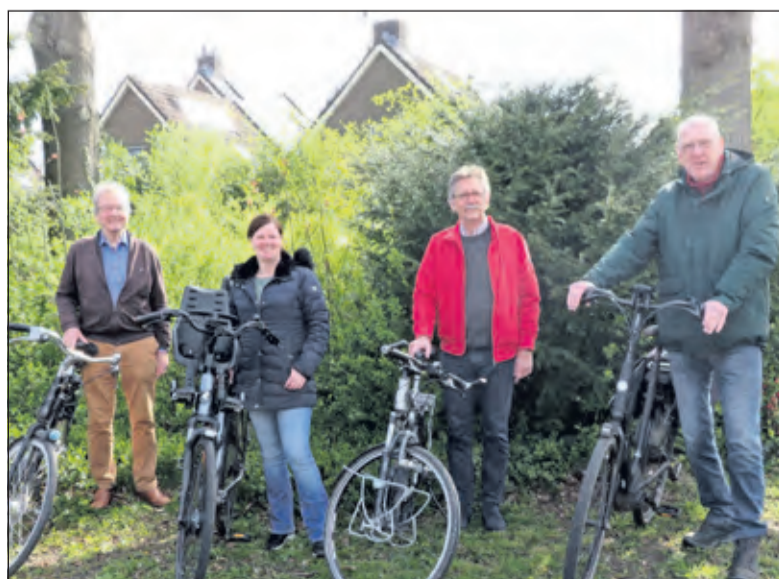
Enkele leden van de Wijkraad De Leijen.

loopt. De wijkraad is voorstander van meer delegatie van taken van de gemeente naar de Wijkraad op basis van een investeringsfonds.