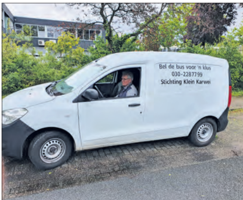
De klussenbus klaar voor een karwei.

Als u een klus heeft, kunt u het meldpunt bellen op werkdagen tussen 9.30 en 12.30 uur, op het telefoonnummer 030-2287799, u kunt ook bellen naar het meldpunt in Maartensdijk op nummer 0346-214161. Het meldpunt geeft uw aanvraag door aan de coördinator van de Klussenbus. Hij belt zo spoedig mogelijk om een afspraak te maken op een dinsdag of een donderdag. Een vrijwilliger komt dan langs om de klus te klaren.