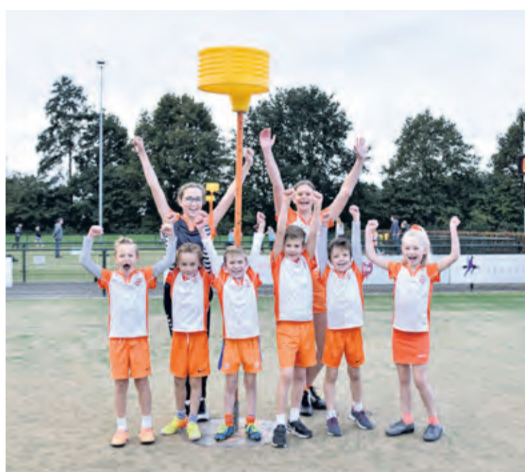
De C1 en F1 van Tweemaal Zes uit Maartensdijk zijn afgelopen zaterdag kampioen geworden. Met mooie overwinningen haalden ze het kampioenschap binnen. (Sterre Thijs)