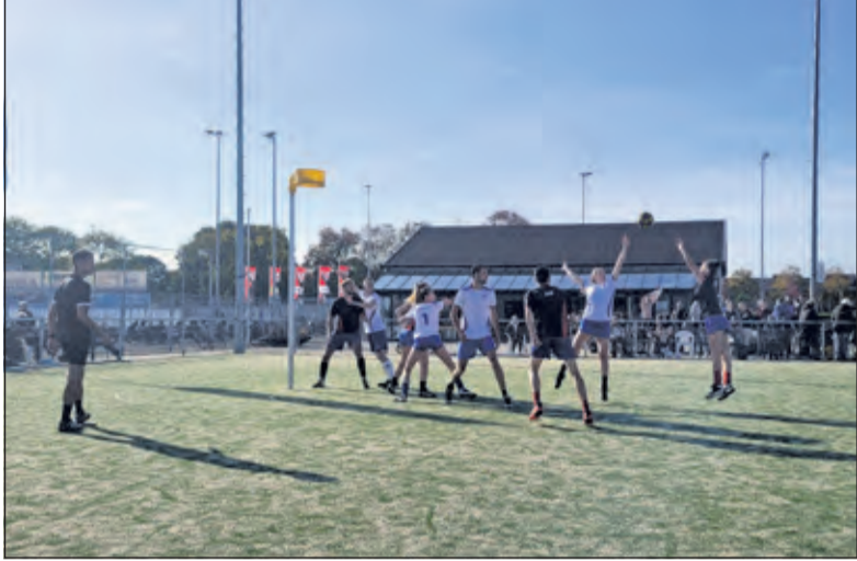
Een spelmoment uit DVS – Nova.

De spelers van Nova kwamen vol energie uit de kleedkamer in een poging het tij te keren. De doelpunten van DVS bleven even uit, dus was dit het moment waarin Nova aan een inhaalrace zou kunnen beginnen. De aanvallen van Nova werden langer en dynamischer, alleen bleef de score uit. Er kwamen goede kansen uit, maar het afrondingspercentage bleef achter. Hierdoor kon Nova het verschil in score niet wegwerken. Ondertussen wist DVS de korf weer te vinden waardoor zij geen moment in gevaar kwamen. De scheidsrechter floot de wedstrijd af met een eindstand van 20-10. (Job Paauw)