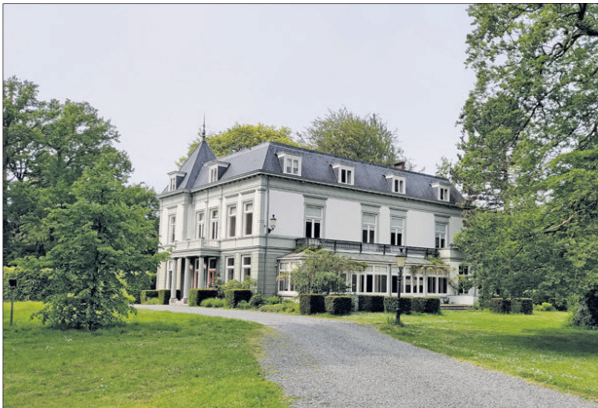
Huize Voordaan wordt wellicht opvanglocatie voor 50 minderjarige asielzoekers.