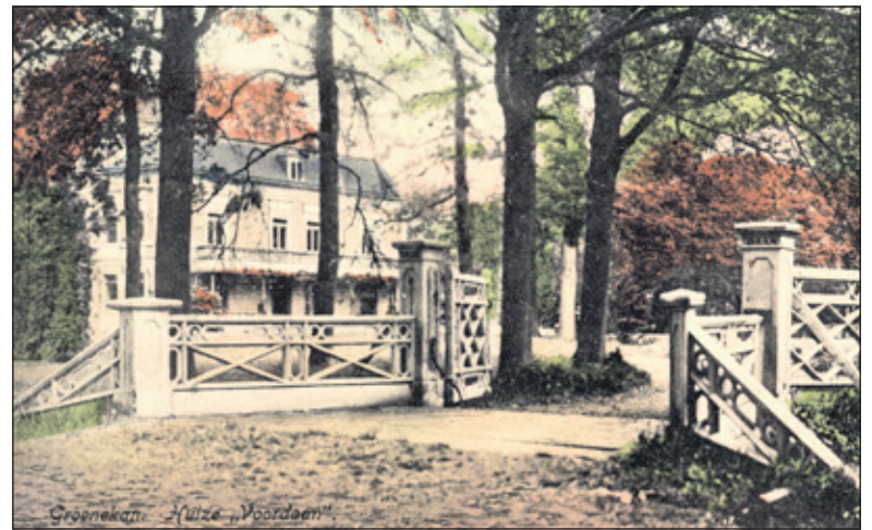
Huize Voordaan in 1926.