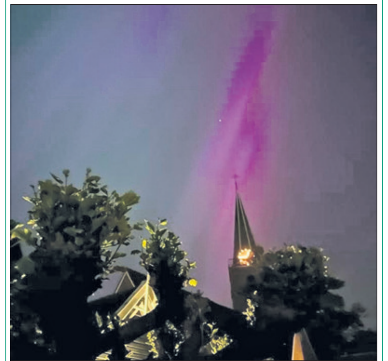
Afgelopen vrijdagavond was het Noorderlicht goed zichtbaar op de Dorpsweg in Maartensdijk.