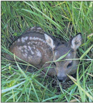
Reekalfje ligt verscholen in het hoge gras.

Een van de vele kwetsbare soorten in dit jaargetijde is de ree. Dit elegante hoefdier is hét icoon van Utrechts Landschap en de lieveling van velen die op de Utrechtse Heuvelrug wonen. Het gaat weliswaar goed met de reeën in ons land, maar het gebeurt toch nog steeds dat ze opgejaagd worden, stress ervaren, in een hek vast komen te zitten of op de weg een aanvaring hebben met een auto. Volwassen dieren kunnen nog vluchten, maar voor de net geboren reekalfjes is dat helaas een ander verhaal.