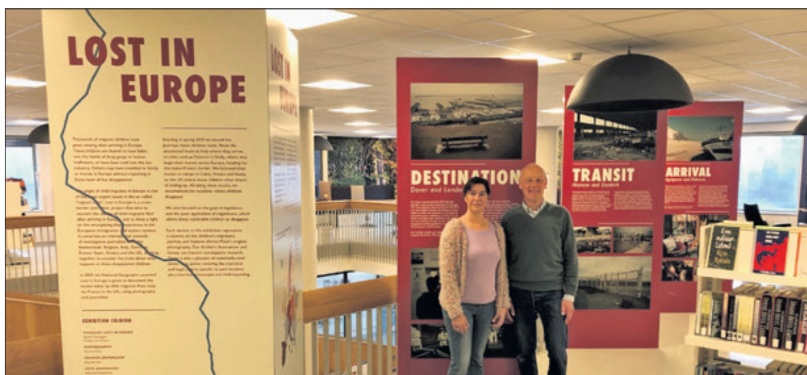
Hoe vluchtelingkinderen verdwijnen wordt duidelijk in de tentoonstelling.

van Geesje van Haren. Elk onderdeel van de expositie vertelt het verhaal van een land binnen een vaste structuur, waardoor de bezoekers een dieper inzicht krijgen in de complexiteit van het probleem. De expositie is tot 10 juni te bezoeken tijdens de openingstijden van de bibliotheek in Het Lichtruim, Planetenplein 2 in Bilthoven op maandag van 13.00 tot 17.30 uur en de overige weekdays van 08.30 tot 17.30 uur. (Rob Muntendam)