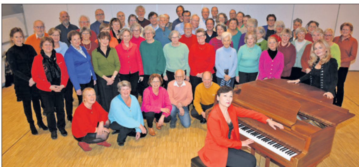
AZM en Kamerkoor De Bilt verzorgen een voorjaarsconcert.