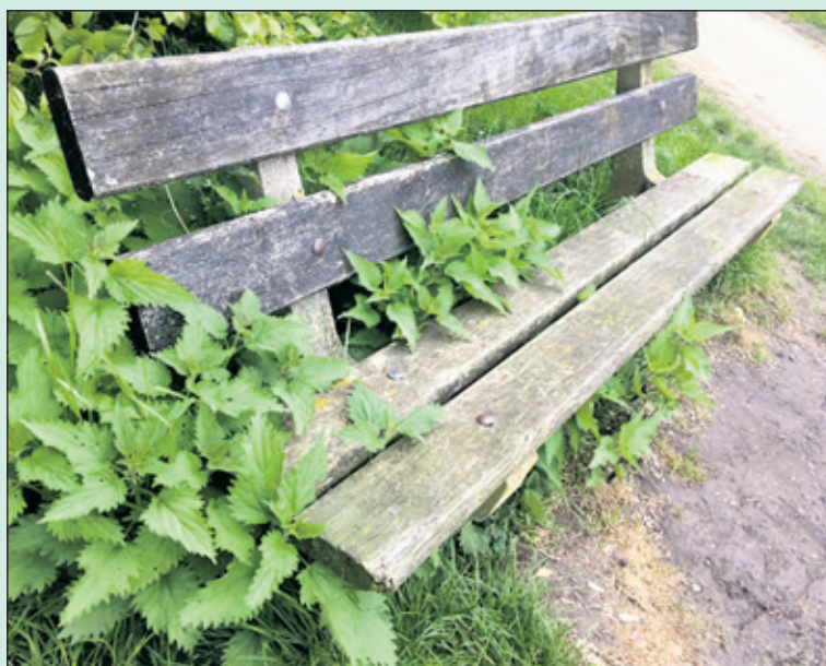
Wie z'n billen brandt... moet op de blaren zitten.