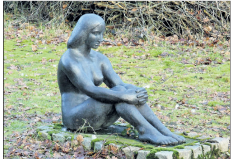
Sinds 1960 zit in de tuin van Huize Voordaan aan de Groenekanseweg het beeld Meisje van Charles Weddepohl.