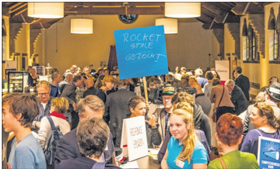
Impressie van eerdere beursvloer van Samen voor De Bilt.

Voor mensen die willen deelnemen aan de Biltse Beursvloer geldt: Hoe concreter hoe beter. 'Met een zo concreet en beknopt mogelijke omschrijving van zowel je vraag als aanbod vergroot je de kans op een succesvolle match enorm', aldus Samen voor De Bilt. Aanmelden is nog mogelijk tot 22 mei. Iedereen die verbonden is aan een bedrijf, stichting of vereniging en een vraag en/of aanbod heeft kan zich aanmelden via www.samenvoordebilt.nl . En heb je nog vragen, bel met Judith van Samen voor De Bilt: 06 - 11 56 49 57. Volgende week besteden we uitgebreid aandacht aan Beursvloerdeelnemers in een special.