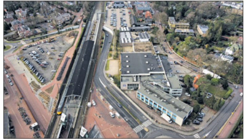
Het project Rembrandtkwartier wordt ontwikkeld naast het NS-station aan de Rembrandtlaan en Jan Steenlaan in Bilthoven tot plm. het | P + R-terrein.

De grondeigenaren zijn van mening, dat de gemeente op de stoel van de ontwikkelaar plaatsneemt door zelf ideeën en financiële modellen te ontwikkelen en daarbij