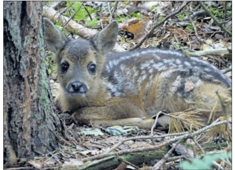
Door de schutkleuren worden reekalfjes een met de natuur.

Jacqueline van Dam, Boswachter Utrechts Landschap