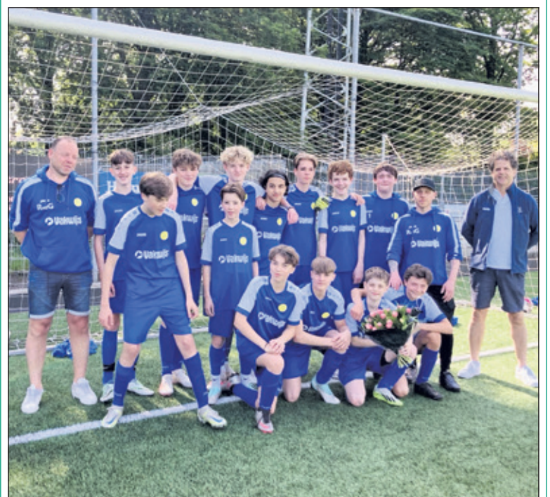
SVM Jo 15 loopt er de komende seizoenen weer tip top bij in de door Vakwijs gesponsorde nieuwe kleding! Het team beloofde de sponsor met een gelijkspel tegen Vv Maarssen.