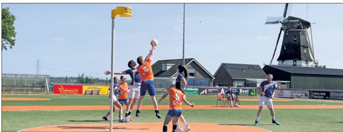
DOS weet de winst niet binnen te slepen.

Op 25 mei is er voor DOS Westbroek kans om deze nederlaag weer recht te zetten in de uitwedstrijd tegen Dindoa. (Fred van Ettikhoven)