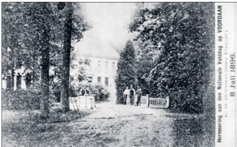
Herinnering aan een Velddag.

In de jaren 60, 70 en 80 bood Jeugdhuis Voordaan opvang aan kinderen en jongeren met een verstandelijke beperking. In 1982 werd het 'debieleninternaat' omgedoopt tot 'orthopedagogisch project leef-eenheden - begeleidingsvormen voor jongeren met beperkte ontwikkelingsmogelijkheden'. Eind jaren '80 werd Jeugdhuis Voordaan gesloten. De opvang van kinderen in grote afgelegen tehuizen strookte niet meer met de nieuwe opvatting over goede jeugdzorg. Daarna heeft het pand jarenlang leeg gestaan. In 2001 heeft EMC zich in Huize Voordaan gevestigd en is het pand in zijn oude glorie hersteld. De Learning Collective was de laatste huurder van het pand.