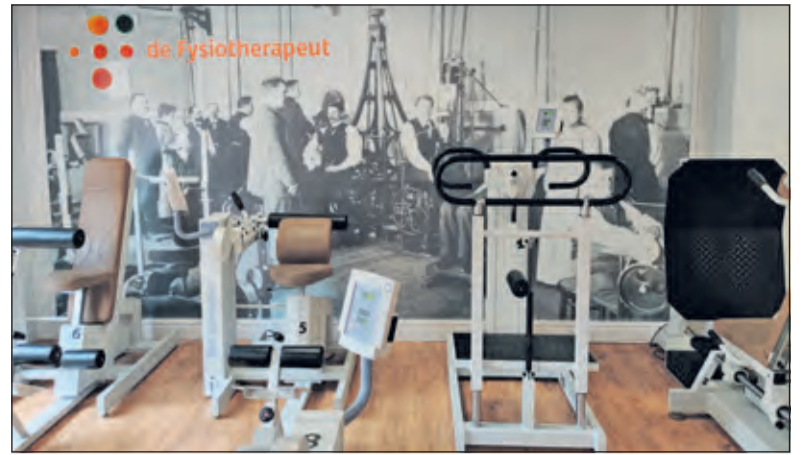
De beweging kan er weer ingebracht worden.

Tot dan waren fysiotherapeuten vaak vooral en alleen aangewezen op video- en telefoongesprekken. Ze mochten patiënten alleen in de praktijk ontvangen als dat echt niet anders kon. Bij een behandeling moesten ze anderhalve meter afstand houden. Aanraken was dus ook geen mogelijkheid, tot onvrede van veel fysiotherapeuten in Nederland. Op de grens van april en mei kwam er dus die nieuwe richtlijn over het gepast gebruik van persoonlijke beschermingsmogelijkheden binnen de paramedische zorg en later mochten patiënten