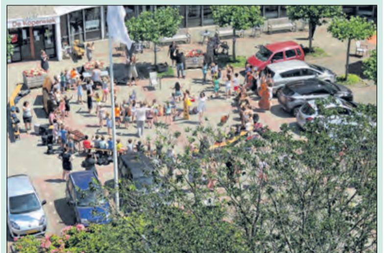
Leerlingen van de Julianaschool zingen bij De Koperwiek.