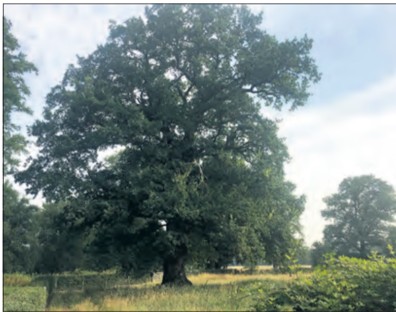
De magnifieke oude eik in het Baronnenbos.

Joris Hellevoort boswachter Utrechts Landschap