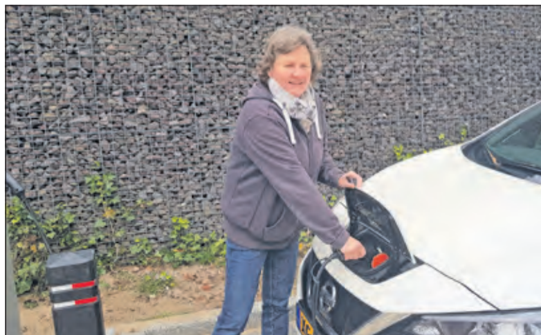
Samen Slim Rijden

De Bilt voldoende belangstelling is. En in welke delen en dorpen binnen onze gemeente. 'Niet dat je je meteen aanmeldt, maar we horen graag wat men ervan denkt. Dan kunnen we bepalen of en hoe we verder gaan'. De enquête is te vinden op de homepage van www.beng2030.nl (Alies Vos)