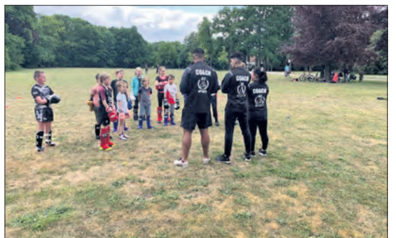
Ook de allerkleinsten kwamen trouw trainen.

'Elke les is anders waardoor het spannend blijft, de motivatie hoog is en de deelnemers er lol in houden. In mijn lessen komt altijd conditie en kracht naar voren, maar wel op eigen niveau en dat maakt het geschikt voor iedereen. Ook voor jeugd. Het enthousiasme van iedereen en de goede onderlinge contacten geeft mij volop voldoening en plezier in mijn werk'.