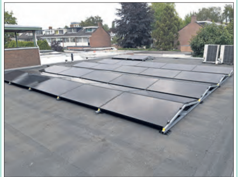
Op het dak van de wereldwinkel liggen 44 zonnepanelen.

Tijdens de week van de duurzaamheid in oktober a.s. zal het hele plan rond de Global Goals aan de inwoners van de gemeente worden gepresenteerd. Ook zal dan de speciale Global Goals ruimte achterin de winkel worden geopend. (Aad van der Meer)