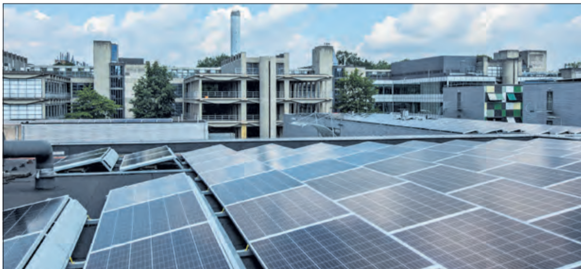
Drieduizend zonnepanelen op de daken van Utrecht Science Park Bilthoven.

Het traject van vooronderzoek, plannontwikkeling en realisatie heeft een paar jaar geduurd. Tussentijds kwam de toekenning van subsidie van de Rijksoverheid (SDE+), ter stimulering van meer opwekking van duurzame energie. Daardoor geldt in de komende 16 jaar een vergoeding voor de geproduceerde zonnestroom. Poonawalla Science Park en BENG! delen graag hun ervaringen met dit project. 'We steunen de energietransitie in De Bilt daarmee graag, ook voor kleinere projecten trouwens.' Bedrijven en instellingen met plannen kunnen mailen naar: communicatie@poonawallasciencepark.nl of info@beng2030.nl . (Alies Vos)