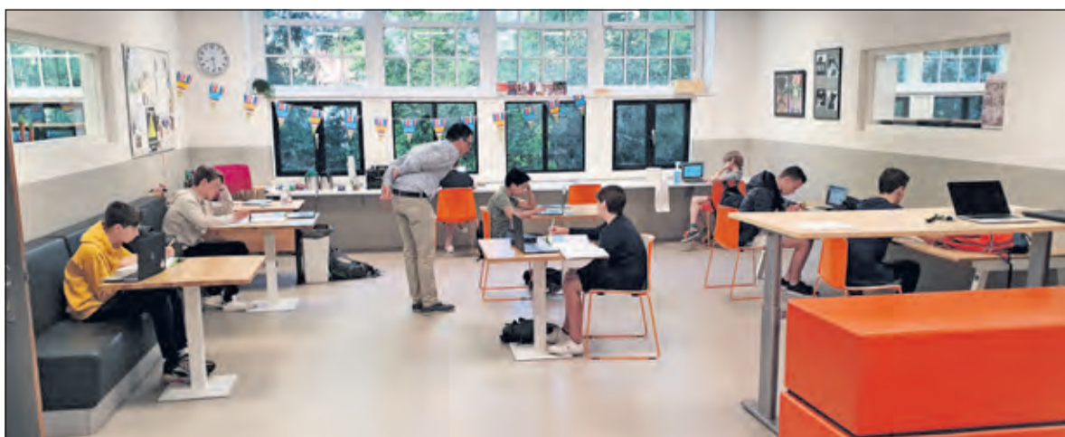
Ook in de klas zitten leerlingen op afstand van elkaar.

Eind september begint het nieuwe schooljaar. De schoolleiding is al druk bezig met het samenstellen van twee lesroosters, een gewoon basisrooster en een coronaroster. Van de Sluis: 'Je weet nooit of het coronavirus in het najaar opnieuw toeslaat, dus hebben wij in ieder geval een extra lesrooster. Maar eerst komt de vakantie eraan. De meeste leerlingen zijn door naar het volgende schooljaar, op basis van hun resultaten tot de lockdown inging. Natuurlijk kijken wij niet alleen naar die cijfers. Samen met de ouders wordt bepaald of een leerling over gaat. Verder zijn wij heel trots op onze eindexamenkandidaten. Zij hebben een heel vreemd jaar achter de rug, waarbij zij geen eindexamen hoefden te doen. In de media hoor je veel over een coronadiploma, alsof leerlingen een diploma in de schoot geworpen krijgen. Ik kan iedereen verzekeren, dat is pertinent niet waar. Het was een zwaar schooljaar en ik ben trots op onze leerlingen en geef hen graag mijn complimenten'.