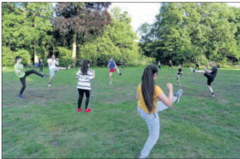
Uiterst geconcentreerd worden de traptechnieken geoefend.

lingen blijven op 1,5 meter afstand. Net als ikzelf. We doen alles volgens de coronaregels'. Bij WVT wordt niet aan wedstrijd-karate gedaan maar zijn de lessen meer gericht op zelfverdediging en op de traditionele karate-oefeningen. Bij karate leer je door middel van technieken de natuurlijke wapens van het menselijk lichaam, o.a. de handen, de voeten effectief te gebruiken om jezelf of een ander te verdedigen tegen één of meer aanvallers. Er wordt vooral getraind op conditie, lenigheid, kracht, snelheid, balans, concentratie en coördinatie. Mark Krähe: 'Je bouwt met karate niet alleen een goede lichamenlijke conditie op maar ook je gevoel van eigenwaarde neemt toe'.