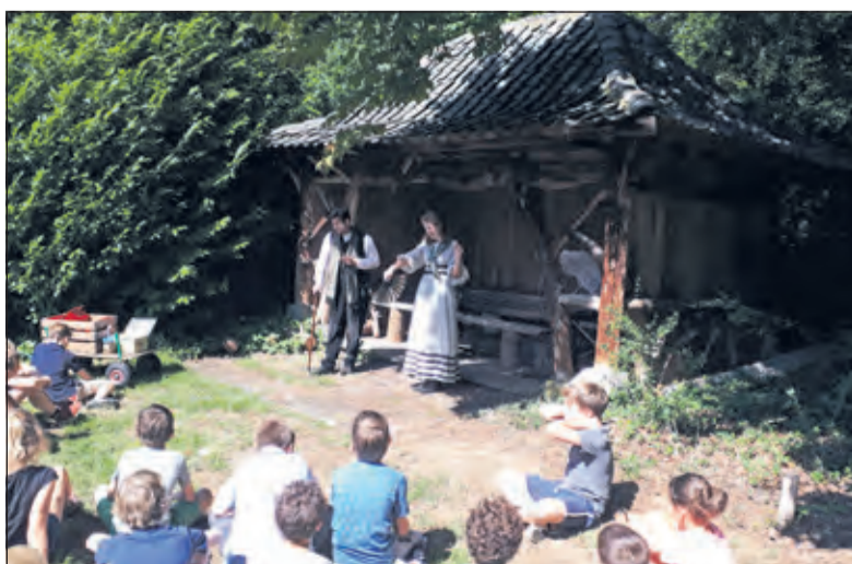
De leerlingen maken zich op om gedichten te schrijven op 'inspiratieplek': het theehuisje achter Eyckenstein.