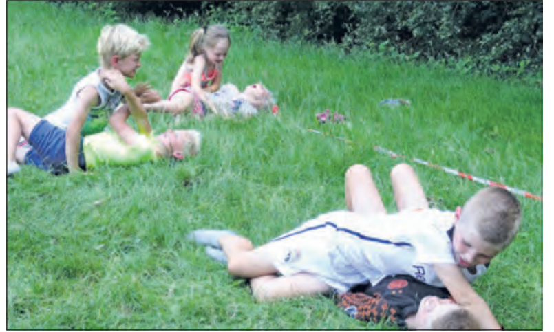
De kinderen van de judogroep 1 van Judokan oefenen de houtgreep op elkaar.

Met karate was er in het begin helemaal geen lichamenlijk contact mogelijk tussen de leerlingen. Maar