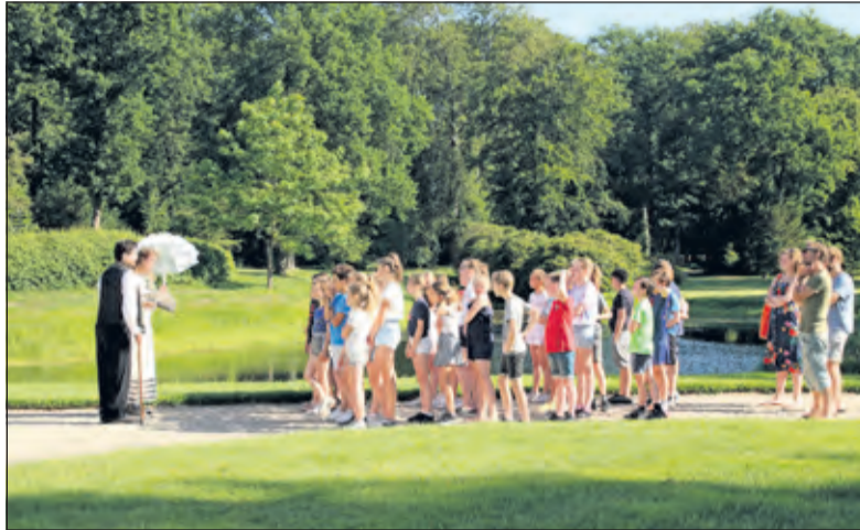
De klas wordt door de baron en barones ontvangen.

In een project van Kunst Centraal (de provinciale organisatie in Utrecht op het gebied van kunst- en cultuureducatie, o.a. voor circa 90% van de scholen in het primair onderwijs) maken de leerlingen kennis met het fenomeen 'buitenplaats', met de mooie huizen, riante tuinen en vele bijgebouwen. De leerlingen onderzoeken en bezoeken een buitenplaats in hun eigen gemeente. Ook gaan ze op zoek naar de waarde van deze plek voor hun eigen omgeving en maken een plan voor de toekomst.