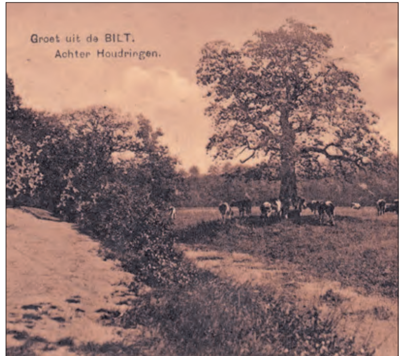
De oude eik op een ansichtkaart uit 1930.