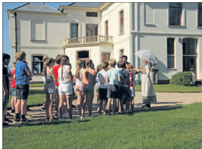
De leerlingen bekeken niet het huis, maar wel de tuin erachter.