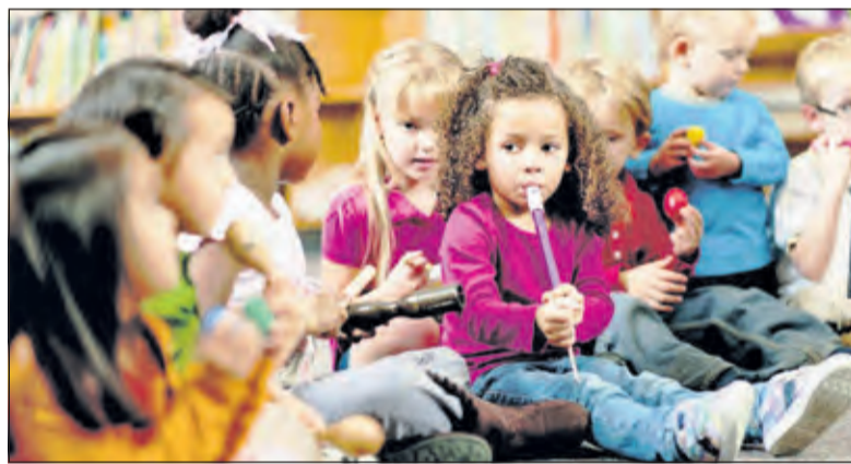
Bij de cursus Muziekplezier van 1 tot 4 maken kinderen op een speelse manier kennis met muziek.