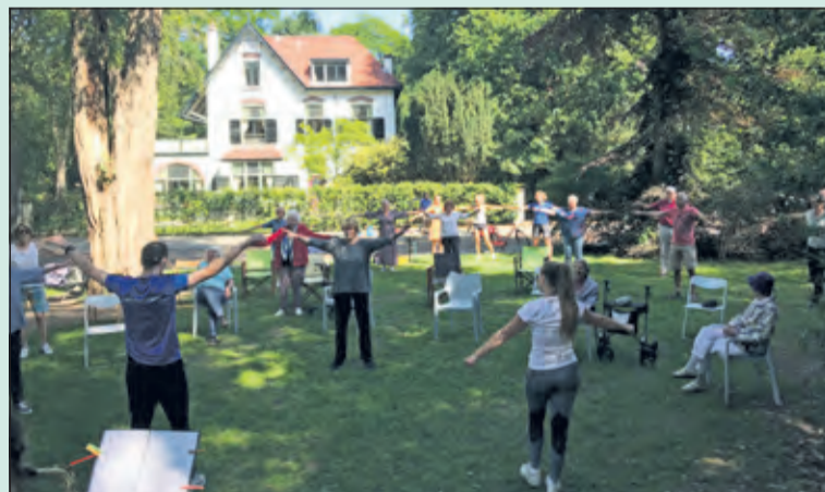
Ook de bewoners van wijk Vogelzang in Bilthoven deden mee aan 'Buiten Spelen!' bewegen voor ouderen onder begeleiding van muzikanten van het Kunstenhuis. Het plantsoentje aan de Kruislaan was goed gevuld met wijkbewoners die de bewegingen van de buurtsportcoaches van Mens De Bilt volgden.