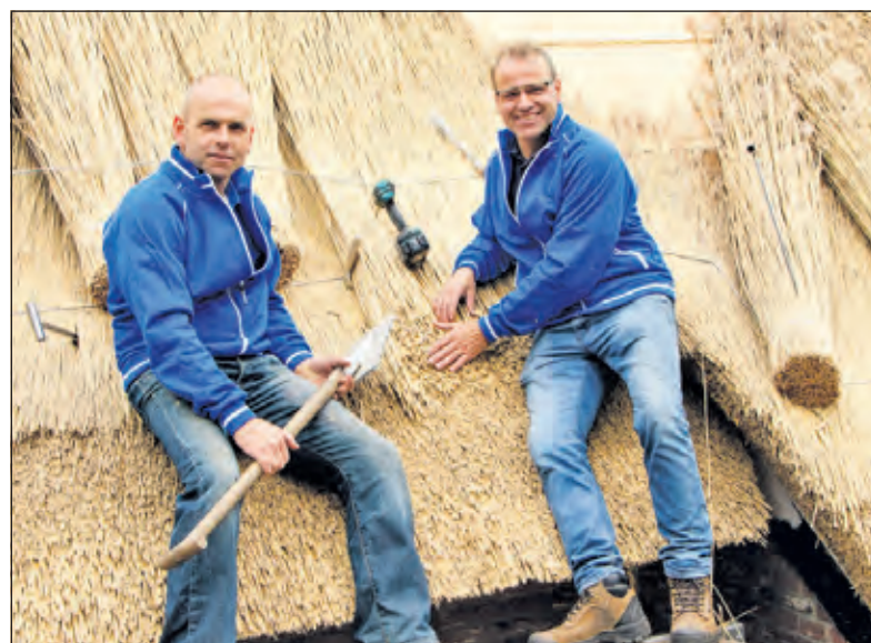
Van Ettehoven Rietdekkers werkt al 9 generaties op het rietendak.

uit Loosdrecht blijkt van uitzonderlijke kwaliteit zodat wij uitbreiding van dit project graag promoten. Wij zijn finalist in de verkiezing; 'Ondernemer van Wijdmeren' en hebben uw stem hierbij nodig. Bekijk onze video en stem nog: VanEttehovenRietdekkers.nl