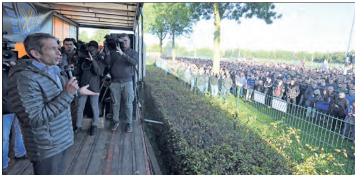
Hans Brug, directeur-generaal van RIVM spreekt de 7.000 boeren toe.

Waartegen demonstreren boeren eigenlijk? Uit allerlei berichten en onderzoeken blijkt het stikstofoverschot een veel groter probleem te zijn dan klimaatverandering. Ook verdroging is een groot probleem dat stikstofproblematiek versterkt. Ongeveer 78% van de lucht bestaat uit stikstof, maar als stikstof een verbinding aangaat met andere stoffen, ontstaan onder andere stikstofoxide en ammoniak. Om deze verbindingen gaat het. Stikstof(verbindingen) zorgt onder andere voor vermessing. Vooral natuur op zandgron-