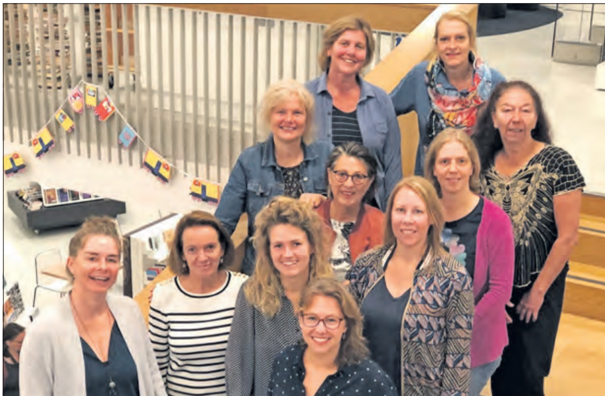
Leden van de werkgroep KidS en medewerkers van Kunst Centraal, Kunstenhuis en IDEA.

Cultuureducatie is één van de vakgebieden waarin les gegeven wordt op de basisschool. Een daarvoor eertijds in het leven geroepen Werkgroep KidS is samengesteld uit o.a. vrijwilligers, medewerkers vanuit het Kunstenhuis, Kunst Centraal, het Landschap Erfgoed Utrecht en het Onderwijs.