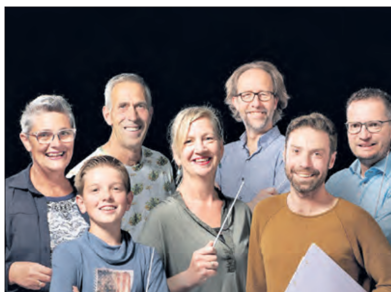
De kandidaten voor de Maestro-titel.

duurt tot 21.30 uur. Ook dan bent u van harte welkom als voorproefje op de wedstrijd van 9 november om 20.00 uur. (Karin Bos)