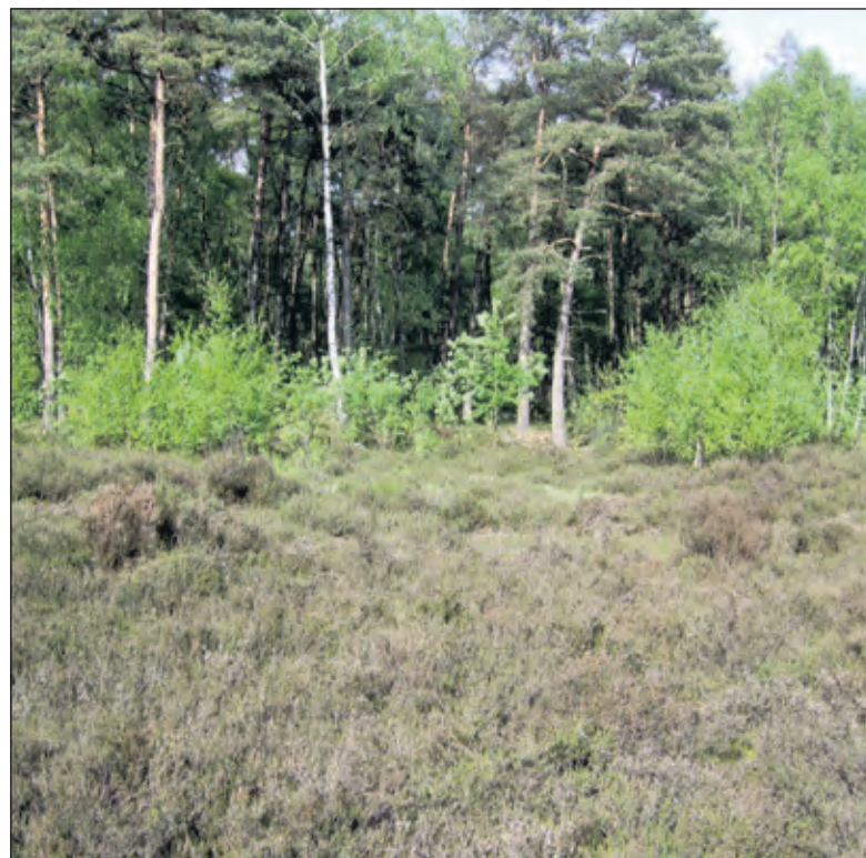
Ook in 2017 en jaren daarvoor werd de opslag in het heideveld in de Ridderoordse bossen verwijderd.

Het verlies aan biodiversiteit - de afgelopen decennia ruim 70% - is een grote zorg. Biodiversiteit is de verscheidenheid aan soorten van levende organismen binnen een bepaalde omgeving, oftewel, het aantal soorten planten en dieren in een bepaald gebied. Dit geheel is voor de mens van levensbelang. Het zorgt tenslotte voor de zuurstof die men inademt, levert een gezonde bodem voor voedselproductie en zoet water en het is de groene leefomgeving van planten en dieren.