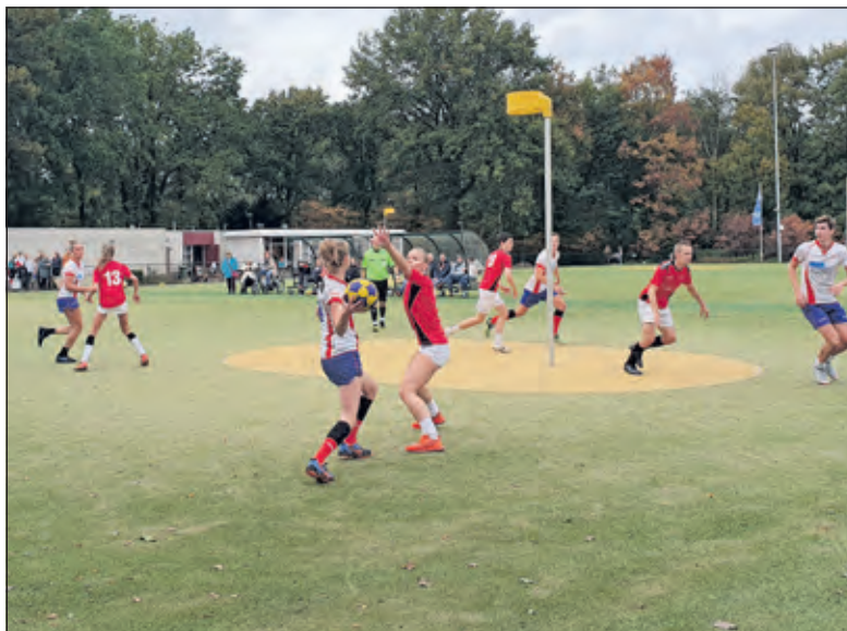
Nova komt te laat op dreef.

Waar Nova een groot deel van de tweede helft veel moeite bleef houden met scoren, vlogen bij Telstar de schoten er regelmatig van grote afstanden moeiteloos in. Nova zag het gat steeds groter worden, 7-16. Het tweede deel van de tweede helft liet Nova nog zien waar de ploeg echt goed in is; op tempo veel