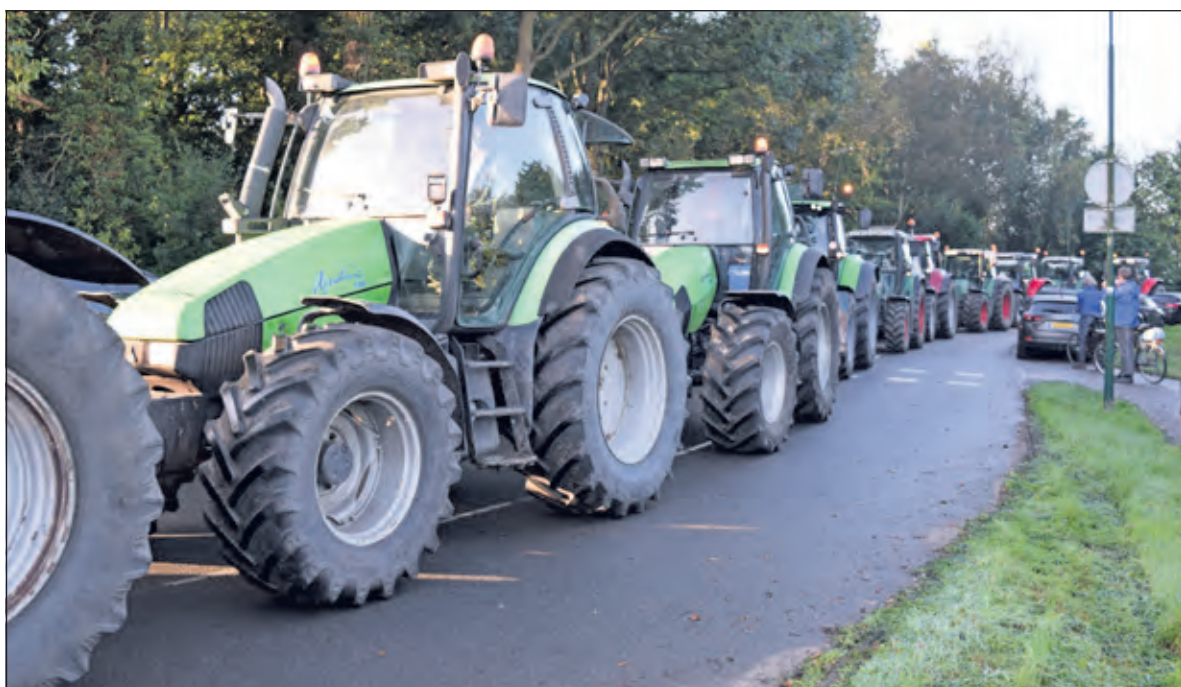
2.500 trekkers staan opgesteld op de Biltse Rading.

Duizenden boeren demonstreerden woensdag 16 oktober in gemeente De Bilt op het terrein van honkbalvereniging HSV Centrals aan de Voordorpsedijk in De Bilt. Met 2.500 trekkers kwamen 7.000 boeren van heinde en verre om te demonstreren tegen meetmethoden van het RIVM en om aan te geven dat het Bilthovense bedrijf niet transparant genoeg is