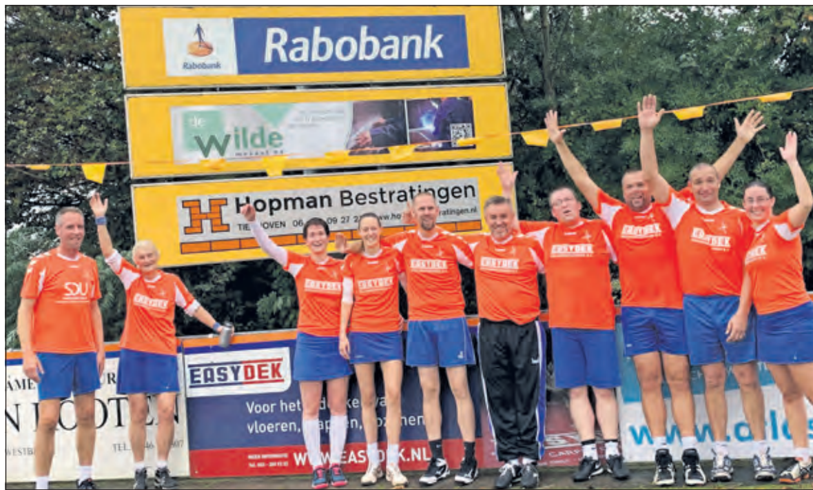
Door met 10-10 gelijk te spelen tegen Eemvogels 2 behaalde het vierde team van korfbalclub DOS uit Westbroek het veld-kampioenschap.