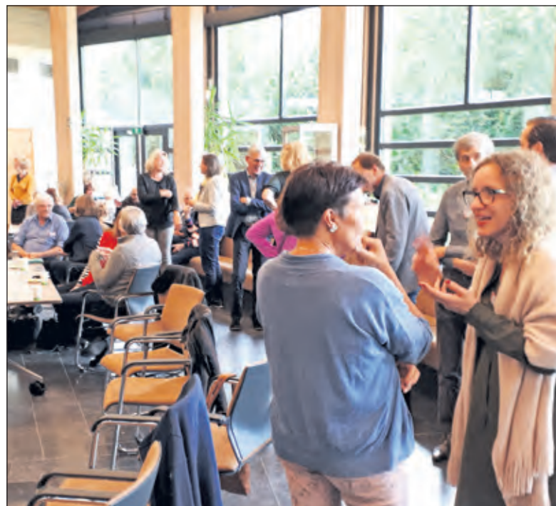
In een op de praktijk gericht programma wordt buurtbemiddelingswerk nader belicht.

klachten aan. Zowel de klager(s) als degene(n) over wie de klacht gaat wordt gehoord. In eerste instantie met iedere partij afzonderlijk, later hopelijk gezamenlijk. De bemiddelaars nemen geen standpunt in en zorgen ook niet voor oplossingen. Wat zij proberen te doen is om begrip te kweken bij beide partijen voor het standpunt van de ander. Ze proberen dit op zo'n manier te doen, dat beide partijen op basis van het inzicht dat zij in het standpunt van de ander hebben gekregen samen met elkaar tot oplossingen gaan komen. Deze aanpak werkt. Landelijke cijfers laten zien dat in 70% van de gevallen er een positief resultaat wordt geboekt. Niet alles komt dus tot een oplossing. Beide partijen moeten wel bereid zijn het gesprek met elkaar aan te gaan. Landelijke cijfers laten zien dat helaas complexe aanvragen toenemen door de stijging van psychosociale problematiek in de wijken. Het gaat niet