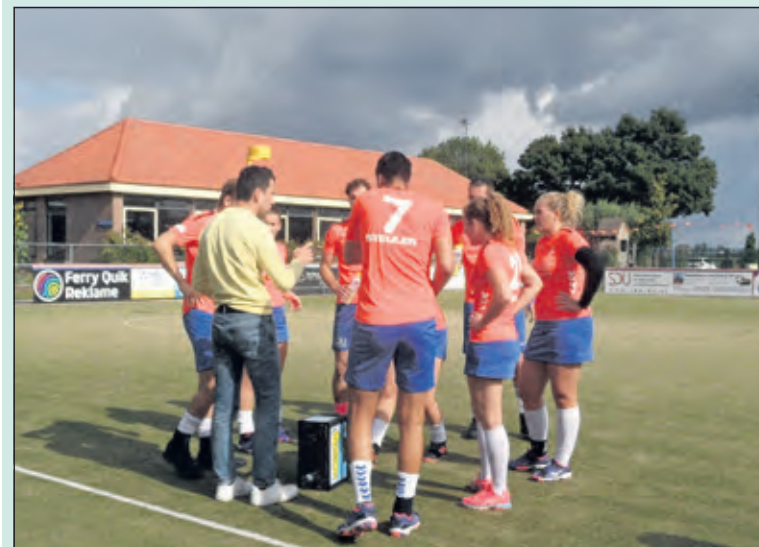
Met ingang van 2018 is de time-out geïntroduceerd; beide teams mogen ieder 2 time-outs per wedstrijd aanvragen. Een time-out duurt 1 minuut.

De laatste veldwedstrijd uit de eerste veldperiode speelt DOS uit tegen ASVD. De wedstrijd in Dronten begint om 15.30 uur.