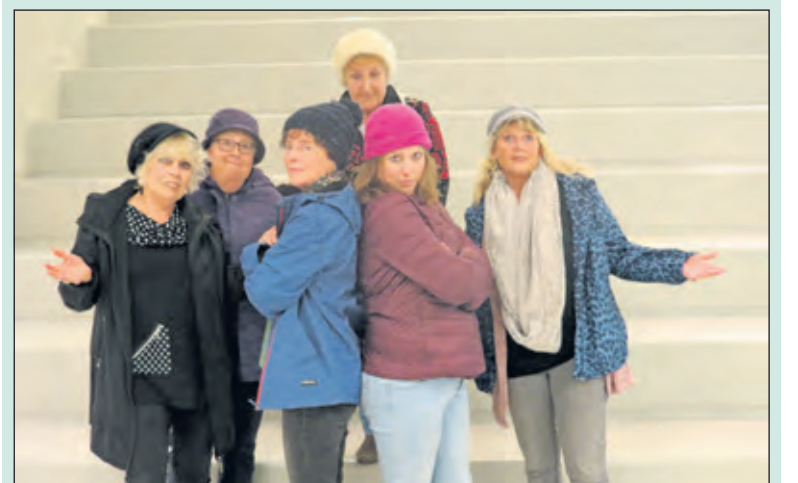
De zes zussen die weer gaan zorgen voor een heerlijke uitvoering.

De voorstellingen zijn in Het Lichtruim, Planetenplein 2, Biltoven op vrijdag 8, zaterdag 9 en zondag 10 november. Op 8 en 9 november begint de voorstelling om 20.00 uur. Zondag 10 november om 14.30 uur. Kaarten zijn te bestellen via secretariaatsteedsbeter@gmail.com , of tel. 030 2291021. De voorverkoop start op 26 oktober bij: Mijn Droomkapper, Planetenbaan, The Read Shop, Hessenweg of Bruna, Julianalaan. Aan de zaal kan niet worden gepind.