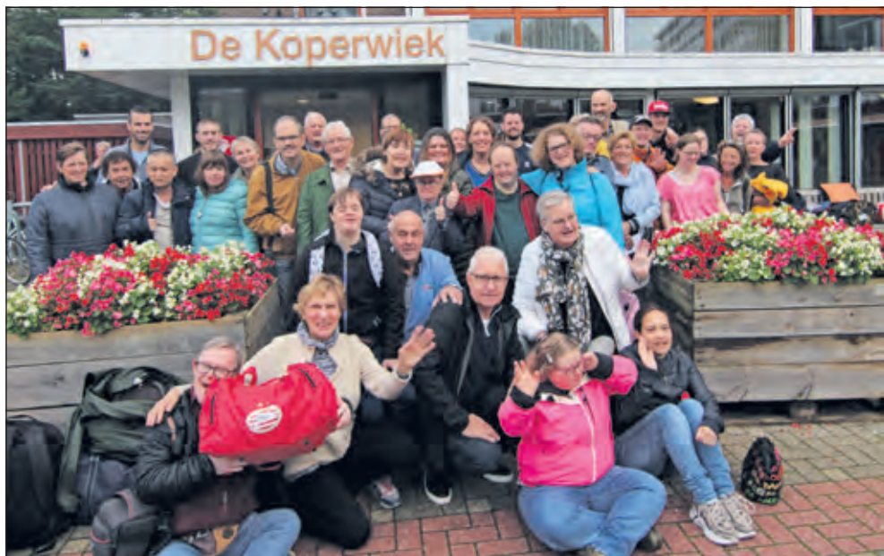
Vorige week dinsdag vertrokken 21 sporters en 19 vrijwilligers voor een geheel verzorgde reis naar Disneyland Parijs.

Vervolgens zocht iedereen met de eigen groepjes die activiteiten op die de sporters wilde bezoeken met natuurlijk ook voldoende tijd om in één van de vele winkeltjes mooie souvenirs te kopen. De groep vrijwilligers, waaronder vast personeel van Zideris en Reinaerde die onbetaald en met inlevering van vrije dagen meegingen, werden de mooiste cadeaus gekocht. Rond twaalf uur vertrok de bus richting Bilthoven met nog wel een fijne tussenstop bij de McDonalds. Geen onvertogen woord, enthousiaste sporters, lieve vrijwilligers en een niet moe te krijgen bestuur: over deze fantastische reis gaat nog lang gepraat worden.