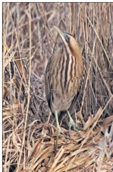
De roerdomp is een opvallende nieuwkomer in het gebied.

De afgelopen jaren is er veel werk verzet in de Oostelijke binnenpolder en de Taartpunt om het tot één groot waterrijk natuurgebied te maken onder de rook van Utrecht. De provincie Utrecht heeft hiermee haar deel van het Natura 2000 gebied 'Oostelijke Vechtplassen' ingericht. Wie het natuurgebied van dichtbij wil bekijken kan een wandeling maken over het Vredevoetpad: zie www.natuurmonumenten.nl . (Tamara Overbeek)