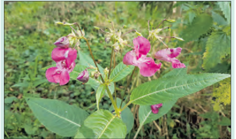
Ongewenste en exotische plantensoort reuzenspringbalsemien.

Afval levert ook risico's op voor dieren die er van eten, snoeiafval van taksus is bijzonder giftig en heeft al tot de dood van menig dier geleid. Addy: 'Bij sommige mensen zie je dat ze zich oprecht niet bewust zijn van de risico's. Maar er zijn ook mensen die onverschillig zijn of het uit gemakzucht dumpen. Het is jammer dat zo'n klein groepje dat tuinafval dumpst ons zoveel werk bezorgt om de woekerplanten te bestrijden en de rotzooi op te ruimen. In deze tijd voeren wij ook weer extra controles uit om het dumpen van tuinafval tegen te gaan. Ik hoop dan ook dat door dit onderwerp extra onder de aandacht te brengen het aantal dumpingen teruggedrongen kan worden'. (Joost Hogenboom)