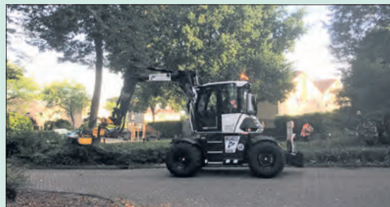
Nieuw groenbeleid van gemeente De Bilt.

Integendeel: de Biga Groep blinkt uit in het verminken van beplanting waarbij, in een groot aantal gevallen, planten zodanig worden teruggesnoeid of afgezaagd, dat deze helemaal niet meer uitlopen. Daardoor is er in toenemende mate sprake van onwenselijke aanwas van onkruid (brandnetel, braam en vogelkers, enz.).