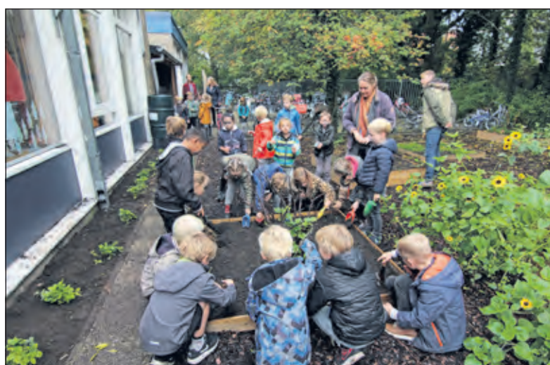
Leerlingen van de Patioschool zijn druk in de tuin. Er ging ook een fors aantal bloembollen de grond in waar de bijen in het voorjaar goed van kunnen profiteren.

aangeplant. Er is een selectie gemaakt van planten, die tevens eetbare vruchten vormen voor de kinderen zelf. Zo is er gekozen voor bijvoorbeeld de aalbes, de appelbes, frambozen en de bosaardbei.