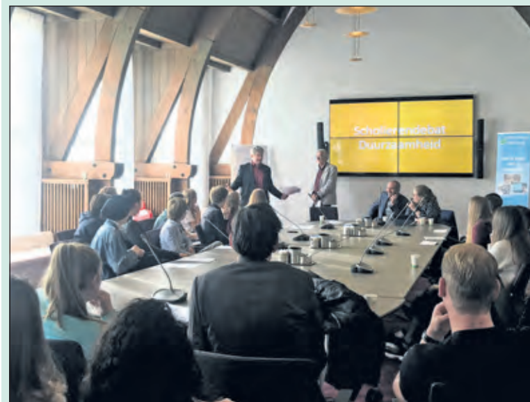
Het scholierendebat in de oude raadszaal van Jagtlust.