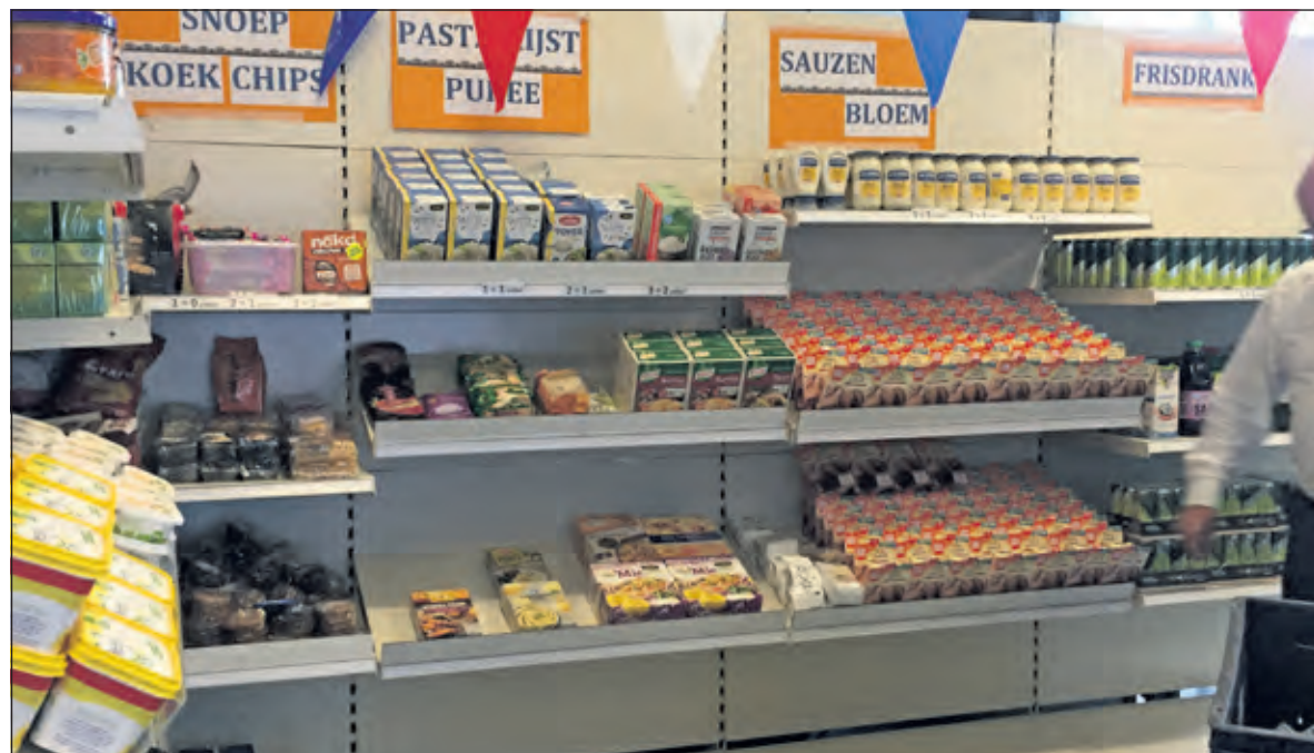
Meer keuzevrijheid bij de Voedselbank.