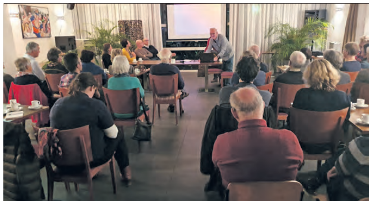
Tijdens het dorpsberaad kwam ook de biodiversiteit van Westbroek ter sprake.

Sensitief begeleid door pianiste Eva van der Molen trof verteller Tuinenburg precies de juiste toon om grut én ouders te ontroeren, te raken en te doen schateren, precies zoals dat een ouderwets kinderfeestje betaamt.