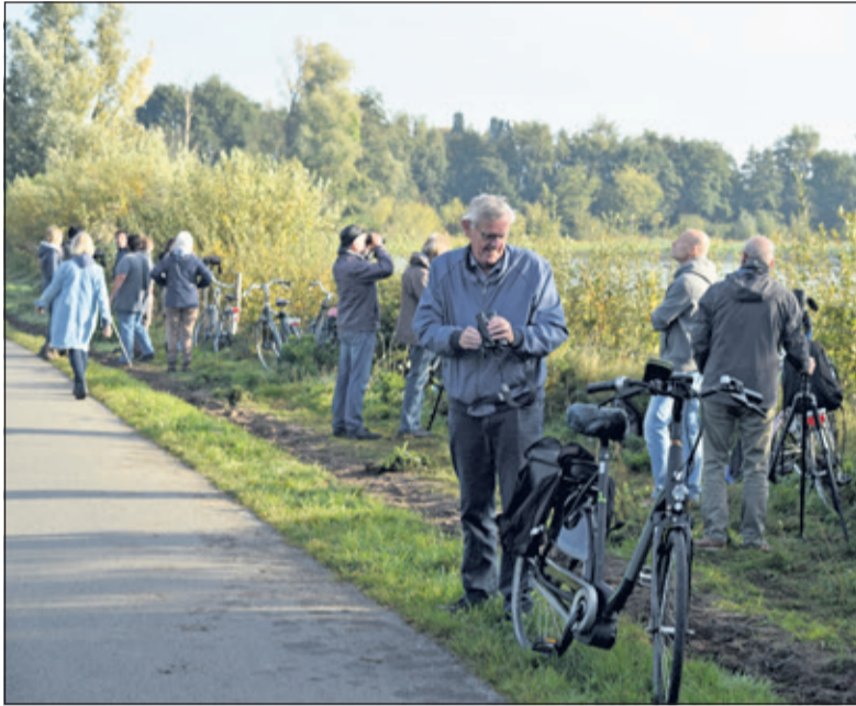
Ongeveer 20 vogelaars telden alles wat over vloog.

Zaterdag 6 oktober telden duizenden vogelaars, in heel Europa, de trekvogels, op hun trek van noord naar zuid. Ieder voor- en najaar weer een spectaculair fenomeen. In het kader van het 60-jarig bestaan van de Vogelwacht Utrecht en het 50-jarig bestaan van het IVN telde een groepje vogelaars mee aan de Hoogekampseplas in Groenekan.