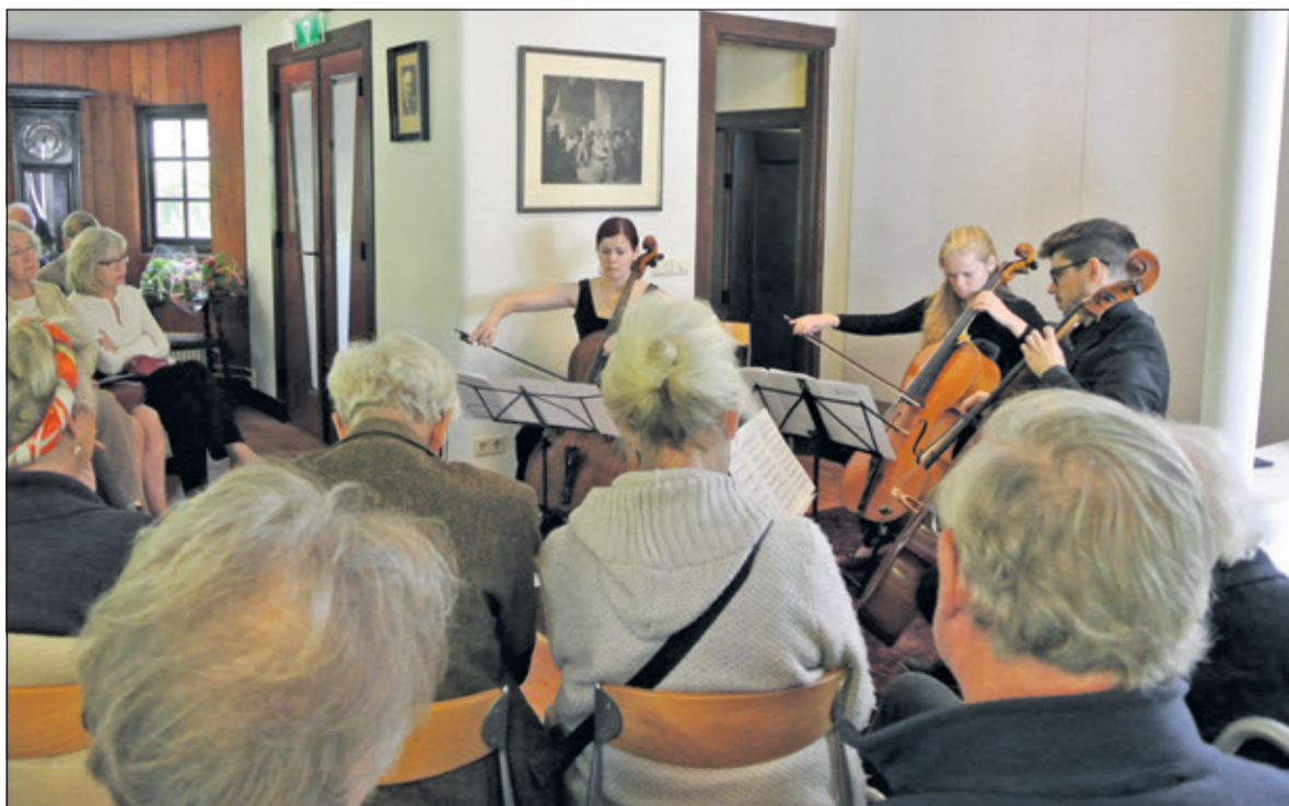
Belangstellenden genieten van de Cello Company.