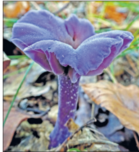
Miranda Engelshoven bracht deze rodekoolzwam prachtig in beeld.

In het kader van het 50-jarige jubileum van IVN De Bilt wordt een fotowedstrijd georganiseerd met een aantal leuke prijzen. Voor deze wedstrijd is IVN op zoek naar unieke natuurfoto's waarop het feest van de natuur is vastgelegd. En dan speciaal de natuur van dicht bij huis; het liefst uit de regio De Bilt. Denk daarbij bijvoorbeeld aan een kever met mooie felle kleuren, een boom vol herfstbladeren of een spelend kind in de natuur. Deelnemen kan