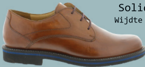
Solidus Wijdte G/H