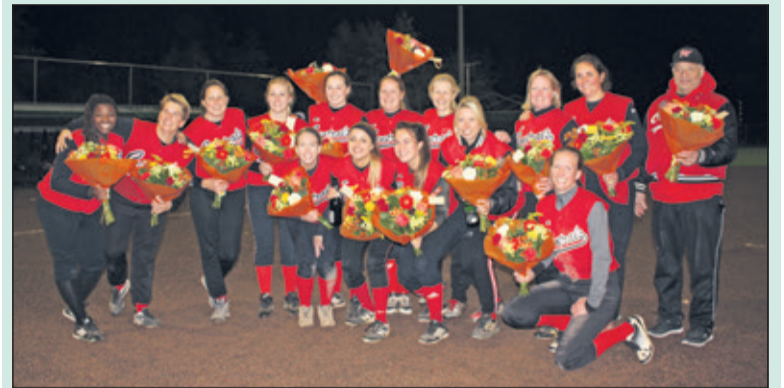
Bloemen voor het kampioensteam.