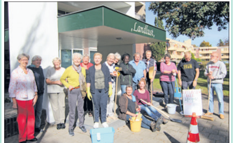
De schoonmaakploeg van Landlust.

Zaterdag was het najaar-schoonmaak-dag voor de bewoners van Complex Landlust aan de Alfred Nobellaan in De Bilt. Met een knipoo naar NL-Doet noemen zij dat daar een Landlust-Doet-dag. Vanaf 9 uur was er een groot aantal bewoners bezig om het geheel er weer netjes uit te laten zien. Een ander gedeelte van de bewoners zorgde voor de versnaperingen: er was gekookt, gebakken en de dag wordt afgesloten met een drankje. Regina Tersteeg