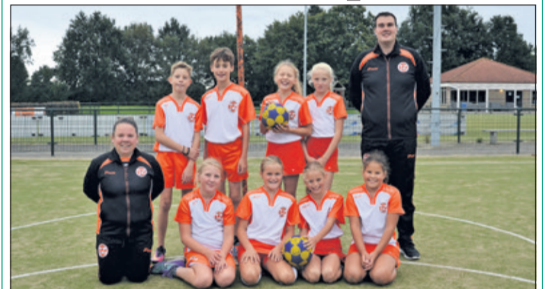
TZ D1 werd zaterdag 6 oktober kampioen door hun vijfde wedstrijd op rij te winnen. Na een 4-0 ruststand werd het tegen Sparta Nijkerk uiteindelijk 6-2 voor de Maartensdijkers. (Hester Ploeg-van Laatum)