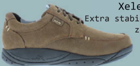
Xelero Extra stabiele zool