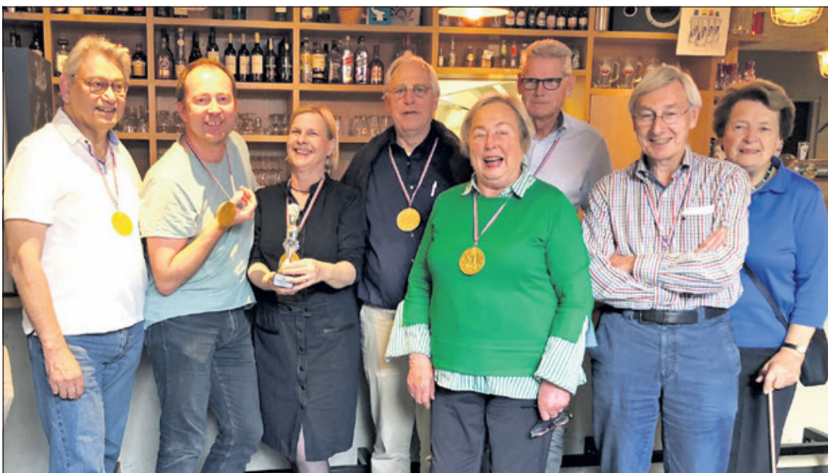
BC Bilthoven gaat met de eer naar huis.