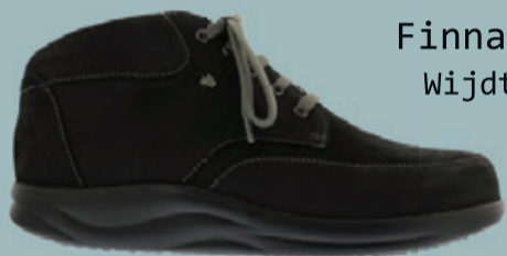
Finnamic Wijdte K