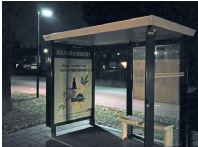
Vrijdagavond 5 oktober brandde het licht in deabri toch echt niet.

Bilts Rover-agent Evert Bouws weet in eerste instantie niet direct