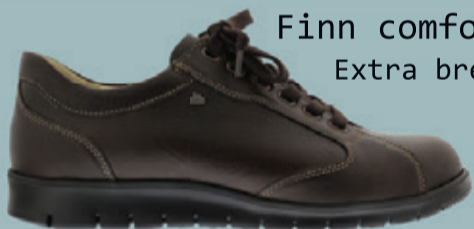
Finn comfort Extra breed