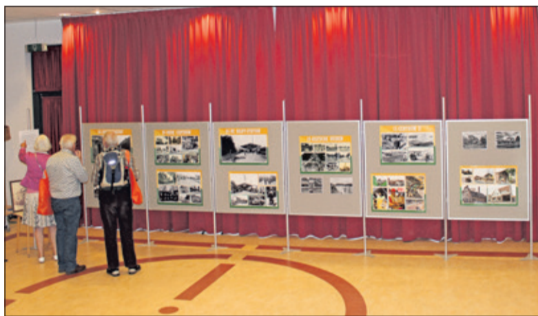
In de school was een deel van de tentoonstelling over 100 jaar Bilthoven ingericht.

zo goed mogelijk als school werd ingericht. Op maandag 31 januari 2005 werd de in 1918 ingemetselde steen door toenmalig burgemeester Tchernoff, in aanwezigheid van een groot aantal leerlingen, leerkrachten en ouders, uit de muur van de Julianaschool verwijderd. De school werd kort daarna gesloopt en ter plekke werd een nieuwe school gebouwd die medio 2006 in gebruik werd genomen'.