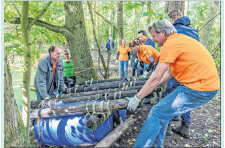
Bankmedewerkers helpen Griffenstein & Zorg met aanleg van speelactiviteiten voor cliënten.

De geboden hulp was een initiatief van Rabobank Rijn en Heuvelrug en Samen voor de Bilt en werd georganiseerd tijdens de Aandeel In Elkaar Week: een initiatief van de Rabobank waarin meer dan 100 medewerkers van de bank hun betrokkenheid hebben getoond. Zij deden vrijwilligerswerk bij verschillende maatschappelijke organisaties in de regio. (Suzanne Baan - Van der Zwan)