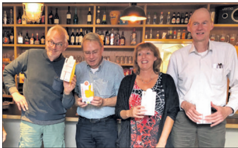
De extra prijs voor het viertal dat individueel het best gescoord had ging naar de Thuisbridgers van het RIVM.