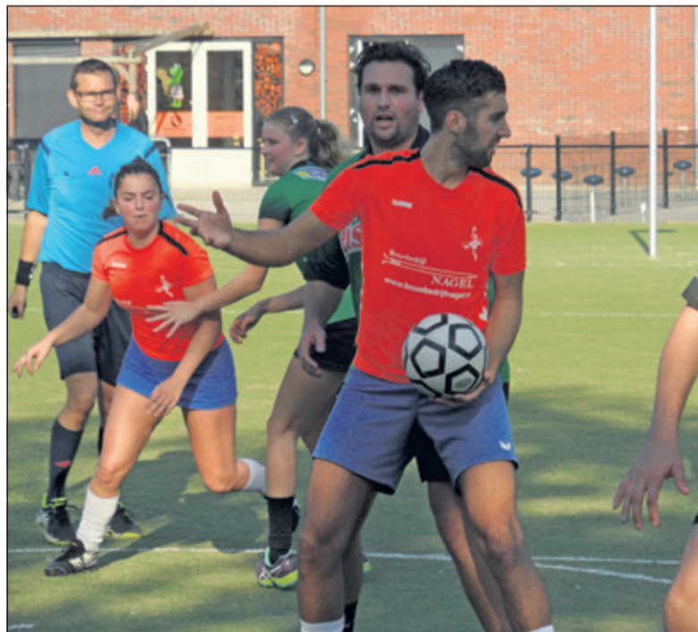
Dos voert een spannende strijd in Ruinerwold

De tweede helft boog DOS snel de 11-10 achterstand bij rust om in een 11-12 voorsprong. Bij 12-14 leek DOS een eerste beslissing in de wedstrijd te forceren, maar KIOS kon toch gelijk komen. Vanaf dat moment ontspon zich een spannende strijd richting het einde van de wedstrijd, waarbij DOS steeds als eerste scoorde, maar KIOS telkens wist aan te haken. Enkele minuten voor tijd dacht DOS bij 17-18 de overwinning binnen te