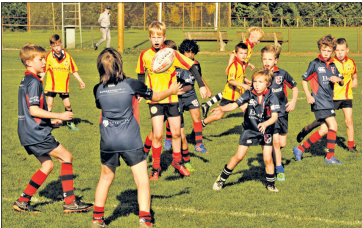
Het rugby seizoen is alweer in volle gang. Het seizoen kent geen winterstop en loopt door tot begin juni.