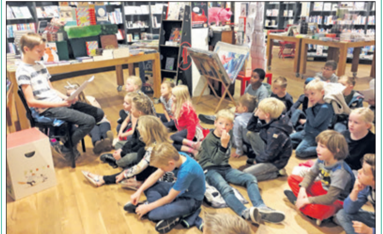
Er wordt aandachtig naar het voorlezen geluisterd.