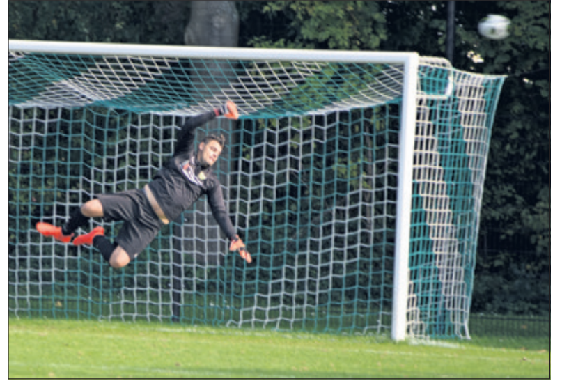
De Maartensdijkse goalie ranselt een bal uit het doel.

Zaterdag 13 oktober speelt SVM de vierde van in totaal 26 wedstrijden, wanneer Elinkwijk (Utrecht) naar Maartensdijk afreist. Aanvang 14.30 uur.