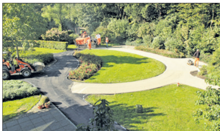
Er wordt druk gewerkt aan de verharding van het tuinpad. (foto Wim Westland).

Dankzij genereuze bijdragen van de Hubertusstichting en Stichting Masian kon er een nieuw asfalt pad worden aangelegd in de tuin van Hospice Demeter. Het oude pad was van split; de patiënten konden moeilijk over het pad met een rollator of rolstoel en met een bed was het helemaal niet mogelijk; lekker van de tuin genieten was dan ook niet vanzelfsprekend. Dankzij deze stichtingen is er nu een verhard pad in een natuurlijke kleur en passend in en bij de rustgevende tuin. Op 12 oktober tussen 10.00 en 13.00 uur kan iedereen deze prachtige verandering bewonderen op de Internationale Dag Palliatieve Zorg. Demeter zal deze dag aandacht geven aan de betekenis van natuur voor patiënten en naasten in de palliatieve zorg. Meer informatie hierover op website www.hospicedemeter.nl