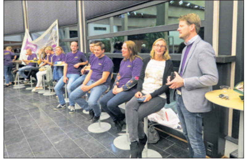
Medewerkers van De Regenboog waren in de raadzaal aanwezig maar het onderwerp waar ze voor kwamen werd niet behandeld.