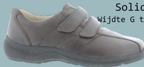
Solidus Wijdte G t/m M