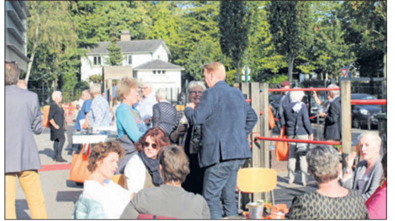
Al vanaf de eerste moment was het een drukte van belang.