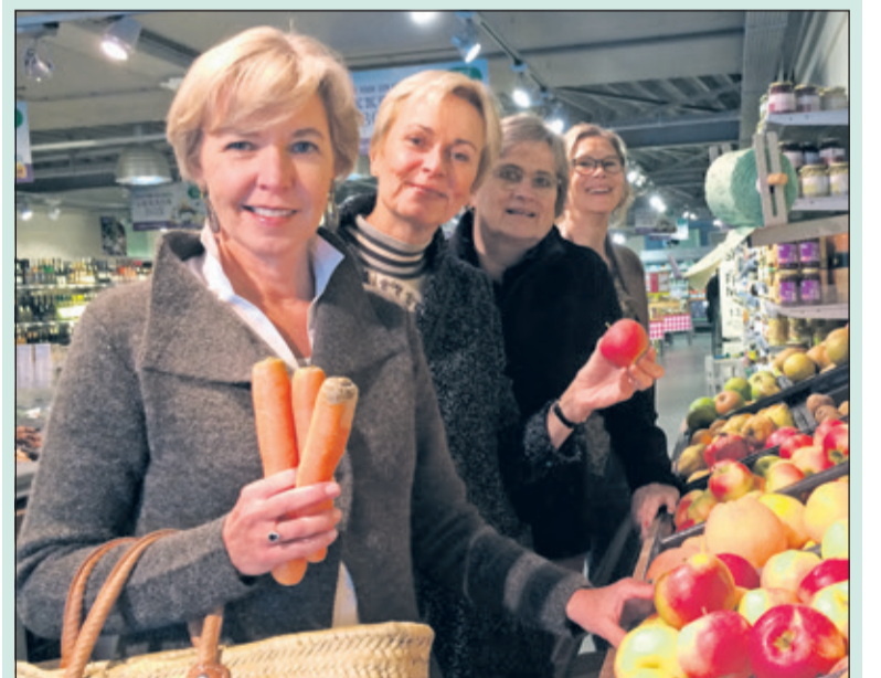
De dames van Rotary Zandzegge kiezen bewust voor lokale producten.