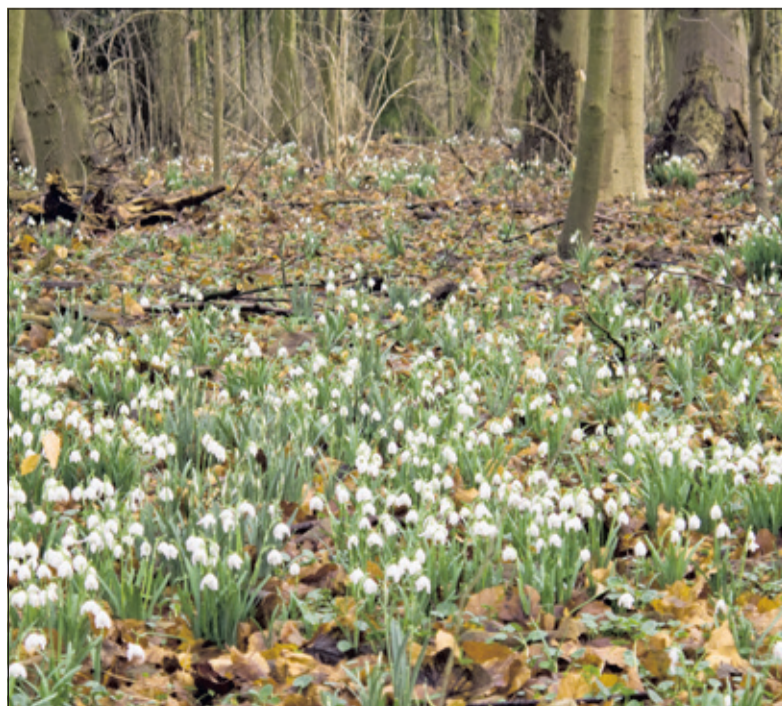
Stinsenplanten zoals sneeuwkllokjes bieden al vroeg in het voorjaar voedsel aan insecten.