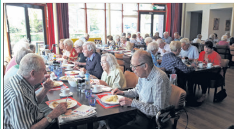
Vrijdag 5 oktober waren de bewoners van Weltevreden en de ouderen uit de buurt uitgenodigd om pannenkoeken te komen eten in Restaurant Bij de Tijd. De pannenkoeken werden gebakken door een aantal vrijwilligers van Mens, het restaurant en Weltevreden. De ingrediënten voor de pannenkoeken werden geschonken door de Hessenwegwinkeliers Bakkerij van Ingen, Slagerij van Loo, Corum Market, Ekoplaza en Dirk van den Broek. (Bea Alma - Otten)