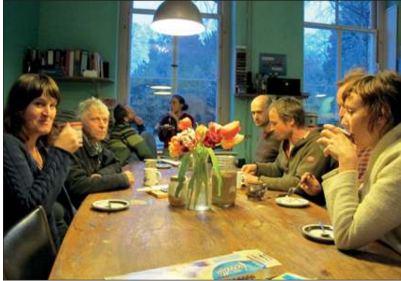
Na de gemeenschappelijke maaltijd wordt er opgeruimd en schoongemaakt, waarna iedereen die zin en tijd heeft met de anderen aan de koffie of thee gaat.

gaat naar de centrale keuken. 'Dat is de plek waar bij wijze van spreken dag en nacht mensen zitten.'