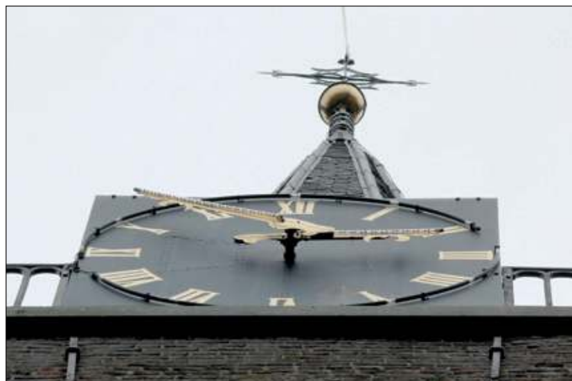
In Maartensdijk loopt de tijd ook na 14.45 uur ook gewoon door.