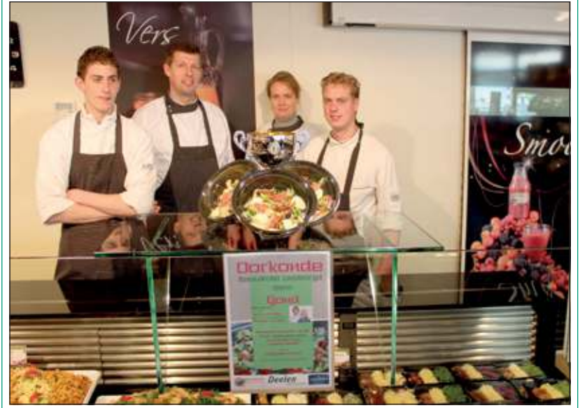
Landwaart onderscheidt zich wederom.

Van huis uit is Deelen Verswaren de leverancier voor AGF speciaalzaken. De tijd dat AGF speciaalzaken alleen aardappelen, groente en fruit leverden is verleden tijd. De huidige AGF speciaalzaak onderscheidt zich door bijvoorbeeld verse complete maaltijden te leveren. De snelle hap blijft hierdoor wel een snelle hap maar is toch gezond. Ook AGF Landwaart is zo'n speciaalzaak. Onlangs won de Maartendijkse traiteur een onderlinge ondernemers wedstrijd over rauwkost en salades. De rauwkost- en saladewedstrijd was het vernieuwende aspect met een uniek aantal inschrijvingen en fantastische winnaars. Dit alles onder de professionele en gepassioneerde leiding van de jury Ellemieke & Jeremy Vermolen. Groentewinkel Landwaart Culinair werd winnaar met de Asperge Sardines Panchetta salade zowel bij de salades als in de 'overall categorie'. [HvdB]