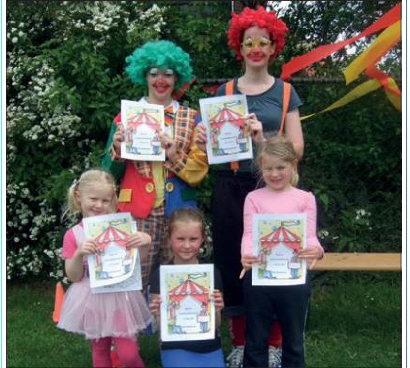
Een aantal deelnemers ging graag even samen met de clowns en het diploma op de foto.

Afgelopen zaterdag was er een korfbalcircustraining bij korfbalvereniging DOS te Westbroek voor kinderen die kennis wilden maken met korfbal. De kinderen hebben samen met de clowns een leuke korfbaltraining gedaan. Aan het eind van de ochtend kregen alle kinderen een circuskorfbal diploma! Lijkt het jou ook leuk om een keer mee te doen? Kijk dan op www.dos-westbroek.nl . De eerste vier trainingen zijn gratis zodat je goed kennis kunt maken met het korfbalspel en de vereniging DOS.