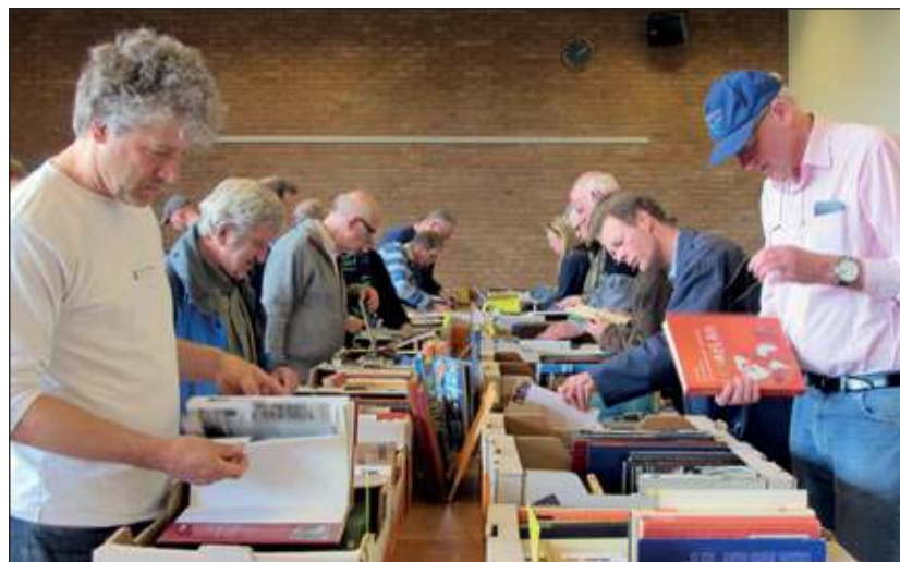
Grote drukte op de boekenmarkt van WVT.

serveerd voor de kinderboeken. Daar zit een jochie op de grond, verdiept in een Flintstone-album. Volwassenen schuiven met hun nieuwe aankopen met elkaar aan grote ronde tafels en bespreken hun vondsten. Kinderen zeuren dat ze naar huis willen, ouders smeken hun kroost of ze nog even mogen blijven zoeken. Met een triomfantelijk gezicht en grote boodschappentassen vol boeken komen weer andere mensen naar buiten. De buit is binnen dit jaar. [Lvd]