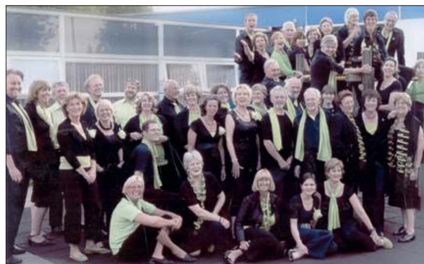
Het grote à capella koor zingt zonder instrumentale begeleiding.

tendvoorstelling zijn nog kaarten te reserveren via optredens@valschen-gemeen.nl