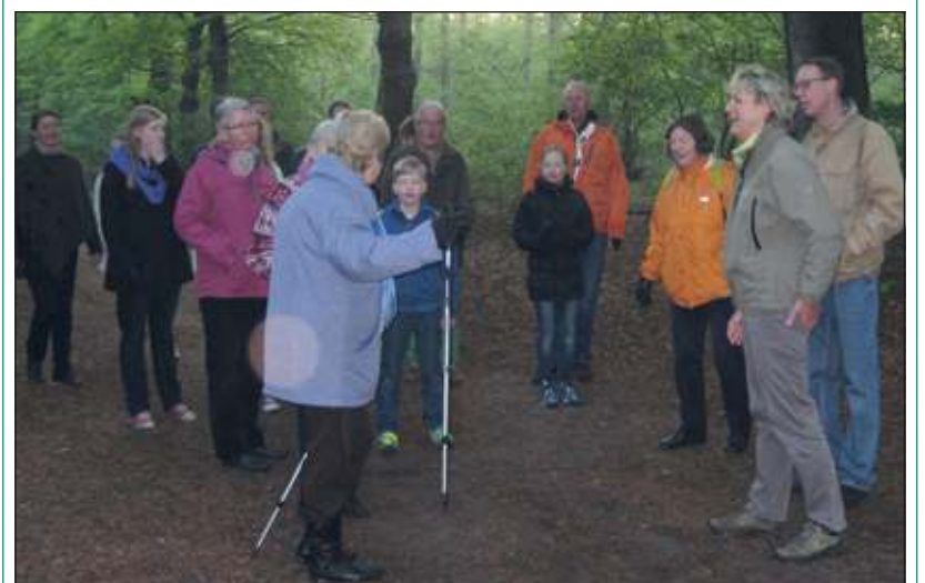
De vroege vogels in het bos.

Bij terugkomst om half 8 stond een uitgebreid ontbijt klaar met verrukkelijke, dampende pannenkoeken. (Ria Verhoef)