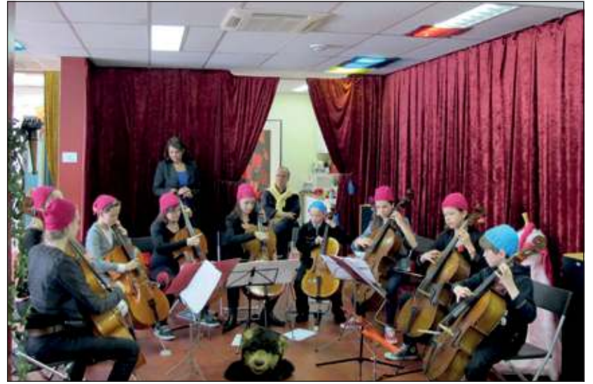
De jonge muzikanten van Fermecelli vielen op door hun rode en blauwe mutsjes.