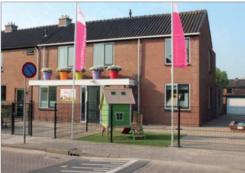
TopKids Maartensdijk biedt naast 'all inclusive' opvang ook de mogelijkheid om halve dagen af te nemen.

Direct aan het pand ligt een ruime kindvriendelijke tuin. Een gedeelte