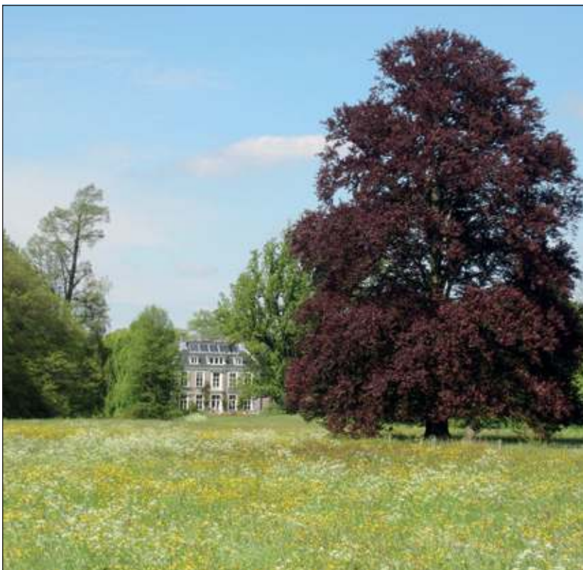
Voor Sandwijck ligt een verleidelijk natuurtapijt.

De wandeling begint om 14.00 uur en duurt ongeveer twee uur. Het verzamelpunt is de parkeerplaats op Sandwijck aan de Utrechtseweg 301, recht tegenover het Van Boetzelaerpark. Als het vochtig is, is het verstandig om stevige schoenen of laarzen aan te trekken. De rondleiding is gratis.