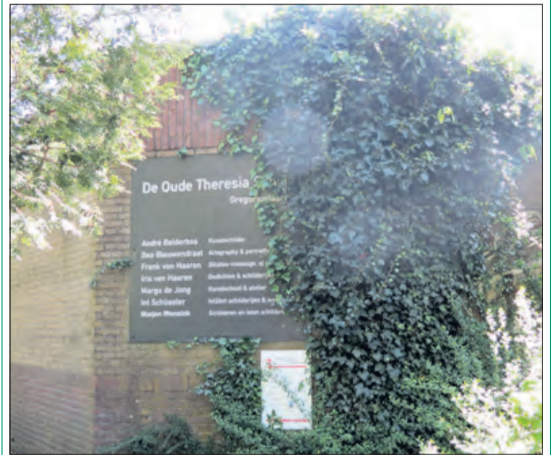
De maatschappelijke initiatieven in de oude Theresiaschool worden alom gewaardeerd.