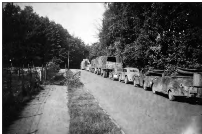
De aftocht van de Duitsers. (De kolonne van de vertrekkende misschien vluchtende Duitsers staat geparkeerd op de Bilderdijklaan); de foto is van iemand die daar in 1945 tegenover Zonneheuvel woonde).

Aan het einde van de oorlog traden de Duitsers zonder enig pardon op. Gruwelijk was ook het lot van de