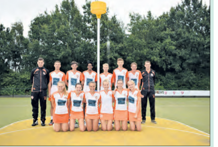
Jammer voor het team van TZ A1 dat de sportcompetities vanwege de coronamaatregelen niet afgewerkt konden worden. Met nog twee wedstrijden te gaan en een voorsprong van drie punten lag de titel binnen handbereik. Volgens het KNKV geen kampioen, maar de supporters denken daar anders over. (Bram Hund)