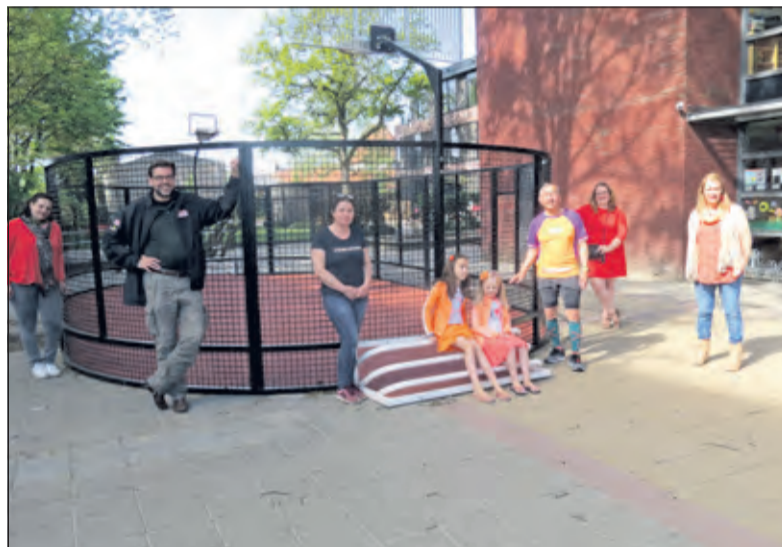
De onlangs geplaatste Pannakooi past mooi bij het bewegingsonderwijs.