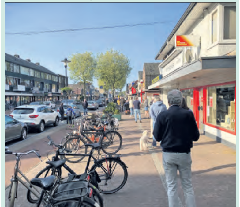
Op de Hessenweg heeft zich een lange rij gevormd op weg naar de oranjepoezen van Van Ingen.