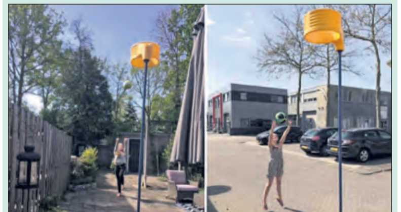
Novaleden korfballen thuis.

'We mogen weer!' Dat was de reactie van veel sportclubs op de regeringsmededeling van 21 april. Kinderen tot en met 12 jaar mogen weer georganiseerd samen sporten en kinderen van 13 tot en met 18 jaar mogen dit ook, maar op 1,5 meter van elkaar. Hoe organiseer je dit veilig en hoe korfbal je op 1,5 meter van elkaar?