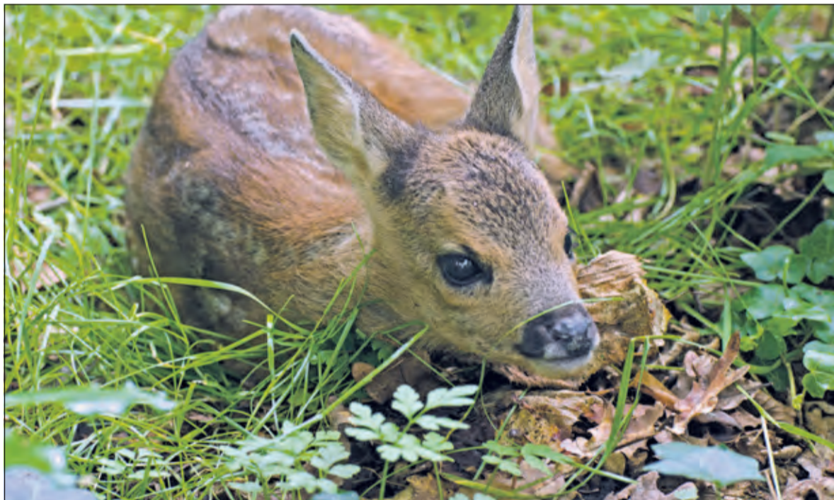
Hertenjongen liggen vaak alleen op een stil, beschut plekje. Moederhert is vast in de buurt, ook al is zij niet zichtbaar: laat het hertje daarom met rust.