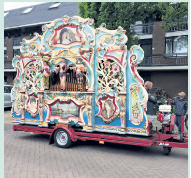
'De Blauwe Gavioli' uit 1905 in actie in De Bilt