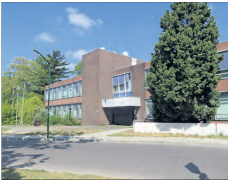
Op de politiebureaulocatie aan de Leyenseweg is een mooie gemengde buurt te realiseren.

De raad gaat met 19 stemmen voor en 7 tegen akkoord met de 'Startnotitie Water- en rioleringsplan en klimaatstrategie 2021-2025' en