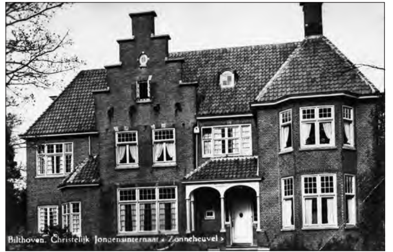
De commandobunker kwam naast de villa Zonneheuvel in de driehoek Tollenslaan, Bilderdijklaan, Hasebroeklaan.

joodse fotograaf Salomon de Wolf. Na verhoor in Utrecht (het Wolvenplein) werd hij op 23 januari voor zijn huis aan de Soestdijkseweg-Noord met 7 anderen gefusilleerd. Eveneens een represaillemaatregel.