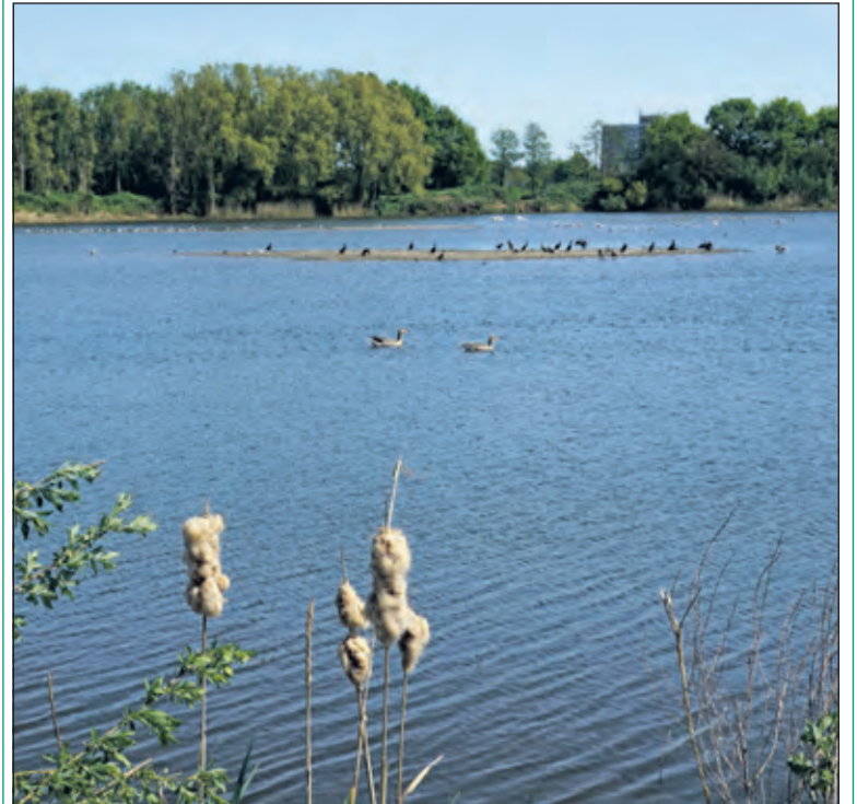
De Hooge Kampse Plas stond jaren bekend als 'stinkgat' vanwege de stank door stort van huisvuil. Na de sanering werden er onlangs ecologische oevers en eilandje aangelegd, waar nu de vogels kunnen rusten.