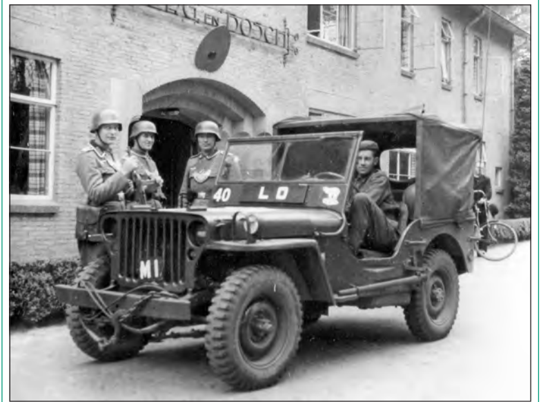
Het sanatorium Berg en Bosch.

- verantwoordelijk voor de watervoorziening van De Bilt, ook tijdens het Duitse bewind- was een mitrailleurpost. Ook dat gebied achter de Julianalaan -de Sperwerlaan bestond toen nog niet-werd op het einde van de oorlog afgesloten.