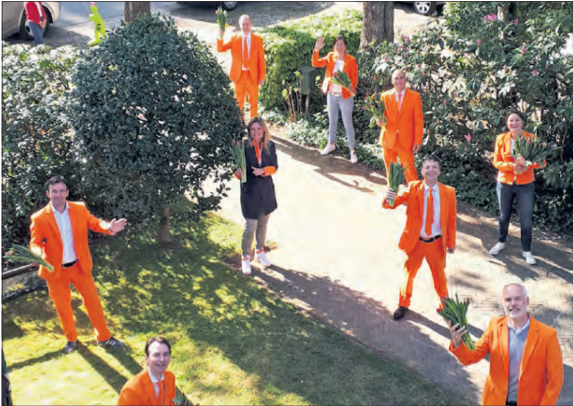
Oranjevereniging Groenekan maakte Koningsdag toch nog een beetje feestelijk. Alle inwoners van Groenekan kregen persoonlijk een bosje tulpen overhandigd vergezeld van een kaartje met fleurige groet.