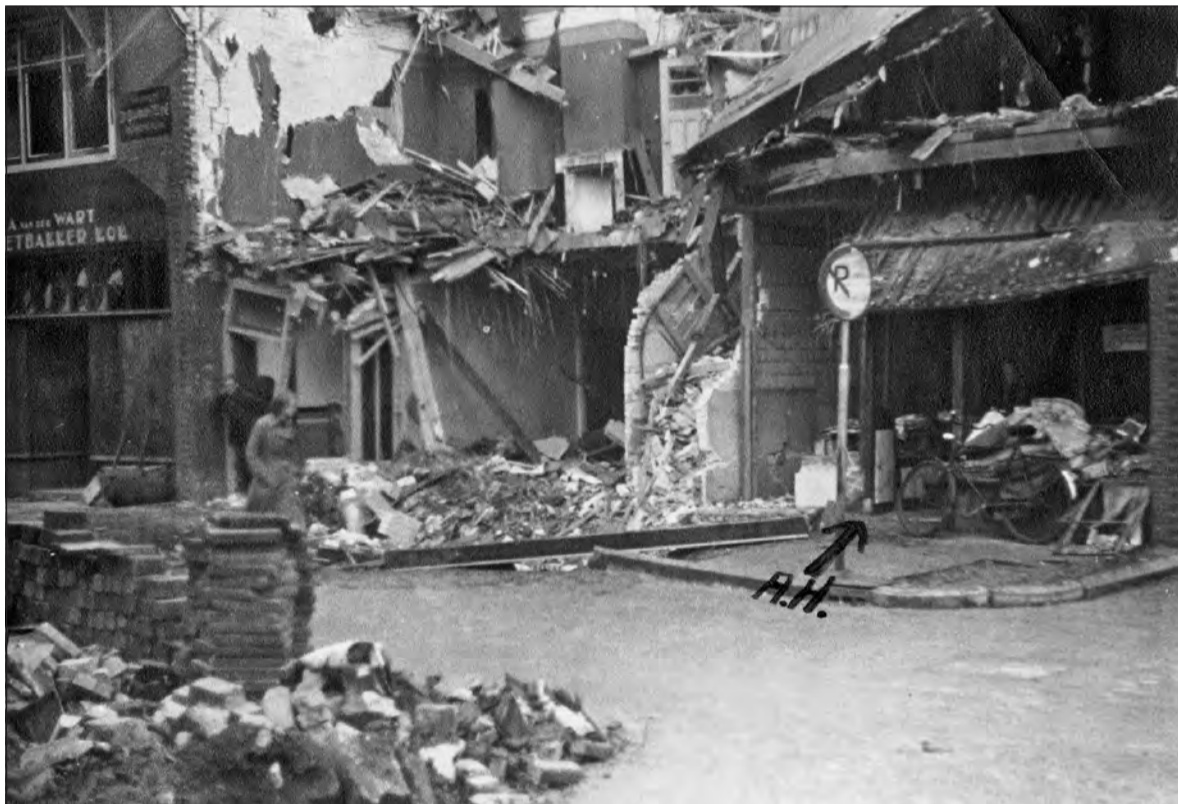
Het gebombardeerde Emmapplein. Op nr. 12 was een AH-vestging.