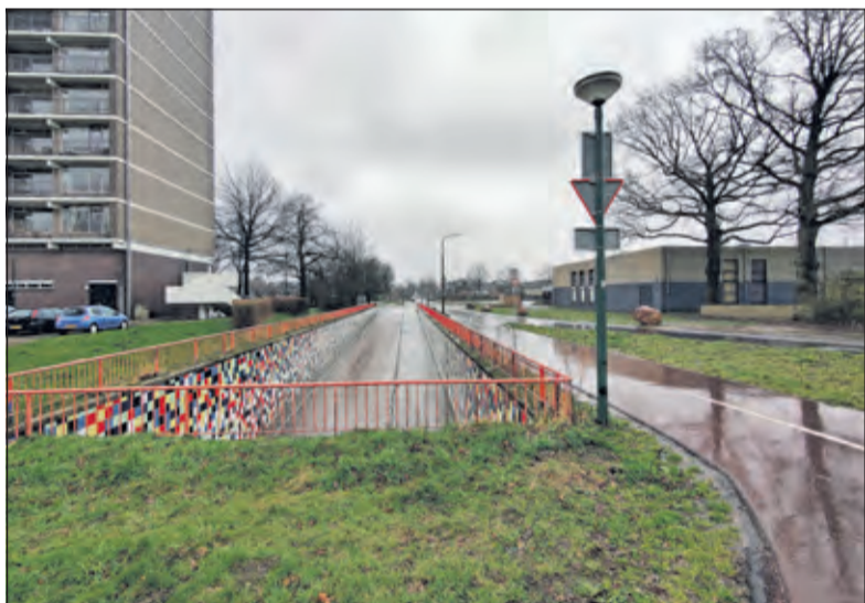
'De Prof. Dr. Asserweg eindigt in een zeer onduidelijke fietsstraat met rare fietsroutes zowel bij de rotonde Biltse Rading als komende vanuit de fietstunnel'. [foto vanaf rotonde]

dat dit pakket van maatregelen het sluipverkeer ontmoedigt: 'Er zijn geen of nauwelijks files meer. Nu is er voor de inwoners zeer veel ongemak en grotere onveiligheid en oponthoud ontstaan. Zij vragen dan ook de gemeenteraad en het college zeker voor de inwoners aan en ten zuiden van de Looydijk de maatregelen in heroverweging te nemen.