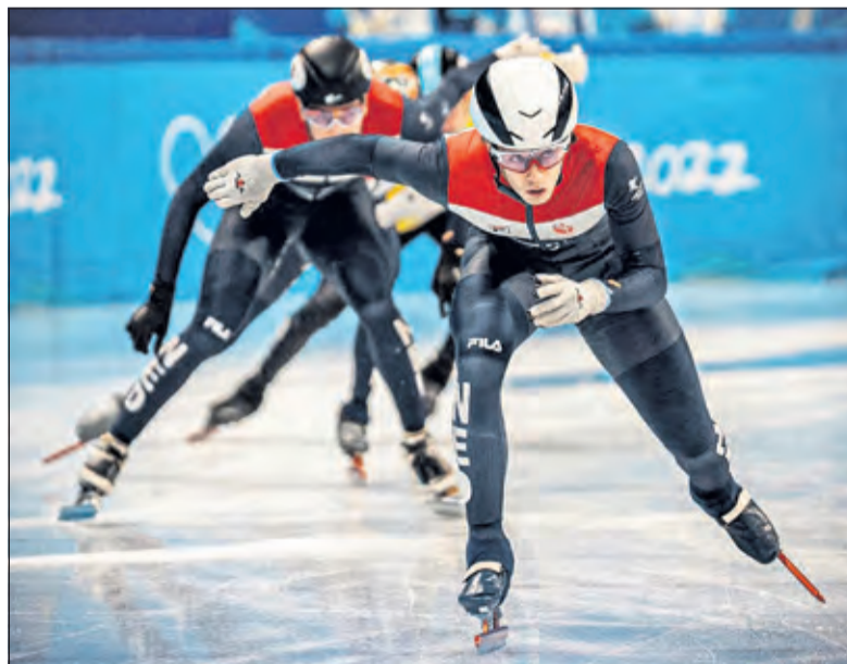
Shorttracker Steenaart trainend op het Olympisch ijs.

Op zondag 13 februari bezocht Steenaart ook de shorttrackwedstrijd. Voor hem was dit een erg bijzondere middag. Hij mocht naast de voorzitter van het Internationaal Olympisch Comité (IOC) zitten: 'Hij wilde graag naast een paar atleten zitten en toen was aan TeamNL gevraagd of ze iemand wisten. Natuurlijk wordt dat niet iemand die nog bezig is met de wedstrijd, maar