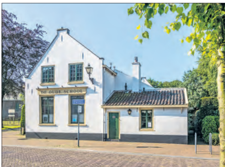
Het gebouw aan de Burgemeester de Withstraat.

De Biltse school verhuisde in 1845 naar de verbouwde rijtuigenfabriek van Soeders aan de Dorpsstraat vanouds Steenstraat, thans nummer 25. Dat pand was in 1844 verbouwd tot raadzaal, schoollokaal, onderwijzerswoning en cachot. In 1846 kocht het kerkbestuur van de Nederlands-hervormde kerk het leeggekomen schoolgebouw en vestigde er een bewaarschool in. Tot 1873 bleef de bewaarschool in het pand gehuisvest. De Oude School is in de loop der jaren diverse malen uitgebreid en verbouwd.