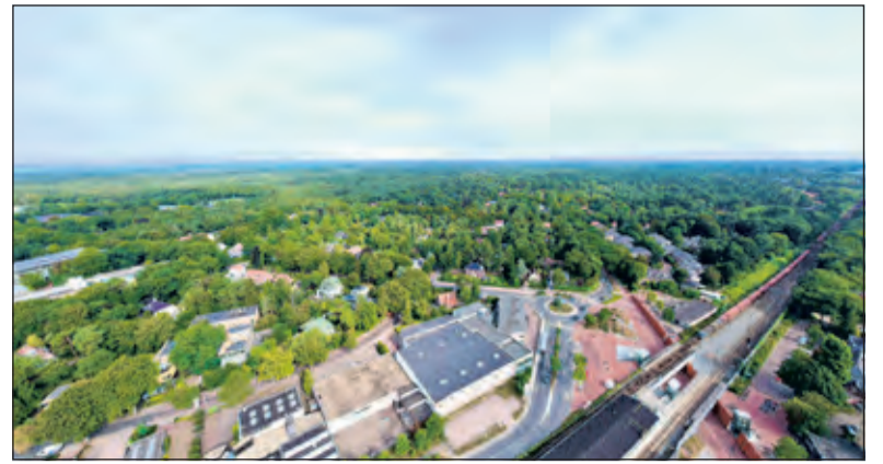
Bilthoven-Noord is uitgebreid onderwerp van gesprek tijdens de commissievergadering.

'Het alternatief dat het college voorstelt gaat ervanuit om een aantal knelpunten op te lossen', aldus de