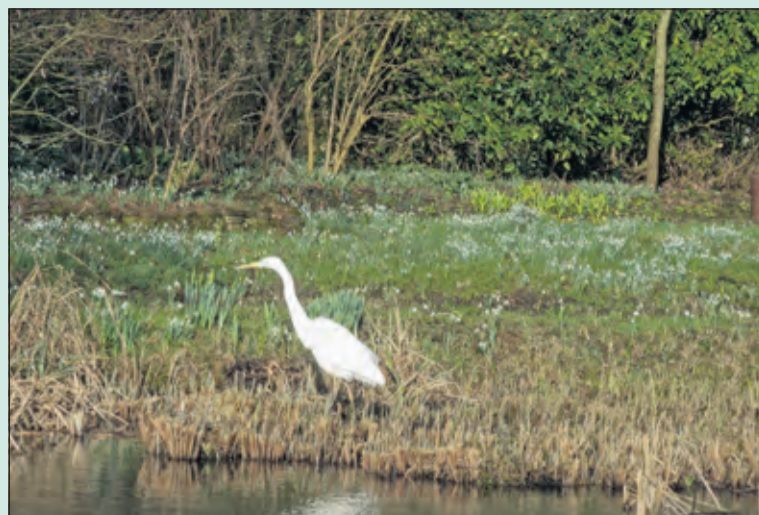
Komende zaterdag, 26 februari zal de Moeras- en Stinzenplantentuin wit zijn van massaal bloeiende sneeuw- en lenteklokjes. Daartussen bloeien dan ook al veel andere stinzenplanten, zoals Helleborus, narcis en krokus. De toegang is vrij, tussen 10.00 en 17.00 uur op de Kerkdijk 132 (tuiningang) in Westbroek. Parkeren alleen aan de weilandkant.