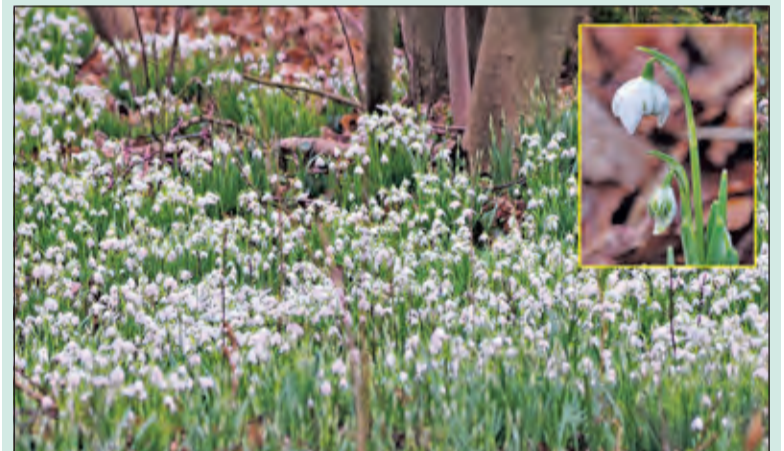
De sneeuwkllokjes zijn al massaal verschenen op landgoed Oostbroek van het Utrechts Landschap. Dit landgoed geniet landelijke bekendheid vanwege zijn diverse soorten sneeuwkllokjes. Grote delen van het landgoedbos kleuren wit, wat vanuit de bewegwijzerde rood-gemarkeerde rondwandeling goed te zien is. (Eugène Jansen)