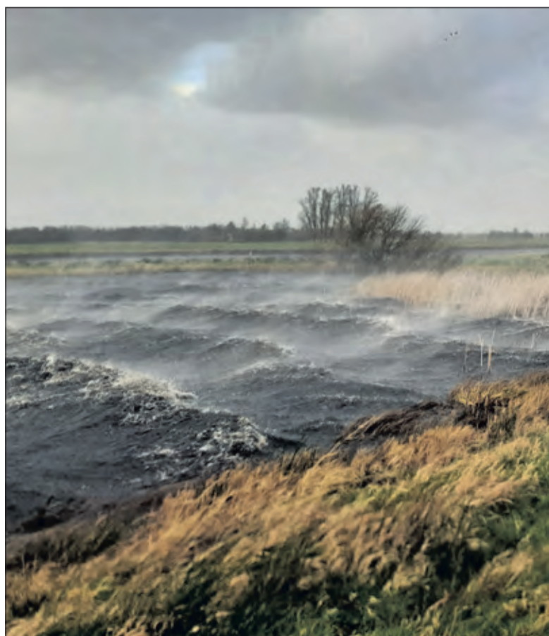
De wind golft door het rietland.