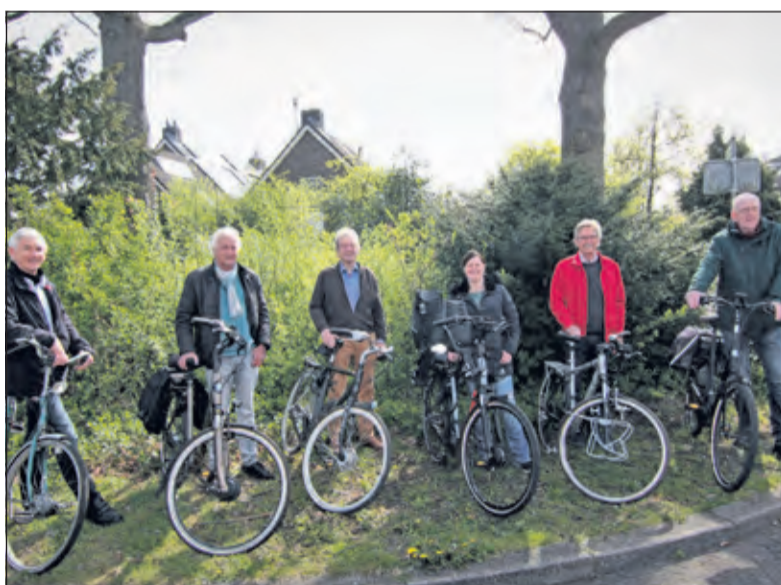
De wijkraad in april 2021 in de groene wijk.