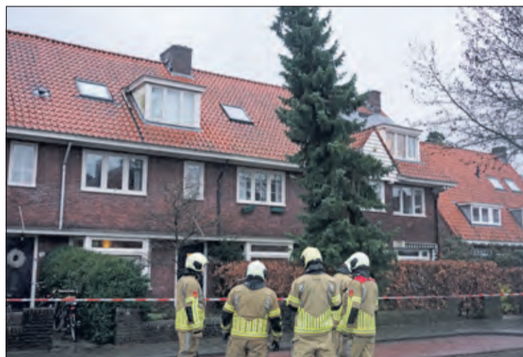
Zondagmiddag was de brandweer bezig een scheef gewaaide spar op de Steenen Camer in Bilthoven om te zagen. Door de storm van de afgelopen dagen waren de wortels losgetrokken uit de ondergrond en dreigde de boom op de achterliggende woning te vallen.