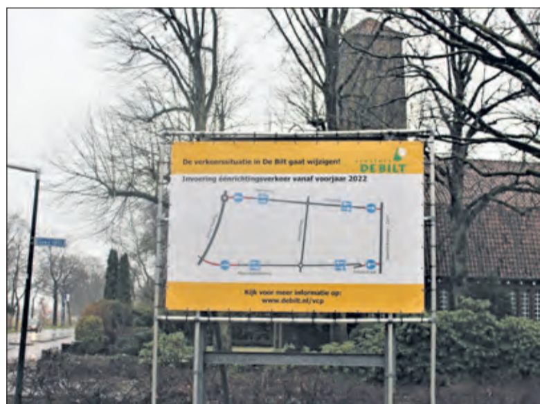
De komende maanden worden de aan deze wijzigingen gekoppelde werkzaamheden uitgevoerd. Om verkeersoverlast te beperken wordt het werk 's avonds en 's nachts gedaan. De wegen worden dan afgesloten voor het verkeer.