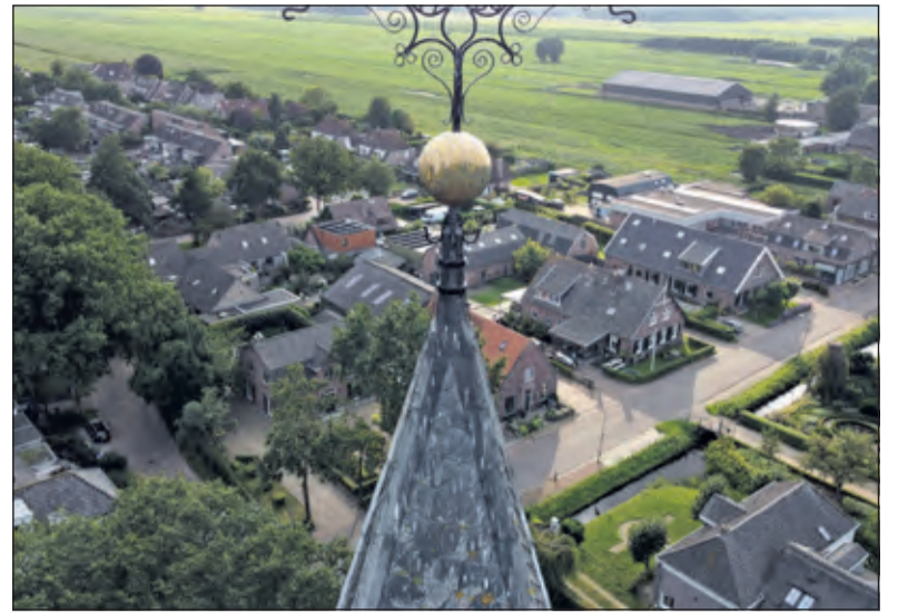
Vergulde bol onder het kruis heeft z'n glans verloren.