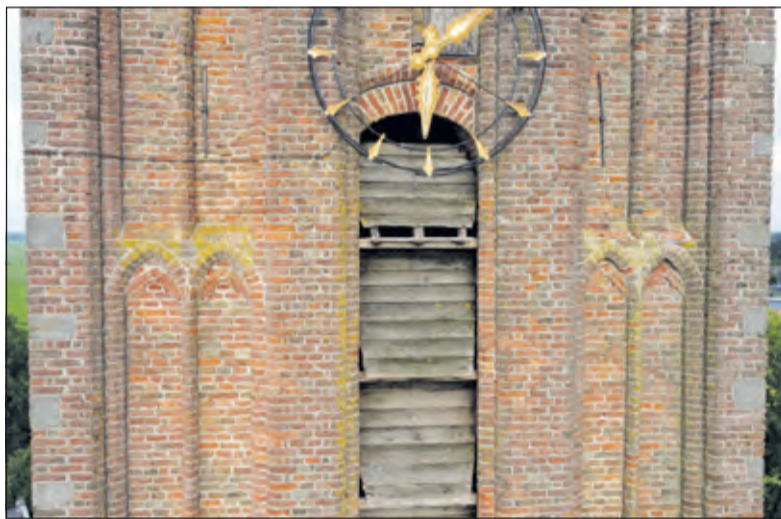
De galmborden van het kerkgebouw aan de Kerkdijk zijn volgens Tijsma in zeer slechte staat.

De ramen en roeden van de NH ker van Westbroek zijn afgelopen jaren goed onderhouden. Het onderhoud van de ramen en roeden van de gemeentelijke zijkapellen en dat van de galmgaten laat echter te wensen over. Een galmgat is een betrekkelijk smalle opening in de muur van een toren ter hoogte van de klokken, waarin vaak horizontale, schuin geplaatste galmborden het geluid van de luidende klokken naar buiten en naar beneden leidt. De galmborden van het kerkgebouw aan de Kerkdijk zijn in zeer slechte staat. Er is zelfs een plank op ongeveer 25 meter hoogte losgeraakt. Verder mankeert op verschillende plaatsen het voegwerk. De vergulde bol op de spits, is zijn glans kwijt geraakt.