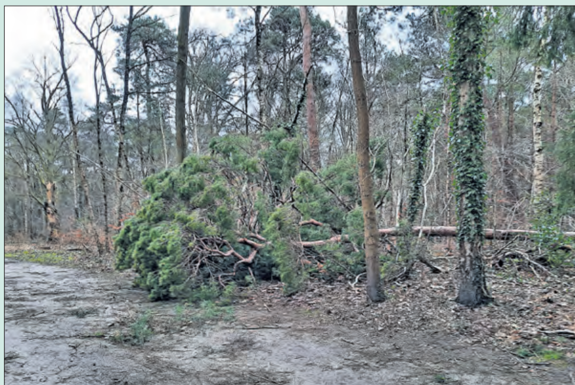
De storm Eunice heeft ook in het Leijense bos toegeslagen.