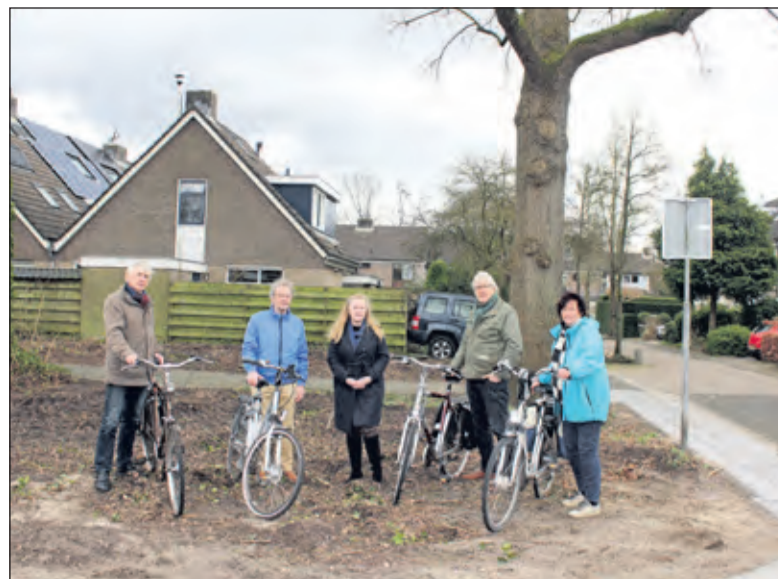
De wijkraad staat in februari 2022 bij de kaalslag.

De Wijkraad De Leijen vraagt alle politieke partijen, die meedoen aan de gemeenteraadsverkiezingen,