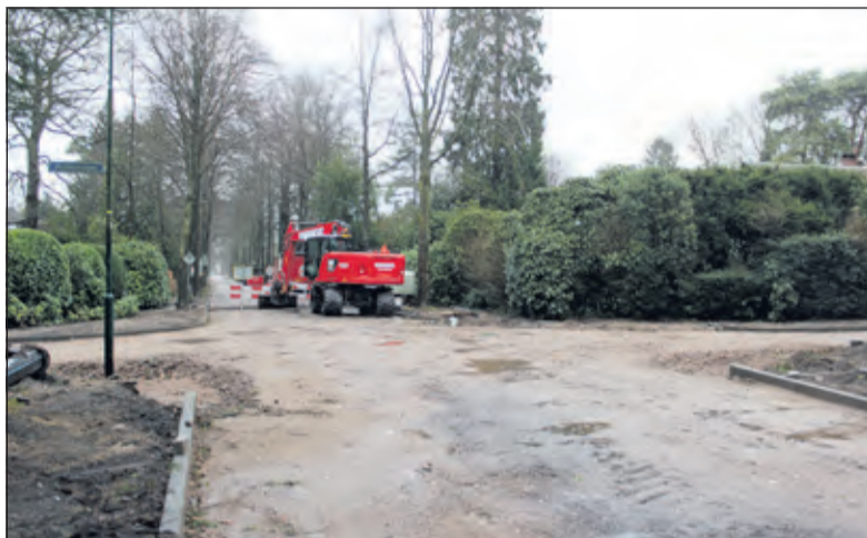
Er valt nog heel wat te doen aan de kruising Hobbema- Gezichtslaan.

De werkzaamheden worden gefaseerd uitgevoerd waarbij de verharding wordt opgebroken, de riolering wordt vervangen - inclusief de huisaansluitingen tot de erfgrens - waarna er weer verharding wordt aangebracht. Tevens worden de lichtmasten voorzien van LED-verlichting. De bomen blijven behouden.