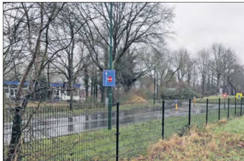
Rijgend over de Biltse Rading kan men niet via de (verlengde) Asserweg De Bilt 'in'.