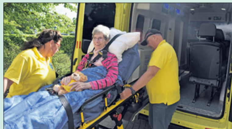
Klaar voor de reis naar België.

Iemand die ernstig ziek is, heeft vaak nog een wens. Nog een keertje naar familie toe, die verder weg woont, kan zo'n wens zijn. Een eenvoudige wens, die voor sommigen niet altijd vanzelfsprekend is. In deze vraag voorziet de Stichting Veluwe Wens. Wie meer wil weten over deze stichting: www.veluwewensambulance.nl