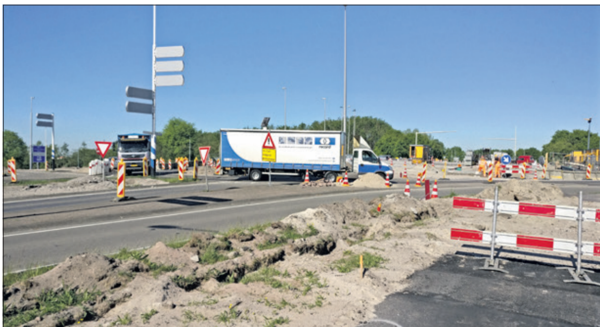
Het begint duidelijk te worden hoe de situatie na de aanpassing eruit komt te zien.

de oude aansluiting Bilthoven gesloopt. Tevens wordt de nieuwe situatie van de aansluiting Bilthoven gerealiseerd. Hiervoor worden de huidige toe- en afritten gefreesd en opnieuw geasfalteerd, zodat deze aansluiten op de nieuwe situatie. Daarnaast worden de verkeersregelinstallaties aangebracht. Als laatste wordt aan het eind van dat weekend de nieuwe belijning aangebracht.