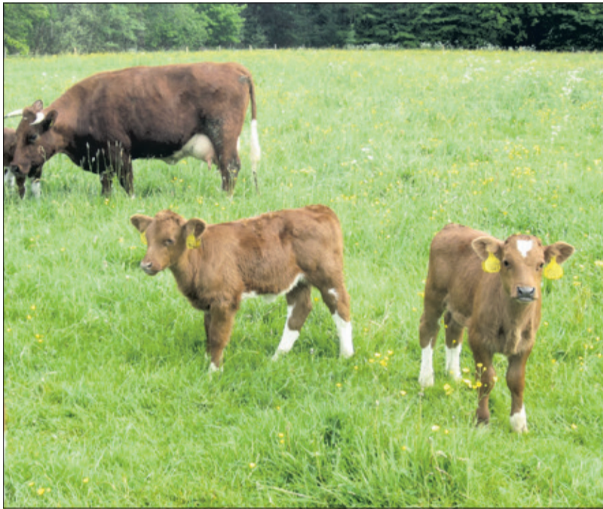
Iste Pinksterdag is er een rondleiding over het landgoed Sandwijkstraand.