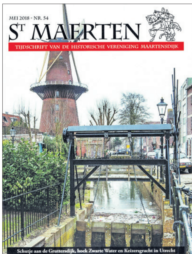
De omslagfoto van de nieuwe Sint Maerten geeft een impressie van één van de Maartensdijkse schutjes, die door de loop van de geschiedenis inmiddels is gelegen op het grondgebied van de stad Utrecht.

De verkooppunten voor de losse verkoop van St. Maerten zijn: Bouman Boekhandel, Hessenweg 168, De Bilt, Van der Neut b.v., Groenekansweg 5, Groenekan, Kapper Hans Stevens, Maertensplein 26, Maartensdijk en de Bilthovense Boekhandel, Julianalaan 1 te Bilthoven. (Frank Klok)