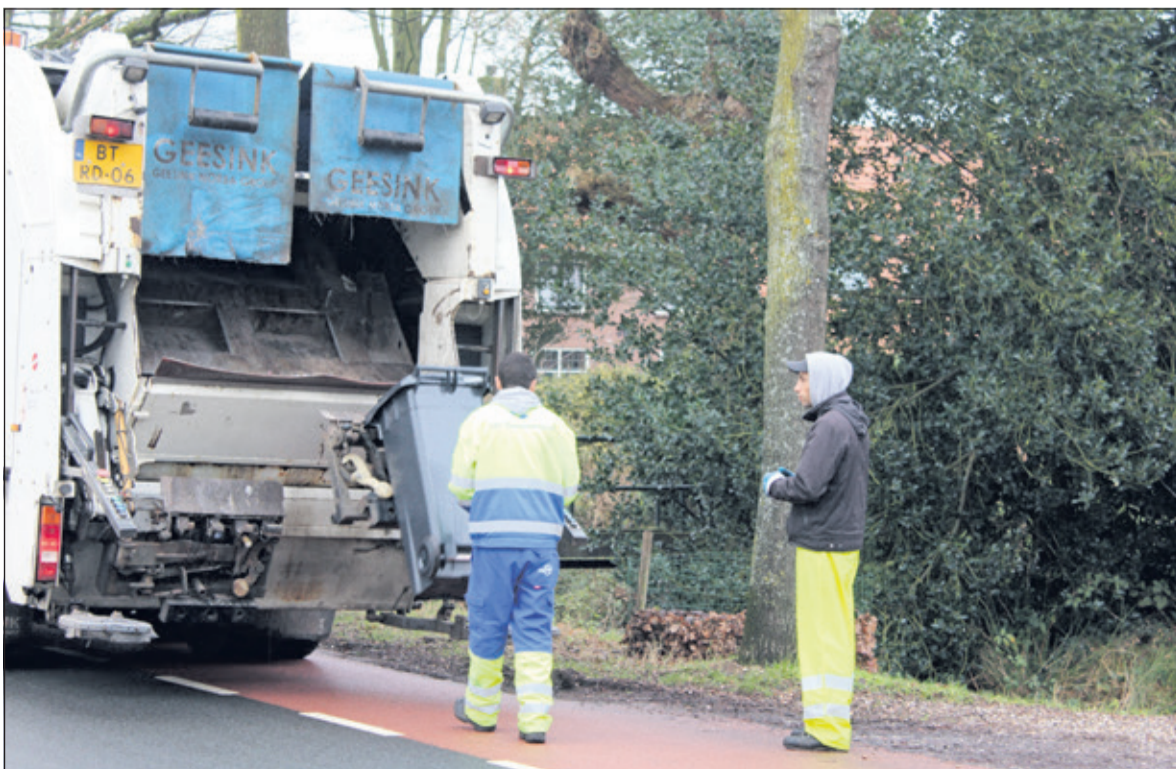
Minder restafval door afvalscheiding.

In opdracht van de gemeente controleerden zogenaamde grondstofcoaches eind april steekproefsgewijze