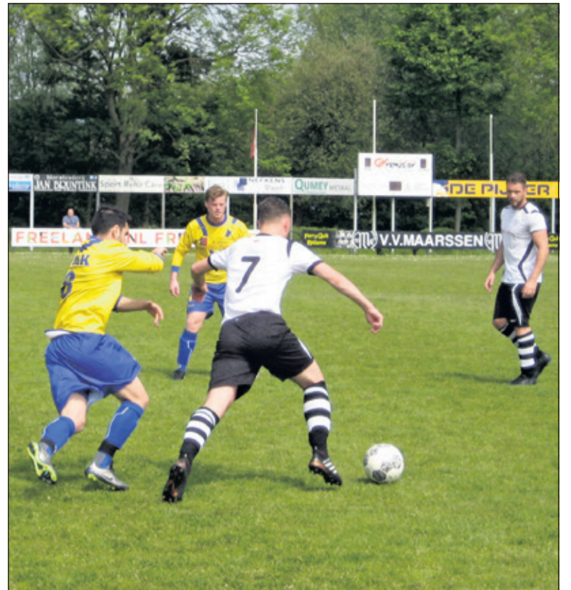
SVM heeft het lek nog niet boven.

Er resteren nog twee reguliere competitieronden: a.s. zaterdag fungeert SVM als gastheer tegen (inmiddels) kampioen Benschop en een laatste ontsnappingsmogelijkheid is er nog op 26 mei in Culemborg tegen Focus '07. (Nanne de Vries)