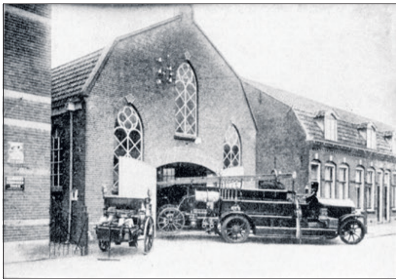
Het tot Brandweerkazerne verbouwde voormalige kerkgebouw, in de voorgevel (aan de Nieuwstraat) zijn nog de oorspronkelijke kerkrampen aanwezig en de aanpalende woningen zijn anno 2018 er ook nog. Aan de zuidzijde is de Molenkamp gerealiseerd.

In publicaties van de Historische Kring in De Bilt is te lezen over de geschiedenis van kerk en het kerkgebouw. De gemeente is in 1965 als huiskring begonnen. Omdat deze huiskring groeide, werd er vanaf september 1969 een zaal gehuurd in 'De Meteor' aan de Planetenbaan. Dit was een in 1961 tot noodkerk verbouwde schuur, oorspronkelijk bestemd voor de St. Laurensparochie. Ook de Hervormde Wijkgemeente heeft tot 1964 de schuur als noodkerk gebruikt. Vanaf 1974 maakte de Volle Evangelie Gemeente ook nog gebruik van een voormalig Ned. Hervormd wijkge-