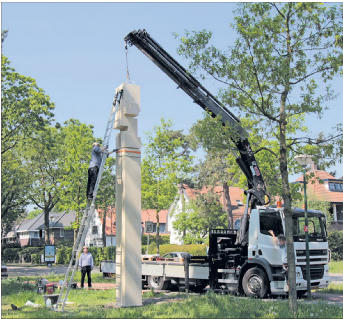
Het kunstwerk werd woensdag 9 mei op de hoek van de Julianalaan en de Paltzerweg geplaatst.

Tellegen maakte twee nieuwe kunstwerken voor De Bilt in het kader van het 100-jarig bestaan van kunststroming De Stijl in 2017. Het eerste werk werd op 9 mei geplaatst in Bilthoven op de hoek van de Julianalaan en de Paltzerweg. Het tweede beeld volgt later in deze maand in De Bilt bij de rotonde vanaf de Biltsche Rading naar 't Beukenlaantje.