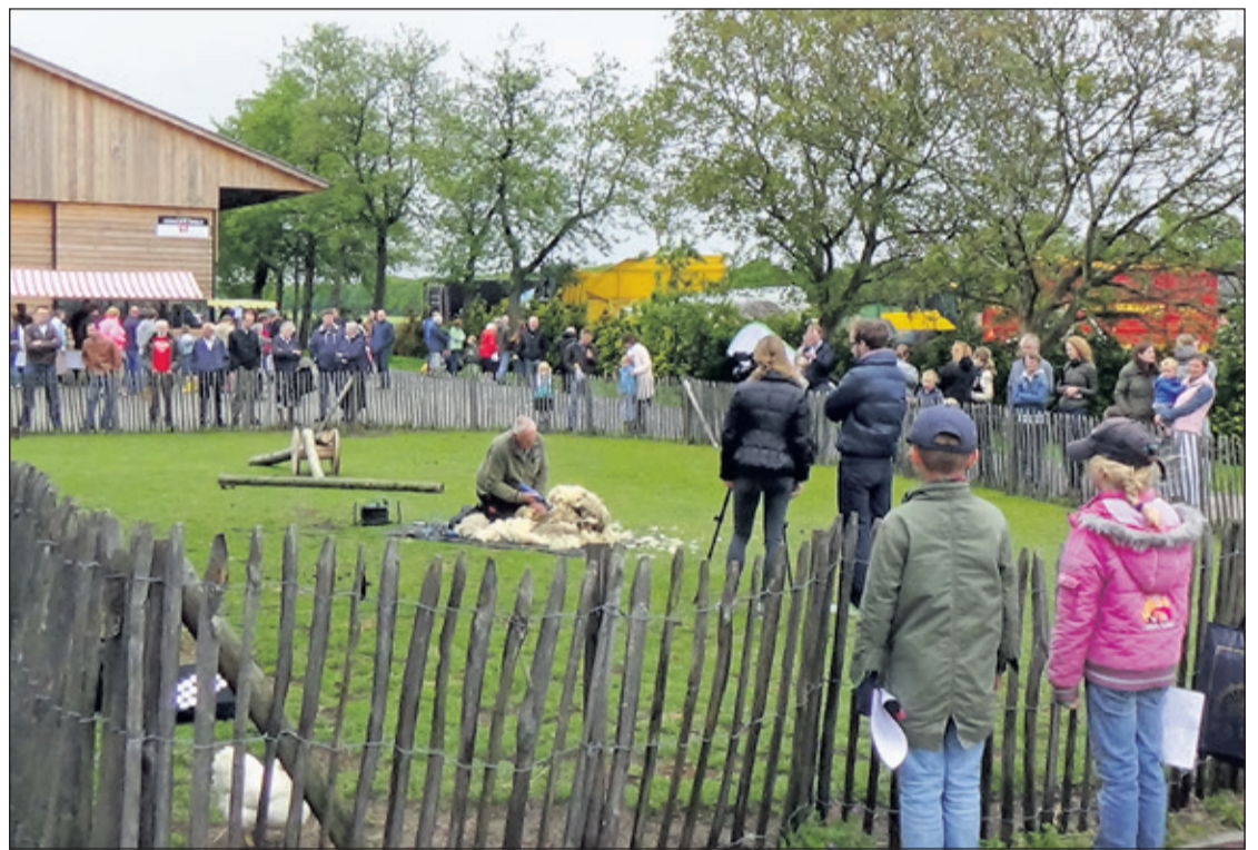
Demonstratie schaapscheren tijdens de lentemarkt.

De opbrengst van deze dag komt dankzij sponsoren ten goede aan de (nood-)hulp die stichting HCR in Bacau (Roemenië) verleent. Dit project is in 1995 opgericht om school- en gezinsverlating te voorkomen. De doelen van het project zijn: kinderen binnen het gezin houden, zorgen dat kinderen naar school blijven gaan, (re-)integratie van kinderen of jongeren in hun school, opname van kinderen in tehuizen tegengaan en voorkomen van het uiteenvallen van gezinnen. Jaarlijks nemen aan dit sociale project meer dan 1000 mensen deel.