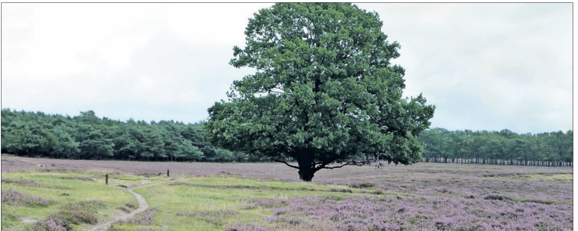
De Hoorneboegse hei is uitgangspunt van de natuurverbinding tussen oost- en westkant van de A27.

over de ontstane patsituatie. Deze adviescommissie zou moeten proberen om met behulp van een bureau met een nieuw en zo mogelijk unaniem advies te komen. Het GNR zei daarbij toe, dat als de commissie een unaniem advies zou uitbrengen, het wel heel gek zou moeten lopen wanneer het GNR dit advies niet zou overnemen. Er werd een commissie van 10 personen door de provincie Noord-Holland ingesteld. De keuze geschiedde op basis van opgestuurde CV's. In de commissie zaten zowel voor- als