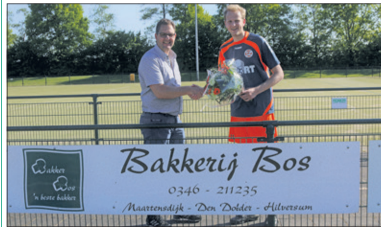
Bakker Bos heeft het contract verlengd.

Het was afgelopen zaterdag druk op de TZ velden en dit keer niet alleen met spelers en hun supporters maar ook met sponsors. Allen werden uit dankbaarheid door het bestuur en de sponsorcommissie met een bloemetje in het zonnetje gezet.