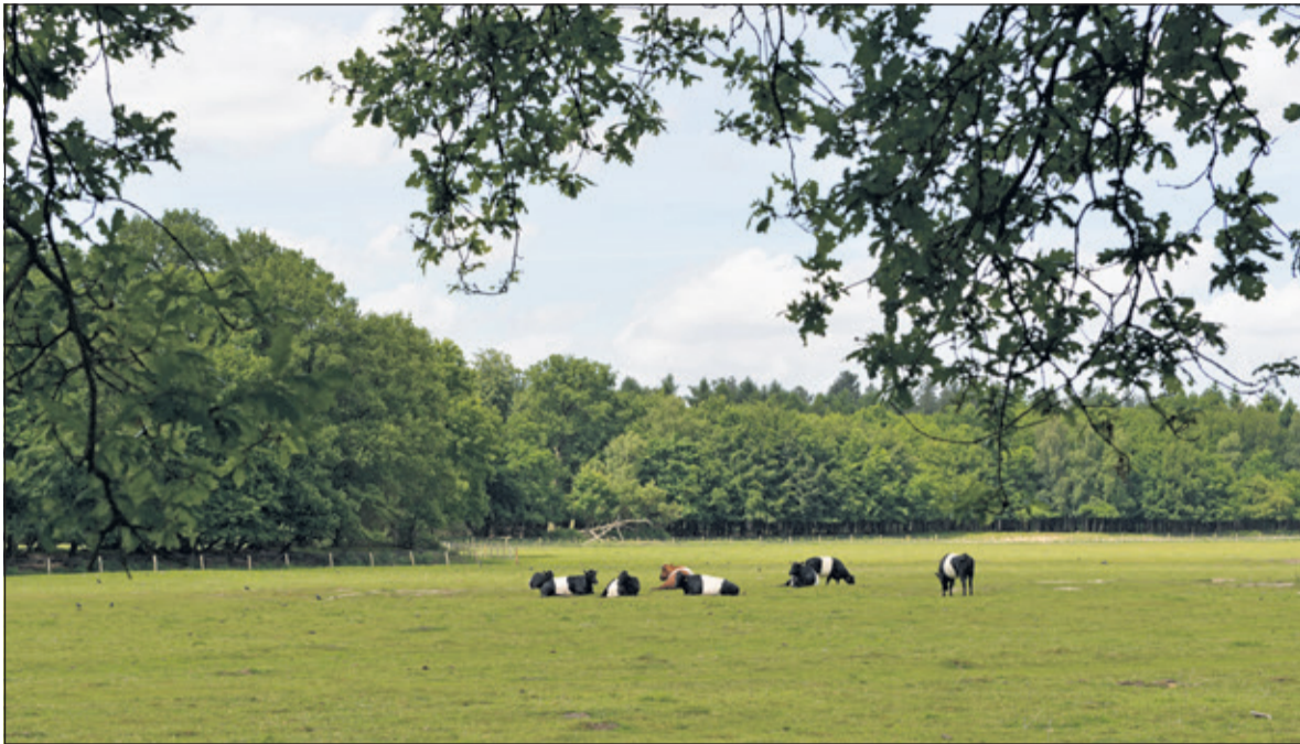
Ontdek de mooiste plekjes tijdens de Landschapswandeling.

De ANWB en de 12 provinciale landschappen organiseren op zondag 27 mei voor het eerst een Landelijke Wandeldag om te genieten van de lente in de ontluikende natuur van de provinciale Landschappen.