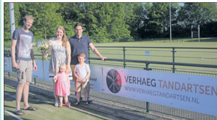
Tandarts Verhaeg is een nieuwe sponsor bij Tweemaal Zes.

Het is mei, koeien gaan weer naar buiten wat ze uitbundig blij dansend dan uit een vlaai en een plas doen ze nu in het gras en de boer kan de stal schoon gaan spuiten