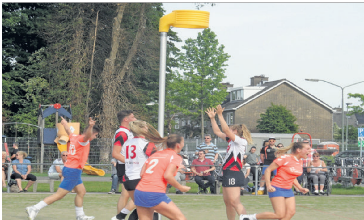
DOS scoort en Sporting Delta blijft vertwijfeld achter.

Na een vrij Pinksterweekend speelt DOS zaterdag 26 mei de laatste thuiswedstrijd. De wedstrijd tegen Rohda begint in Westbroek om 15.30 uur.