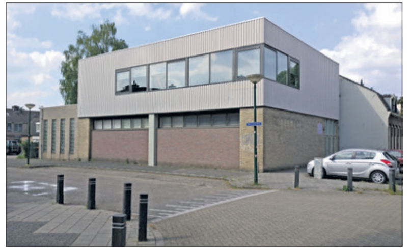
De Nieuwstraatgemeente VEG De Bilt op de hoek van de Molenkamp en de Nieuwstraat in De Bilt.