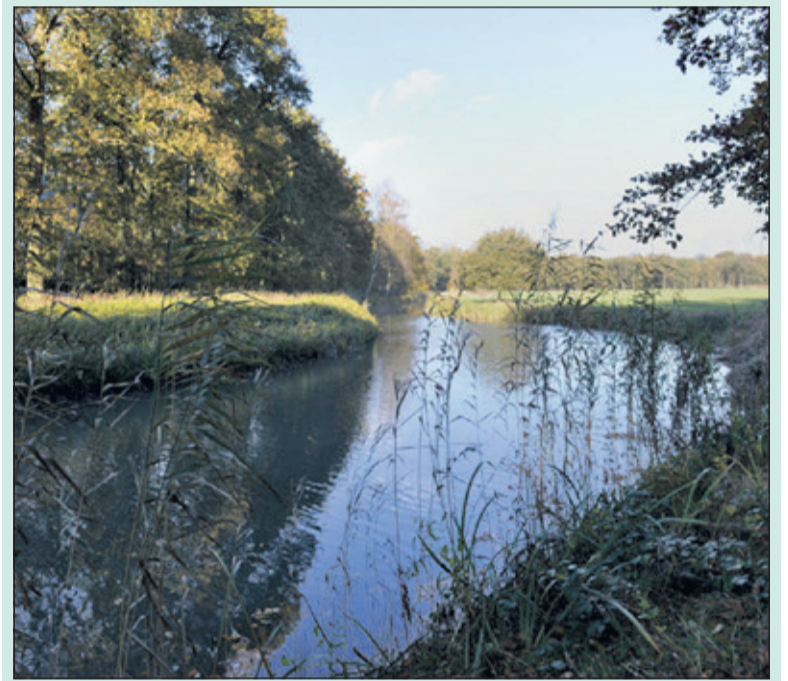
Landgoed Beerschoten in De Bilt behoort tot de mooiste landgoederen van de Utrechtse Heuvelrug.

Huize Houdringe is in 1779 gebouwd. Rondom het huis is de tuin deels in de Engelse landschapstijl en deels in de Franse barokstijl aangelegd. Tijdens deze wandeling vertelt de gids over de rijke historie van deze landgoederen. De wandelingen starten beide dagen om 14.00 uur vanuit Paviljoen Beerschoten (Holle Bilt 6, De Bilt) en duren anderhalf tot twee uur. Deelname is gratis Vooraf aanmelden (is nodig) op website Utrechts Landschap bij 'activiteiten'. (Trees Althues)