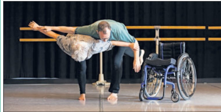
De uitdaging zit in het samen bewegen; oog hebben voor elkaar en mogelijkheden scheppen, dat is wat Inclusiedans is.