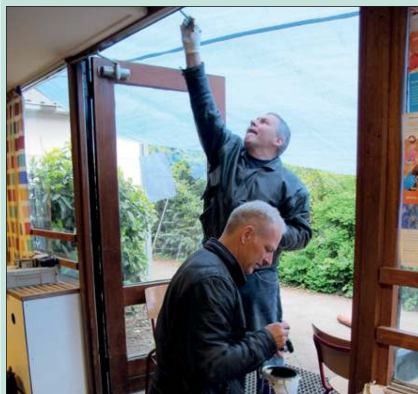
Het gebouw werd van onder tot boven van nieuwe verflagen voorzien door ouders en bestuursleden en oudere scouts van scoutinggroep Ben Labre.