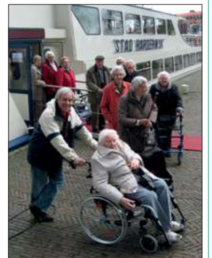
De Zonnebloemgasten hebben na een prachtige tocht op het Veluwemeer weer vaste grond onder hun voeten.