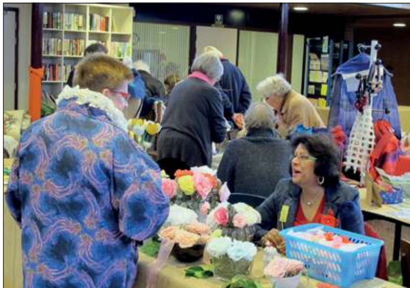
Iedere deelnemer aan de Creatiefbeurs bij WVT kon een goed verhaal vertellen over de totstandkoming van het meegebrachte of ter plekke tot stand komende werk.