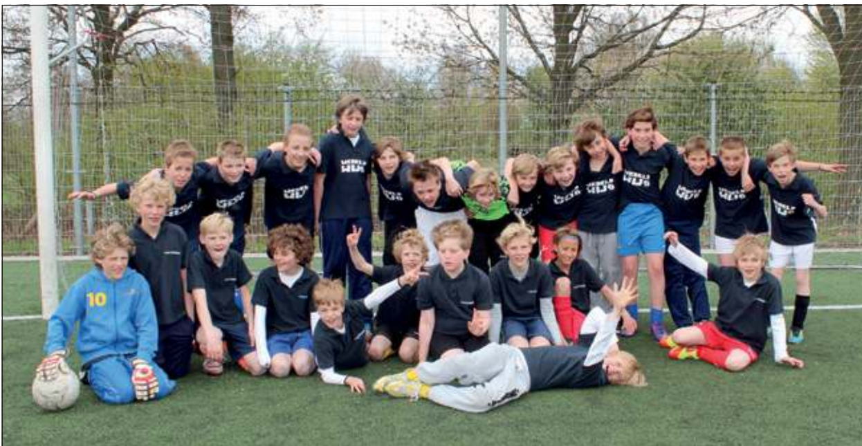
De teams van Nijepoort2 en Wereldwijs1 (achterste rij) speelden op veld 4 tegen elkaar. De organisatie zorgde wel voor onderscheidende kleding tijdens de wedstrijd. [HvdB]

Onder frisse, maar goede voetbalomstandigheden vond onder goede publieke belangstelling het 2de gedeelte van het schoolveldvoetbaltoernooi voor de Biltse basisscholen jl. woensdag op de velden van FC De Bilt