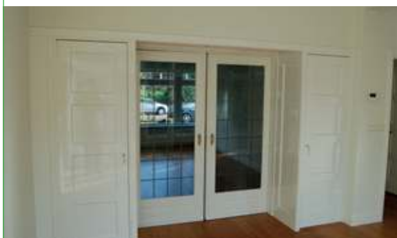
kamer en suite

Robouw BV - Molenkamp 30 3732 EV De Bilt Tel. 030-2280478 Mob. 06-54228555 info@robouwbv.nl www.robouwbv.nl