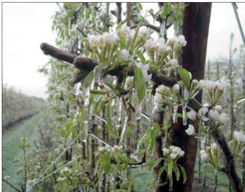
De perenbloesem na nachtvorstberegening van 16 april.

Tijdens deze dag is er uitleg over de nieuwe koelcellen, je kunt er inkijken en je krijgt te horen hoe het toch komt dat er in juni nog een perfecte appel uit de koelcel komt. Er is een rondleiding door de boomgaard met voorbeelden van machines die nodig zijn voor de pluk. Atelier Wollebol laat haar werk zien. En natuurlijk in het jaar van de bijen is er een imker aanwezig om ook daar over te vertellen. Voor de kinderen zijn diverse activiteiten aanwezig, zoals appel-peren sap proeven, een springkussen, tractors en een trampoline. De appels, peren, sappen