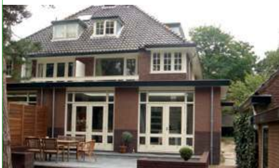
aanbouw met terras