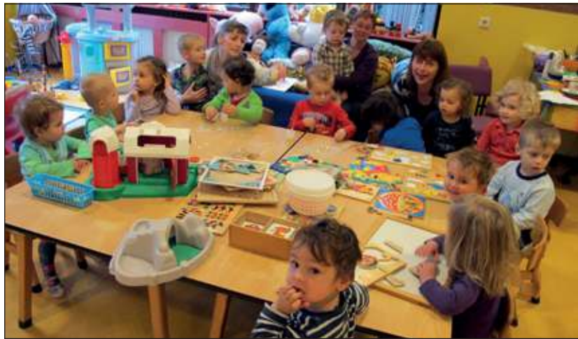
Het peuterwerk is een goeddraaiende activiteit in de accommodatie van WVT.