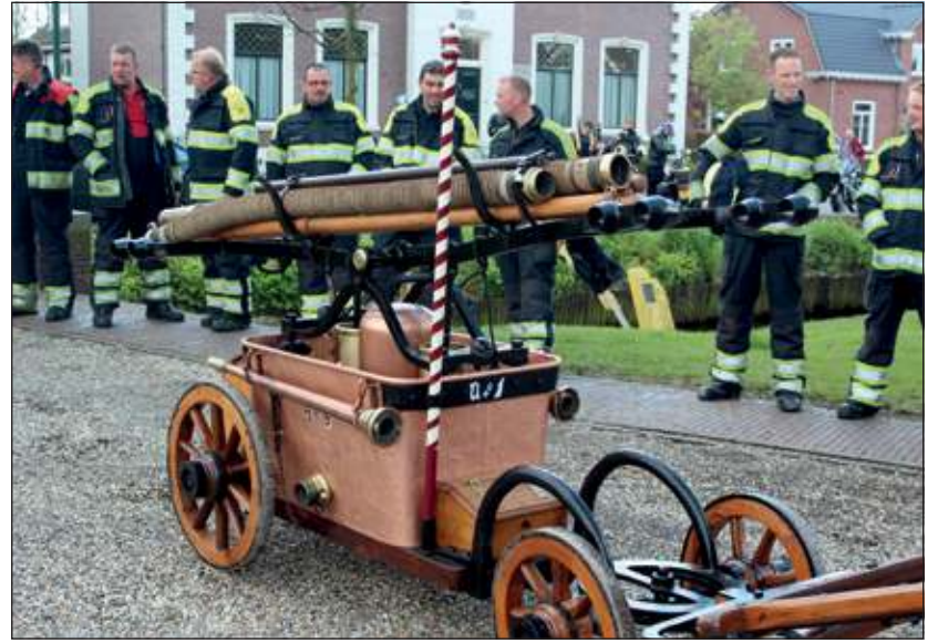
Leden van de Westbroekse brandweer verwelkomen de oude handspuit.