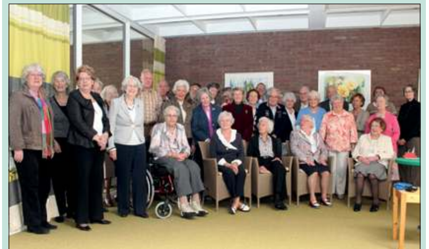
Zondag 22 april vond de zgn. Lente-bridge-drive in parkflat Houdringe plaats.

Aan de kerst- en de lentedrive wordt altijd veel aandacht geschonken. Naast het bridgen kan men in huis ook biljarten, koersballen en deelnemen aan gymnastiek. In de zomer wordt er ook 'jeu de boules' gespeeld. 8 keer per jaar wordt er een avondvullend programma gepresenteerd. Om de dag kan men 's ochtends gezamenlijk een kopje koffie drinken en tegen de avond een glaasje. Er is een bibliotheek met een zgn. wisselcollectie van de bibliotheek van Bilthoven. Daarnaast is het voor de kinderen en andere familieleden, die op een grotere afstand wonen, een voordeel dat ze tegen een geringe vergoeding kunnen logeren; kamers met gedekte bedden, eigen douche en toilet. 'Het is er goed toeven in Houdringe'.