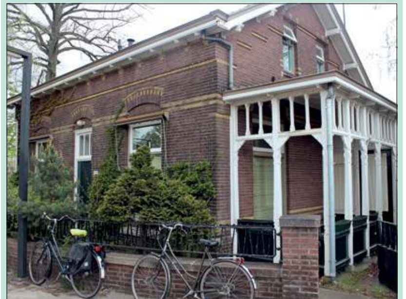
De voormalige stationchefswooning verdwijnt binnenkort.

Sloop van de stationschefswooning bij station Bilthoven komt in zicht. De sleuteloverdracht staat gepland voor 26 april, de verwachting is dat niet lang daarna wordt gestart met de sloop. De exacte datum is echter nog niet bekend.