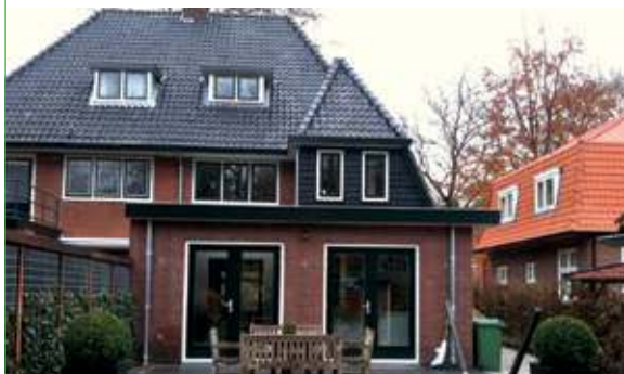
aanbouw met opbouw

Bouwen en verbouwen is Ron zodoende van jongs af aan met de paplepel ingegoten. Service en kwaliteit zijn de speerpunten van ROBOUW een visie die ROBOUW ook in deze moeilijker tijden uit wil dragen, vandaar ook dat ROBOUW begin dit jaar is verhuisd naar een groter bedrijfspand aan de Molenkamp in De Bilt (v/h de vestiging van bouwbedrijf De Jong en Van Dijk) om de kwaliteit en service te kunnen waarborgen. ROBOUW is een middelgroot aannemersbedrijf en is gespecialiseerd in grote maar ook kleinere verbouwingen maar altijd met oog voor detail. ROBOUW geeft u graag vrijblijvend en kosteloos een deskundig advies. Graag nodigen wij u uit voor een bezoek aan ons bedrijfspand. U bent van harte welkom!