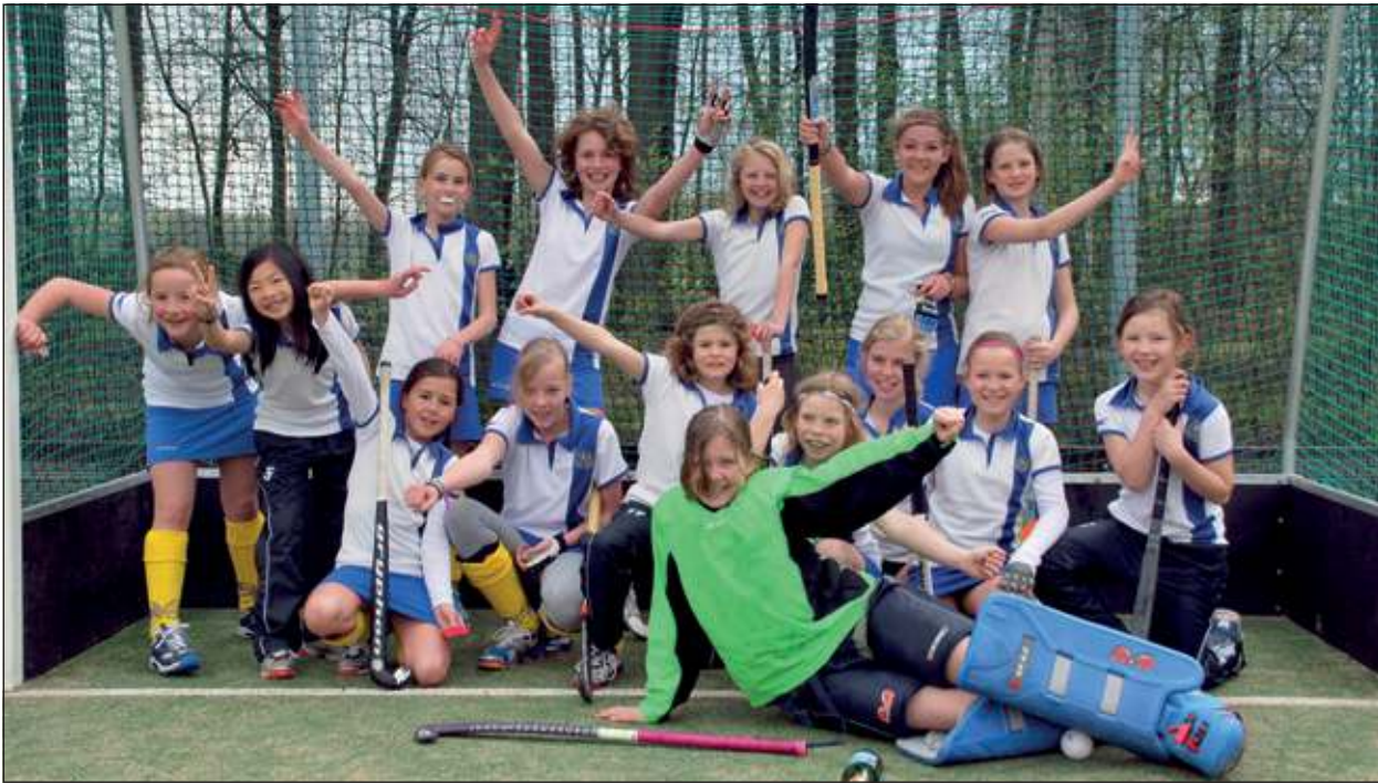
Meisjes Voordaan D3 werd als eerste team van de club kampioen dit jaar!

Afgelopen weekend is Meisjes D3 van hockeyclub Voordaan er in geslaagd als eerste team van de club kampioen te worden. Door met 8-4 van Spitsbergen te winnen zijn ze drie wedstrijden voor het einde niet meer te achterhalen. Op 1 wedstrijd na won MD3 alle wedstrijden. Het team bestaat uit een