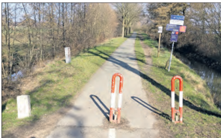
De extra lus van het klompenpad loopt langs de Hogenkampse plas en Voordorpsedijk.

Een wandelroutenetwerk bestaat uit knooppunten die met elkaar zijn verbonden; een beproefd landelijk systeem. De knooppunten zijn met palen en markeringsbordjes aangegeven en op informatiepanelen staat een kaart van de omgeving. Alle wandelmogelijkheden binnen het netwerk, een routeplanner en diverse thematische wandelroutes zijn te vinden op RoutesinUtrecht.nl .