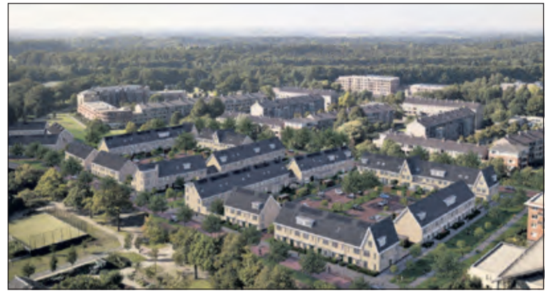
In Hof van Bilthoven worden 33 huurwoningen voor SSW gerealiseerd naast 72 koopwoningen. (foto ERA Contour en Woonstichting SSW)

Smolenaers vervolgt: ‘We bouwen ook niet zomaar wat: wij richten ons op het type en prijsklasse woningen,