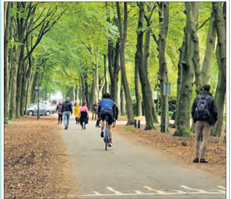
Grote drukte in de bossen van Lage Vuursche. [foto Henk van de Bunt]

De natuurorganisaties raden wandelaars dringend aan om niet allemaal naar de bekendste plekken te gaan. 'Op onze website staan duizenden wandelingen, er zijn rustige plekken genoeg', aldus bijvoorbeeld Natuurmonumenten. Ook Staatsbosbeheer heeft een lange lijst gemaakt van 'onbekende streken'. [HvdB]