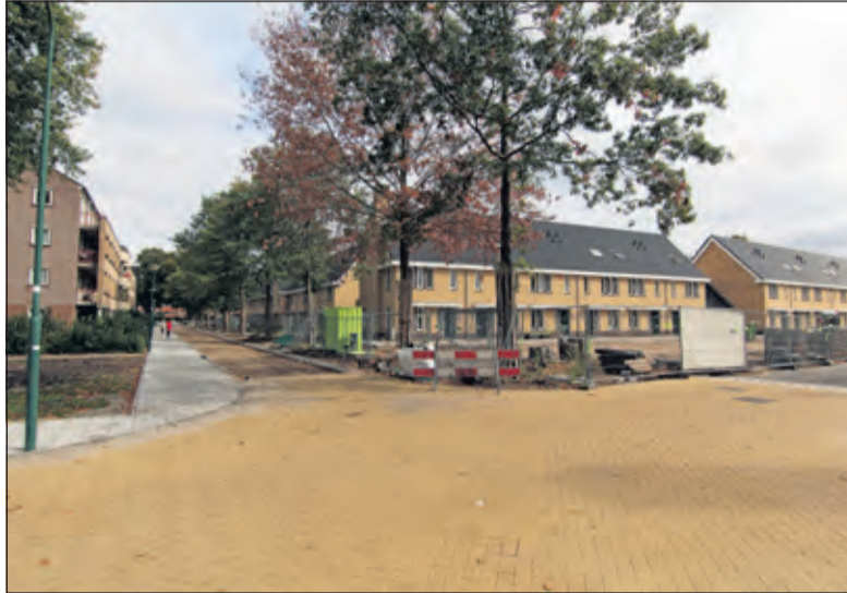
De Hof van Bilthoven sluit goed aan bij bestaande wijken.

Verschillende gemeenten in de provincie Utrecht, waaronder De Bilt, hebben de inschrijving en toewijzing van woningen uitbesteed aan Woningnet, Regio Utrecht (verder Woningnet). Woningnet doet dit voor alle gemeenten in de regio Utrecht en is hiervoor opgericht vanuit de corporaties. Volgens de Bewonersvereniging heeft de gemeente De Bilt geen invloed op de toewijzing van sociale huurwoningen: ‘De toewijzing door Woningnet gebeurt op basis van inschrijvingsduur en voorrangregelingen, zoals onder meer voor statushouders, woningzoekenden met urgentie/zorg of medische indicatie, kernbinding, en specifieke doelgroepen zoals jongeren en ouderen. Daarna komen de ingeschreven woningzoekenden uit de gehele regio aan bod. Aangezien de ingeschreven woningzoekenden uit de gemeente De Bilt een kleine minderheid vormen binnen de regiogemeentes, gaat het overgrote deel van de woningen naar woningzoekenden van de andere regiogemeentes’. De gemeente De Bilt reageert hierop: ‘Dit is een niet juiste voorstelling van de gang van zaken. De gemeente bepaalt (in de huisvestingsverordening en beleidsregels) de spelregels voor de verdeling van