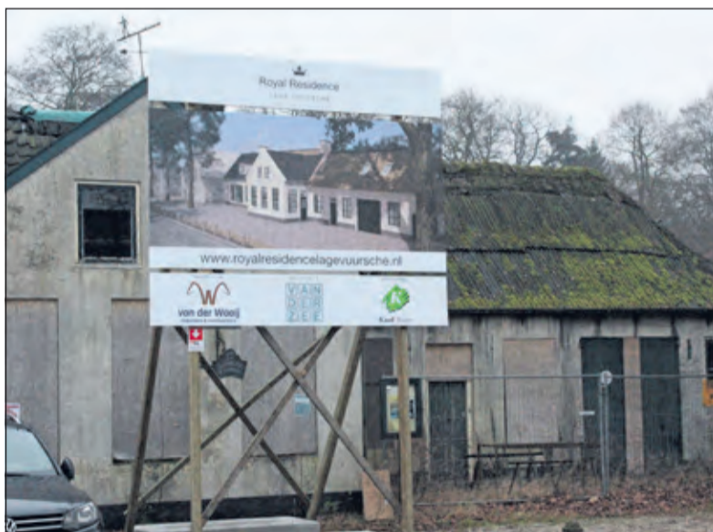
Een foto van De Vierklank eind 2016 geeft een duidelijke impressie van de (toen nog te realiseren) nieuwe situatie.