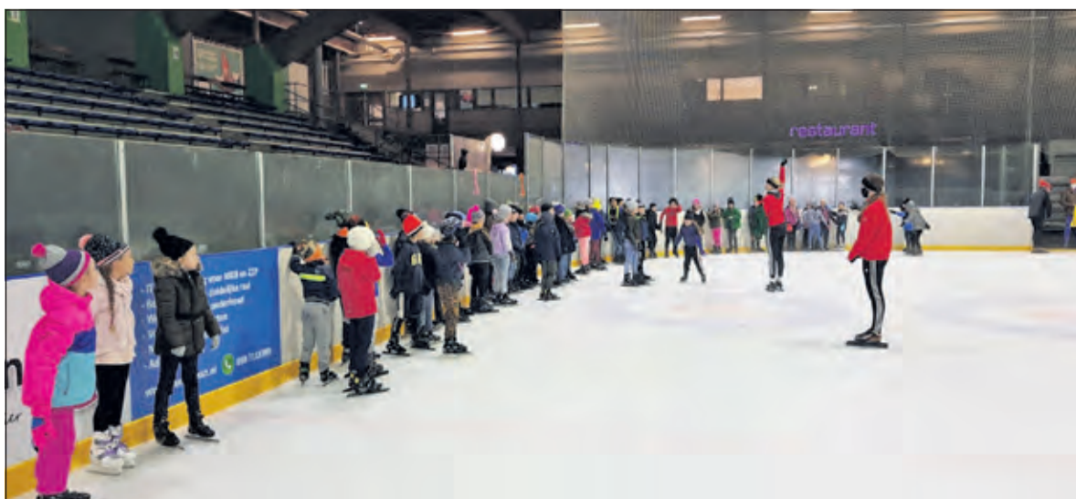
Leerlingen van De Rietakker krijgen schaatsles op de Vechtsebanen.

naar de ijsbaan. Het schoolschaatsen wordt georganiseerd door IJsclub het Biltse Meertje.