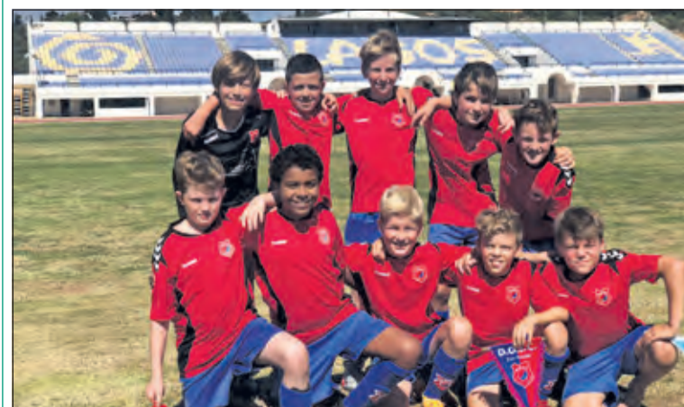
Met maar liefst 8 spelers uit Bilthoven poseert het kampioensteam voor een plekje in de krant.