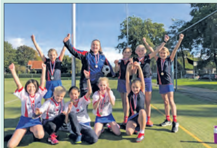
Ook de D1 wist het kampioenschap net op tijd binnen te slepen.