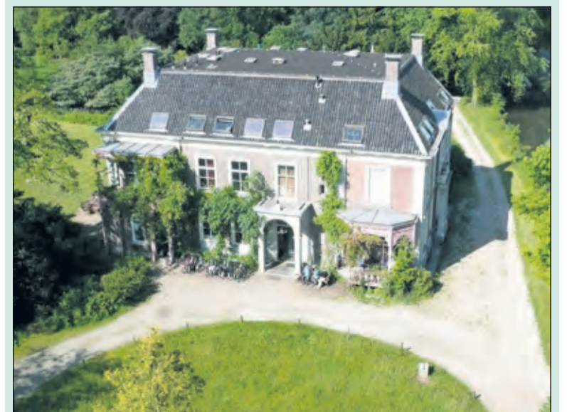
Voor de bewoners van Sandwijck verandert er niets.

Stadsherstel heeft uitsluitend het gebouw gekocht, het omliggende landgoed van 70 hectare tussen de Utrechtseweg en de A28, blijft in eigendom en beheer bij het Utrechts Landschap en blijft toegankelijk voor wandelingen.