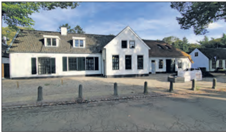
De gerealiseerde vernieuwing.

Op een donderdagochtend begin augustus van dit jaar stond het rieten dak van de toen net gerenoveerde villa 'De Oude Smidse' in brand. Door snelle inzet van de brandweer werd voorkomen dat het vuur zich verspreidde. Later concludeerde de politie dat de brand die nacht bij de oude smederij in Lage Vuursche was aangestoken na onderzoek met onder meer een speurhond en het bekijken van camerabeelden. Die conclusie van de politie bevestigde de vermoedens van de buurt, die die nacht een auto met hoge snelheid hoorden wegrijden. Dat gecombineerd met het feit dat het vuur alleen woedde in de rieten kap en dat het grindpand brandde, maakte het voor de inwoners van Lage Vuursche een uitgemaakte zaak: er is sprake geweest van brandstichting. De