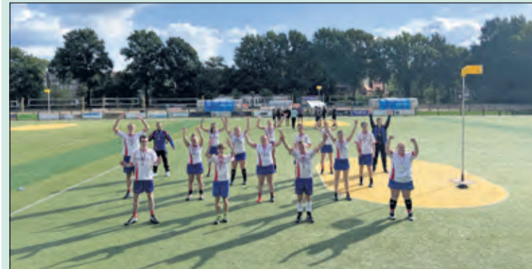
De kampioensfoto van NOVA 3.

NOVA 3, de F1 en de D1 zijn kampioen en kregen allemaal een welverdiende medaille om hun nek gehangen. (Renske van Kempen)