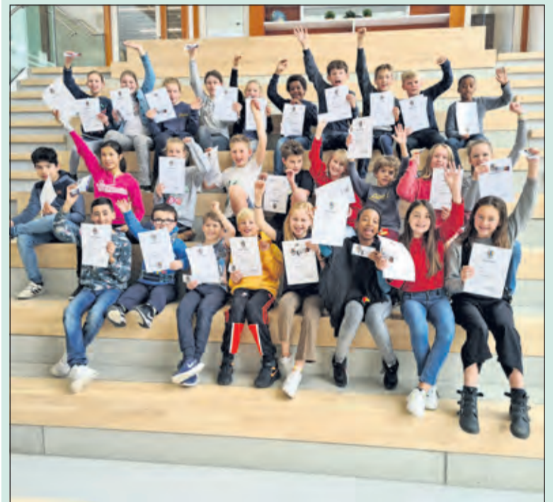
Alle leerlingen van groep 8 zijn geslaagd voor hun opleiding tot mediator.

Leerlingen krijgen daarnaast taken en verantwoordelijkheden in de klas, in de school en ook in de omgeving van de school. Zo worden leerling-mediatoren opgeleid, die helpen bij het oplossen van conflicten. De leerlingen van groep 8 hebben de afgelopen weken een opleiding tot mediator gevolgd en zijn hier allemaal voor geslaagd. Tijdens een feestelijke bijeenkomst met iets lekkers, kinderchampagne, bloemen en speeches, kregen zij een officieel diploma uitgereikt. Ze zijn er helemaal klaar voor om aan hun belangrijke taak binnen De Regenboog te beginnen!