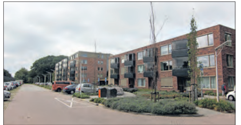
Het recent opgeleverde project ‘De Leijen Zuid’.

zetten kan dus niet. Als andere gemeenten dat ook zouden doen, kan iedereen alleen nog maar binnen zijn eigen woonplaats verhuizen en wat als je dan ergens anders een baan krijgt? Onze eigen inwoners verhuizen heel vaak naar buurgemeenten, daar is niets op tegen, vrije vestiging is een grondrecht. We staan aan de vooravond van een belangrijke uitvraag aan al onze inwoners om nog beter te weten te komen waar de behoeftes liggen. Daar is ook bewonersvereniging Maartensdijk-Zuid voor uitgenodigd. Maar we horen ook graag de mening van de Maartensdijkse woningzoekenden die helaas nog geen huis hebben kunnen vinden of nog bijvoorbeeld noodgedwongen bij hun ouders wonen. Binnenkort krijgt ieder adres een brief op de mat, en hou onze website en social media in de gaten!’