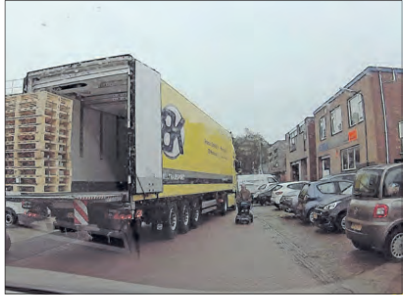
In dit gedeelte van de Ambachtsstraat wordt er diagonaal over de weg geladen en gelost en resteert er slechts ruimte voor een rolstoel.

Een woordvoerder van de buurtbewoners wees op de geluidsoverlast en de hinder in de buurt van het vrachtverkeer. Maar volgens de woordvoerder van MSD gaat de buurt er juist op vooruit als de fabriek groen licht krijgt voor zijn plannen. MSD gaat zorgen voor minder parkeerdruk en zegt een goede buur te willen zijn. De rol van de raad lijkt overigens marginaal, want de provincie neemt uiteindelijk het besluit. De Bilt mag alleen een advies uitbrengen. Eind van de maand komt de kwestie nog één keer in de raad ter sprake.