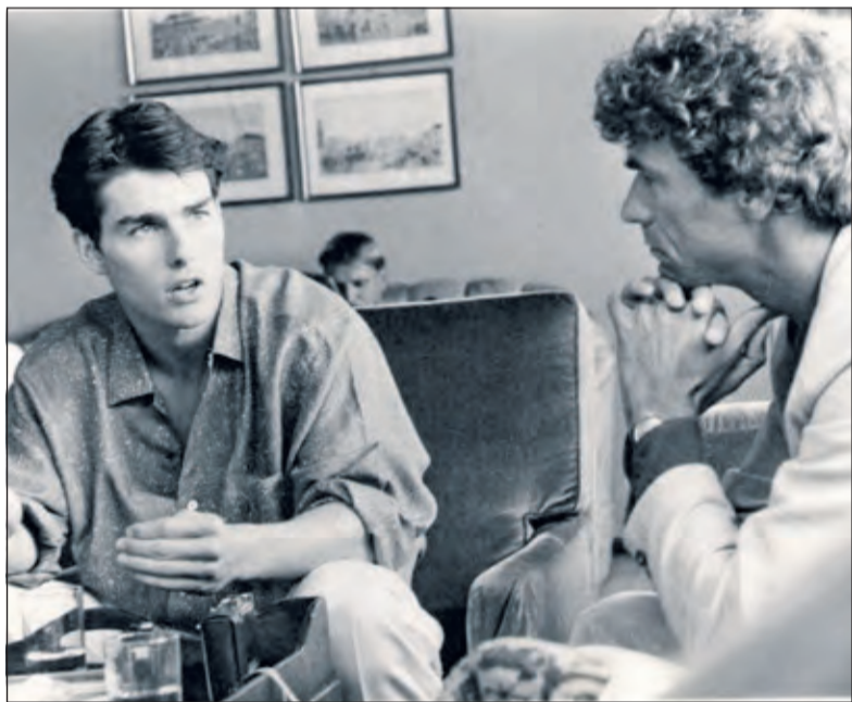
Met Tom Cruise tijdens een presentatie van de film Top Gun in Kopenhagen in 1986.

Voor de lezers van De Vierklank is een aantal exemplaren van het boek ter beschikking gesteld. Om hiervoor in aanmerking te komen stuurt u een mail naar info@vierkank.nl met in het onderwerp Wild West. De boeken worden onder de inzenders verloot.