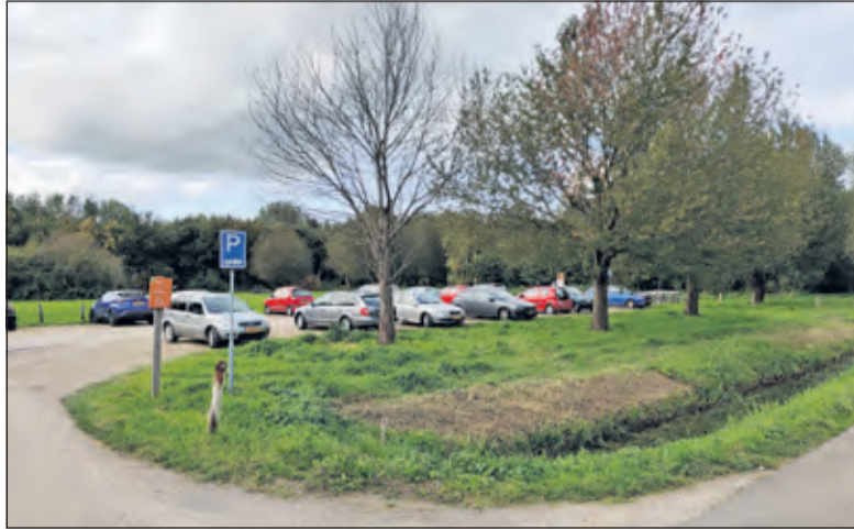
Het vertrekpunt van de Kazemattentocht is vanaf de druk bezochte parkeerplaats aan de St. Anthoniedijk in Utrecht, waar nog meer tochten hun vertrekpunt hebben.