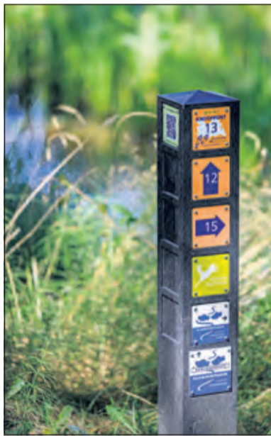
Entree klompenpad bij Beukenburg.

De schuilplaatsen zijn van zwaar-gewapend beton en waren bedoeld als schuilplaats voor een groep van tien tot dertien manschappen. Verder loopt dit leuke wandelrondeje ook langs Fort Ruigenhoek, langs de rand van het Gagelbos en door een stukje van het groene Sjanghaijpark aan de rand van de wijk Overvecht. Het Startpunt van deze route is op de Parkeerplaats Gagelbos aan de St. Anthoniedijk 107 te Utrecht. De route is ca. 5,5 km lang en te downloaden op www.routesinutrecht.nl .