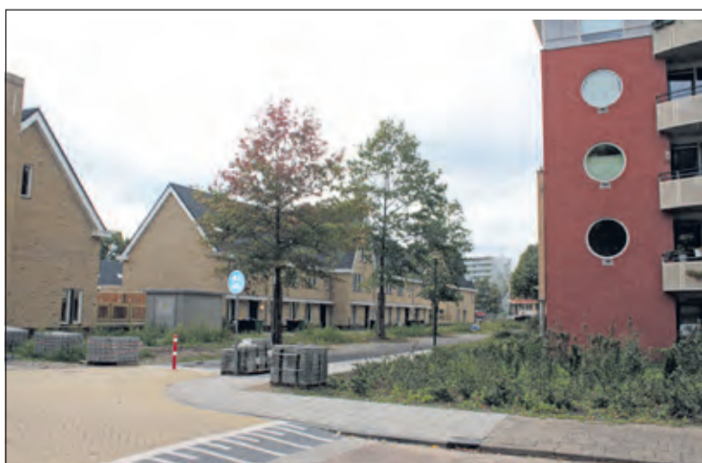
Ook dit deel van De Hof van Bilthoven nadert zijn voltooiing.