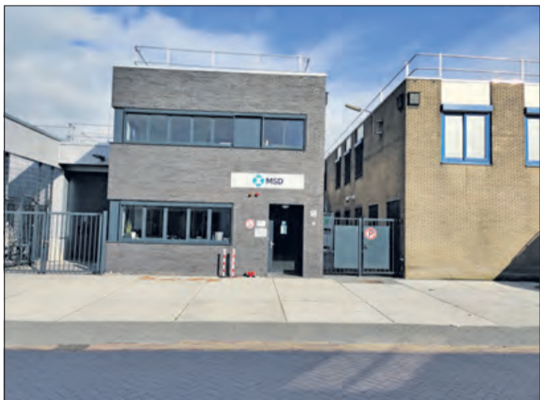
Het College heeft Gedeputeerde Staten aangeven, dat de door Intervet aangevraagde afwijking van het bestemmingsplan als 'kruimelgevallenregeling' behandeld kan worden.

'Tijdens de voorbereiding van alle stukken en overwegingen voor het voorleggen van de verklaring van geen bedenkingen aan de raad ontstond twijfel of de procedure, die reeds ingestoken was, wel juist was. Naar aanleiding daarvan is juridisch advies ingewonnen bij de huisadvocaat. Hoewel Gedeputeerde Staten in eerste instantie heeft aangenomen dat de gemeenteraad een verklaring van geen bedenkingen zou moeten geven is het, gelet op de inhoud van de aanvraag en de procedure, die de wet daarbij voorschrijft, zeer waarschijnlijk dat Gedeputeerde Staten de aanvraag anders gaat behandelen. Daarbij zal blijken, dat de raad niet bevoegd is om een verklaring van geen bedenkingen te verlenen voor de aanvraag van Intervet. Dit komt omdat de afwijking van het bestemmingsplan ten behoeve van de nieuwe productiefaciliteit en traforuimte valt onder de toepassing van de zogenoemde 'kruimelgevallenregeling' van het Rijk. Dit betekent dat, indien de afwijking past binnen een goede ruimtelijke ordening, Gedeputeerde Staten een omgevingsvergunning kunnen verlenen. Daarvoor is een verklaring van geen bedenkingen van de raad