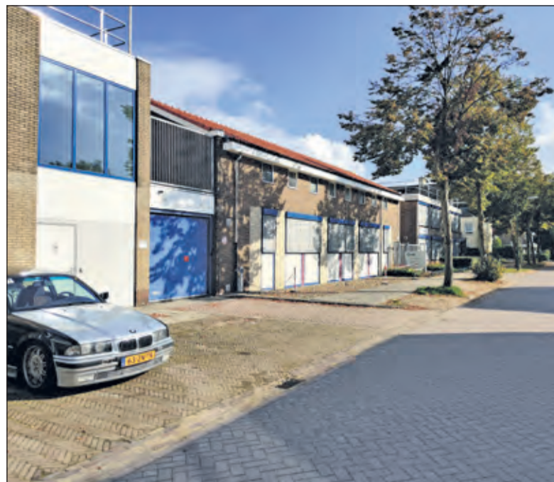
MSD beslaat een groot gedeelte van de Ambachtsweg.

niet vereist. De aanvraag kan worden vergund met toepassing van de kruimelgevallenregeling en daardoor zonder verklaring van geen bedenkingen van de raad'.