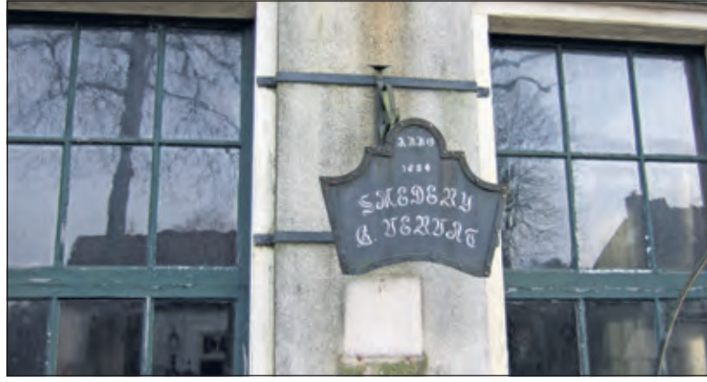
Op een uithangbord stond te lezen 'Anno 1854 smederij G. Vervat', (foto G.H. Kruijmer)

Vervolg van pagina 3 Het gebouw werd in 2007 verkocht en stond daarna lange tijd leeg, doordat de gemaakte bouwplannen niet binnen het bestemmingsplan vielen en niet de goedkeuring van de dorpscommissie kregen. Het gebouw is begin 2017 gerenoveerd: In de voormalige smederij zijn twee riante appartementen, een geschakelde villa en een commerciële ruimte. Aan de achterkant is een nieuw koetshuis, met plek voor zes auto's gerealiseerd.