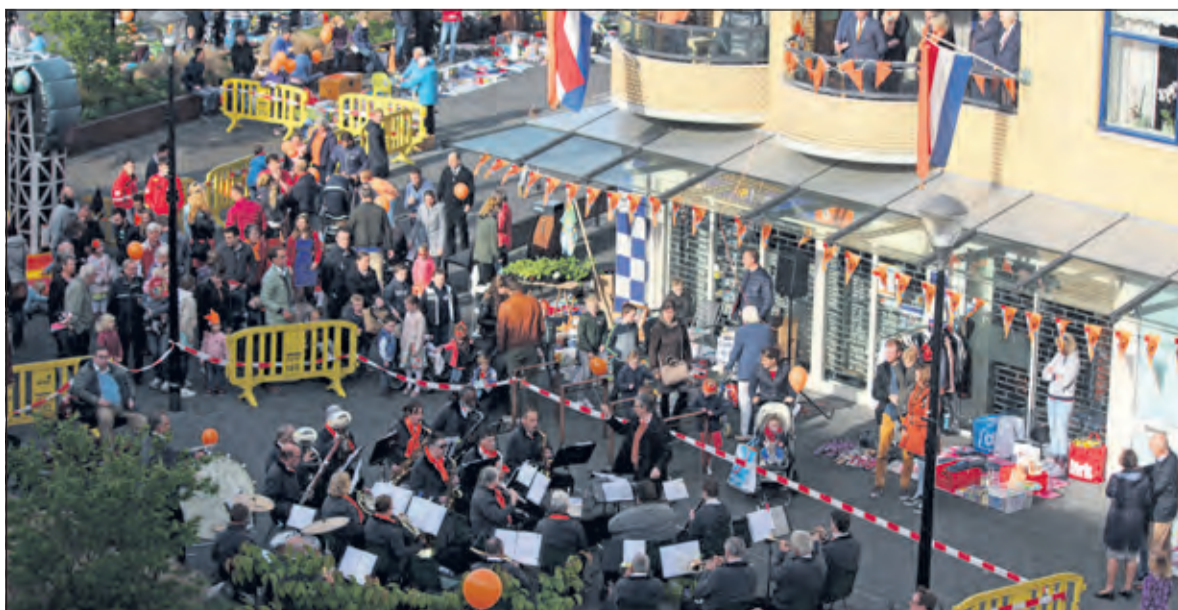
Een viering zoals deze zit er even niet in.

Het Oranjecomité De Bilt-Bilthoven roept iedereen op om mee te doen aan deze 'Nationale Toost' en gezellig (op een Corona-vriendelijke manier) met elkaar te proosten om 16.00 uur. Voor het Landelijk programma van De Koninklijke Bond van Oranjeverenigingen op 27 april kunt u terecht op www.oranjebond.nl .