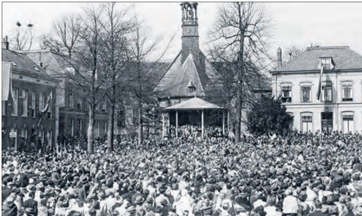
Bevrijding 1945.

gingen. Het gebeurde regelmatig dat bevriende gevechtsvliegtuigen het Duitse transport aanvielen dat over de Kerkewijk trok. Eens, heel vlakbij ons huis op de Kerkewijk, werd een paard- en wagen aangevallen en daarbij werd het paard dodelijk getroffen. Toen ik dat hoorde vond ik dat erg zielig voor het paard. Maar het stuk paardenvlees dat later gebraden en wel op mijn bord kwam was overheerlijk. Zo vaak kwam er geen vlees op tafel. Toen de bewoners van de Kerkewijk in de gaten kregen dat het paard dood op straat lag, gingen ze met scherpe messen op het paard af en sneden ze er willekeurig grote