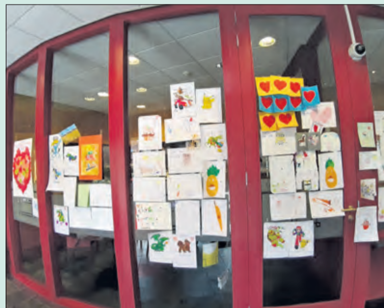
Een impressie van tekeningen en kaartjes.