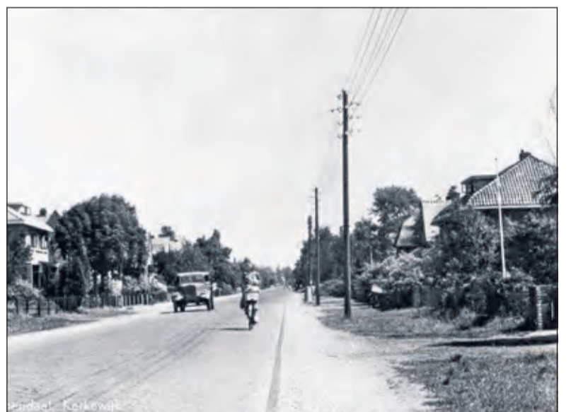
Kerkewijk in Veenendaal circa 1945.