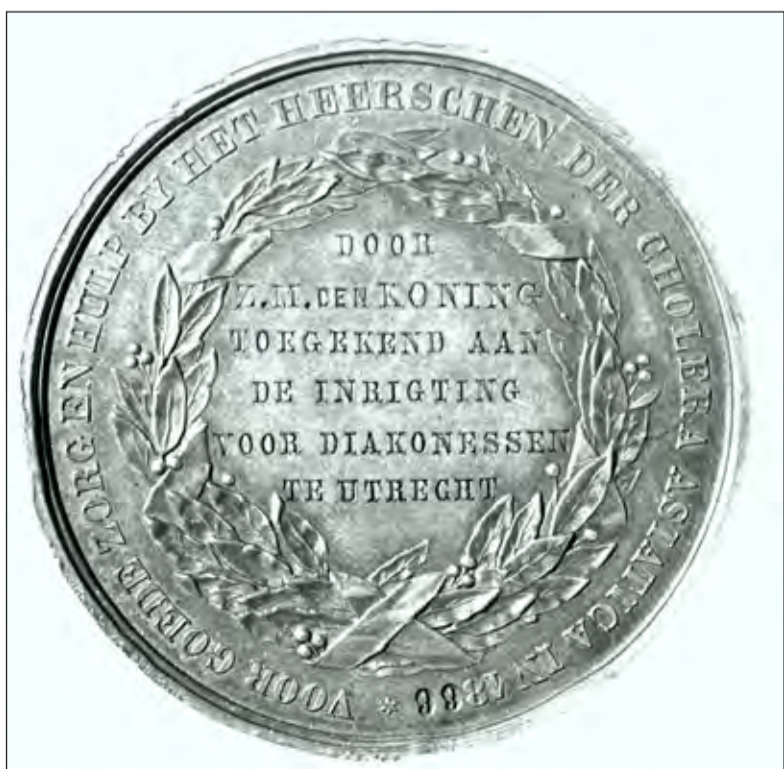
Penning uit 1866 geschonken door Willem III aan het Diakonessen ziekenhuis in Utrecht.

Hessenweg 4 * 3731 JK De Bilt hazekampparket.nl * 030 - 633 26 91