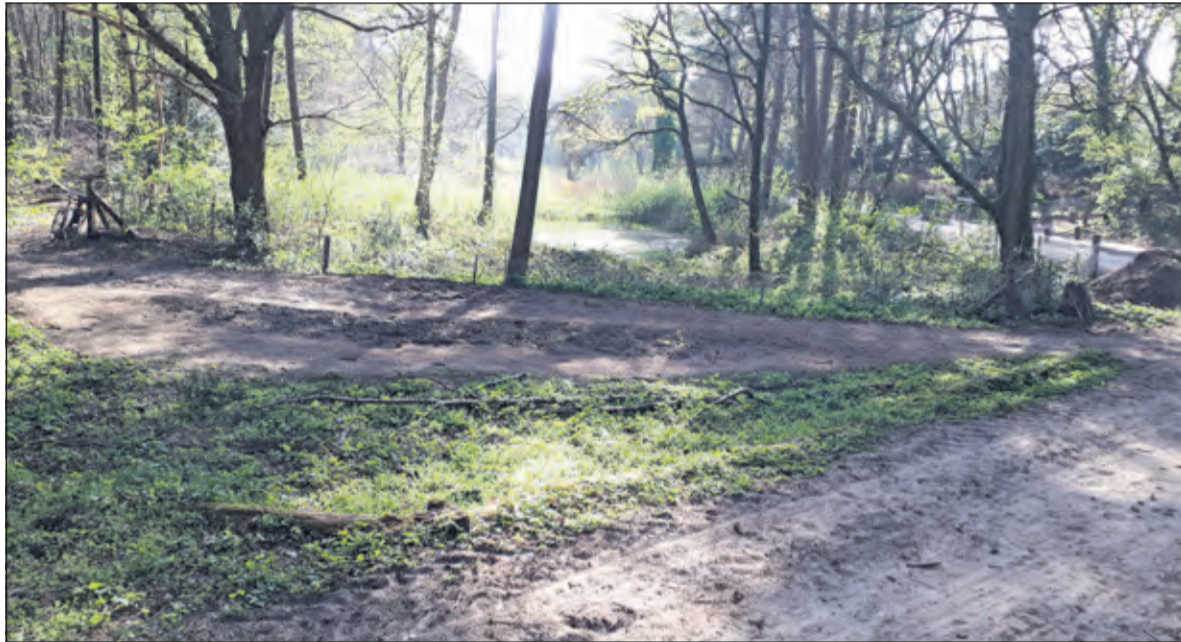
Eindpunt Tienhovensch Kanaal bij Zwarte Berg op de Hoorneboegse hei.

provincies. Tussen 1839 en 1869 werd het Tienhovensch Kanaal gegraven, waardoor ook op sommige plaatsen de Tienhovensche Vaart moest worden verbreed. Het kanaal moest gaan dienen voor zowel de ontwatering van het gebied als ook voor transport van turf. Het moest