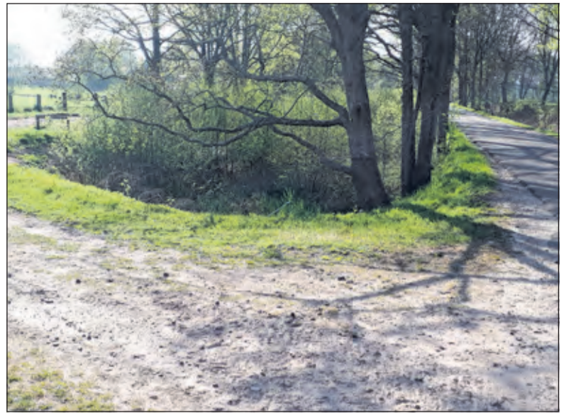
Eind van het Tienhovensch Kanaal op de Graaf Floris V weg in Hollandsche Rading.

Aan de Graaf Floris V weg ligt de in 1824 gebouwde woning van de sluiswachter. Langs de Graaf Floris V weg loopt het Tienhovensch Kanaal verder richting Hollandsche Rading. Ooit heeft hier dus een sluis gelegen. Na ruim een kilometer op de Graaf Floris V weg houdt dit kanaal plotseling op. Het kanaal is al lang niet meer bevaarbaar, omdat er in de loop der tijd vele dammen in het kanaal zijn verzezen. Er zijn verschillende verklaringen over de redenen waarom