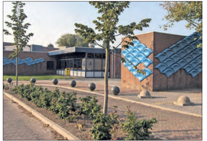
In 2006 bestond binnenbad van Combibad Brandenburg 30 jaar; ter gelegenheid daarvan vonden er verschillende festiviteiten plaats. Er waren bijvoorbeeld schoolzwemwedstrijden, waaraan ook Maartensdijkse scholen deelnamen. Er konden gezinnen van eerst samen banen zwemmen en daarna was er speelmateriaal in het water. [HvdB]

en dat de ontwikkeling minimaal budgettair neutraal moet verlopen. Deze randvoorwaarden beperken de mogelijke keuzes bij de herontwikkeling. Desondanks streeft het college ernaar om ter plaatse minimaal 30 procent van de woningen in de sociale huursector en 10 à 20 procent van de woningen in de midden-huur-sector realiseren. In de komende periode zullen in samenspraak met omwonenden de randvoorwaarden verder worden verfijnd en afspraken gemaakt worden over de wijze waarop de omwonenden kunnen meedenken in het vervolgproces. Daartoe zijn nog voorbereidende werkzaamheden en onderzoeken nodig.