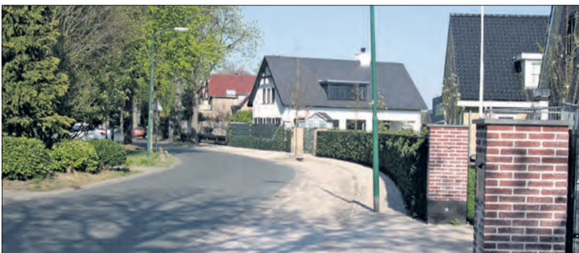
Nieuwe situatie Rembrandtlaan.