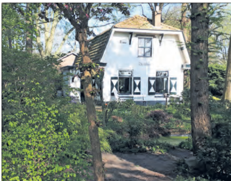
Huis Sluijs, anno 1824.

Bel of mail om te bestellen: 06-12368755 / info@naastdeburen.nl