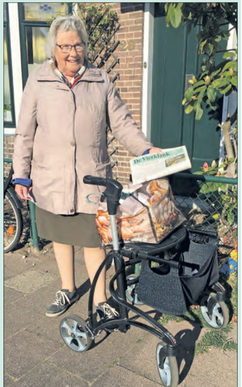
Nooit te oud om De Vierklank te bezorgen.