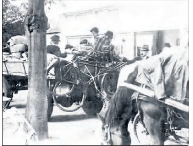
De hele bevolking van Arnhem, Oosterbeek, Renkum, Heelsum, Wolfheze, Heveadorp, Doorwerth en Wageningen moest evacueren: Een volksverhuizing!

Na de Slag om Arnhem werden onder Duitse bewaking lange rijen Engelse krijgsgevangenen vermoeid, haveloos en gedeprimeerd over de Kerkewijk afgevoerd. Van het deel van de Kerkewijk waar wij woonden waren de mannen verplicht elke dag met een bezem de straat te vegen, omdat een hoge Duitse officier met zijn auto lekke banden had gereden doordat er met spijkers