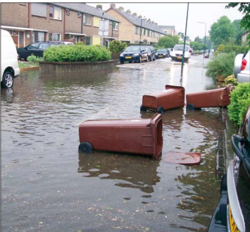
Marjan Bekkering zag alles in het water vallen.

Al jaren staat bij het minste drupje water de hoek Prins Willem Alexanderplantsoen / Prins Bernhardlaan blank. Terwijl verderop in de Bernhardlaan de brandweer assisteert bij het leeg - c.q. wegpompen van het overtallicht vocht, ligt een nieuw werkterrein alweer braak voor deze onmisbare vrijwilligers [HvdB].