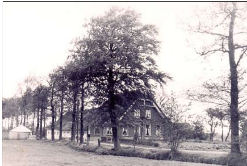
De in 1980 afgebroken boerderij Ridderhofstad aan de Prinsenlaan.

Sinds mensenheugenis is de Prinsenlaan een onverhard landweggetje van Maartensdijk naar de Nieuwe Wete-