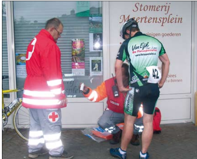
Aan tien mensen is hulp verleend.

Het Rode Kruis is opgericht door de Zwitser Henry Dunant. Hij was in 1859 toevallig getuige van een veldslag tussen het leger van Napoleon en het Oostenrijkse leger. Na de veldslag bleven er 40000 slachtoffers op het slagveld achter waar niemand zich