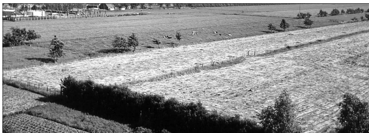
Voor 1960 vanaf de molen De Hoop gemaakte foto met aan de horizon de Prinsenlaan.

ring. Soms worden de karrensporen van boerenwagens wat geëgaliseerd en de elzenhagen gesnoeid. Planten, dieren en mensen vinden er rust en ruimte. De Prinsenlaan is nog een van de weinige onverharde paden door het weiland die herinneren aan het ontstaan van onze streek. Een al vaker verteld verhaal over de ontginning van de veenpolders tussen de stad Utrecht en het Gooi leert dat vanaf 1085 ten noorden van de stad is begonnen met het uitbaggeren van het veen. Geleidelijk ontstond er een