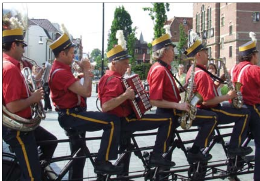
't Brabants Fietsharmonisch Orkest zorgt voor pittige muziek.