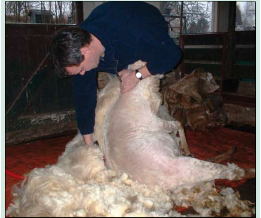
Door de minder goede weersomstandigheden van zaterdag jl. hebben de organisatoren de Country Fair op het Maertensplein verschoven naar zaterdag 24 mei. Naast de Country Fair zullen er ook schapen van van Woudenberg geschoren worden [MD].

Dit jaar wordt voor de tweede keer een meezingconcert gegeven. 'De eerste keer heeft laten zien dat ook een koor dat uit zoveel mensen bestaat toch nog goed verstaanbaar is. We genieten met z'n allen en dat stralen we uit'. Het concert wordt gegeven op zaterdag 31 mei aanstaande in het Nieuwe Vredenburg Leidsche Rijn, aan het J.C. Verthorenpad in Utrecht. Kaarten kosten 11 euro per stuk en zijn te bestellen via internet www.grachtensmart.nl