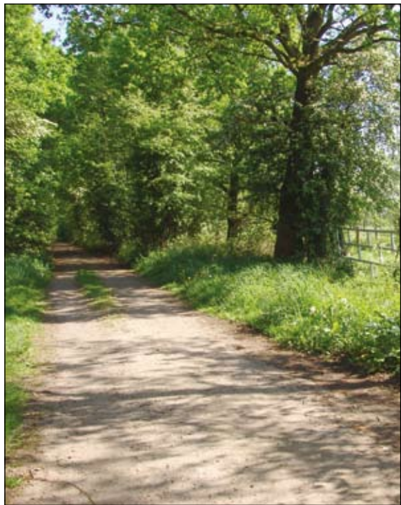
De huidige Prinsenlaan.

De weilanden aan beide zijden van het nog bestaande gedeelte van de Prinsenlaan hebben vanaf de ontginning van het oorspronkelijke veengebied een agrarische functie. In 1980 hebben studenten in het kader van de tweede graadsopleiding biologie aan de Stichting Opleiding Leraren te Utrecht er een veldonderzoek verricht. Van dit onderzoek is een verslag gemaakt, getiteld 'Maartensdijkse Houtsingels' waarin een inventarisatie is opgenomen van de aangetroffen broedvogels en flora in de lijnvormige hout-