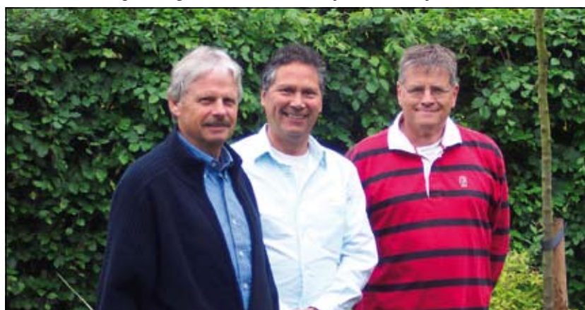
V.l.n.r. penningmeester, voorzitter en secretaris van 'De 4-spraak'.

Schuller vertellen dat het contact leggen en het uitbouwen daarvan het voornaamste doel van de sociëteit is. Dat is ook goed gelukt. Er zijn vriendschappen uit voortgekomen. Leden zijn met elkaar gaan golfen en gaan motorrijden en naar aanleiding van een lezing over het Noorderpark is De Stichting Behoud Noorderpark opgericht, waarvan het bestuur geheel uit leden van de sociëteit bestaat. Er worden ook buiten de eigen kring acties ondernomen. Ze steunden de slachtoffers van de Tsunami en een ziekenhuis in Nepal. Ze gaven een bijdrage voor een Kerstrit voor de oudjes van Dijkstate. Ze denken