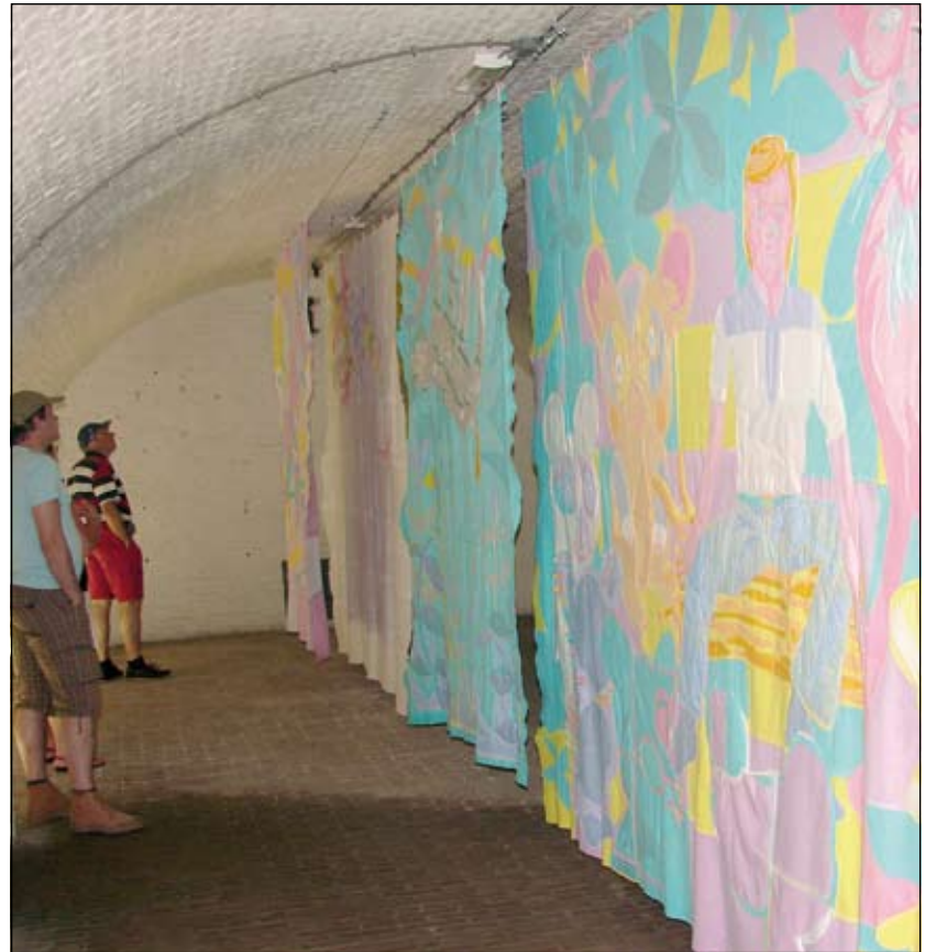
Kunstwerken, gemaakt van keukendoeken.

KAAP is iedere zondag tot en met 22 juni geopend van 10.00 tot 18.00 uur. Meer informatie is te vinden op de website www.kaapweb.nl .