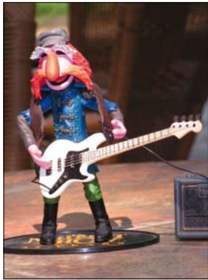
Mister Floyd Pepper himself.