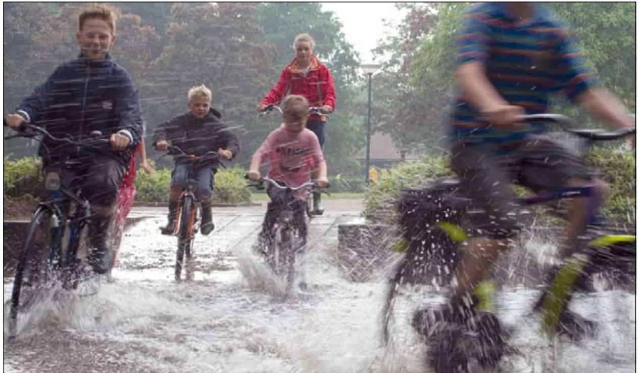
De Maartensdijkse beginnend fotograaf Wouter ter Wee (hij kwalificeert zichzelf zo) legde dit waterplezier vast. Een blik op zijn website leert dat Wouter al tot meer fraais in staat is geweest. ( www.wterwee.nl )