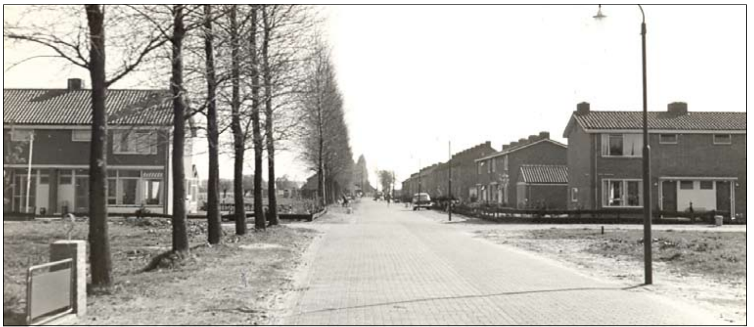
De eerste huizen aan de Julianalaan (gemaakt door Frans Schaafsma).

Wijkservicecentrum Mens is gevestigd in Buurthuis 't Hoekie aan de Prof. Dr. T.M.C. Asserweg 2 in De Bilt. Het wijkservicecentrum is bereikbaar via de helpdesk voor meer informatie. Dat kan via email: helpdesk-db@mensdebilt.nl. U kunt ook van maandag t/m vrijdag van 9.00 tot 12.30 uur persoonlijk of per telefoon terecht. Het telefoonnummer is 030-2217550.