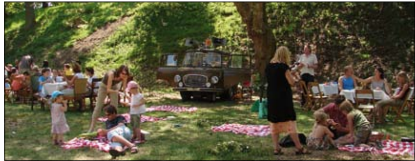
Even bijkomen van alle kunst.

KAAP werd op zondag 11 mei om 15.00 uur officieel geopend door de burgemeester van Utrecht Aleid Wolfsen. Op Fort Ruigenhoek zijn van 11 mei tot en met 22 juni tien nieuwe kunstwerken van kunstenaars uit binnen- en buitenland te zien, waarbij de kunstenaars zich vooral richten op de jongste bezoekers. KAAP was voorheen de kleine biënnale, een twejaarlijks tentoonstelling, die zo succesvol was dat de naam veranderd moest worden.