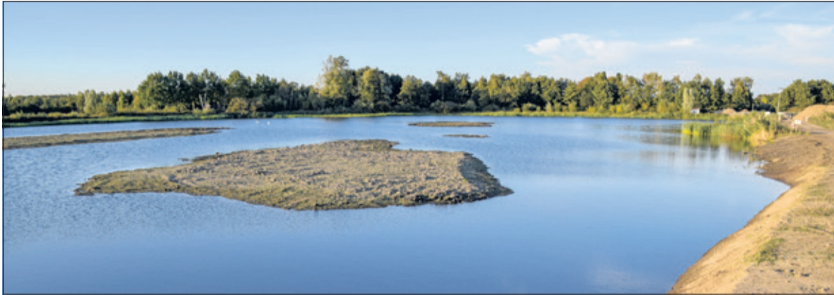
De eilanden die al in de noordelijke plas zijn aangelegd en zich nu verder kunnen gaan ontwikkelen.