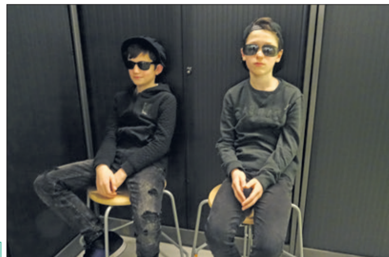
Twee living statues. Na elke donatie werd door één van de statues een dansje gemaakt.

Naast geld ophalen tijdens het Open podium heeft de school de afgelopen weken ook tandenborstels ingezameld. Stichting Kinderen van Abong Mbang heeft een hygiëneproject en als onderdeel daarvan is het tandenpoetsen op de scholen daar geïntroduceerd. De kinderen hebben een klein tasje in hun klas waarin hun eigen tandenborstel en een tube tandpasta zit. Deze tan-