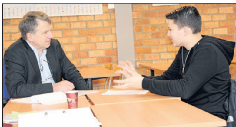
Voor het eerst op sollicitatiegesprek.

De sollicitatiegesprekken vinden plaats op diverse kantoorlocaties in de gemeente De Bilt. Voor de leerlingen is dit meestal hun eerste sollicitatie-ervaring. De spanning is dan ook soms te snijden. Zowel de locatie waar de sollicitatie plaatsvindt, als de degene met wie het gesprek gevoerd wordt, zijn immers nieuw. Ook het soort gesprek is anders dan anders'.