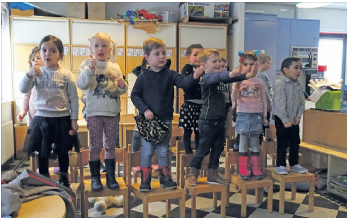
Leerlingen uit de groepen 1 en 2 zingen heel enthousiast hun liedjes voor alle aanwezigen. Het jongetje in het midden ging na het zingen met de pet rond.

Basisschool De Regenboog in De Bilt steunt al vele jaren Stichting Kinderen van Abong Mbang o.a. door periodieke sponsoracties. Deze stichting ondersteunt projecten die kansen vergroten en de situatie verbeteren van kinderen in dit Oost-Kameroense dorp.