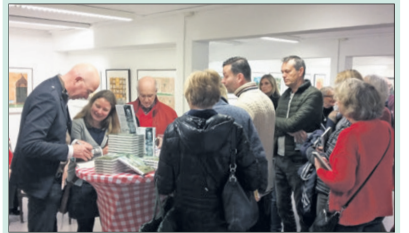
Tommy Wieringa signeert in een drukbezochte KunstKelder in de Bilthovense Boekhandel.