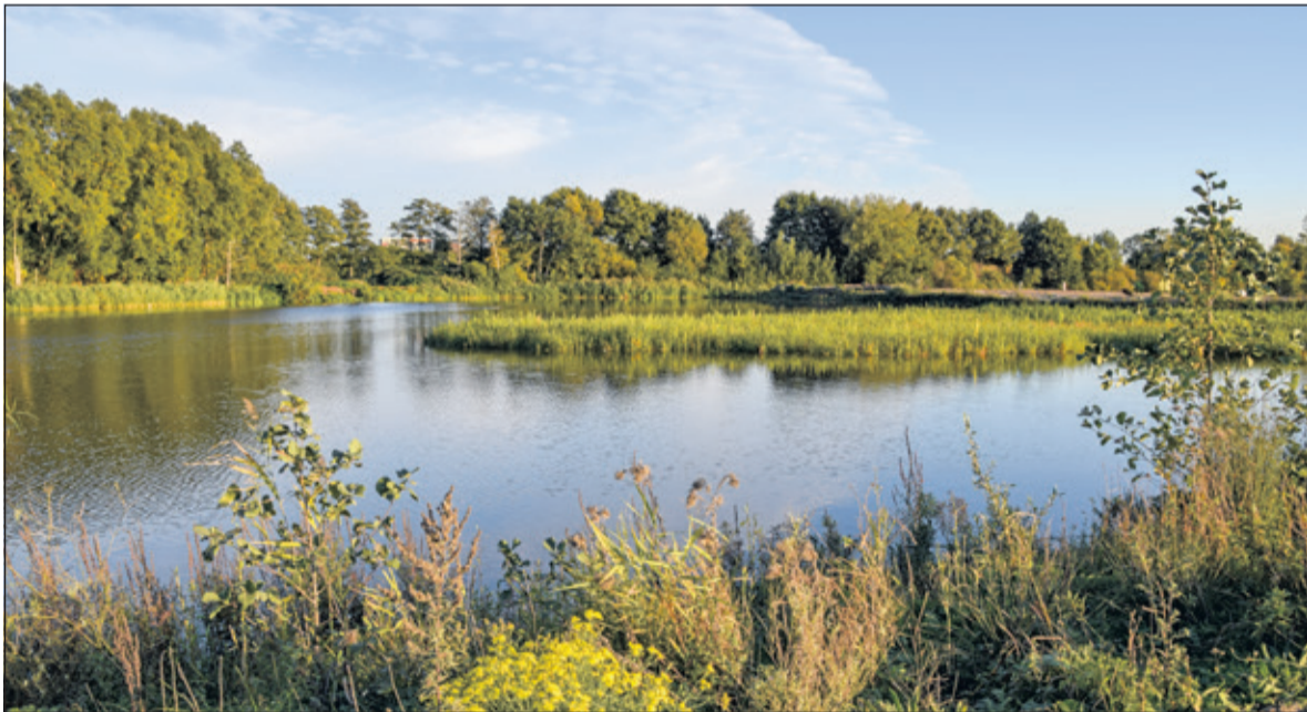
Een deel van de noordelijke plas.

Vermeule vervolgt: 'Vanaf de start in mei 2010 is er inmiddels 1,2 miljoen m 3 grond en baggerspecie in de plas aangebracht. Inmiddels is het noordelijk deel bijna helemaal klaar. In 2013 is het eerste deel opgeleverd en in oktober 2018 is ook het tweede deel hiervan opgeleverd. De resterende 3 eilanden zullen we dit jaar maken uit de werk-weg, die nu dwars door de plas loopt. Omdat