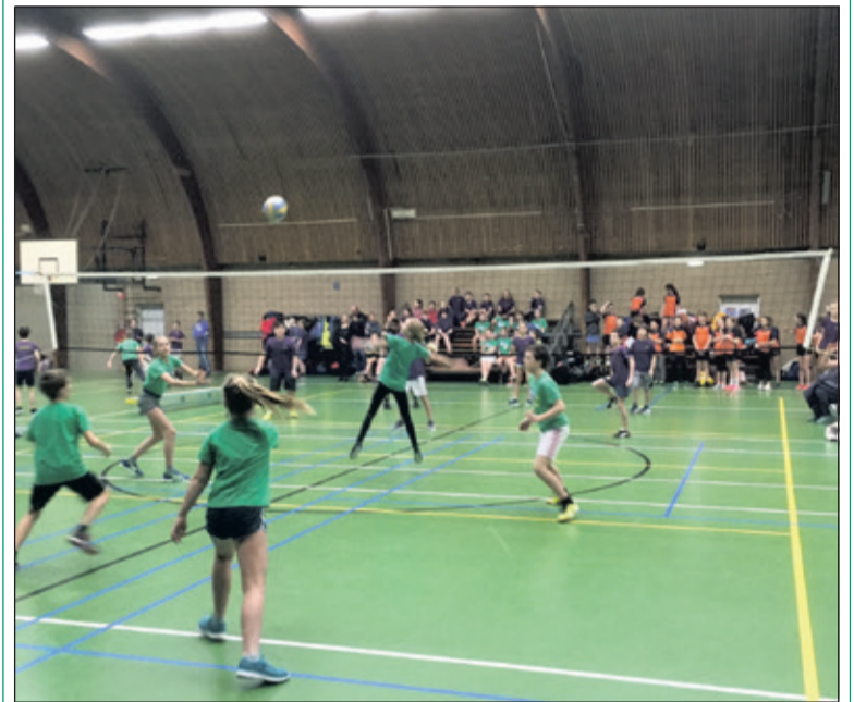
Onderlinge ontmoetingen van groepers acht in de Biltse Sporthal.