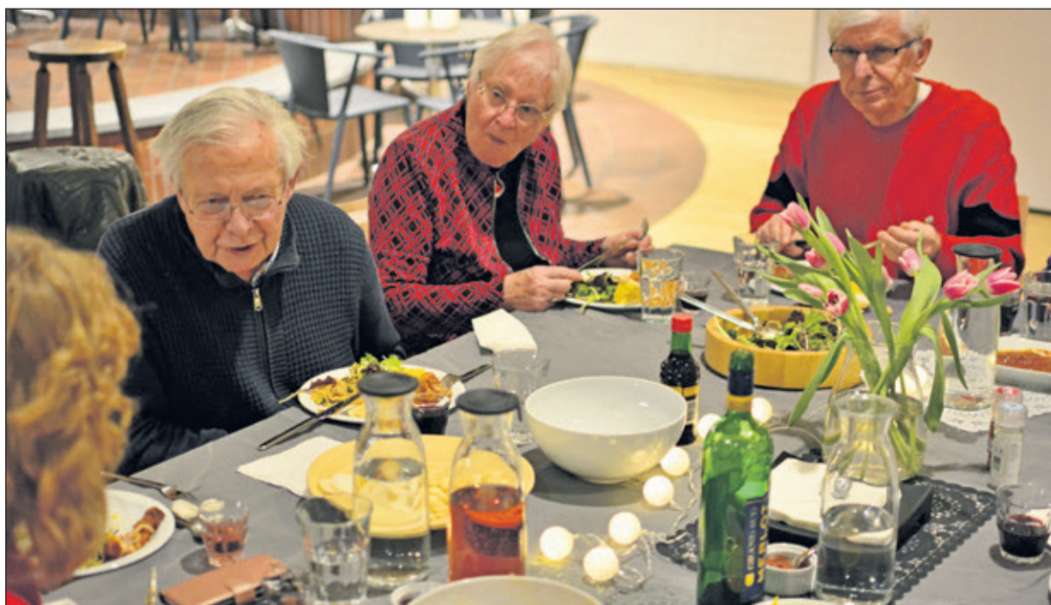
Deze foto (gemaakt bij de try-out) van 'Aan de Keukentafel' geeft een indruk van de sfeer aan tafel.

Van der Heijden: 'Ik nodig iedereen van harte uit voor de feestelijke opening op donderdag 14 februari 2019'. Het restaurant is open vanaf 18.00 uur en om 18.30 uur gaat men aan tafel. Aan De Keukentafel is een initiatief van Stichting Vierstee 2.0 en wordt mogelijk gemaakt door enthousiaste en betrokken vrijwilligers. Kijk op de website voor informatie en reserveringen: www.vierstee.nl/aandekeukentafel .