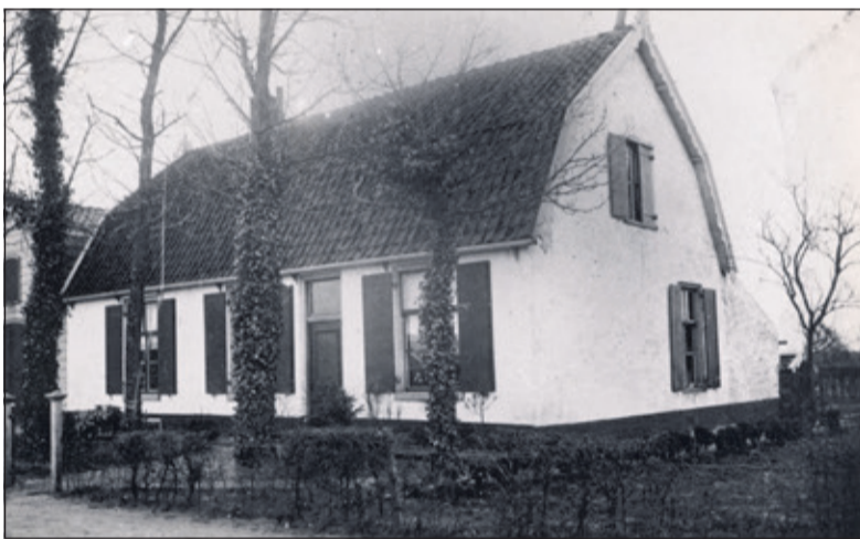
Hier begon grootvader in 1953.