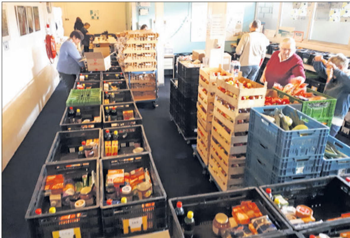
Vrijwilligers zijn vrijdagochtend druk in weer om de pakketten samen te stellen