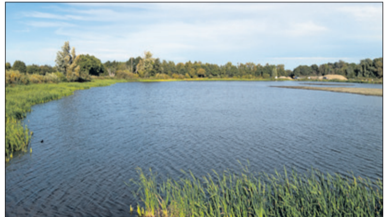
Een deel van de noordelijke plas met links vegetatie die zich daar door de verflauwing van de oever kan ontwikkelen. (foto Luuk Donderwinkel)

Grondbank GMG houdt zorgvuldig rekening met (beschermde) plant- en diersoorten die zij tijdens de uitvoering tegenkomt. Daar zijn ook ecologen van Stichting Utrechts Landschap bij betrokken. Ook wordt er dankbaar gebruik ge-