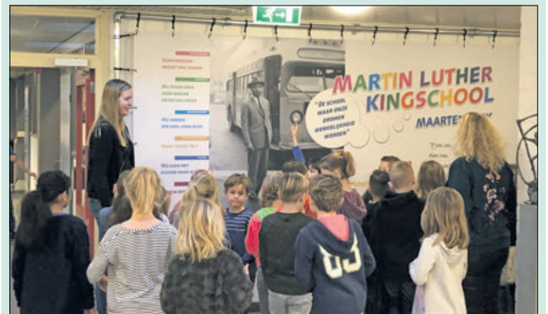
Groep 4 krijgt uitleg bij de banner in de school.

But whatever you do, you have to keep moving forward'.