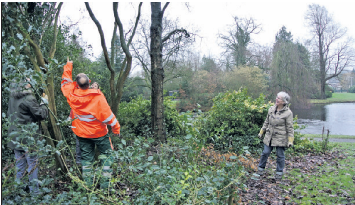
Een medewerker van het Wijksericeteam De Bilt geeft enkele vrijwilligers aanwijzingen waar er gesnoeid mag worden tijdens de januari-werkochtend van de Vrienden van het Van Boetzelaerspark in De Bilt.