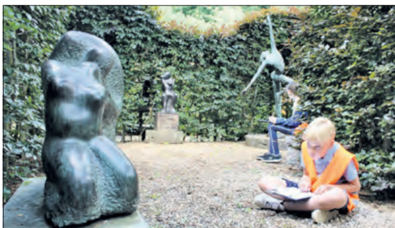
Een van de leerlingen van groep 8 van de Julianaschool in Bilthoven tekent het beeld na uit de Griekse mythologie genaamd 'Theseus en Ariadne'.

omdat de kunstenaar hier ruim 50 jaar heeft gewoond en gewerkt aan beroemde beelden in binnen- en buitenland. Monumentale beelden in wereldsteden, op pleinen en tentoonstellingen zorgden ervoor dat hij wereldwijde faam verwierf. Jits ontmoette tijdens zijn leven veel wereldleiders en prominenten, ook ons Koningshuis bezit diverse werken van Jits Bakker. Sinds 1999 bevindt zich op het landgoed Beerschoten in De Bilt het Beeldenpark met een permanente verzameling van 31 van zijn beelden. Zie ook website www.jitsbakkercollectie.com .