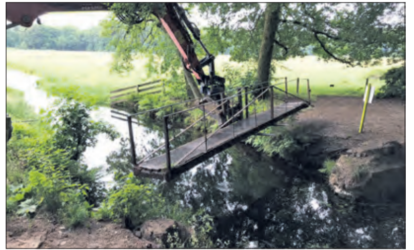
De brug wordt van zijn 'hoofden' getild.

Van Traa vervolgt: 'De 'Baron'-brug bestaat uit een gemetseld aan het uiteinde afgerond landhoofd aan de zijde (zuid) van het park, dat uitsteekt in het water en boven het water uitkomt. Het landhoofd was de basis voor het niet meer aanwe-