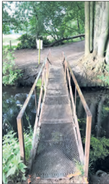
Een laatste foto van voor de restauratie.