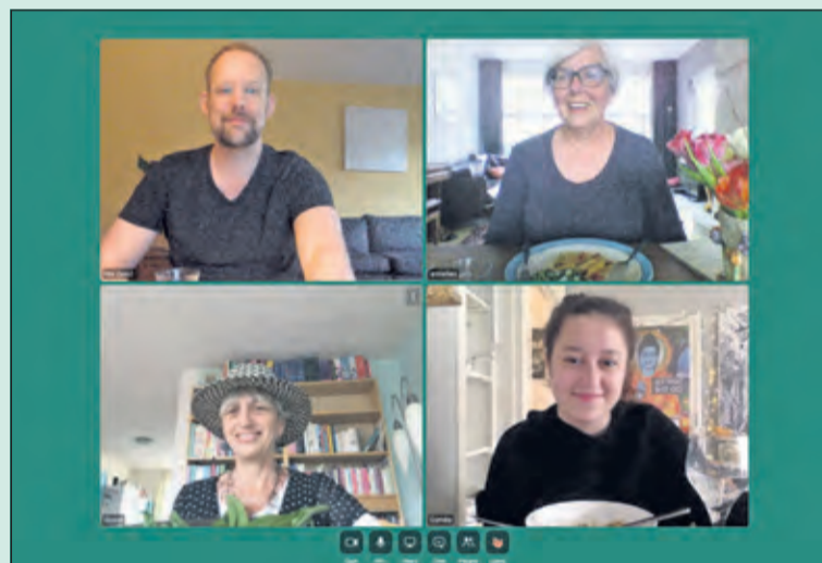
Digitaal samen eten kan toch heel gezellig zijn.

Nieuwe mensen ontmoeten is deze zomer nog lastig. Evenementen gaan voorlopig nog niet door. De gesprekjes bij het koffieautomaat zitten er voor thuiswerkers nog steeds niet in. De sportschool is nog dicht. Het blijft de komende tijd lastig om spontaan nieuwe mensen te ontmoeten.