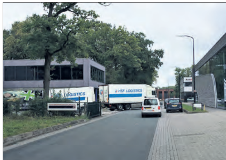
Volgens insprekers staan er gedurende de week al diverse vrachtwagens op de weg, waardoor andere bedrijven slecht toegankelijk zijn.