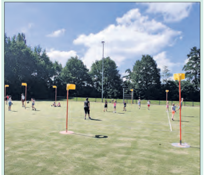
Afgelopen zaterdag was er een open training bij Tweemaal Zes. In totaal waren er 40 kinderen waarvan 14 nog niet korfbal speelden. Na 1,5 uur hard gesport te hebben was het tijd om af te sluiten. Na een warme dag was een ijsje wel op zijn plek. Daarnaast kreeg iedereen een speciale TZ sticker. Alle vriendjes en vriendinnetjes zijn welkom om nog eens te komen. (Reinier Enschedé)