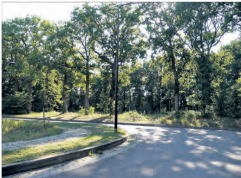
De directeur-eigenaar van het tegenoverliggende bedrijf Auto Larenstein: 'Het uitkijken op de groenstrook is 'uniek en waardevol' voor een bedrijfspand'.