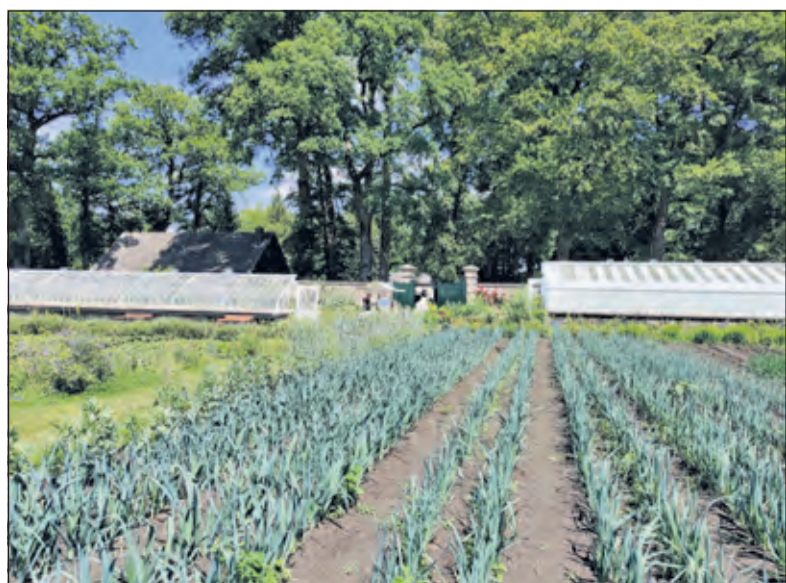
Op een moestuin is corona vaak ver weg; 'Zo'n tuin is goed voor je geest'.