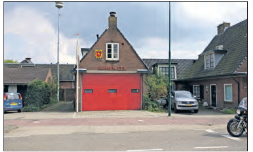
De huidige post in Groenekan. [foto 2017]

Op basis van de positieve resultaten van het eerste verkenningsonderzoek heeft het College de VRU gevraagd het vervolgonderzoek te starten. Mocht uit nader onderzoek alsnog blijken dat een fusiepost niet