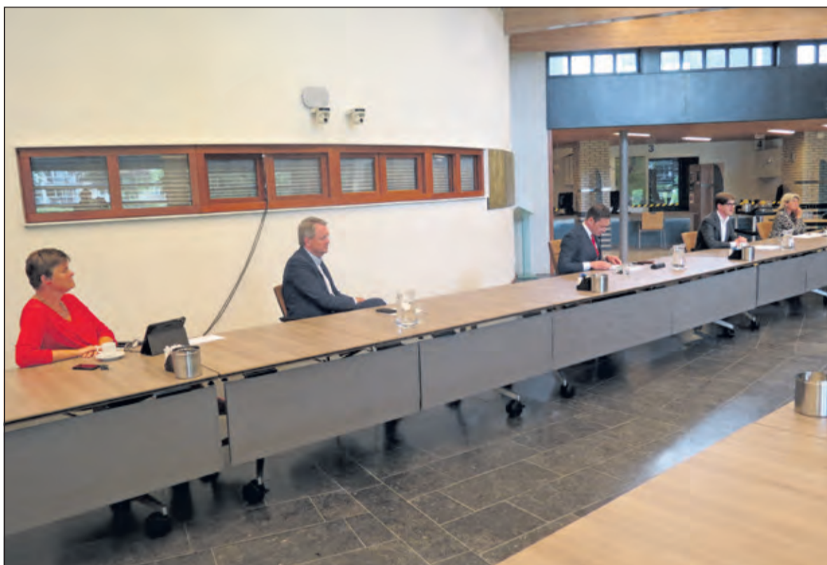
Het college geeft met ruime onderlinge afstand een toelichting op de jaarrekening.

ten dat de bijdrage van het Rijk als compensatie voor onder meer de coronamaatregelen lang niet altijd voldoende zal zijn. Vorig jaar is het gelukt de lasten voor de burger niet te verhogen maar voor dit jaar is alles nog ongewis. We kunnen door deze onduidelijkheid niet garanderen dat wat