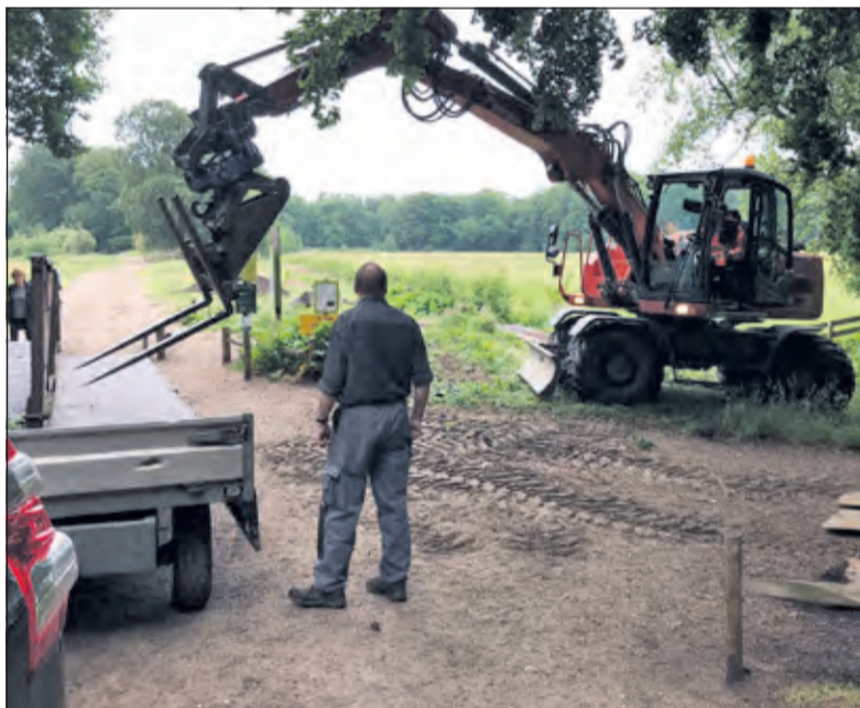
De brug kan worden afgevoerd.

Waar nodig en mogelijk worden ter plaatse herstellende en vervangende werkzaamheden verricht, waarna de brug weer zal worden teruggeplaatst. Pieter van Traa: 'In het huidige gebruik is de mogelijkheid van draaien niet meer noodzakelijk en gewenst. Toch wil de eigenaar (Het Utrechts Landschap) een restauratie uitvoeren, die recht doet aan de ruim 200 jaar oude brug en wordt de mogelijkheid tot draaien gerealiseerd, waarbij de brug wordt afgesloten/geborgd in een positie dat er kan worden overgestoken. Vier van de zes platen van het loopvlak zijn intact; de buitenste platen zijn deels beschadigd. Alle bestaande en te hergebruiken ijzerwerk zal moeten worden gestraald en voorzien van een coating'.