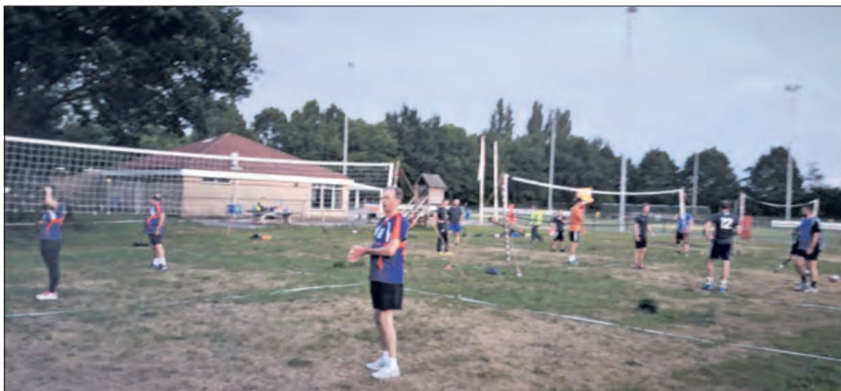
Ook de recreantengroep van Salvo speelt met veel plezier hun partijtjes in de openlucht.