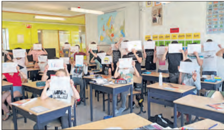
Groep 7 vindt het helemaal top om er weer te zijn!

Het was heel bijzonder hoe de kinderen op 11 mei de school weer inkwamen. Heel timide, heel voorzichtig. Dat de halve groep er maar mocht zijn drukte ook de kinderen met de neus op de bijzondere situatie. De tijd met halve groepen zorgde ervoor, dat kinderen wendden aan de maatregelen: het vele handenwassen, ook op school. Dat we niet meer allemaal tegelijk door dezelfde deur lopen, maar met afstand van elkaar de nooduitgangen ook gebruiken. En misschien wel het meest ingrij-