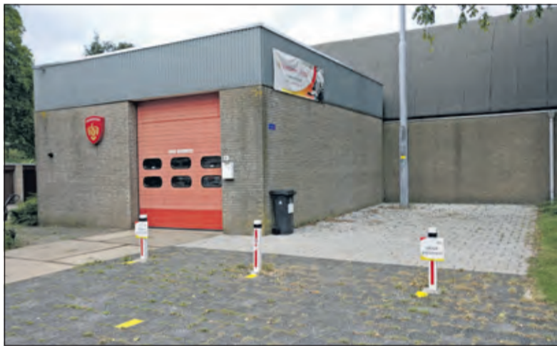
De huidige post in De Bilt. [foto 2017]

locatie een mogelijke herontwikkeling in het H.F. Wittegebied ('Nobelkwartier') in de weg staat. Daarnaast is nog niet duidelijk of de huidige post op de huidige locatie aan de gestelde eisen kan voldoen. Ook heeft het College de VRU verzocht om de nodige aandacht voor een tijdige communicatie met de betrokken brandweervrijwilligers.