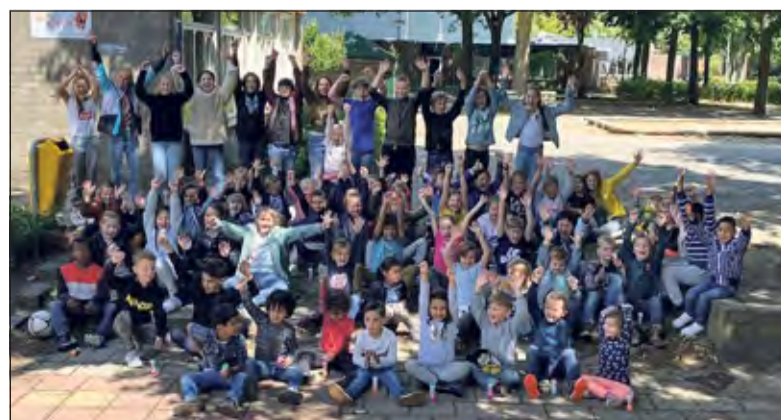
De Kievit is trots op haar leerlingen, blij dat ook echt iedereen weer op school en in goede gezondheid is.

duidelijke richtlijnen, samenwerking en de inzet van alle ouders hebben we het onderwijs op afstand de afgelopen tijd goed vorm gegeven.