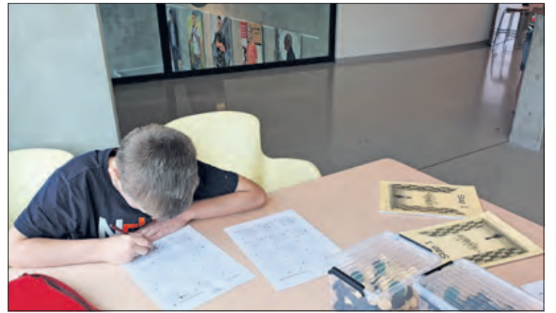
Eindelijk mochten de schaaklessen ook weer doorgaan.

pende: dat de ouders niet meer meelopen de school in, maar bij het hek gedag zeggen en je weer opwachten.