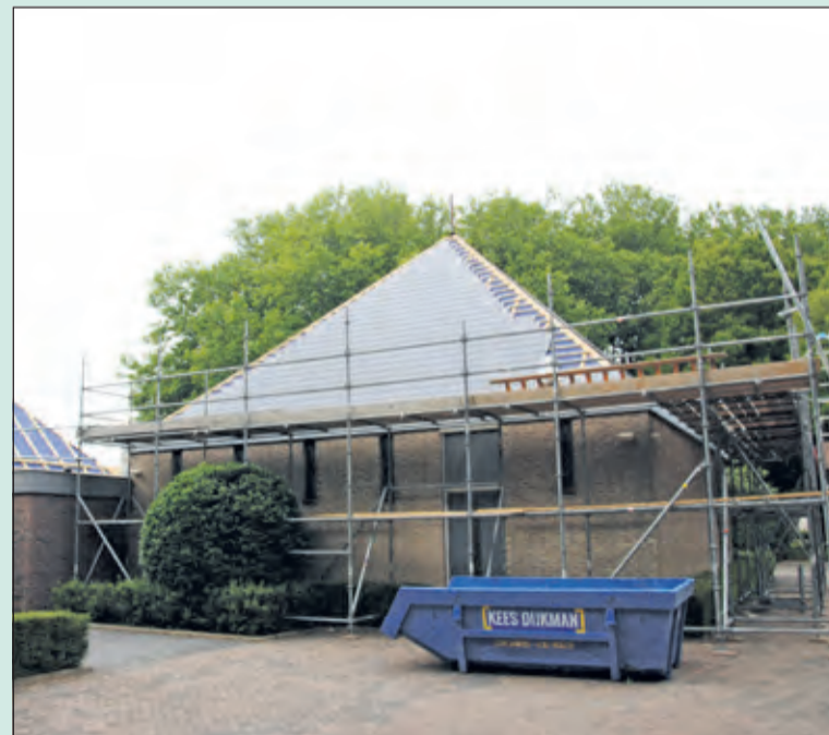
De kerk aan de Planetenbaan wordt gerenoveerd.