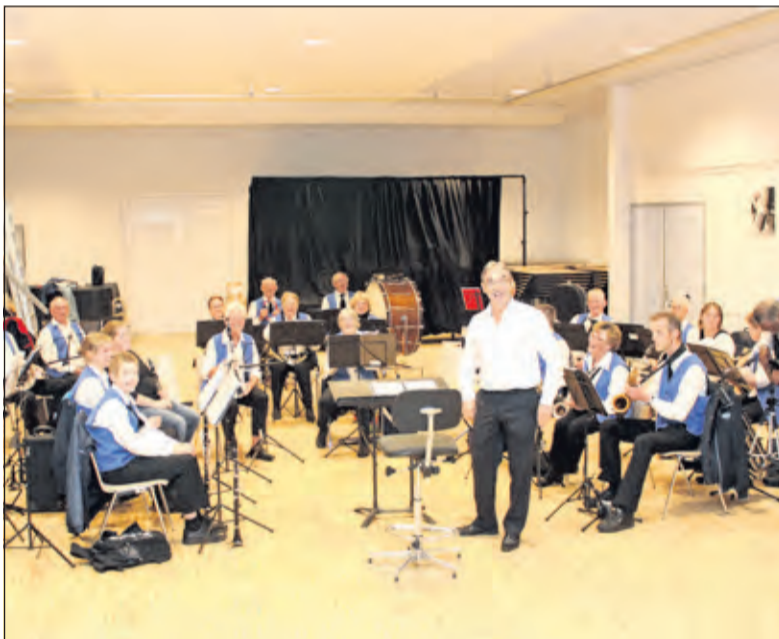
Lachende en tevreden gezichten bij Harmonie Kunst en Genoegen op de eerste oefenavond in een nieuw seizoen en een vernieuwde ruimte.

Ook vanuit de gebruikers van de sporthal komen positieve geluiden. De kleedkamers en de sporthal zelf zijn dan ook flink onder handen genomen. Sportambtenaar Wim Tigelaar krijgt ook namens de scholen alleen maar complimenten voor de mogelijkheden die er zijn voor het oude vertrouwde gymnastiekonderwijs. Ook de eerste zaalvoetbalwedstrijden zijn er alweer gespeeld. Edwin Plug: 'In zowel de sportzaal als de sporthal komen vanuit Stichting Vierstee 2.0 nog professionele geluidsinstallaties. Dankzij het nieuwe ventilatiesysteem in zowel de grote sporthal als de toneelzaal en het horecagedeelte zal het verblijf daar nog aangenamer zijn dan vroeger. Op het dak van de kleine sportzaal zijn ruim 230 zonnepanelen gemonteerd. Verder is er overal LED-verlichting geplaatst, is het gebouw flink geïsoleerd en zijn er overal waterbesparende douchekoppen geplaatst. De renovatie heeft er aan bijgedragen dat het gebouw milieuvriendelijker is geworden'.