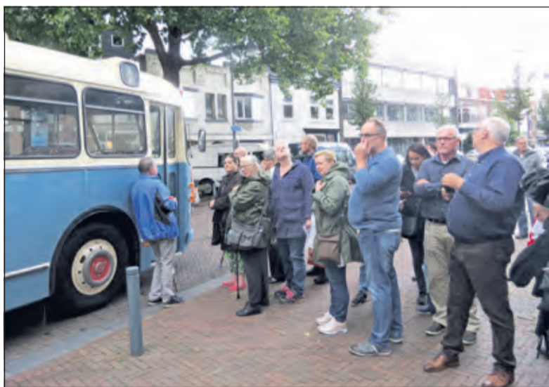
Wachten op de bus voor een rondrit door de gemeente.