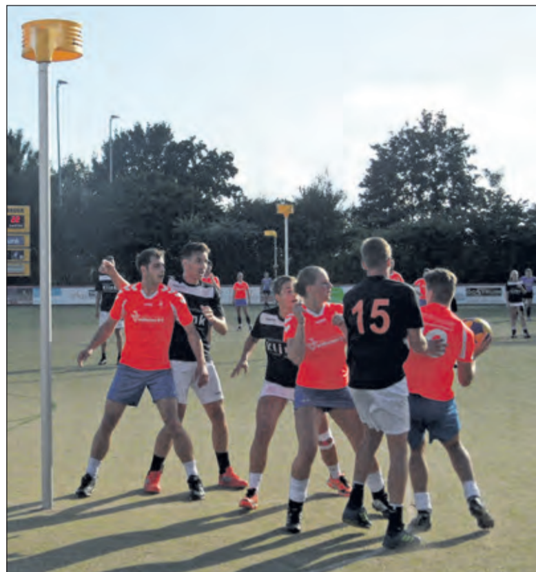
Een beeld van DOS-Oranje Wit van tussen de buien door.

Aanstaande zaterdag speelt DOS thuis om 15.30 uur. Tegenstander is wederom een Dordtse ploeg. Nu komt DeetosSnel naar Westbroek.