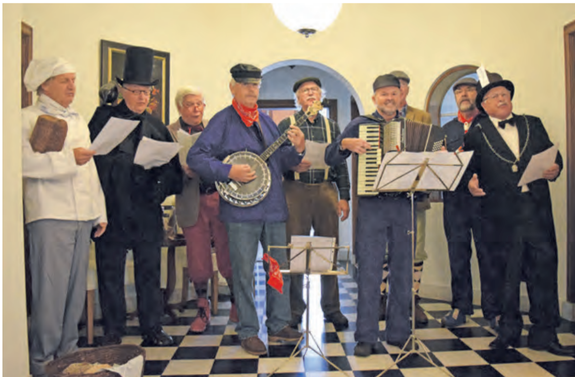
Sterk Spul zingt uit volle borst.

broek, voor degenen met honger konden terecht in Molen De Kraai in Westbroek voor een boerenlunch en bij Boerderij Eyckenstein was vlees van Jersey-stieren te koop. Los van Open Monumentendag vond in De Bilt nog de jaarlijkse kunstmarkt plaats in het Van Boetzelaerpark en kon men old-timers bewonderen in de Dorpsstraat.