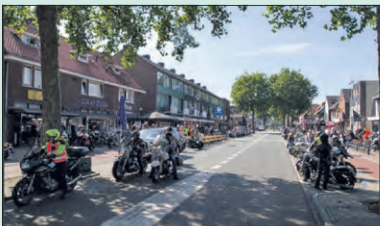
Hessenweg vol motoren.