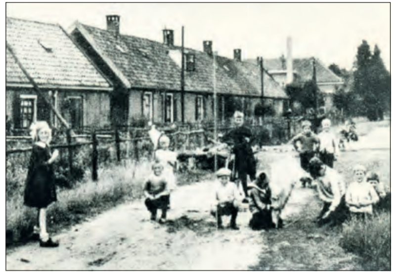
Achter de Vinkenlaan en de Julianalaan tegen de bosrand aan lag Het Jodendom (Koekoeklaan, Koekoekdwarslaan en de Lange Buurt); een karakteristieke arbeiderswijk.

'Het eigenaardige was alleen dat de borden niet op elkaar aansloten. De lokale krant had geconstateerd dat er borden Bilthoven waren geplaatst op de Soestdijkseweg nabij de hoek Noord Houderingelaan en aan het eind van de 1e Brandenburgerweg nabij de hoek Hertenlaan. Maar richting De Bilt stonden de borden De Bilt op de Groenekanseweg nabij de hoek Dr. Letteplein en op de Eerste Brandenburgerweg precies voor de uitrit van de Stenen Camer. Nog zuidelijker stond een grensbord De Bilt aan het begin van de Looydijk, nabij de Soestdijkseweg. Er was dus een stuk niemandsland ontstaan waarvan niemand precies wist tot welke kern dit hoorde. Bewoners hadden de indruk dat de borden lukraak werden neergezet en dit wekte vaak ergernis of lachlust op. Waarschijnlijk is daarna besloten om een meer duidelijke grens tussen de twee woonkernen in te stellen. Wanneer precies is niet duidelijk, maar in de tijd dat Brandenburg-West gebouwd was, stonden er borden Bilthoven bij de Grote Beer en op de 1e Brandenburgerweg net voorbij de ingang naar het Rijksinstituut voor de Volksgezondheid'.