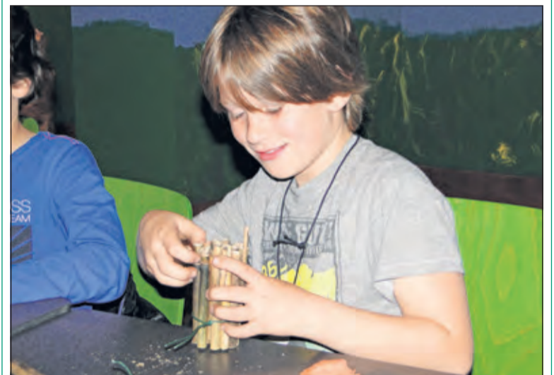
Kinderen maken een insectenhotel.

KinderNatuurActiviteiten organiseert activiteiten voor kinderen in en over de natuur. Dit wordt gedaan onder leiding van vrijwilligers van Utrechts Landschap en IVN De Bilt. Woensdag 20 september wordt er een Insectenhotel gemaakt. en is er wat lekkers met limonade. Leeftijd: 6 t/m 10 jaar. Tijd: 14.30 tot 16.30 uur. Plaats: Paviljoen Beerschoten, De Holle Bilt 6 in De Bilt. Aanmelden per email kan tot en met zaterdag 16 september via kinderatuuractiviteiten@gmail.com .