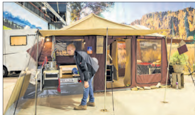
De kampeertiefhebber kan zijn hart binnenkort weer ophalen in de Jaarbeurs.

Langs de Innovatieroute zijn de nieuwste gadgets en de winnaar van de Start Up Contest te vinden. Bovendien kan dit jaar iedereen op de 'Kampeer & Caravan Jaarbeurs' camping blijven overnachten direct naast het beurscomplex. 11 t/m 15 oktober in de Jaarbeurs te Utrecht.