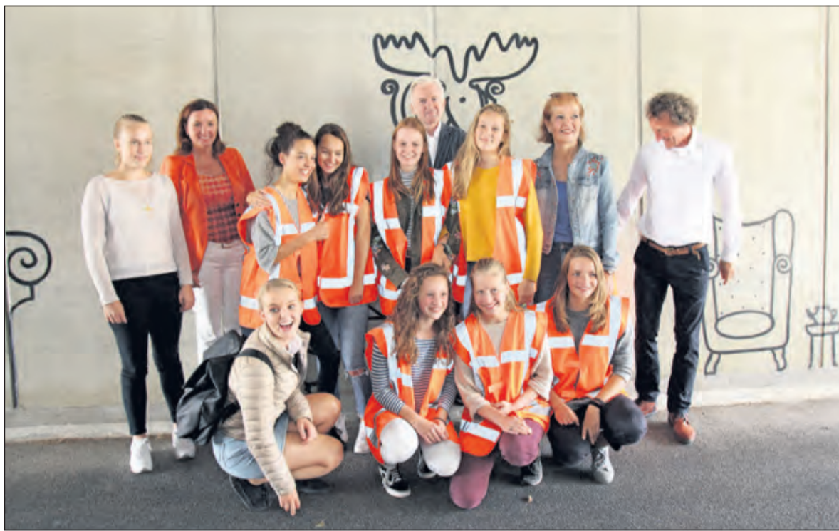
Leerlingen van de Stichtse Vrije School in Zeist ontwierpen en realiseerden een kunstwerk in de fietstunnel bij landgoed Vollenhoven.

op de wanden geschilderde ramen, kijkt men in de richting van het landgoed bij Vollenhoven binnen en zie je onderdelen van het interieur. Vanuit het landgoed kijk je op de tegenover gelegen wand geschilderde tekeningen door ramen naar de Wegh der Weegen. De provincie Utrecht reageerde enthousiast op het ontwerp van de leerlingen en zette zich gezamenlijk met de Stichting Wegh der Weegen in om van dit project een succes te maken.