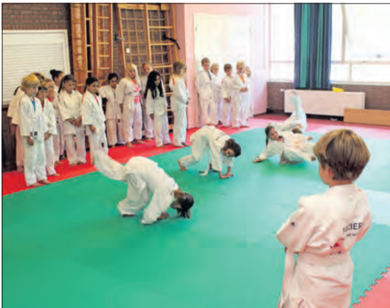
Vallen en opstaan moet je leren en je omgeving heeft daar invloed op.

Alle leerlingen trekken, voor de les begint, een judo-pak aan. Klok: 'Nog voordat de les begint, zie je al samenwerking. De kleineren uit groep 1 en 2 worden in hun pak gehesen door de leerlingen uit hogere groepen. Ook respect voor de ander wordt hen al direct bijgebracht, door elkaar de hand te geven, voor en na de les'. Tijdens de les van 45 minuten voor groep 1 en 2 en een uur voor groep 3 t/m 8, wordt niet alleen geleerd samen te werken, maar ook hoe je je val kunt breken, voor jezelf op te komen en allerlei behendigheidsoefeningen gedaan'. Buis tenslotte: 'Door voor jezelf op te komen, krijg je ook meer zelfvertrouwen en dat straalt je uit. Binnen Schooljudo noemt men dat 'Skills voor Life', vaardigheden opdoen voor de rest van je leven'