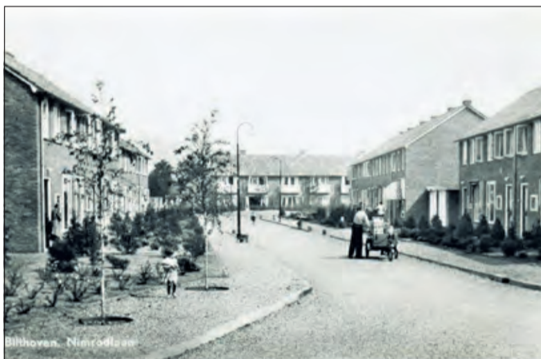
De 'achtertuin' van wijk Vogelzang was het gebied waar nu de wijk Jachtplan ligt. De straten kregen namen die verband hielden met de jacht. De Nimrodlaan is vernoemd naar Nimrod, een achterkleinzoon van Noach. Hij werd gezien als een geweldig jager die door niemand overtroffen werd. We zien de straat hier in 1952.

puist, die gelukkig grotendeels verscholen ging achter de Julianalaan. Tuindorp lag ver genoeg weg voor de Bilthovenaar om daar niet mee geassocieerd te hoeven worden. Bij een naderende grenswijziging in de jaren '20 van de vorige eeuw, was er zelfs een groep bewoners uit Bilthoven, die een zelfstandige gemeente wilde vormen, wanneer de kern De Bilt door de grenswijziging bij Utrecht gevoegd zou worden. Delen van Zeist zouden zich bij deze nieuwe gemeente kunnen aansluiten. Bosch en Duin, Den Dolder en Huis ter Heide vertoonden veel overeenkomsten met Bilthoven 'wat aard, samenstelling en belangen betreft'. De gemeente Zeist was 'not amused': De burgemeester van Zeist noemde de Bilthovenaren 'ingezetenen, die aan ongemotiveerde landhonger lijden en wier fantasie geen grenzen kent'. Hij vervolgt zijn relaas met de woorden: 'Het is toch immers meer dan belachelijk, dat een buurtschap, die 40 jaar geleden amper bestond, de pretentie heeft ongeveer een derde van de gemeente Zeist, die een geschiedenis van eeuwen achter zich heeft in te palmen met het eenig motief het verkrijgen van een bloeiende gemeente met een behoorlijk afgerond grondgebied'. [Bron: Het Vaderland, 25-07-1925 en andere kranten]. Anno 2017 is er veel veranderd. 'De Bilthovenaar' kent vele gezichten en is te vinden in een veelheid aan wijken'.