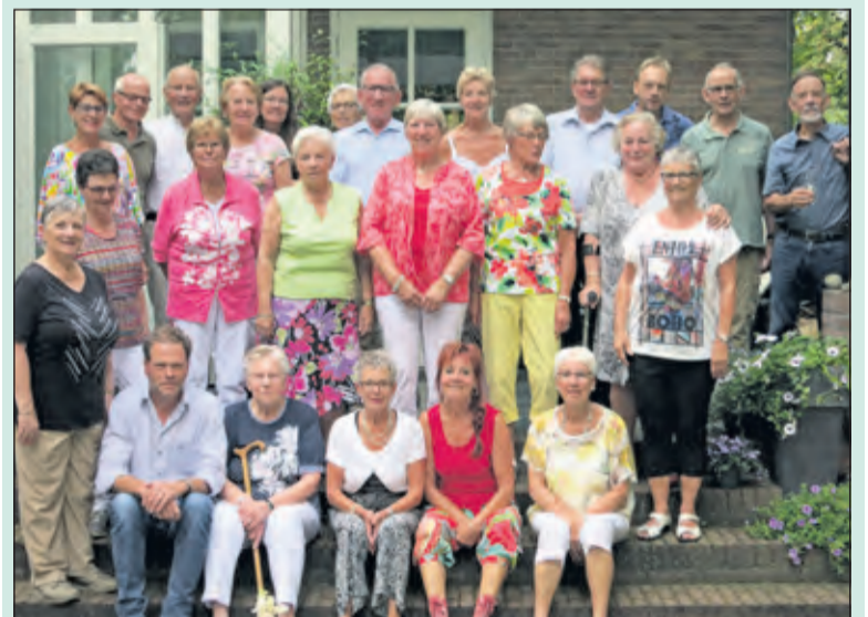
Ook voor Zang Veredelt is het nieuwe zangseizoen begonnen. Zang Veredelt heeft een zeer gevarieerd repertoire en repeteert iedere donderdagavond in de Opstandingskerk aan de Eerste Brandenburgerweg 34 te Bilthoven. Nieuwe leden zijn van harte welkom. Bel voor meer info 030 2200153.