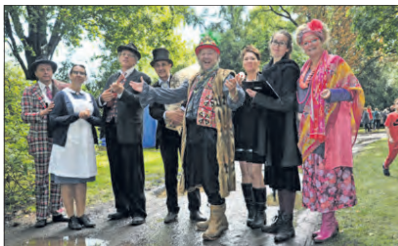
Het van Boetzelaerspark was tijdens de Kunstmarkt De Bilt 2017 een heel natte bedoening.