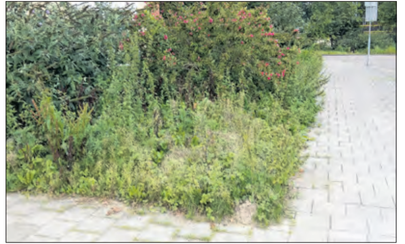
De groenstrook voor de huizen bij Tweelingen.

'In navolging van een buurvrouw van drie woningen verderop heb ik de gemeentelijke groenstrook geadopteerd. Je bent dan verantwoordelijk voor het onderhoud. De gemeente heeft wel eerst alle struiken en onkruid uit de groenstrook verwijderd. Tevens is afgesproken dat er geen hek of schutting om de tuin geplaatst mag worden. Helaas is het niet voor iedereen weggelegd om de groenstrook te adopteren en er een mooie tuin van te