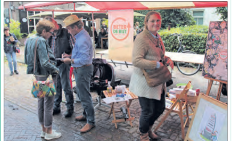
De hevige regenbuien die af en toe neerkletterden weerhielden belangstellenden niet om op zaterdag 9 september de negende Markt- en Oldtimerdag in Het Oude Dorp De Bilt te bezoeken. De schaarse droge momenten waren ook hoogtepunten voor bijvoorbeeld de kramen van de politieke partijen als Beter De Bilt (foto), ChristenUnie, GroenLinks, SGP en SP.