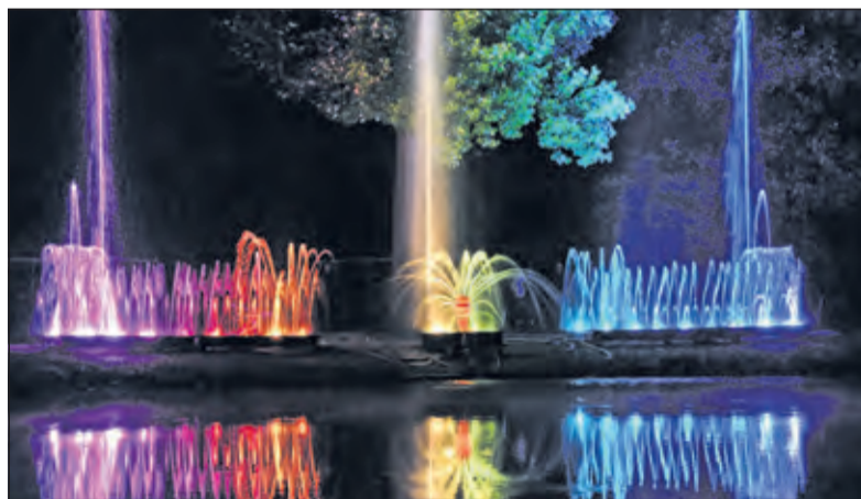
Het waterorgel symboliseerde de vriendschappelijke samenwerking tussen De Bilt en Coesfeld.

Voor één keer werd het park omgedoopt in 'El Parque de los Amigos'. Dat had alles te maken met de vrienden van Baron Van Boetzelaer.