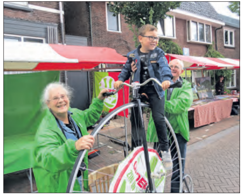
GroenLinks trekt aandacht met een fiets uit vroegere tijden.

Er is een beperkt aantal gratis kaarten beschikbaar voor de lezers van De Vierklank. Stuur een mail naar info@vierklank.nl om hiervoor in aanmerking te komen. De kaarten worden maandag 18 september verloot onder de inzenders.