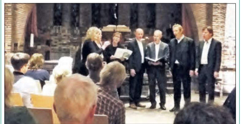
Von Bilthoven in een prachtige vertolking 'Can't help falling in love with you'