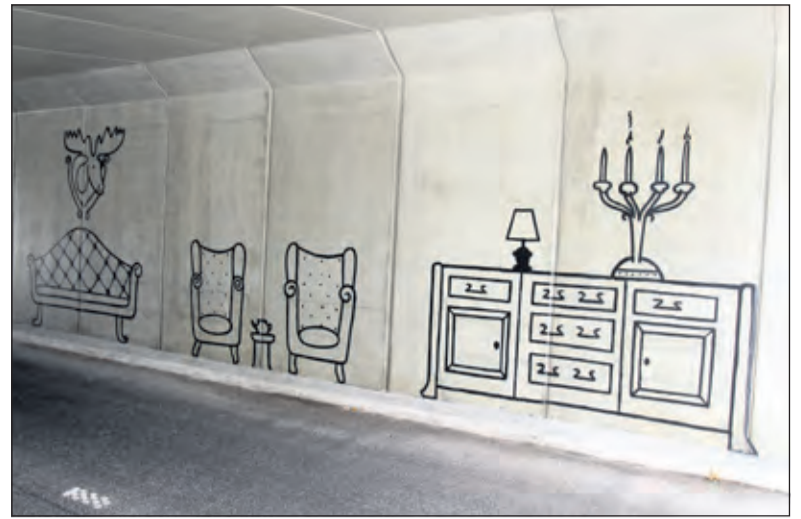
Door grote, op de wanden geschilderde ramen kijk je in de richting van het landgoed bij Vollenhoven binnen en zie je onderdelen van het interieur.