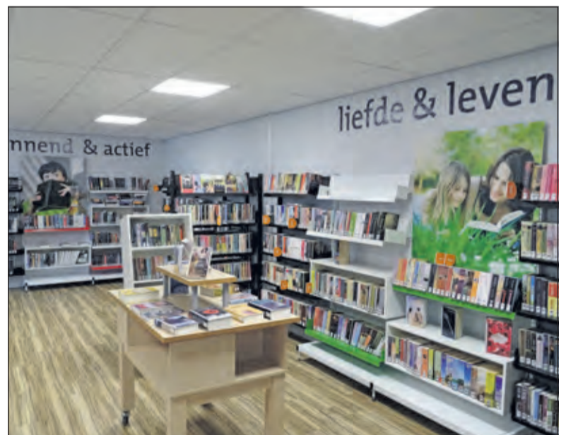
De collectie is ingedeeld in verschillende werelden, op basis van doelgroepen en interesses. Een blik op twee van de werelden die allen een eigen kleur hebben.