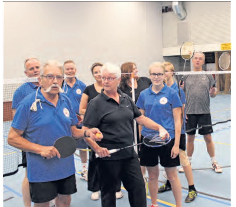
De leden van Badmintonvereniging Reflex zijn blij met de ruimte en het licht in De Vierstee.