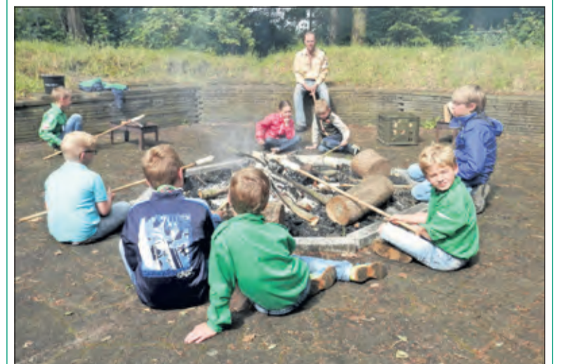
Broodjes bakken boven het vuur tijdens scout-mee-day

De scout-mee-day is niet alleen voor kinderen die zelf graag op scouting willen. Ook kinderen en volwassenen die gewoon zin hebben in een gezellige middag zijn van harte welkom. Schrijf het vast in de agenda: zat. 16 sept. vanaf half één 's middags. Het clubhuis staat aan de Dierenriem 10, achter de sportvelden in Maartensdijk. (Kris Hekhuis)