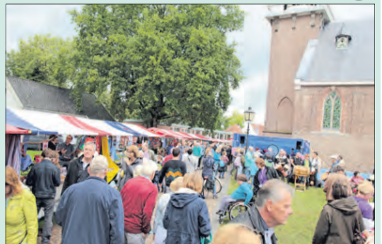
De Marktdag in De Bilt zorgde zoals gewoonlijk weer voor grote drukte op het terrein rond de Dorpskerk. Zie ook pag. 7