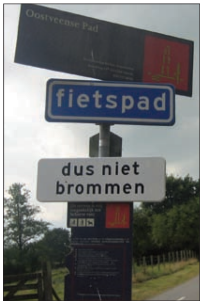
Aan beide zijden staan er duidelijke borden, onder andere met de tekst 'fietspad' en 'dus niet brommen'.

zijn. Dat blijkt niet het geval. Onze boswachters controleren van tijd tot tijd en bekeuren ook, maar kunnen er niet de hele dag rondhangen. Toch is er een eenvoudige oplossing. Als omwonenden ons nu eens melden wanneer precies de meeste overtredingen plaatsvinden dan zorgen wij ervoor dat juist dan de boswachters ter plaatse zijn. Men hoeft mij alleen maar te bellen op 030 2610186.'