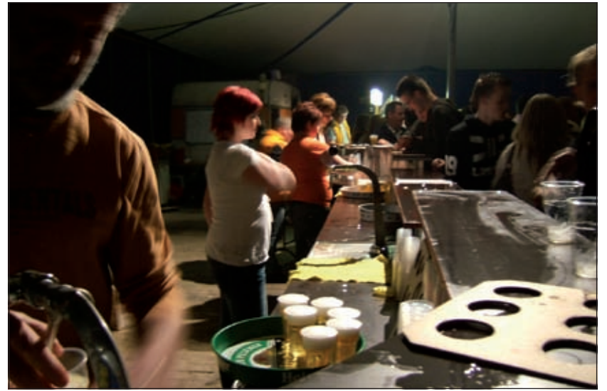
§ eerbeeld feestavond Oranjevereniging Westbroek.

Met de avond op 3 oktober probeert de Oranjevereniging ook iets van het financiële verlies wat ze heeft geleden op 30 april weer goed te maken. Daarom zal een deel van de opbrengst van de consumpties ook naar de vereniging vloeien vertelt voorzitter én