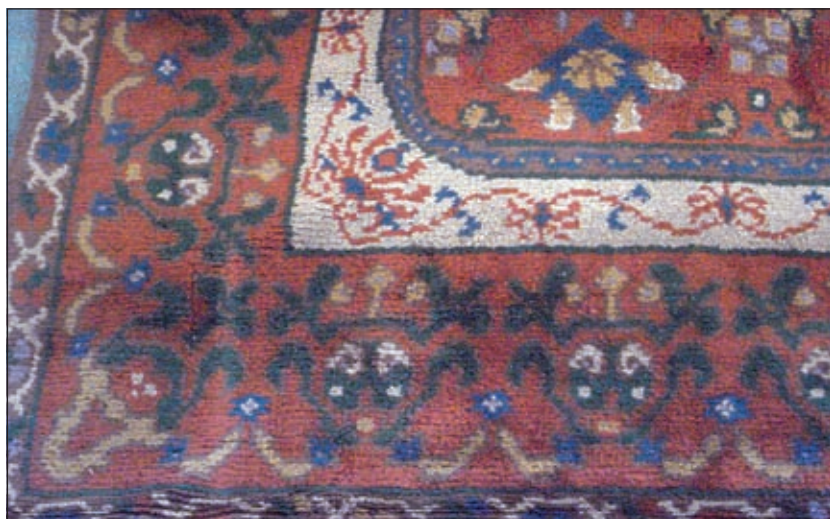
Kinheim tapijt 1932.

het wapen van de afzender. Door de toename van de hoeveelheid papieren werden de documenten gaandeweg in een leren tas vervoerd en raakt de bodebus in onbruik. De bodebus bleef voortbestaan als insigne. Aan de hand van de bodebus was een bode dus herkenbaar. In vroeger tijden gaf het tonen van de bodebus soms recht op gratis 'openbaar vervoer', zoals het gebruik van de veerpont, trekschuit of diligence. Douwe: 'Ook de Bilt moet een bodebus gehad hebben, daar wordt nog naar gezocht. Ook verrassend is de vondst van de burgemees-