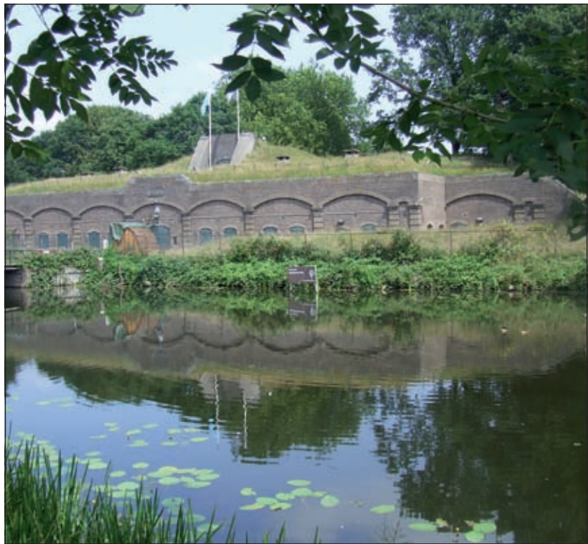
Fort Ruigenhoek, een unieke locatie voor een spectaculair evenement.

Het evenement gaat zaterdagmiddag 5 september om vijf uur van start. In het theatercafé kunnen bezoekers in