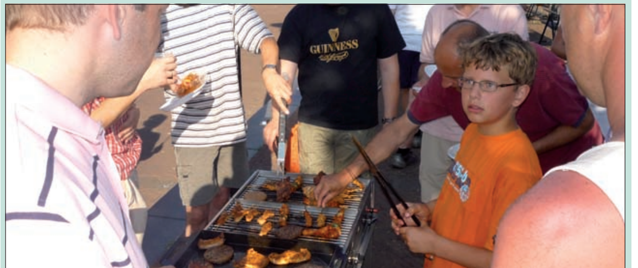
Veel bewoners van de wijk Prinsenhof in Maartensdijk hebben op zaterdag 4 juli genoten van een gezellige gezamenlijke dag. De leeftijd van de deelnemers varieerde van 10 maanden tot 70 jaar. 's Middags konden de kinderen genieten op de twee springkussens, aansluitend volgde een borrel en BBQ op het middenplein van de Nassauhof. Voor 's avonds was een ijscoman geregeld en rond 23.30 uur was alles weer opgeruimd en kon iedereen tevreden terug naar zijn eigen huis [MD].