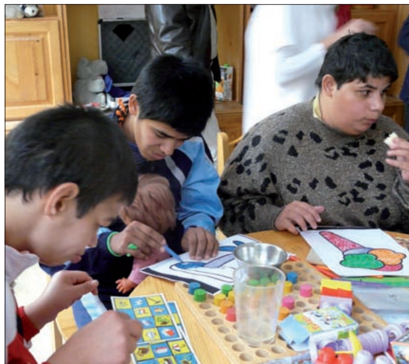
De vrijwilligers van de Bouworde zorgen voor meer aandacht voor de jongeren in Djurkovo.

Dank zij acties en giften van mensen die betrokken zijn, zoals laatst bij Hairdesque, kan het werk van de stichting Kiro worden voortgezet.