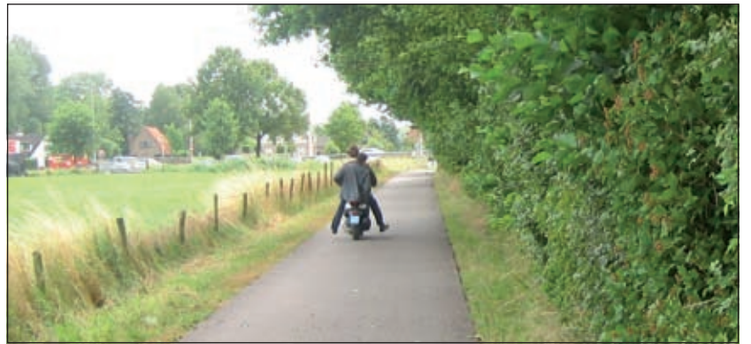
Op het Oostveensepad wordt regelmatig gebromd.