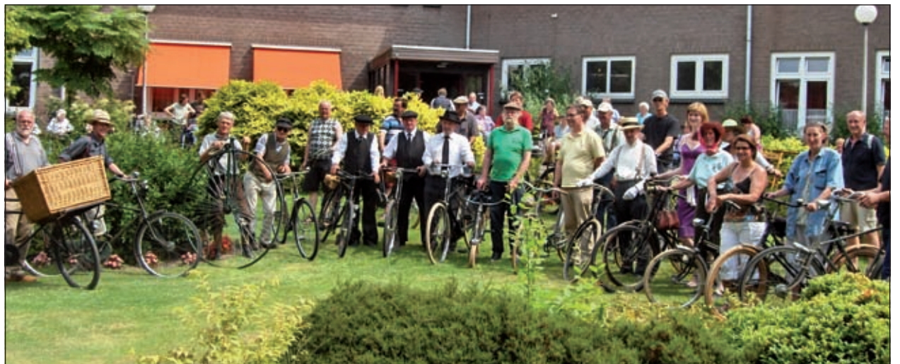
Na hun laatste toegift en de gezamenlijke groepsfoto werd de thuisreis weer aanvaard.