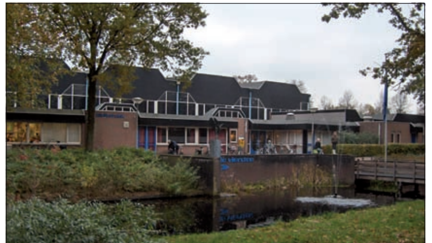
Het college van Burgemeester en Wethouders van de gemeente De Bilt heeft besloten de proefperiode van een beperkte zondagopenstelling van sporthal De Vierstee te verlengen voor het seizoen 2009/2010.

Daarom, maar tevens rekening houdend met de bezwaren van een deel van de inwoners, heeft het college besloten om de proefperiode van een beperkte zondagopenstelling van sporthal De Vierstee te verlengen voor het seizoen 2009/2010.