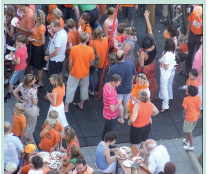
De Julianaschool in Bilthoven sloot vrijdag 3 juli het schooljaar traditioneel af met een barbecue. Prinses Juliana, waarnaar de school is vernoemd, werd honderd jaar geleden geboren dus kwam bijna iedereen in het oranje.

Vuursche Pad (fietspad) naar Hollandsche Rading en vervolgens naar Lage Vuursche te toeren. Bij verpleeghuis St. Elisabeth werd opnieuw gepauzeerd en het was een voorrecht getuige te mogen zijn van het zichtbare plezier, dat de vélocipède en het zwijgtje met hun berijders bij de bewoners van het verpleegtehuis opriepen. Onder voortdurend applaus reden de pedaalridders rondje na rondje, om daarna na hun laatste toegift en de gezamenlijke groepsfoto weer richting het punt van vertrek te gaan.