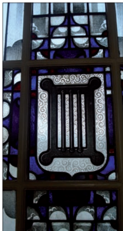
Toograam door Atelier Bogtman, Haarlem 1932.

Op de vraag wat volgens beiden het toppunt van de tentoonstelling is, antwoordt Douwe: 'Ik denk meer het zwaartepunt: een wollen, meer dan 100 kg zwaar, handgeknoopt tapijt van de Beverwijkse firma Kinheim. Dit tapijt is in 1932 geleverd t.b.v. de verbouw van Jagtlust tot gemeentehuis, waarschijnlijk voor de raadzaal. In een brief van de firma Kinheim van 14 mei 1932 staat de volgende