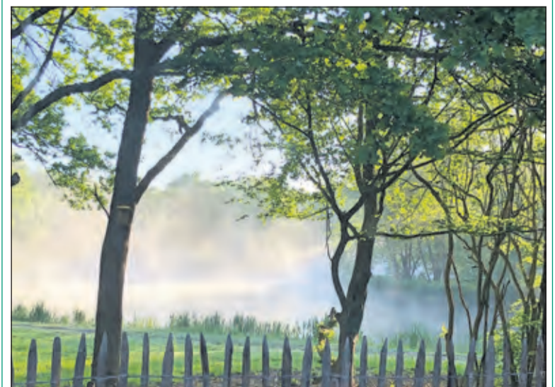
De ijsbaan in De Bilt ontwaakt in het voorjaar.