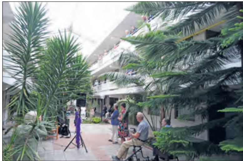
Vanaf de balustrade volgen de bewoners van Dijkstate de feestelijkheden.

De keukenbakjes zijn luchtdoorlatend van gerecycled kunststof. In het bakje komt een speciaal zakje van composteerbaar plastic. De ventilatieopeningen in het bakje zorgen ervoor dat het keukenafval uitdroogt. Hierdoor worden geuroverlast en fruitlegjes beperkt. Indien nodig kan het bakje in de vaatwasser. Van de uitreiking van de keukenbakjes maakten gemeente en bewonerscommissie Dijkstate er een feestelijke bijeenkomst van die door de bewoners vanwege coronamaatregelen vanaf de balustrade voor hun appartementen werd bijgewoond. Om 14.00 uur startte de bijeenkomst met een optreden van zangeres Marian, die vanuit het atrium de bewoners toezong, wat zeer in de smaak viel.