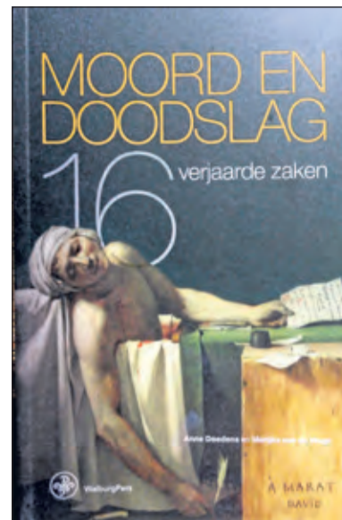
De omslag van het 'actie'-boek.