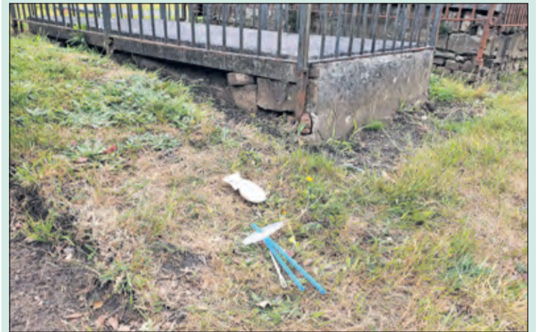
Bezoekers aan de kerktuin laten afval achter.

De begraafplaats rond de Hervormde kerk aan de Dorpsstraat in De Bilt is idyllisch gelegen tussen het eeuwenoude groen. Ooit een rustige plek voor overledenen en nabestaanden. Nu is van die rust echter niets meer te merken. Voorbijgangers genieten van hun ijsje en bakje patat op de rand van de soms eeuwenoude zerken.