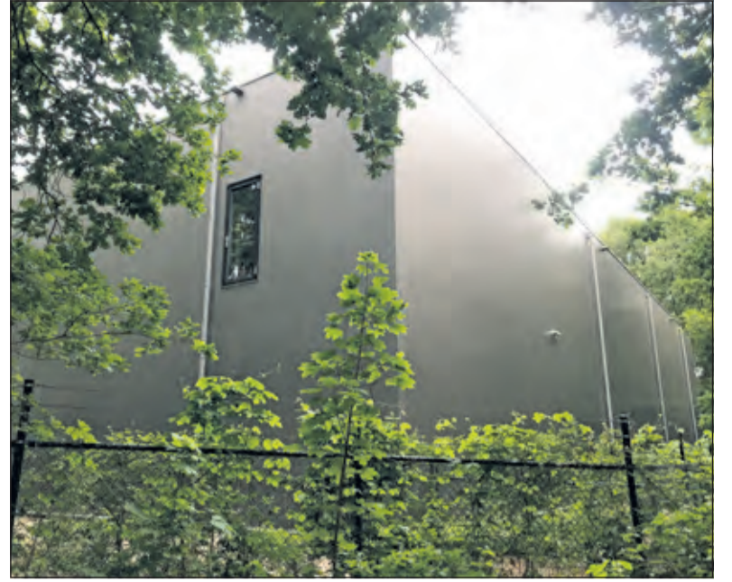
Dit beeld van de achterzijde van C. de Haasweg 6 zal na realisatie in noordelijke richting verdubbelen.

De Vogelwacht Utrecht onderschrijft de inhoud van de door Stichting Milieuzorg Zeist e.o. ingediende zienswijze en vraagt aan het College en de raad zich nader te bezinnen over de vragen rondom 'nut en noodzaak' van het ruimte bieden aan uitbreidingswensen van een vleesimporteur.