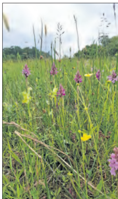
Hooi van kruidrijk blauwgrasland wordt ook wel apotheekhooi genoemd.

Helaas is volgens Baas de gezonde voeding door middel van kleinschalige landbouw bij lange na niet in staat om de miljarden mensen en hun vee wereldwijd te voeden. Bovendien wonen de meeste mensen vooral in miljoenensteden, ver verwijderd van de natuur. Natuur, die wereldwijd zienderogen verdwijnt om plaats te maken voor meer grootschalige landbouw en veeteelt: ‘Ontbossing leidt tot ontwateren en verdwijnen van de vruchtbare teelaarde waardoor grote delen