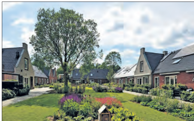
In Zwolle is al een Knarrenhof gerealiseerd.

Knarrenhof: het woord knar zal iedereen bekend voorkomen die oud genoeg is om zich de programmareeks 'Krasse knarren' van Koot & De Bie te herinneren. De naam klinkt grappig en geeft die droom in één woord weer. Het is een stichting van en voor mensen van 55+ die proberen in allerlei plaatsen zo'n woonvorm tot stand te brengen. Op de website ( www.knarrenhof.nl ) staat het duidelijk: