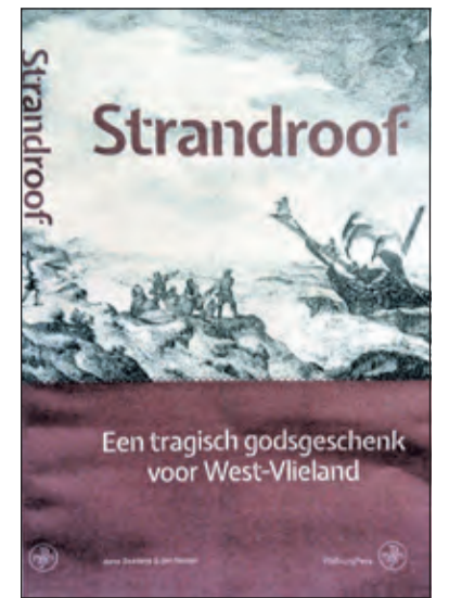
Strandroof is nog niet verschenen en is beschikbaar vanaf 16 juni.