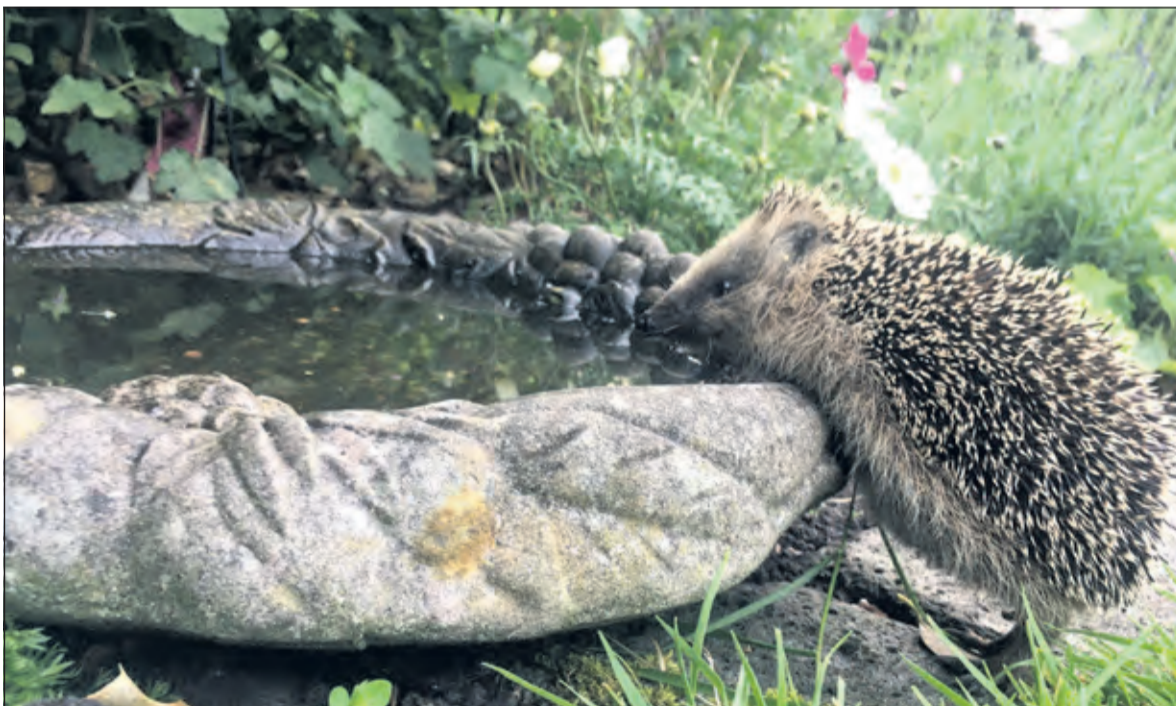
Blijkbaar had deze egel zo veel behoefte aan wat vocht in deze droge tijd dat hij op klaarlichte dag in een tuin aan de Molenweg in Maartensdijk zijn dorst kwam lessen.