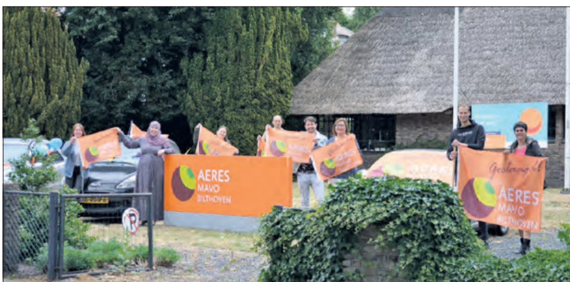
Alle geslaagden van Aeres Mavo ontvangen een vlag.