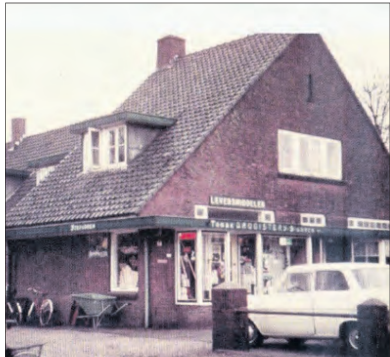
De winkel in de jaren zestig van de vorige eeuw.

‘Neut’ is niet weg te denken uit Groenekan en je kan het zo gek niet bedenken of ze hebben het wel. Het mag dan geen supermarkt meer zijn, maar voor aardappels, wat lekkere snacks en ijsjes kan je er nog steeds terecht.