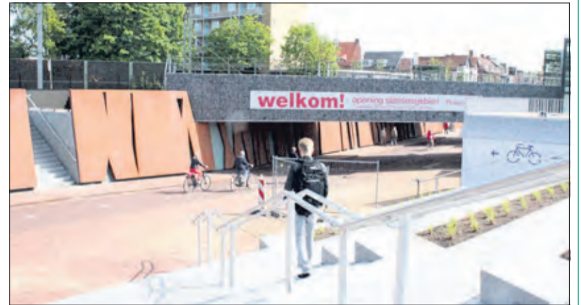
Bij de trappen van de onderdoorgang naar het stationsgebied is beplanting aangebracht waarmee een stuk nieuwe natuur is ontstaan bij het station.

't Is precies 5 jaar geleden, dat het werk aan het stationsgebied in Bilthoven gereed kwam. ProRail en de gemeente De Bilt bouwden in drie jaar tijd twee nieuwe onderdoorgangen onder het spoor door voor auto's, fietsers en voetgangers. Op zaterdag 30 mei 2015 was de feestelijke heropening van het vernieuwde stationsgebied. [HvdB]