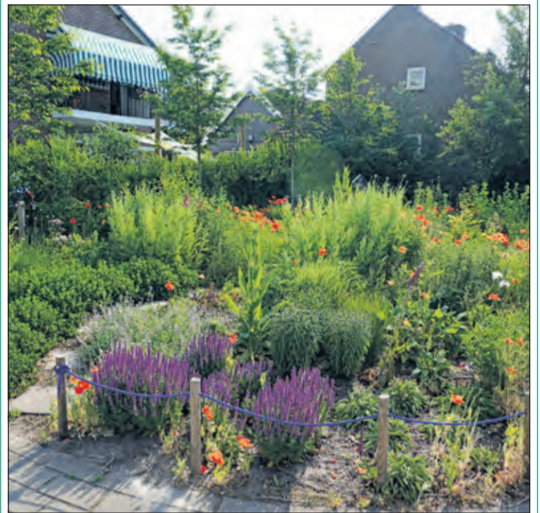
De grond van de mooie buurttuin in De Bilt (hoek Aeolusweg/Cirrusweg) is door de gemeente ter beschikking gesteld en wordt als buurttuin beheerd door meerdere omwonenden. De bloemenpracht is overweldigend. (Frans Poot)