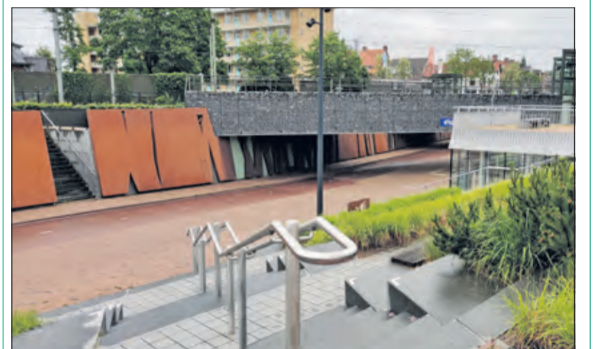
De beplanting bij de onderdoorgang naar het stationsgebied is in die vijf jaar goed ontwikkeld.

Enkele verschillen ten opzichte van het Klanttevredenheidsonderzoek van twee jaar geleden: