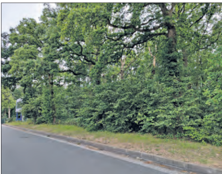
Tegen de uitbreidingsplannen, die nu voorliggen is weerstand en vooral tegen het kappen van de bomen. Daarnaast wordt de toename van verkeer genoemd als risico.

De raadsvergadering van 25 juni begint om 20.00 uur en is te volgen via raadsinformatie.debilt.nl.