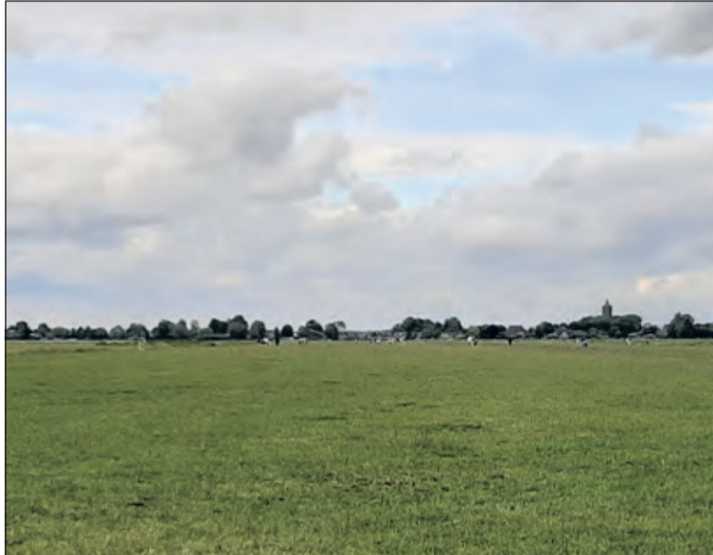
Agrarisch weiland met aan de einder de kerk en de molen van Westbroek.