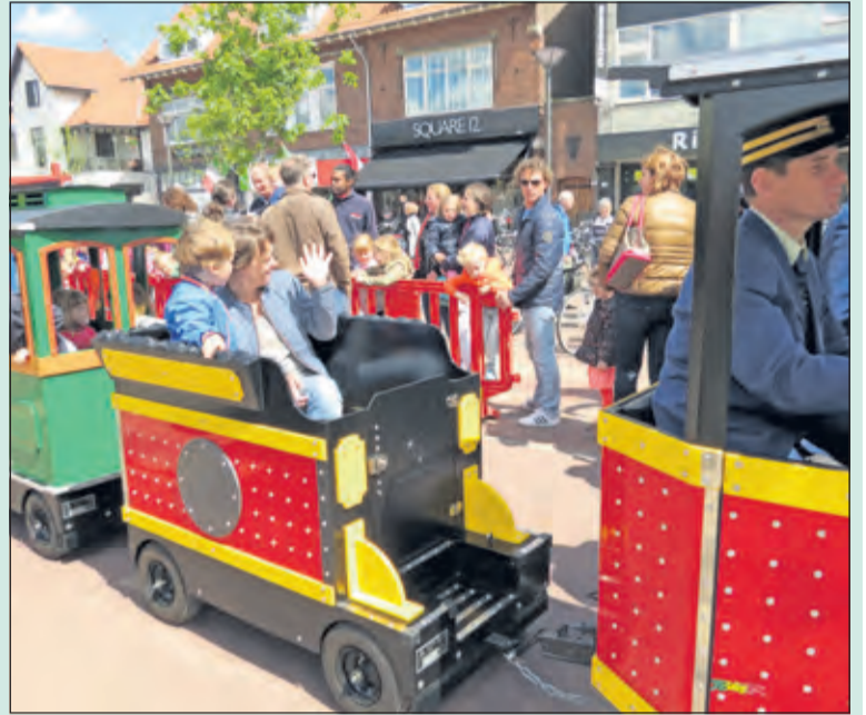
Het is precies 5 jaar geleden dat het stationsgebied in Bilthoven feestelijk heropend werd. Kijk op pag 6. voor meer foto's.