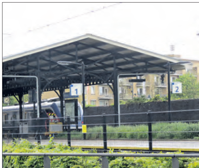
Het station Bilthoven krijgt in het IRP een belangrijke functie. Zie pagina 3