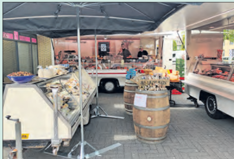
Vanaf vrijdag 14 mei is de winkel op het Maartensplein gesloten. De verkoop zal tijdens de verbouwingsperiode plaatsvinden vanuit twee markt wagens.

Vanwege een grondige verbouwing bij Kwaliteitsslagerij Zweistra in Maartensdijk zal de komende 8 weken vanuit twee markt wagens het normale assortiment aan verse kwaliteitsproducten worden verkocht.