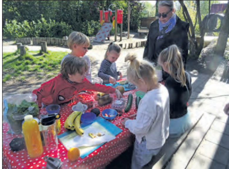
De kinderen doen hun best om lekkere smoothies te maken

'De activiteiten vinden op vier verschillende plekken in en om de school plaats. De groepen wisselen