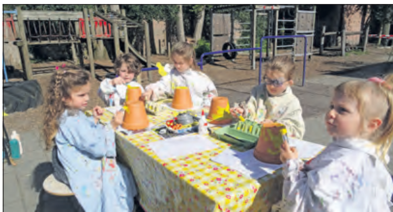
Geconcentreerd wordt aan de bijenhuisjes gewerkt.

In de onderwijsvisie op de Bosbergschool is er veel aandacht voor natuurbeleving. Respect en zorg voor de natuur zijn essentieel voor een gezonde toekomst. Met de natuurochtenden wordt hier door het team, leerlingen en ouders op een hele mooie en educatieve wijze invulling aan gegeven.