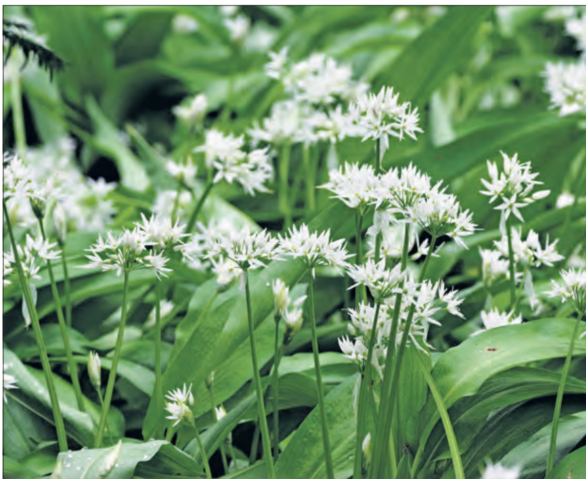
Daslook heeft een karakteristieke knoflook-tuengeur.

ook voor in Amelisseweerd en met name in het prachtige Savelsbos, een hellingbos in Gronsveld/Rijkholt (Zuid-Limburg) met enorme vlakten met daslook. (Eugène Jansen)