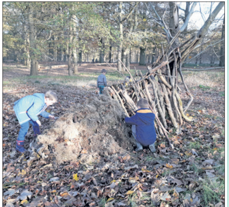
Op Beerschoten leer je een hut te bouwen met materialen die in het bos te vinden zijn.

KinderNatuurActiviteiten van Het Utrechts Landschap (HUL) organiseert activiteiten voor kinderen in en over de natuur. Dit wordt gedaan onder leiding van vrijwilligers van HUL en IVN De Bilt op Beerschoten. Woensdag 20 maart is het thema Hutten bouwen waarbij je leert een hut te bouwen met natuurlijke materialen waar je in kunt overleven als het regent en het ook nog koud is. Leeftijd: 6 t/m 10 jaar. Tijd: 14.30 tot 16.30 uur in Paviljoen Beerschoten, De Holle Bilt 6 in De Bilt. Aanmelden s.v.p. voor zondag 17 maart. via kinder Natuuractiviteiten@gmail.com .