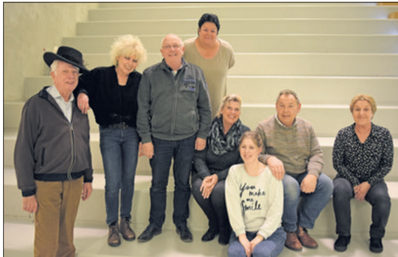
De cast is druk aan het oefenen voor hun toneelstuk.

Het verhaal speelt zich af in Eldorado, een land, hier ver vandaan. Volgens zigeunerin Zenobia wordt de koning van Eldorado ziek, maar is dat wel zo? En wat heeft de heer Valentijn, minister van Eldorado, hiermee te maken? Wil hij de plaats van de koning innemen en speelt hij daarom onder één hoedje met de zigeunerin? En dat wonderflesje van Floriana? Wat is daarmee aan de hand? Is dat een onzichtbaarheidsdrankje? En wordt de 'zieke' koning weer beter? Gelukkig weten dienstmeid Floriana en prinses Rosalinde