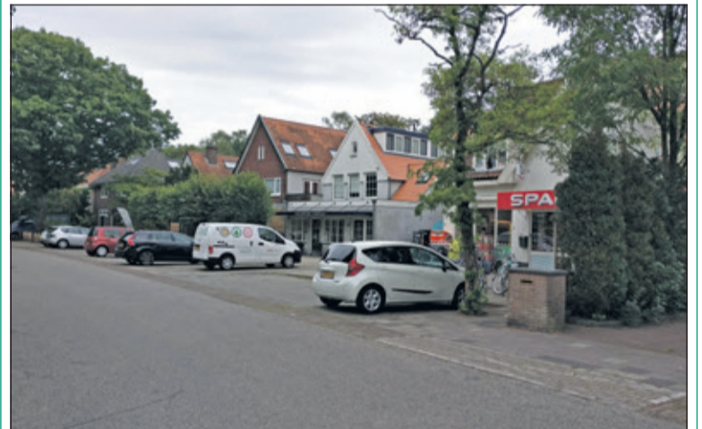
Dit kleine winkelcentrum bewijst (bijna 60 jaar later) nog steeds zijn functie.