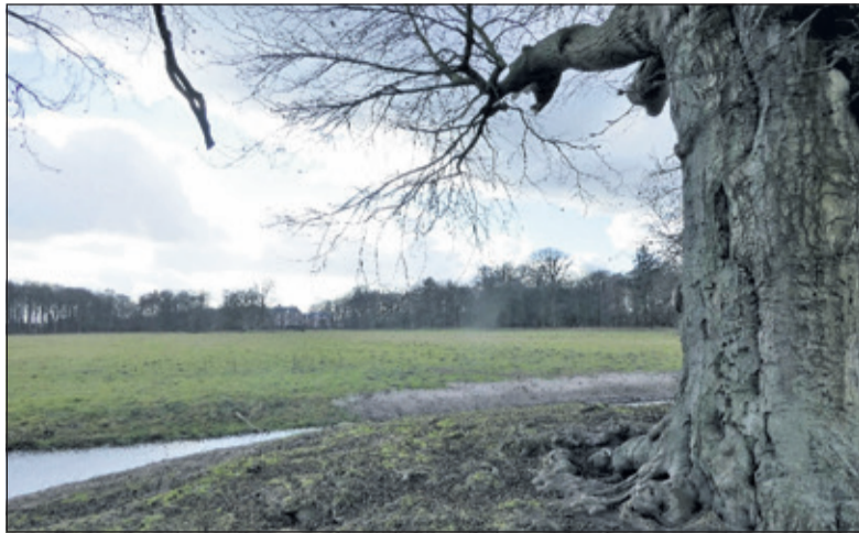
Zicht op Houtringe, met op de voorgrond de eeuwenoude beuk; ook bekend als 'De kabouterboom'.

De vier wandelingen hebben als hoofdthema 'Bomen leren herkennen'. De eerste staat in het teken van 'Bomen in knop' en is op Landgoed Houtringe. 'Bomen in blad en bloei' staat op de rol voor 21 april bij een bomenrondje in het van Boetzelaerpark. Op 26 mei is er een vervolg met Bomen in het Park Bloeyendael, en op 2 juni is de afsluiting bij de monumentale bomen op Ameliswaerd. Alle wandelingen starten om 11.00 uur. Zondag 17 maart is de aftrap met een wandeling 'Bomen in knop' op Landgoed Houtringe.