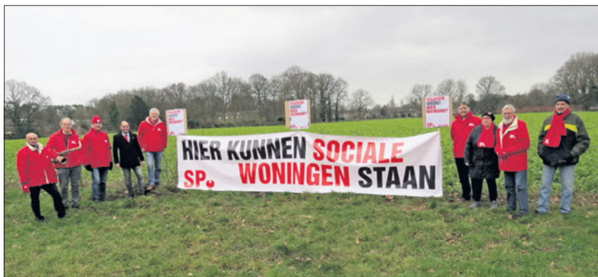
SP De Bilt roept ook de Provinciale Staten op om de Schapenwei voor (sociale) woningbouw te bestemmen.

De Eerste kamer wordt gekozen door de leden van de Provinciale Staten op 27 mei a.s. Aangezien het regeringsbeleid – afkomstig van vooral de VVD – ook afhankelijk is van de stemming in de Eerste Kamer, heeft u op 20 Maart de kans om tegen het huidige regeringsbeleid te stemmen. Stemt u daarom op een vertegenwoordiger in de Provinciale Staten die werkelijk uw belangen behartigt.