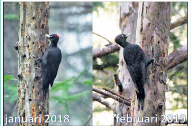
De zwarte specht op insectenjacht.

Dit is erg indrukwekkend omdat het klinkt als een zware mitrailleur en veel luider dan de veel voorkomende grote bonte specht. (Eugène Jansen, Bilthoven)