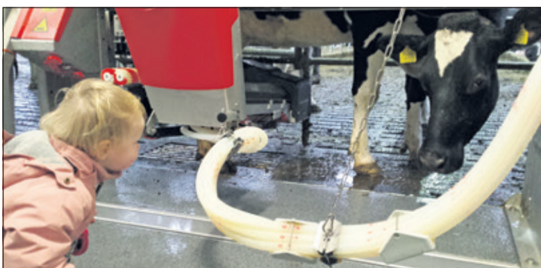
De melkrobot wordt aan inspectie onderworpen.