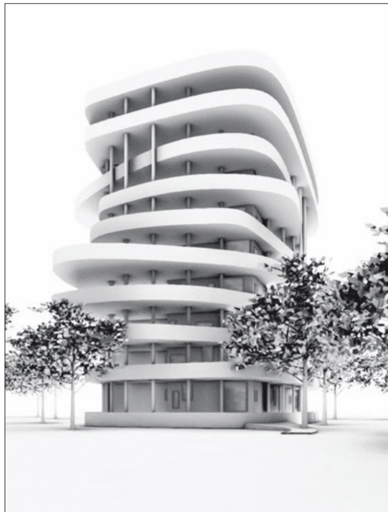
Een gedurfde schets van een appartementengebouw langs de Biltse Rading. (impressie woontoren door Natrufried Architecture)