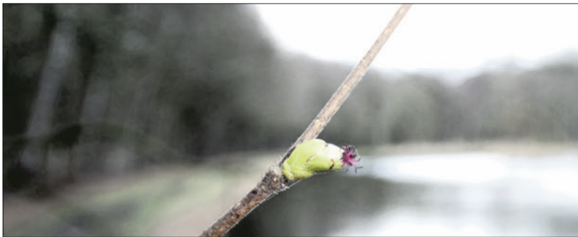
'Naaktbloeiende' hazelaar bij de ijsbaan.

bloempjes van de hazelaar nog kunnen worden bewonderd. De wandeling op zondag 17 maart start om 11.00 uur vanaf het einde van de parkeerplaats bij de natuurbaan De Bilt, Visserssteeg 1 (zijweg van de rotonde op de Soestdijkseweg-Zuid in het verlengde van de Groenekansweg. Deelname is gratis. Meer informatie verkrijgbaar bij Jaap Milius 030 2288636.