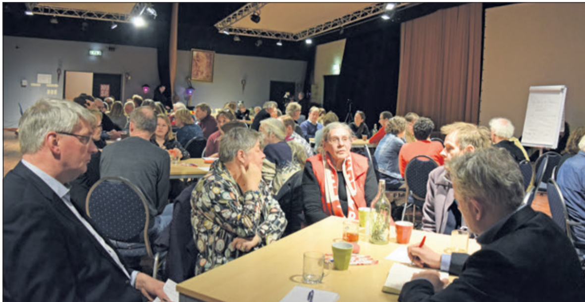
Iedere tafel probeert tot oplossingen te komen voor een duurzamere wereld.

Donderdag 7 maart hielden de Biltse raadsfracties Brouwer, ChristenUnie, PvdA en SP een openbare Raadsinformatieavond in het HF Witte Centrum in De Bilt. Raads- en commissieleden van gemeente De Bilt, scholieren, leden van BENG! en andere duurzaamheidsorganisaties gingen met elkaar de discussie aan op het gebied van duurzaamheid, klimaat en ethiek.