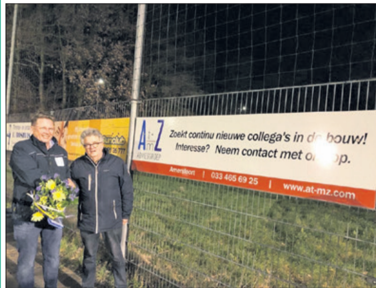
SVM verwelkomt A tot en met Z advies groep als nieuwe sponsor. Het bedrijf heeft het SVM JO 9-2 voorzien van een nieuw wedstrijd tenue en een reclamebord