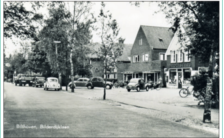
Het kleine dorp aan de Bilderdijklaan in 1959.

Met een foto van weleer, de camera van nu en tekst van overal ((dorps-)historici en eerdere publicaties) gaan we kriskras door de kernen van deze gemeente. [Henk van de Bunt]