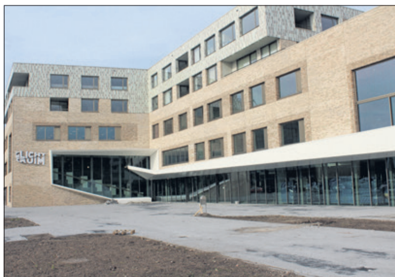
In 2013 was het nieuwe Cultureel Centrum in Bilthoven klaar voor oplevering.

belang, dat dit goed functioneren onder een nieuwe eigenaar wordt voorgezet. Daarvoor heeft het College een visie voor de toekomst van Het Lichtruim opgesteld. De gemeente wil daarin ook graag samenwerken met de nieuwe eigenaar'.