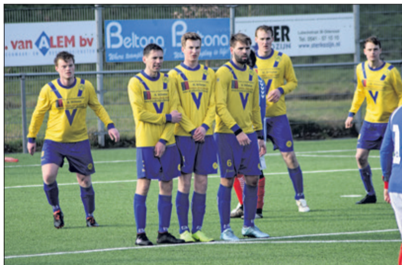
Zes SVM-verdedigers zijn er nodig bij één Patria-aanvaller.