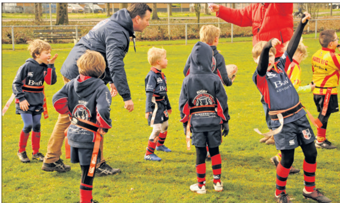
De benjamins van SRFC staan hun mannetje op het veld in Deventer.