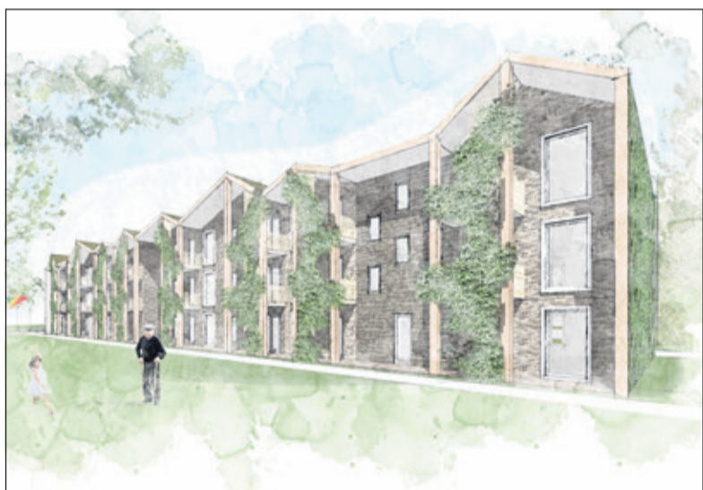
'Zachtere' architectuur met groen om aan te sluiten op de bestaande bebouwing. (impressie woongebouwen door TWA Architecten)

De presentatie van de schetsen en sfeerbeelden van de mogelijke inrichting gaven voldoende basis om over door te praten aan een achttal gesprekstafels. Hoe zit het bijvoorbeeld met speelgelegenheden? Voor welke groepen zijn de geplande appartementen bedoeld? Wat is er mogelijk qua groen? Hoe bewegen fietsers en voetgangers zich volgens deze plannen? Aan hoeveel evenementen wordt er gedacht? Reacties in de vorm van vragen, zorgen en ideeën werden verzameld en plenaire teruggekoppeld, waarna tijdens een afsluitende borrel diverse inwoners bleven napraten.