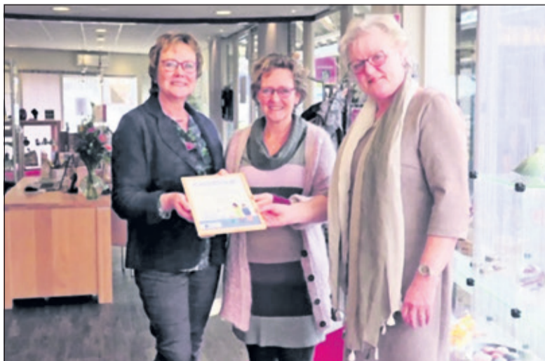
PCB Uitvaartwinkel Bilthoven is trots op het behaalde certificaat.

drag of de stemming van een persoon met dementie veranderen; de bezoeker wordt verdrietig, angstig of achterdochtig. Hoe PCB-medewerkers hiermee moeten omgaan is tijdens de training geleerd en door Alzheimer Nederland bekrond met de sticker bij de deur.