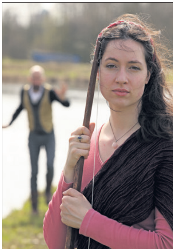
Theater in 't Groen verraste het publiek dit seizoen met Penelope & De Vos.

De repetitieperiode van 'Mariecken' begint met een drietal woensdagavonden waarin belangstellenden de