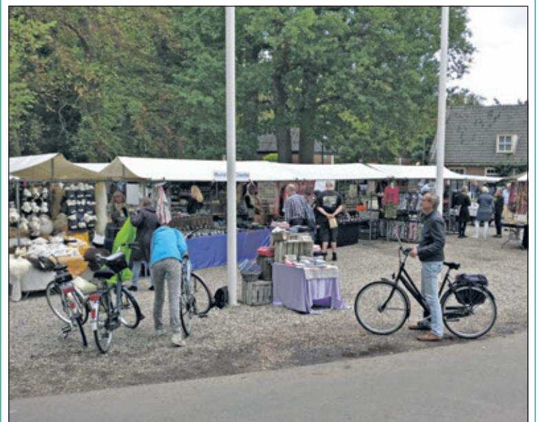
De organisatoren van Trots Markt presenteren gedurende een viertal weken een ambachtelijke markt op vrijdag van 10.00 tot 16.00 uur op de Slotlaan in Lage Vuursche met diverse streekproducten en ander ambachtelijke aanbod.