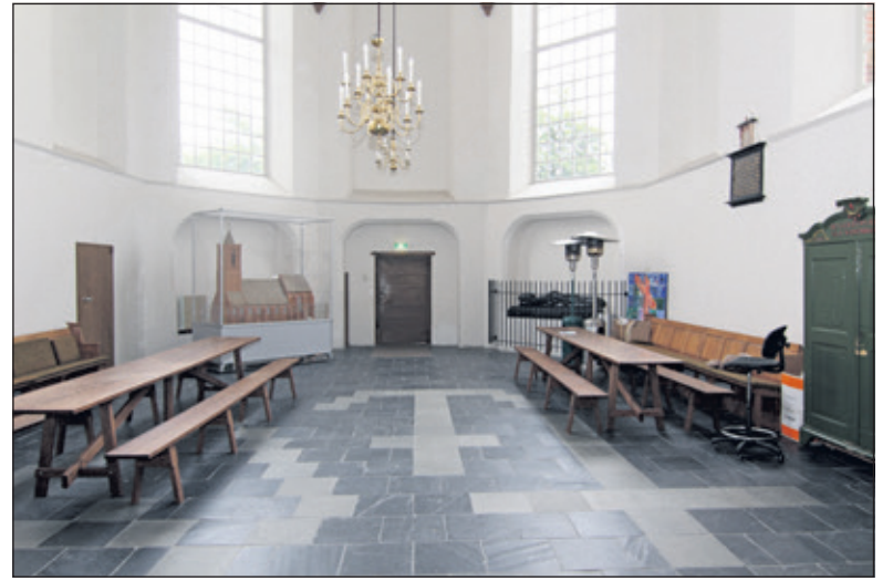
Het 'koor' van de kerk van Westbroek is van omstreeks 1500.