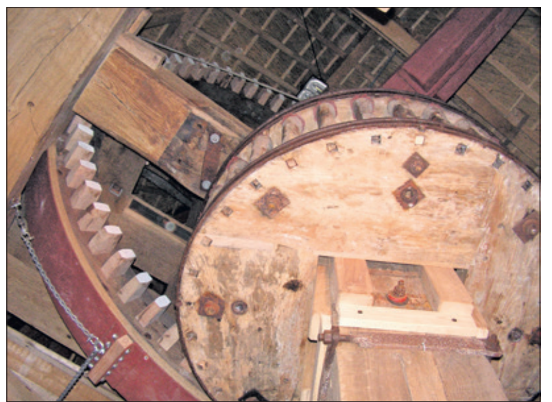
De overbrenging van het bovenwiel dat op de bovenas met wieken zit naar het koningsspel, dat is de grote verticale as waar lager in de molen het maalwerk aan is gekoppeld.