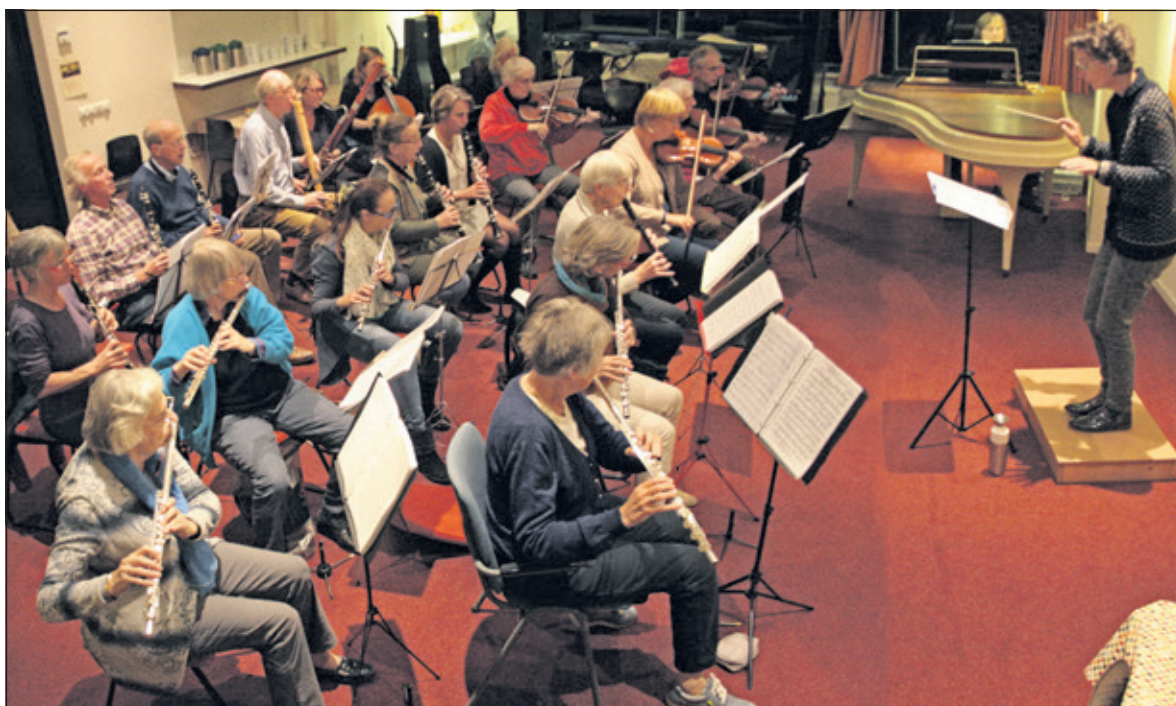
Met een paar jaar spelervaring kan je al met het orkest meespelen.