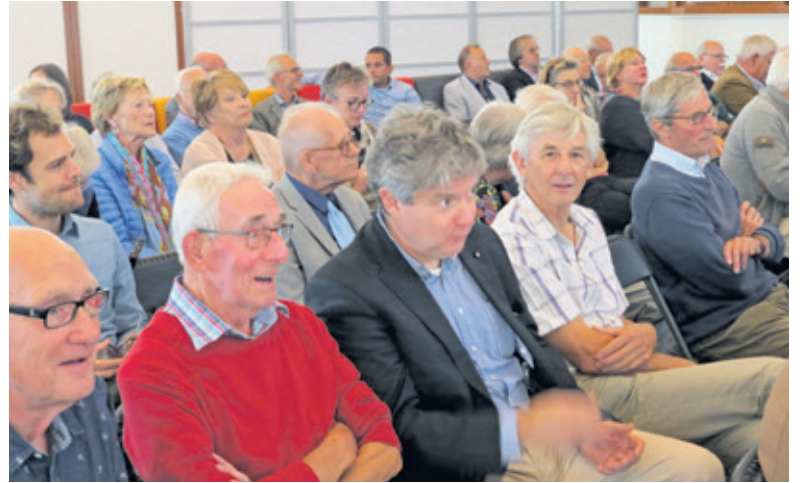
Heel veel belangstellenden woonden de ingebruikname van het Online Museum De Bilt bij.