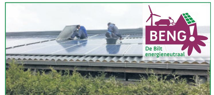
De zonnepanelen van Biltstroom bij Landwinkel De Hooierij, mei 2018.

Informatie over Nieuw Toutenburg project op www.biltstroom.nl