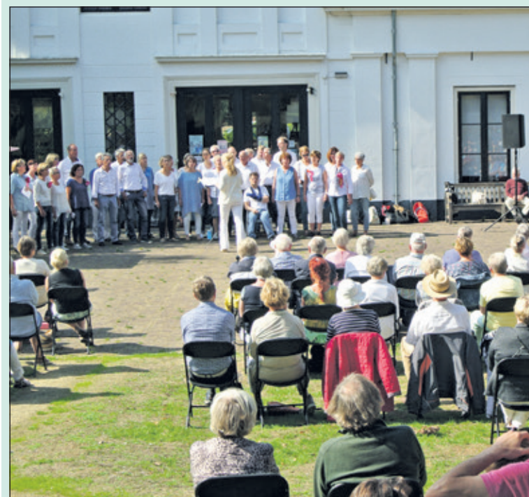
Een goed bezocht laatste zomerconcert in heerlijk nazomerweer.