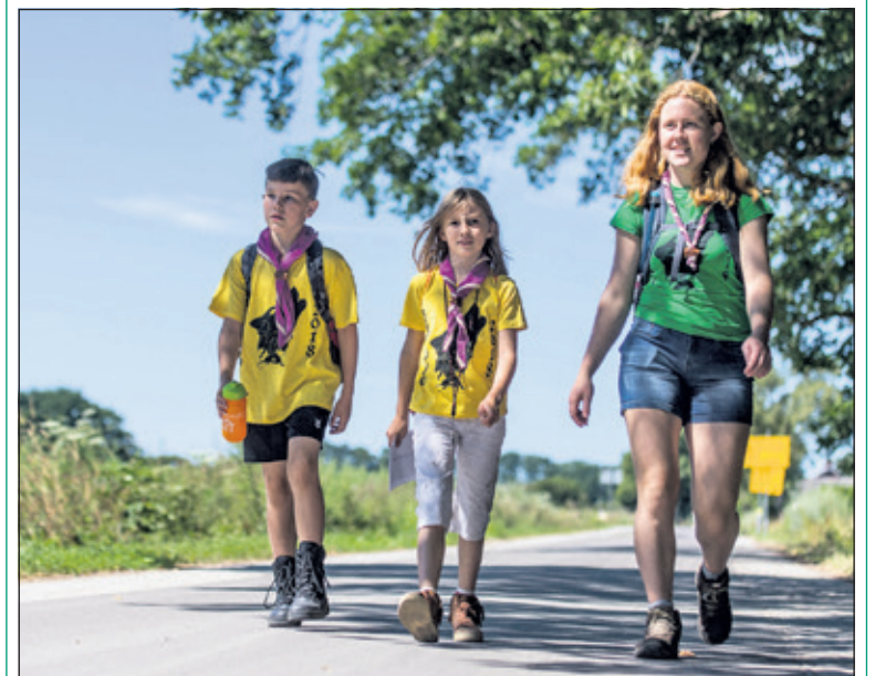
De welpen (leden van 7 t/m 11 jaar) beschermden deze zomer in Hengelo een middeleeuws dorpje tegen een draak.