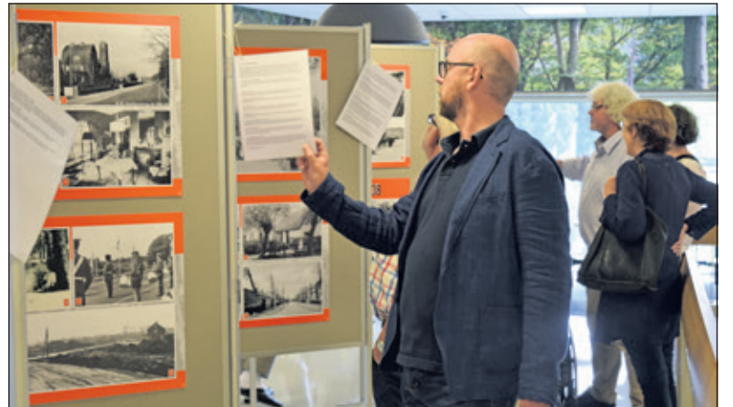
Bezoekers bekijken ook foto's van het oude De Bilt in de bibliotheek. Op 8 september is deze tentoonstelling nog eenmaal te bewonderen; ditmaal in de Dorpskerk in De Bilt).