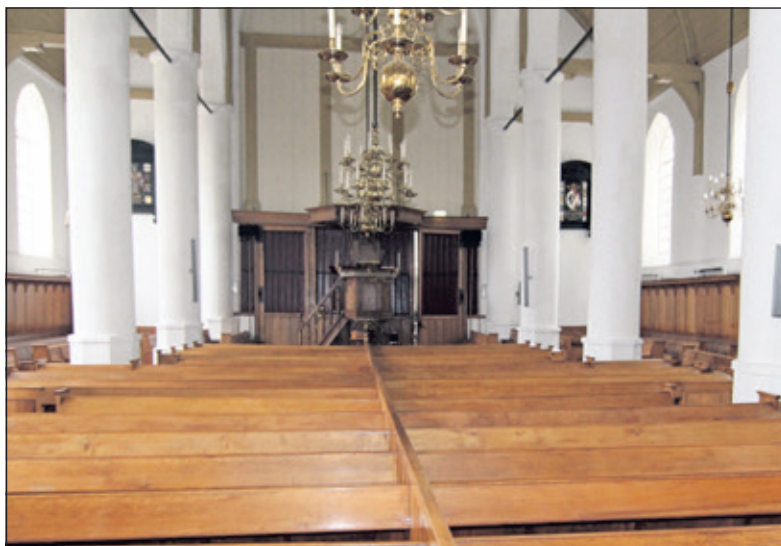
De historie van het kerkgebouw vermeldt o.a.: 'In 1467 werd begonnen met deze laatgotische zaalkerk. In 1481 waren kerk en toren klaar.'

Dit jaar worden er in het scholenproject drie locaties beklommen en bezocht: de NH Kerk in Westbroek, Streekmuseum Vredegoed (Heuvellaan 7 te Tienhoven) en Fort Ruigenhoek (Ruigenhoeksedijk t/o 125 in Groenekan). Op initiatief van burgemeester Sjoerd Potters is er dit jaar voor de scholieren een monumenten-vlog-wedstrijd. De winnaar wordt bekend gemaakt bij de start van Open Monumentendag 2018 op zaterdag 8 september om 10.00 uur in de NH kerk van Westbroek. Voor meer informatie zie www.monumentendebilt.nl .