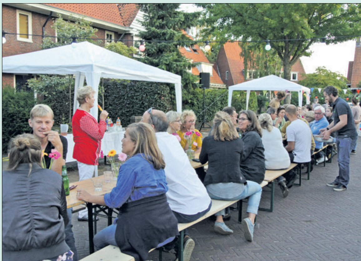
Bewoners van de Steenen Camer verkeren in opperbeste sfeer tijdens het straatfeest dat mede dankzij het mooie weer een mooie afsluiting van de vakantieperiode betekende. (foto Frans Poot).