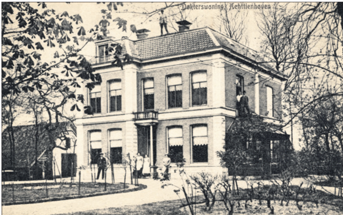
Villa Blauw Hoef

van de dokter gewenst was. In 1954 - wanneer Westbroek en Achttienhoven één gemeente worden - besluiten beide gemeenteraden het Achttienhovense gedeelte van de Kerkdijk te hernoemen tot dr. Welfferweg. De arts had toen al meer dan tien jaar de praktijk verlaten'.