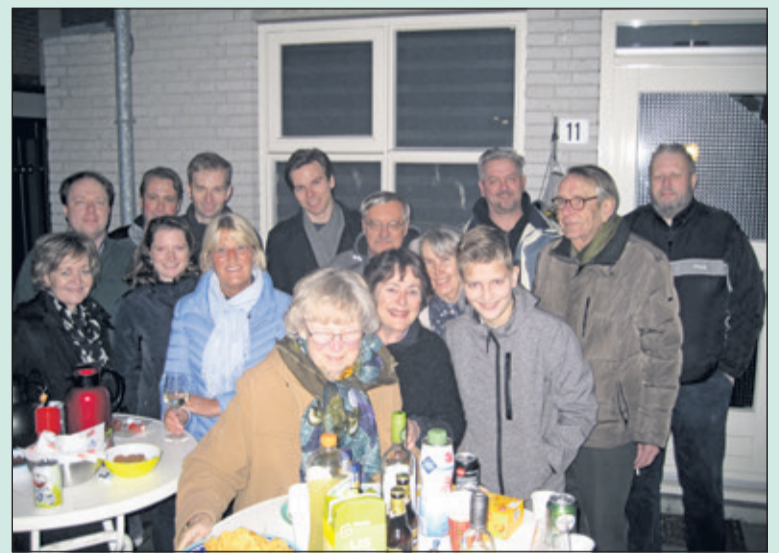
Frisse start van het nieuwe jaar bij Poorthoven II.