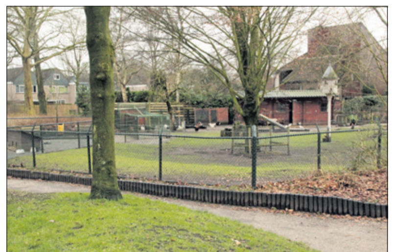
De Maartensdijkse Dierenweide krijgt weer financiële steun.