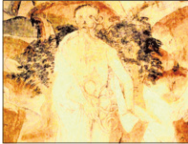
De drie doden

Op de wand van de toren zien we Christus op de regenboog en daar onder de aarde, de opstanding uit de doden. We zien de aartsengel Michael als zielenweger. Naast Christus zien we Maria en Johannes de Doper. Rechts van Christus is een