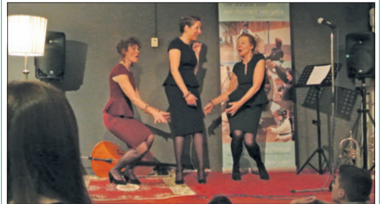
Bel AMI brengt op een inspirerende manier hun muziek ten gehore.

Zij brachten een mix van zang en entertainment. Hun krachtige uitstraling, charme en enthousiasme boeide het veelvuldig toegestroomde publiek overduidelijk. Hun optreden werd afgewisseld met uitvoeringen van leerlingen van de Talentenklas van de Muziekschool. Zij zongen, speelden trompet, cello, piano en gitaar. Het was heel bijzonder om te zien met welk een overgave en plezier deze jonge muzikanten hun muziek ten gehore brachten. (Frans Poot)