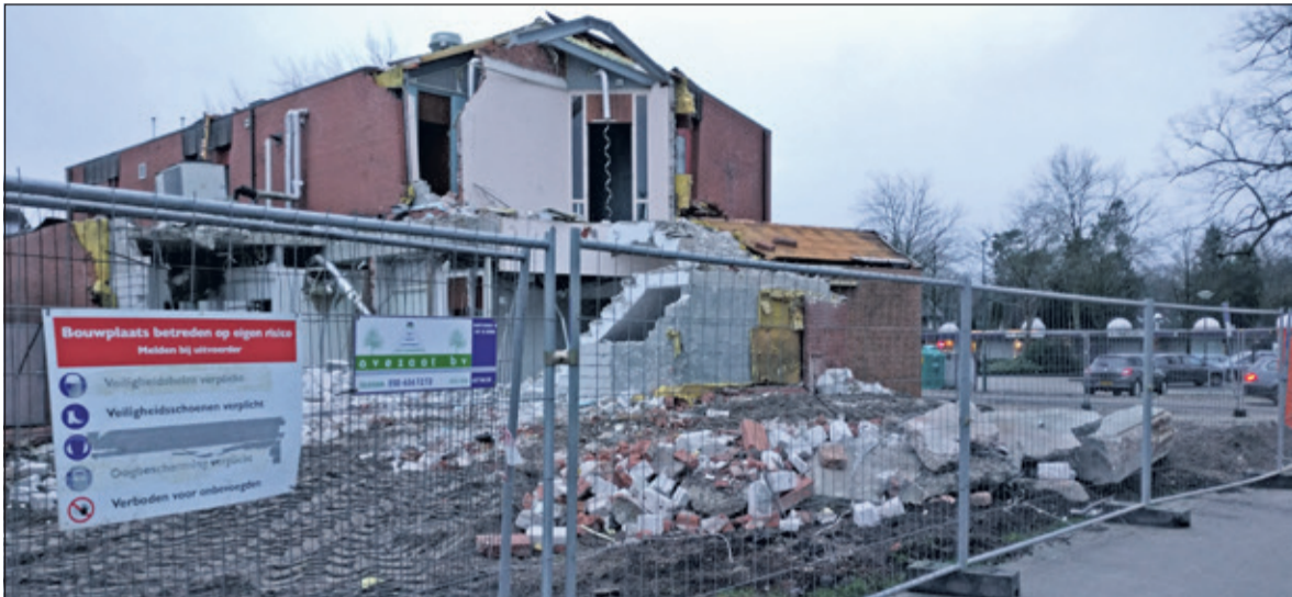
Bram Vermeulen zong het al: 'De beuk erin. Alles moet weg en dat is pas het begin'. Vorige week werd de sloop van het voormalige ING pand gestart.

De aanpak van het Vinckenplein is een belangrijk onderdeel in de modernisering van het centrum van Bilthoven. Aan het plein komt een nieuw gebouw met ruimte voor horeca, winkels en woningen. Vorige week werd een start gemaakt met de sloop van het voormalige ING pand op deze locatie.