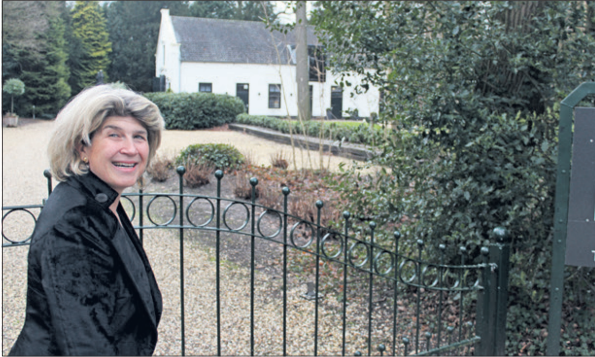
Op donderdag 25 januari wordt een belangrijke stap in de samenwerking gezet door de presentatie en ondertekening van de Gebiedsvisie en samenwerkingsagenda tijdens een bijeenkomst in Het Koetshuis van Landgoed Eyckenstein.

Overheden, terreineigenaren, maatschappelijke organisaties en ondernemers op de Heuvelrug werken al enige tijd samen aan plannen voor de uitbreiding en vernieuwing van Nationaal Park (Utrechtse) Heuvelrug. In het concept van de Gebiedsvisie en de samenwerkingsagenda staat hoe men de ambities wil gaan bereiken. Op 25 januari worden de definitieve plannen gepresenteerd.