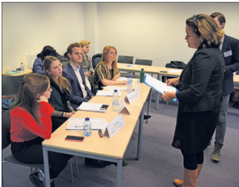
De jury legt uit wat goed ging en waar nog winst valt te behalen.

Tijdens het debat wordt door de jury dan ook extra gelet op deze vaardigheden. 'De spelregels tijdens een debat zijn divers', legt Oosterom uit. 'Zorgen ogen, stem en houding voor extra overtuigingskracht? Geeft de debater blijk van een sterke argumentatie, met een heldere analyse en passende voorbeelden? Worden essentiële argumenten uitgelegd en ondersteund door voorbeelden? Er zijn veel aspecten waarop je als goed debater moet letten, maar dat maakt het vak wel heel interessant'.