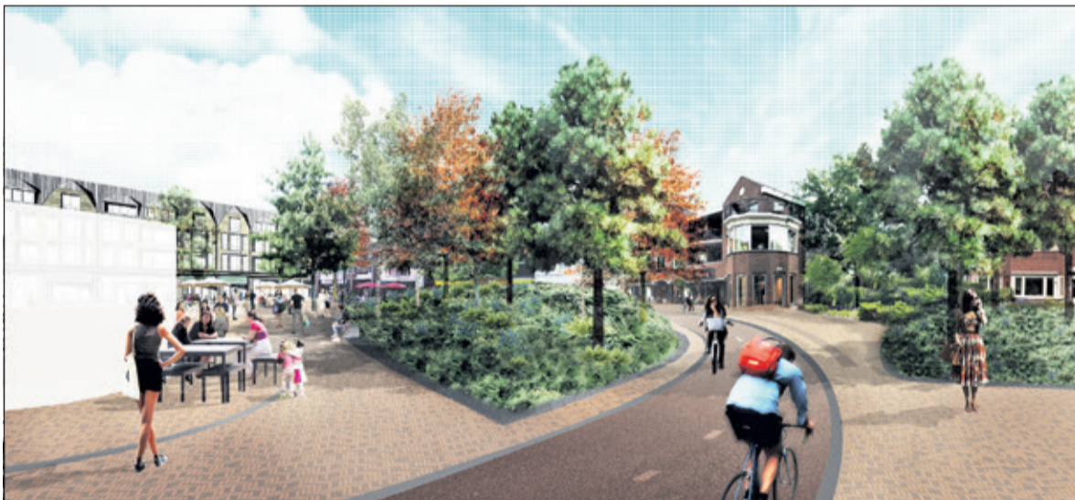
De werkgroep Vinckenplein vertelde tijdens een presentatie op dinsdag 20 december 2016: 'Het Vinckenplein wordt een fantastische plek om te ontspannen, te ontmoeten en te wonen'.