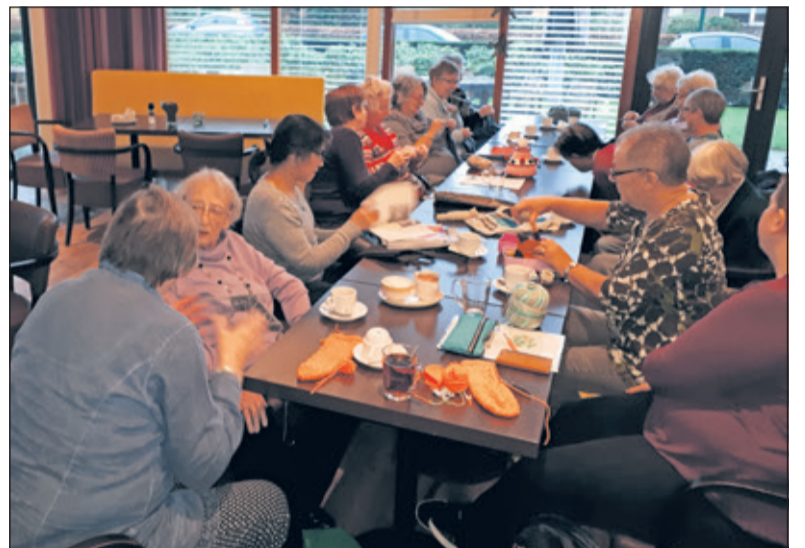
Gezellige bijeen in restaurant 'Bij de tijd' om samen te breien.