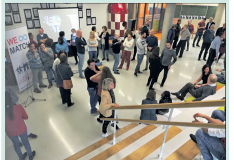
De vorige We Match markt in het Lichtruim is goed bezocht.

We∞Match is ontwikkeld in samenwerking met en mogelijk gemaakt door: Steunpunt Vluchtelingen De Bilt, MENS De Bilt, gemeente De Bilt, KunstenHuis De Bilt-Zeist, BNDRS en Bibliotheek Idea. Kijk voor meer informatie op www.kunstenhuis.nl/we-match .