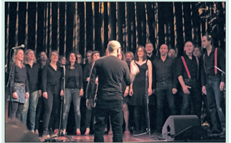
K'zz Voice tijdens de Korendagen.