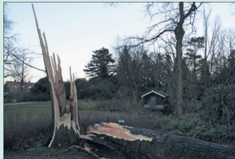
Tijdens de storm van donderdag 18 januari is de reusachtige 85 jaar oude Christusdoorn met donderend geraas gebroken

De Vrienden van het van Boetzelaerspark (De Bilt) organiseren ook in 2018 weer werkochtenden; de eerste op zaterdag 27 januari. Er wordt begonnen om 9.30 uur in/bij het parkhuisje met een kopje koffie. Vervolgens gaat men aan de slag, wordt er rond 11.15 uur weer even gepauzeerd en daarna afrondend weer doorgewerkt tot ongeveer 12.30 uur. Naar het zich laat aanzien is er in het park wel wat ruimwerk te verrichten. Wie belangstelling heeft kan zich aanmelden via info@vriendenboetzelaerspark.nl