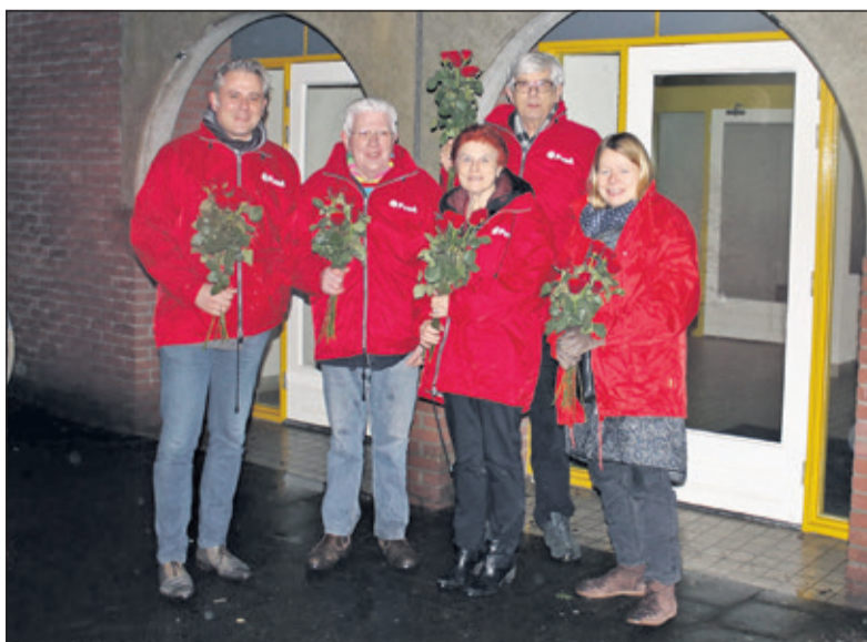
Het wijkteam van de PvdA op bezoek bij Anne Franklaan in Bilthoven.