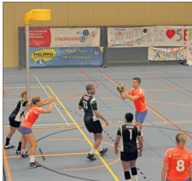
Achilles loopt te vroeg in de bij de vrije bal die uiteindelijk een strafworp oplevert.

Het werden erg spannende minuten. Vier minuten voor tijd had DOS bij 16-18 nog steeds een twee punten voorsprong, maar net op dat moment miste DOS een aantal kansen om te scoren. Achilles kwam langszij en in de voorlaatste minuut leek de overwinning in Den Haag te blijven. In de allerlaatste minuut scoorde DOS uit een strafworp de 19-19 en behoudt door dit resultaat een punt achterstand op koploper Achilles, maar stijgt wel naar een gedeelde tweede plek. Zaterdag speelt DOS thuis tegen KVA. De wedstrijd in De Vierstee begint om 20.45 uur.