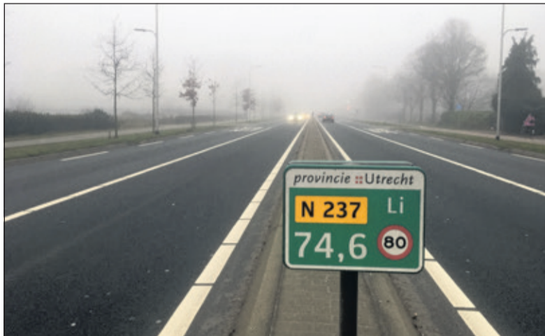
De provinciale weg N237 loopt van de verkeerspleinen De Berekuil bij Utrecht naar de Stichtse Rotonde bij Amersfoort.

Met de reconstructie van de N237 wilde de provincie Utrecht bereiken, dat de doorstroming, de verkeersveiligheid en de oversteekbaarheid verbeterden en dat het verkeerslawaaï afneemt. De provincie Utrecht verbeterde de kruising Utrechtseweg/Universiteitsweg en bij Vollenhoven (kruising Utrechtseweg/Amersfoortseweg) in De Bilt om het verkeer tussen Utrecht en Amersfoort nu en in de toekomst beter te kunnen verwerken. De nieuwe fietstunnel zorgt ervoor dat fietsers veilig onder de Amersfoortseweg (N237) door kunnen rijden en draagt bij aan de verbetering van het fietsnetwerk tussen Utrecht en Zeist.