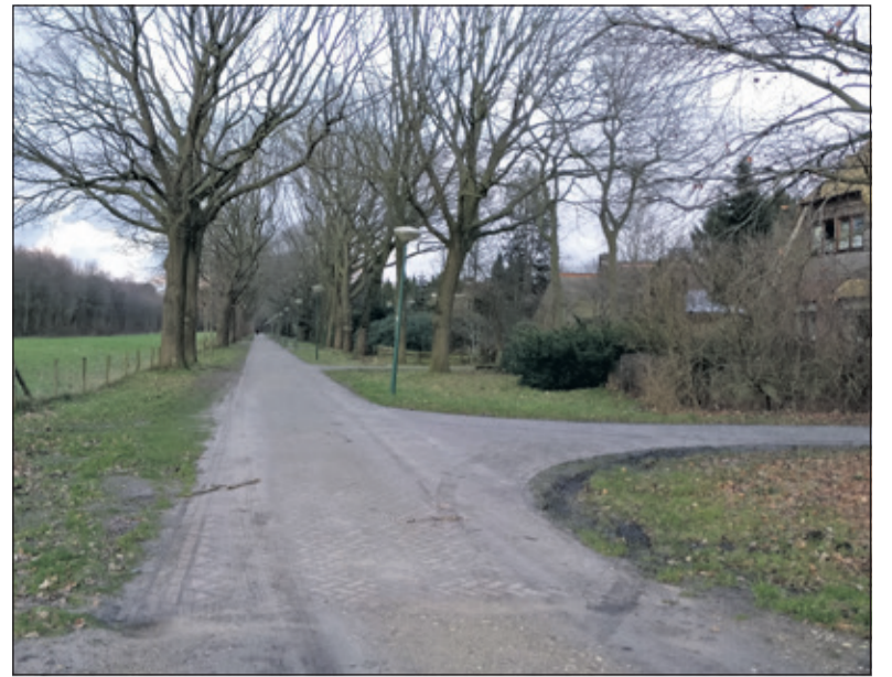
B en W concluderen, dat als gevolg van zwaar verkeer schade ontstaat aan bermen en wegdek van de Schaapsdrift in Hollandsche Rading.