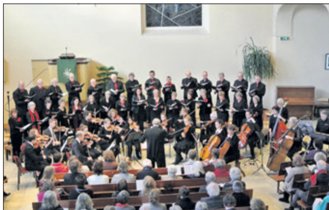
Het Schütz Projectkoor bij de uitvoering van een eerder project in de Opstandingskerk.

Met het 17e project getiteld 'Rondom de Oostzee' brengt het Schütz Projectkoor uit Bilthoven o.l.v. Pieter Kramers het muzikale DNA van het Baltische gebied. Zondag 4 februari om 15.30 uur in de Opstandingskerk in Bilthoven worden zeer uiteenlopende werken van 19e- en 20e-eeuwse componisten belicht met werken van Wikander, Tormis, Mäntyjärvi, Komulainen, Vasks, Alfvén, Ešenvalds, Miškinis en Pärt. Het programma is in samenwerking met het Adorno String Quartet van het Rotterdamse Conservatorium dat, naast de begeleiding van een van de koorwerken, delen uit het strijkkwartet van Grieg zal uitvoeren. Meer info en kaarten, zie www.schutzprojectkoor.nl (Philip Lijnzaad)