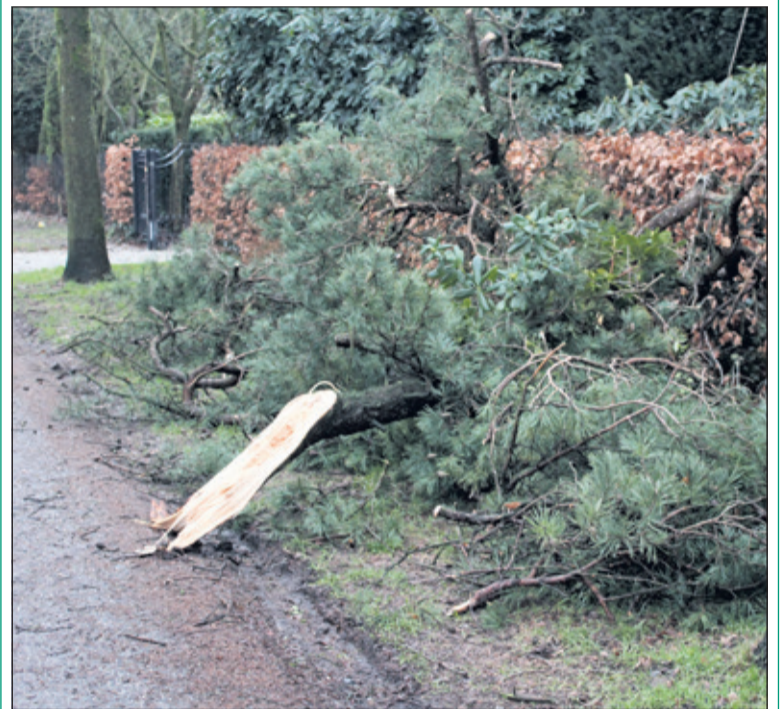
CDA roept gemeente op om de afgewaaiden takken van particulieren mee te nemen.

Het CDA heeft over deze gang van zaken inmiddels vragen gesteld en heeft een oproep gedaan aan de gemeente om alsnog alle omgewaaide bomen en afgewaaiden takken, die langs de weg liggen, op te halen.