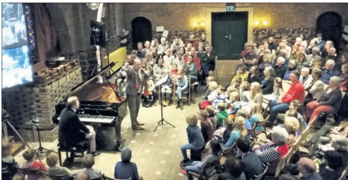
Kinderen, ouders én opa's en oma's genoten volop van deze wandeling door dit 'museum zonder schilderijen', zoals Rutten het omschreef.