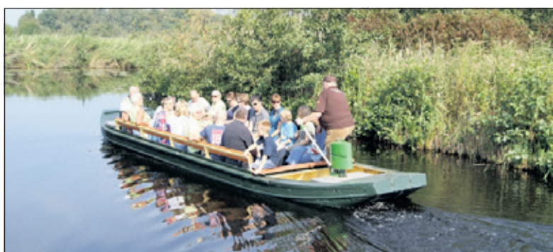
Op een fluisterboot door de Molenpolder is een bijzondere beleving.

Op 23 augustus kunt u mee op de fluisterboot van Staatsbosbeheer door het natuurgebied de Molenpolder en samen met de gids bijzondere planten en dieren ontdekken. Een leuke en leerzame activiteit voor kids én ouders op de woensdagmiddag. Misschien zie je wel een ringslang of purperreiger! Er wordt een tussenstop bij het trilveen gemaakt en u kunt ervaren hoe dit 'drijvend land' loopt. Laarzen of waterdichte schoenen worden aanbevolen. Meer info en reserveren via www.staatsbosbeheer.nl . Met je eigen groep een vaartocht doen? Informeer via utrechtwest@staatsbosbeheer.nl .