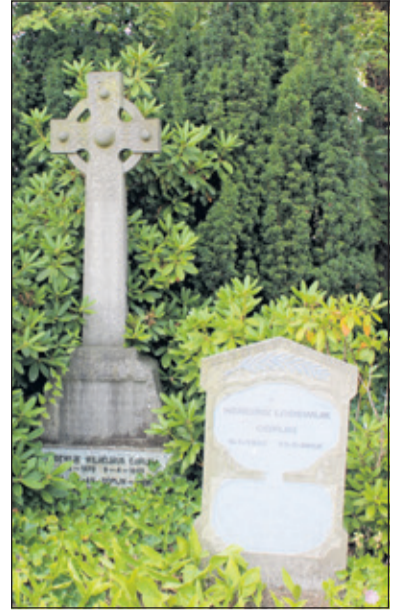
Vlakbij de spoorlijn staat een Ierse grafsteen in de vorm van een Keltisch kruis.