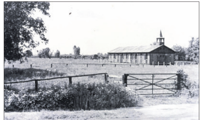
De Zweedse houten noodkerk uit 1950.