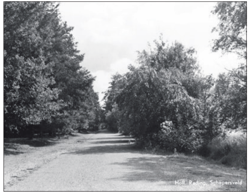
Het laantje, waar de laatste Swiebertje-opnamen zijn gemaakt: het Schepersveld in Hollandsche Rading (foto uit 1978 uit de digitale verzameling van Rienk Miedema).

Ook tegen de Graaf Floris V weg waren bezwaren: 'te lang', 'administratieve problemen' en 'het zegt zo weinig dat hier een graaf door edelen is gevangen geno-