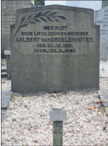
Op de begraafplaats is ook één officieel geregistreerd Nederlands oorlogsgraf met een particuliere grafsteen.

De Hervormde Begraafplaats in Groenekan behoort tot de oudste kerkhoven in Nederland. Sinds 1811 ligt deze aan de Groenekaneweg in Groenekan. Nu, 206 jaar later, ligt het kerkhof (gemeentelijk monument) er idyllisch bij. Met korstmossen, zwart, geel - en groen uitgeslagen grafmonumenten liggen tussen het groen. De afgelopen jaren werd alleen het noodzakelijk onderhoud op de begraafplaats gedaan. Veel graven, van meest Groenekanners of uit De Blauwkapel, worden niet meer onderhouden.