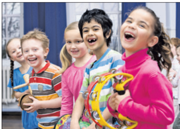
Voor kinderen is er veel te doen op 26 augustus, zoals robots maken, voorgelezen worden, muziekinstrumenten uitproberen, theater-les volgen, dansen en schilderen.

Bij KunstenHuis De Bilt-Zeist zijn er tal van workshops te volgen zoals inloopworkshops kinderatelier,