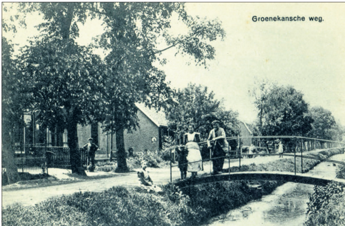
De Groenekanseweg in de jaren twintig van de vorige eeuw. Op het bruggetje ter hoogte van nr. 131 staan de heer en mevrouw Wijenberg met kinderen.

Van vrijdag 25 augustus tot donderdag 31 augustus zal er in Dorpshuis De Groene Daan een tentoonstelling gehouden worden over het ontstaan en de geschiedenis van Groenekan. Elk van de vier dorpen van de gemeente Maartensdijk voor het samengaan met oud Bilthoven en De Bilt heeft een eigen karakter. Veel oudere inwoners kunnen boeiend vertellen over het verleden van de dorpen; over de tradities en bewoners die het dorp een eigen sfeer gaven.