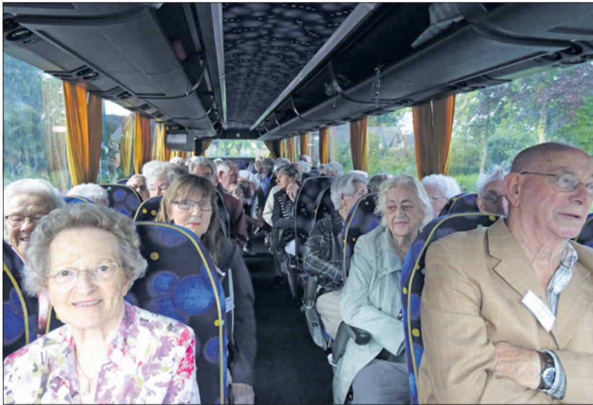
In goede stemming vertrekken de gasten naar Leerdam.

De reacties van de gasten bij terugkomst zijn onverminderd enthousiast. Tevredenheid over de prachtige dag is unaniem. Het Rode Kruis is er weer in geslaagd vele mensen een heerlijke dag te bezorgen. Hulde aan organisatie en de vele vrijwilligers is op zijn plaats.