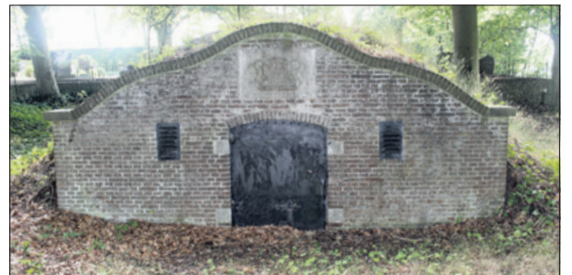
Een zesde deel van het kerkhof werd aangekocht door Baron Calkoen om daarop de familiegrafkelder te bouwen.

Groenekan wil het kerkhof ook in de toekomst voor en met de Groenekanners netjes houden. Wie mee wil helpen kan zich telefonisch aanmelden: 06 21580441 bij de heer van der Neut.