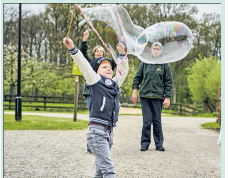
Reuze bellen op Oostbroek.

Op zaterdag 9 september pakt Utrechts Landschap uit op landgoed Oostbroek in De Bilt. Van 11.00 tot 16.00 uur is Huize Oostbroek deels opengesteld en geven gidsen rondleidingen over het landgoed. Er is een gezellige streekmarkt rond 't Winkeltje met kraampjes vol streekproducten, patat, ijs en een knutselkraam. Daarnaast kunnen kinderen zich inschrijven voor de muziekvoorstelling van Krulmuziek; 'Boef-fie trommelt'. Inschrijven excursies en kindervoorstelling via www.utrechtslandschap.nl/activiteiten . Op zaterdag 9 september kan er met de auto niet geparkeerd worden op het landgoed.