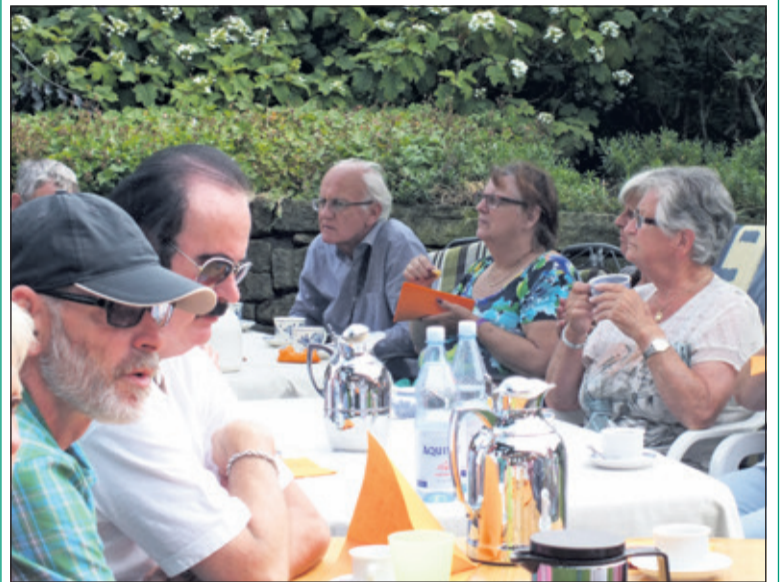
Even op adem komen in de tuin van een boerderij.

De tocht was een onderdeel van het jubileum van 40 jaar jumelage De Bilt - Coesfeld. In dat kader is het op 9 september de beurt aan De Bilt om een tocht te organiseren. Na een begroeting om 11 uur gaat de fietstocht van ongeveer 30 kilometer van De Bilt door Groenekan, Hollandsche Rading en Maartensdijk terug naar Bilthoven en De Bilt. Onderweg staat men stil bij enkele monumenten in deze kernen. De dag wordt afgesloten bij de Kunstmarkt in het Van Boetzelaerpark. Deelnemers aan de rit kunnen zich telefonisch aanmelden (tel.030 2292573) of via info@jumelage-debilt-coesfeld.nl . (Dick Verburg)