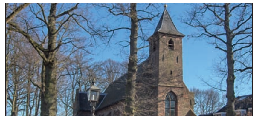
In kerkdorpje Blauwkapel - bereikbaar via de Darwindreef en/of Bastionweg - zijn in adventstijd bijzondere vieringen.