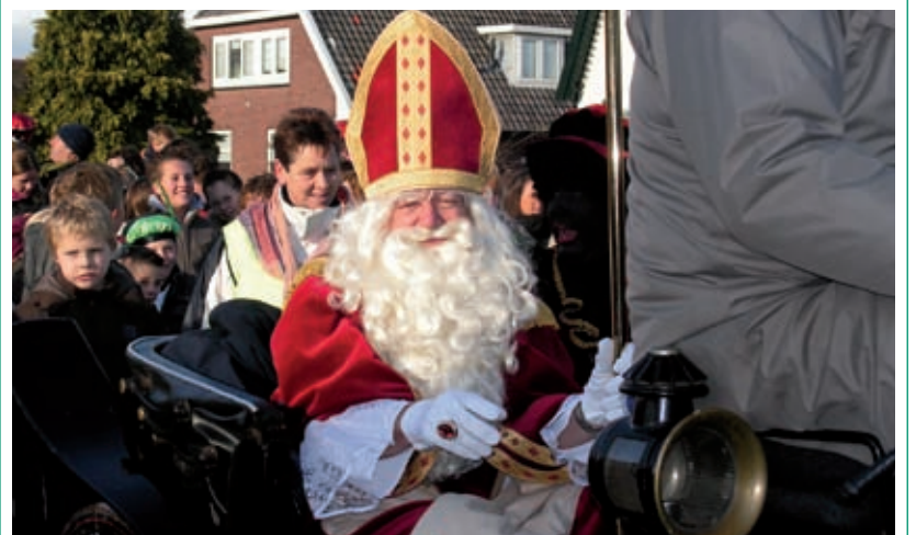
Sint arriveert in een grappig koetsje.