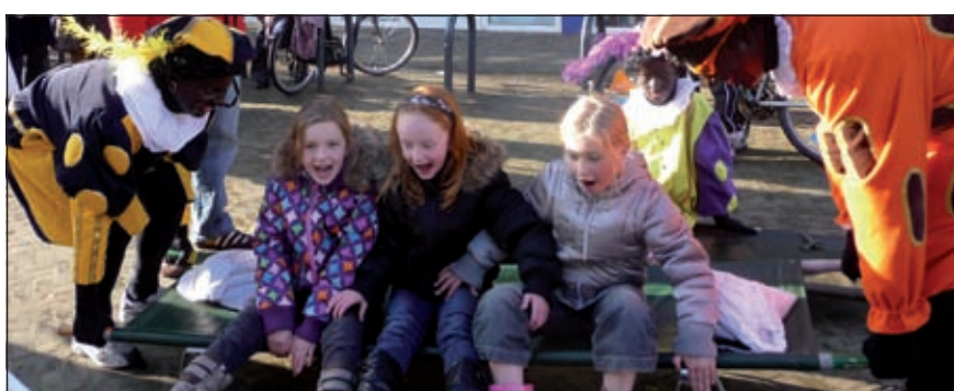
Pieten dragen niet alleen pakjes voor en naar de Sint.