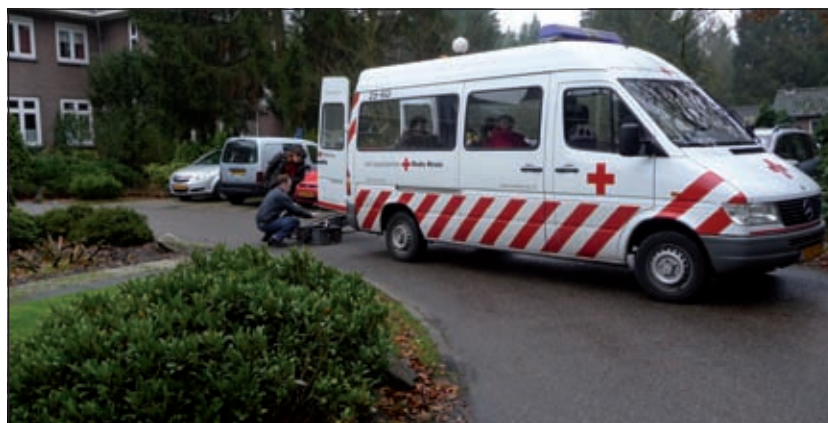
Zowel de begeleiding als het vervoer werd geregeld, onder andere door Douwe Tijmsa met de bus van het Rode Kruis.

die dementerend is en haar eigen naam niet meer weet toch gelijk zegt waar in de Bijbel het verhaal van die bijzondere engel te vinden is die op het schilderij afgebeeld staat. Daar wordt je dan toch even stil van en kijk je toch weer even anders naar zo iemand'.