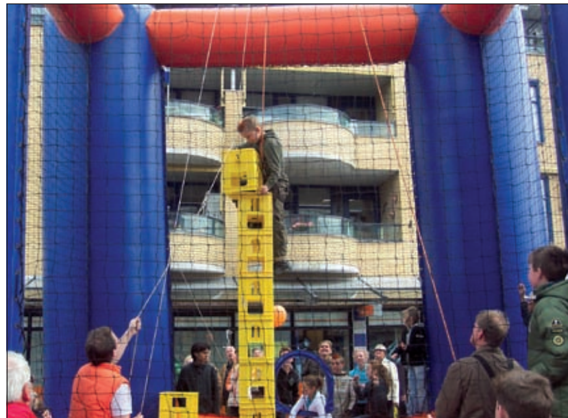
Sinds mensenheugenis zijn er in alle kernen van het voormalige Maartensdijk geweldige feesten gevierd op Koninginnedag. Hoewel onvoorstelbaar, dreigt dit voor het dorp Maartensdijk op te houden.

Sinds mensenheugenis zijn er in alle kernen van het voormalige Maartensdijk geweldige feesten gevierd op Koninginnedag. Zowel jong als oud leefde er naar toe. Hoewel onvoorstelbaar, dreigt dit voor het dorp Maartensdijk op te houden. Met nog vijf maanden voor de boeg ziet dit er niet goed uit. Maar er zijn in Maartensdijk heel wat ervaren organisatoren. Je vindt ze onder andere in de goedlopende verenigingen en clubs. Wellicht kan daaruit door gericht zoeken een team worden gevormd dat het geplande programma helpt uitvoeren.