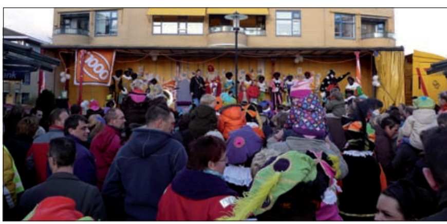
Sint vindt op het podium een warm onthaal.

De aankomst van Sinterklaas in Maartensdijk zorgde afgelopen zaterdag voor een reuze gezellig Maartensplein. Een enorme hoeveelheid Pieten was de gangmaker. Muziek, zang, spelletjes en goedgegumst publiek deed de rest.