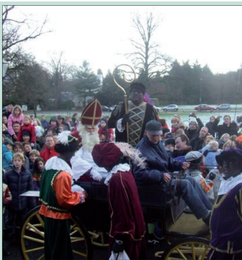
De aankomst van Sinterklaas bij gemeentehuis Jagtlust