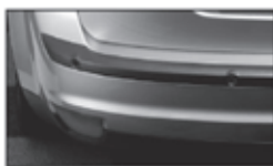
Parkeersensoren voor en achter