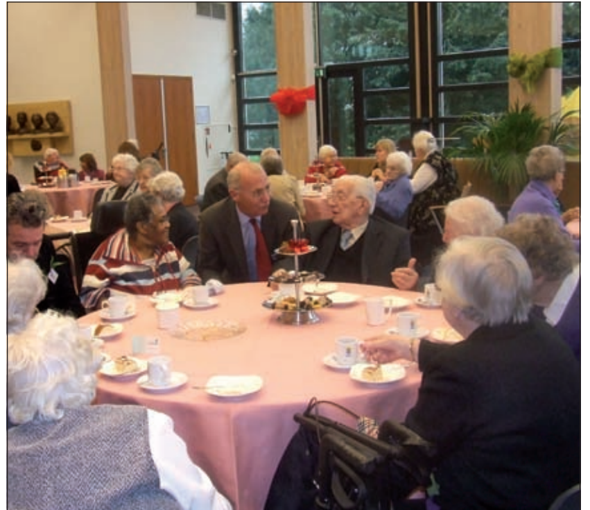
In de Vrijwilligersweek organiseerden gemeenteambtenaren in samenwerking met De Zonnebloem een High Tea voor ouderen in de Mathildezaal van het gemeentehuis [GG].

Elke eerste zondag van de maand verzorgt SWO De Zes Kernen een filmvoorstelling in Woon- en zorgcentrum De Bremhorst, Jan van Eijcklaan 31 te Bilthoven. Op 7 december is dit de film 'Falling in love again' USA 1980. De voorstelling begint om 15.00 uur en de entreekosten zijn 2 euro (inclusief koffie of thee). Info: SWO-vestiging De Bilt, tel. 030 2203490.