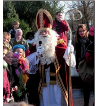
Sint praat uitgebreid met de Westbroekse kinderen.