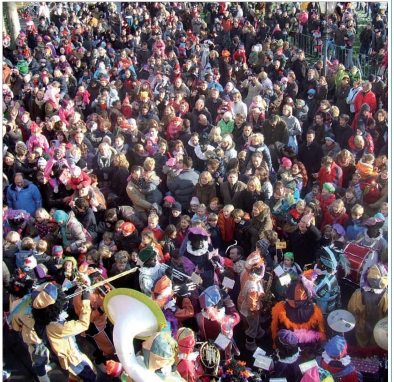
De honderden toegestroomde kinderen zingen de Sint luid toe.

Sinterklaas kwam dit jaar per koets naar het gemeentehuis in Bilthoven. Op het besneeuwde gazon van Jagt lust stonden honderden kinderen om de goedheiligman te ontvangen en toe te zingen. Sinterklaas werd vergezeld door tientallen muzikale pieten. Op het balkon van het gemeentehuis heet burgemeester Gerritsen de Sint hartelijk welkom en schenkt hem een fotoboek van de gemeente. Sinterklaas heeft voor de burgemeester ook wat meegebracht. 'Omdat het een nogal explosief jaar is geweest ontvangt u van mij een passend geschenk.' De Sint geeft de burgemeester een fraai doosje waaruit als hij het openmaakt tot zijn schrik een duveltje tevoorschijn komt. [GG]