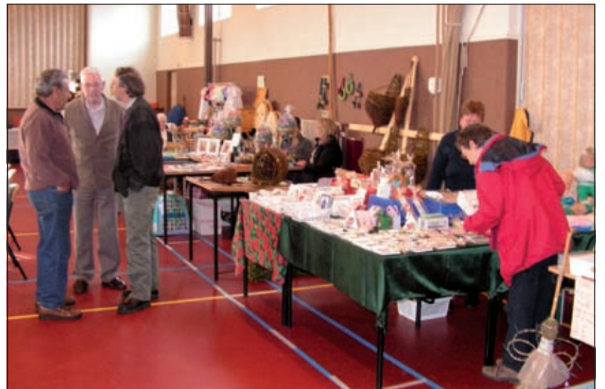
Een beeld van de vorige hobbybeurs in Ø