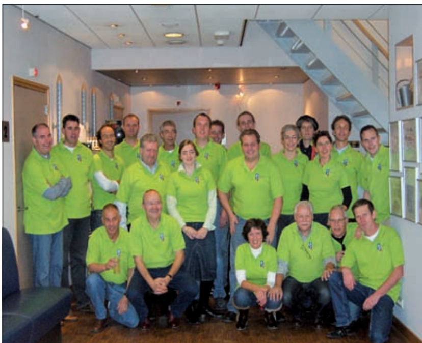
Een deel van de ca. 50 vakmensen van George In der Maur was zaterdag jl. actief bij de door het bedrijf georganiseerde open dag.

Van de 4500 verzonden uitnodigingen, bezochten zaterdag jl. 566 genodigden het bedrijf en werden rondgeleid. Na afloop hield een deel van het personeel dat voor begeleiding en uitleg was ingeschakeld, een gezellig onderonsje en poseerde voor de foto [KP].