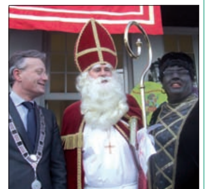
Natuurlijk is er ook weer de balkon-scène.

Sinterklaas kwam dit jaar per koets naar het gemeentehuis in Bilthoven. Op het besneeuwde gazon van Jagt lust stonden honderden kinderen om de goedheiligman te ontvangen en toe te zingen. Sinterklaas werd vergezeld door tientallen muzikale pieten. Op het balkon van het gemeentehuis heet burgemeester Gerritsen de Sint hartelijk welkom en schenkt hem een fotoboek van de gemeente. Sinterklaas heeft voor de burgemeester ook wat meegebracht. 'Omdat het een nogal explosief jaar is geweest ontvangt u van mij een passend geschenk.' De Sint geeft de burgemeester een fraai doosje waaruit als hij het openmaakt tot zijn schrik een duveltje tevoorschijn komt. [GG]