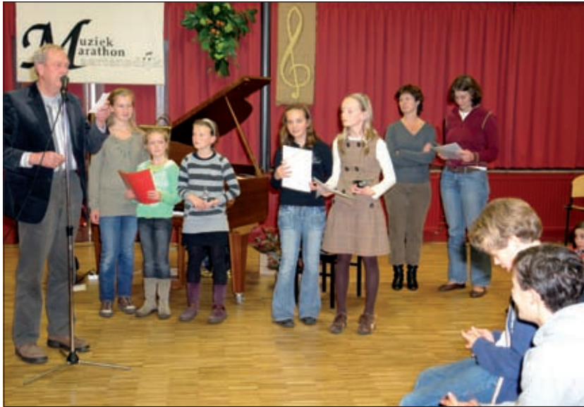
Ook in De Bilt was er een muziekmarathon.

Een deskundige jury zal de inzendingen beoordelen op techniek, articulatie, zuiverheid, algemene muzikale uitvoering en de muzikale prestatie als geheel. Voor de verschillende leeftijdscategorieën en groepen zijn diverse prijzen beschikbaar. De Muziek Marathon Maartensdijk wordt mede mogelijk gemaakt dankzij een bijdrage van diverse sponsors. Het is fijn dat dit jaar gebruik gemaakt kan worden van een goede vleugel, waardoor de marathon ook voor pianisten aantrekkelijk is. Ook de begeleiders profiteren daarvan. De gemeente De Bilt maakte dit mogelijk door een speciale financiële bijdrage.