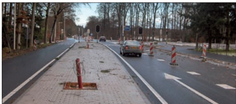
De Rotonde in de N234 waar de afslag is naar Den Dolder, de Nieuwe Dolderseweg (N238), wordt ook al vervangen door verkeerslichten.