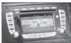
Navigatiesysteem + SD-cardreader