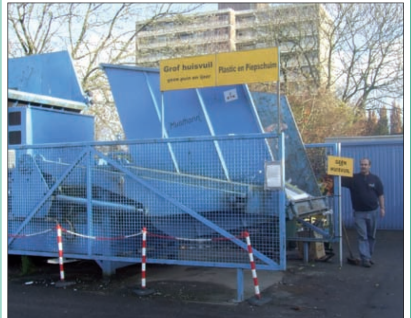
De milieustraat gaat volgend jaar op de schop.

Tijdens de uitvoering is er een tijdelijke voorziening op de naastgelegen gemeentewerf. [GG]