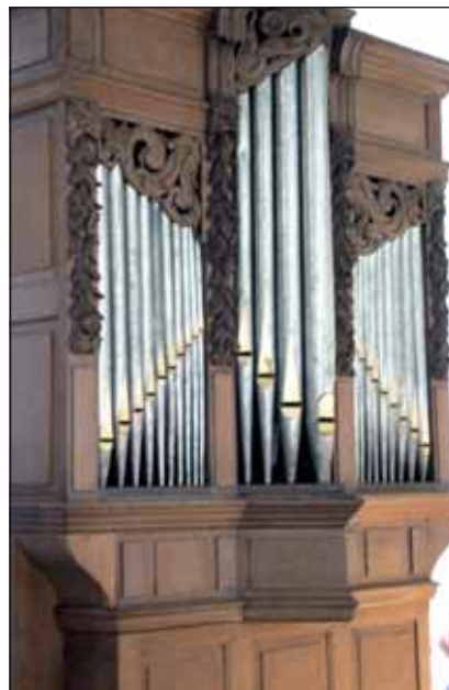
Het uit 1711 daterende orgel heeft een flinke opknappbeurt ondergaan.

De kapel, hoe klein ook, is een volledige kruiskerk, maar binnen in de kapel kost het moeite de kruisvorm terug te vinden. De Stichting Blauwkapel is in 1957 opgericht door de christelijke aannemersbond (NCAB) en de christelijke bouwvakarbeiderbond (NCB). De stichting kocht de kerk voor 1 gulden en liet de kerk restaureren met financiële hulp van deze bonden en monumentenzorg. Tot op de dag van vandaag wordt het stichtingsbestuur gevormd door vertegenwoordigers van bouwwerkgevers en bouwvakbondsbestuurders.