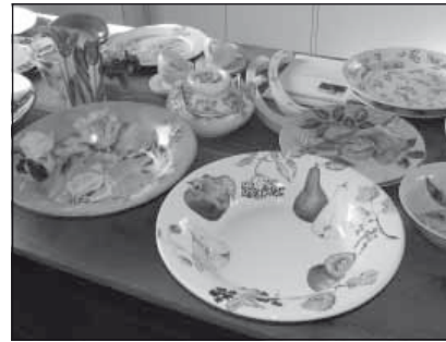
Enkele kunstvoorwerpen die in de Bilthovense bibliotheek tentoongesteld worden.

van glazuurpoeders. Door die met oliën te mengen maak ik daar verf van. Een dunne olie geeft de verf de mogelijkheid ermee te schrijven. Een dikkere olie levert een verf op waarmee je kunt schilderen.' De beschilderde voorwerpen worden in een keramiekoven gebrand tussen de 750 en 840 graden. Die temperatuur wordt heel langzaam opgebouwd. Het opbranden van beschilderde voorwerpen duurt tien tot twaalf uur. 'Daarna moet je het die zelfde tijd weer af laten koelen. Ik doe mijn oven niet eerder open dan wanneer het 60 graden is, want boven de 100 graden kan het barsten. Het gehele proces duurt dus wel 24 uur.'