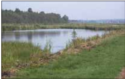
De eendenkooi en een petgat langs het Bert Bospad in de Westbroekse Zodden.