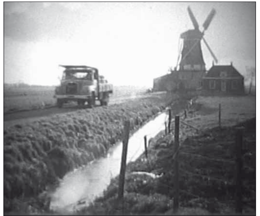
Op weg naar een klant.

Bij het raadplegen van de website 'Jeugdsentiment.net' blijkt dat de inmiddels al tientallen jaren geleden gestopte serie De Kijkkastman nog steeds veel herinneringen oproept bij de jeugd van toen. Mensen op deze site vertellen hoe ze in hun jeugd bij opa en oma 1 keer per maand op zaterdagmiddag tv. keken. Waarbij