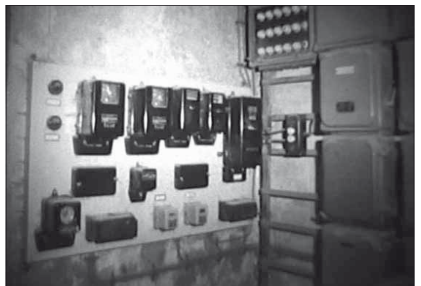
Elektriciteitsmeters waarmee de door de molen opgewekte en aan het net afgegeven stroom werd vastgelegd.