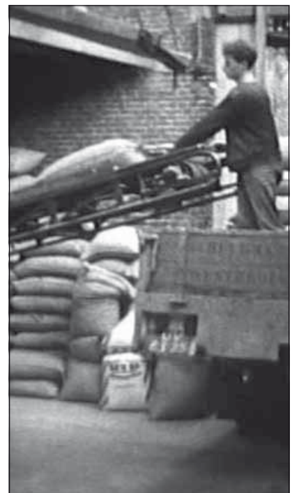
Evert Schuurman laadt de wagen.