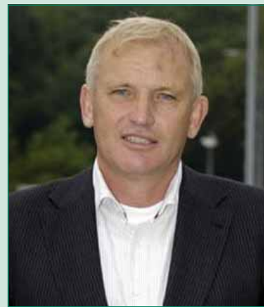
De nieuwe coach.

Bianchi over zijn keuze: 'Ik heb Voordaan altijd een mooie club gevonden. No nonsens, mouwen opstropen en ervoor gaan. De play off wedstrijd tegen Klein Zwitserland en de promotie naar de hoofdklasse vorig seizoen was prachtig en dit jaar speelt de ploeg positief en