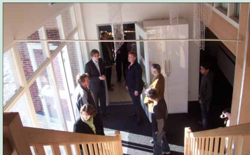
Genodigden werden rondgeleid en bekeken goedkeurend de accommodatie en het uitzicht.