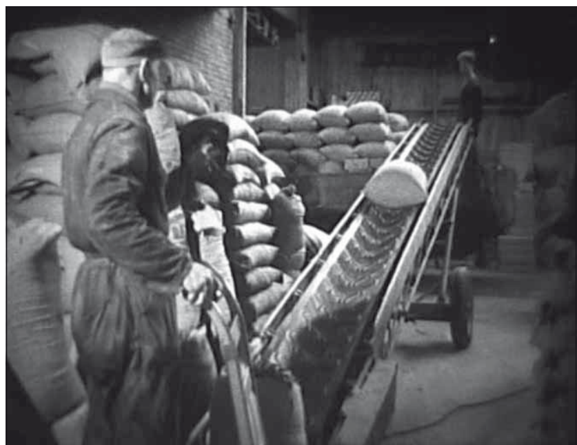
Vader en zoon aan de lopende band.