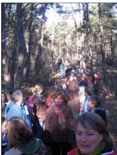
Dat het toegankelijk houden van de Biltse Duinen bij veel mensen leeft, bewees de grote opkomst bij de protestwandeling in het gebied op zaterdag 16 februari.

In de raadsvergadering van december vorig jaar heeft de gemeenteraad besloten om de monumentenverordening uit te breiden met een hoofdstuk voor gemeentelijke landschapsmonumenten. Naast de algemene behoefte om waardevolle landschappen te kunnen beschermen speelden de ontwikkelingen in de Biltse Duinen daarbij een rol. Direct na aanpassing heeft een bureau onderzoek verricht