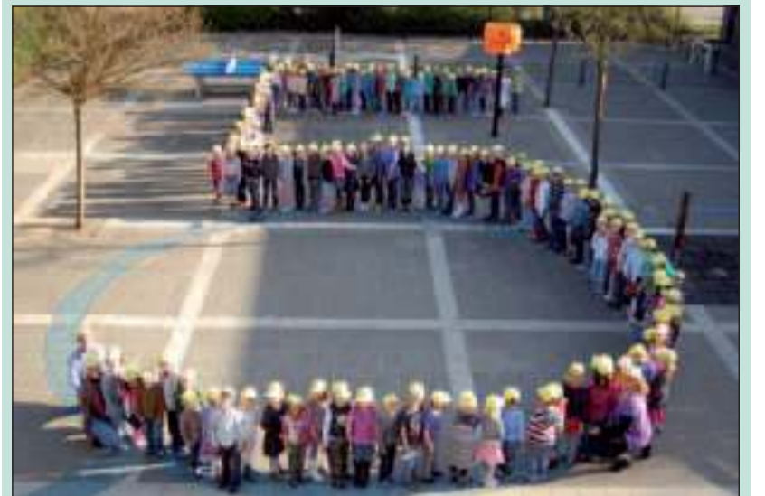
De Regenboog 5 jaar.