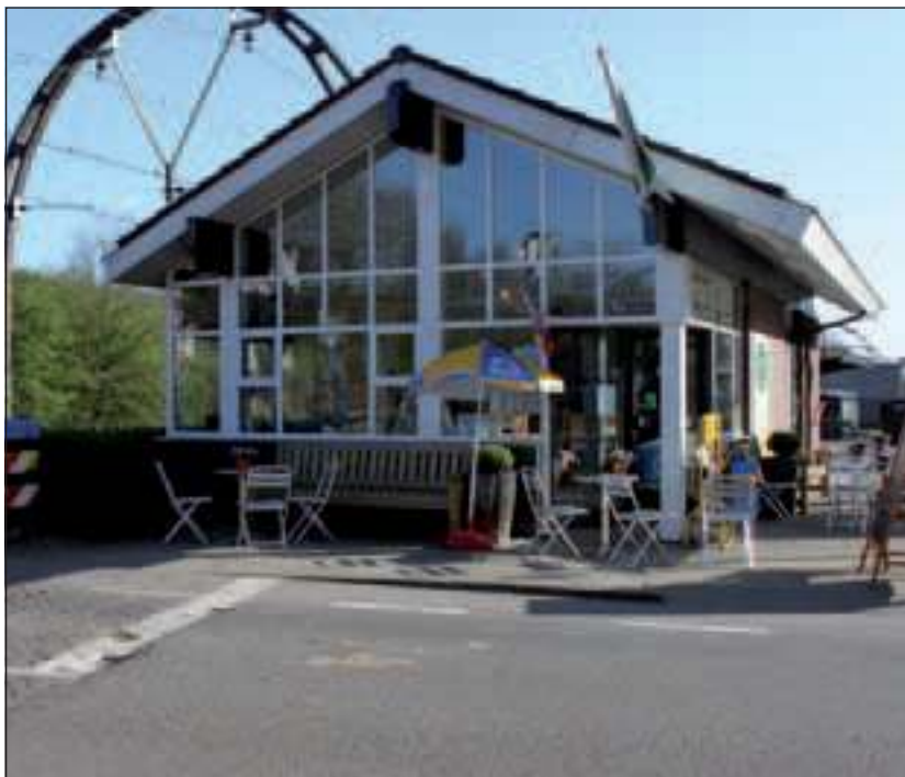
Perron Peet is onlangs geschilderd en de openingstijden zijn vernieuwd.

olie of azijn of zelfs een heerlijke fles wijn. Dit jaar zal ons ijsassortiment worden uitgebreid met een paar nieuwe soorten en natuurlijk hebben we dit jaar ook weer ons overheerlijk Italiaans schepijs'