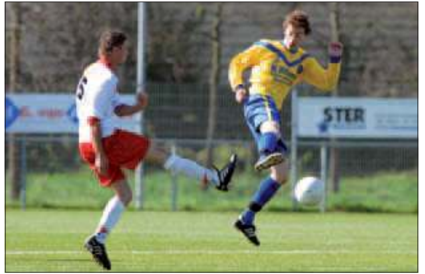
SVM heeft de wedstrijd tegen Valleivogels met 1-2 verloren.

Het spel de afgelopen weken (behalve tegen DOSC) geeft voldoende aanleiding om met vertrouwen naar deze reeks te mogen kijken. HansVoogt