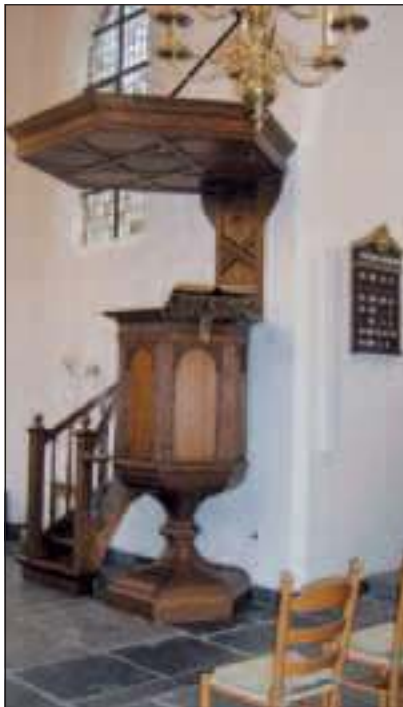
In Ankeveen was het mogelijk om een oude preekstoel te bemachtigen van rond 1650. Ros maakte een ontwerp om deze preekstoel te restaureren in een stijl die past bij de kerk van Lage Vuursche

'Kunst is de uitdrukking van het tijdseigene' is een uitspraak die hij onlangs deed in een interview met het Reformatorisch Dagblad. Dat geldt in alle gevallen, is zijn stellige opvatting. 'Je reageert altijd vanuit het levensgevoel van de tijd waarin je leeft, wat je ook doet en hoe je ook werkt. Ook al maak je gebruik van traditionele technieken, het moet duidelijk een eigentijdse reflectie hebben. Dat kan niet anders, anders klopt er iets niet. Het heeft dan ook geen