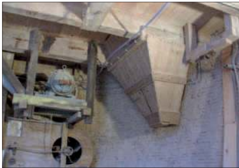
Een deel van het interieur van De Geesina.

In de vergadering van de Dorpsraad Groenekan van 18 april (20.00 uur in het dorps huis) zal Paul Vesters van het Utrechts Landschap een nadere toelichting geven op de restauratieplannen.