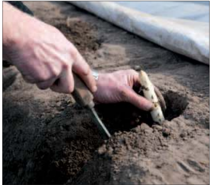
Klaar voor de oogst en met zorg uitgestoken.