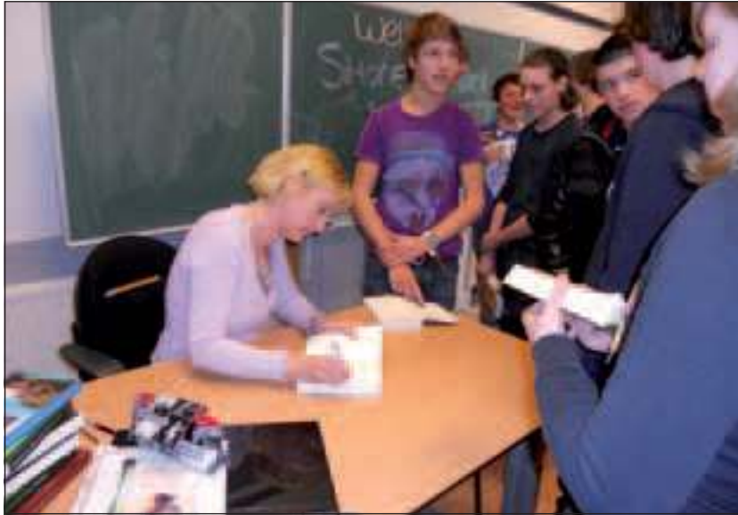
En dan de handtekeningen.

Van der Vlugs eerste gepubliceerde boek is 'Amulet' en gaat over de hekserij van weleer. 'Schrijfster Thea Beckman heeft mij met 'Kruistocht in spijkerbroek' geïnspireerd om historische romans te schrijven. Eigen-