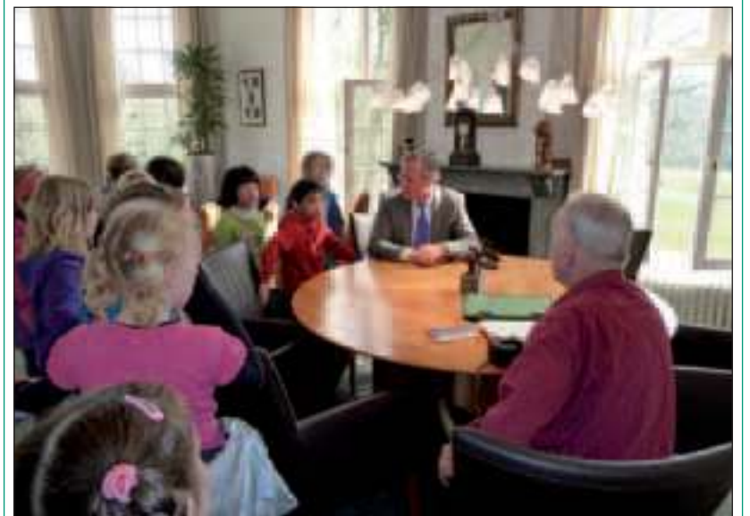
Op bezoek bij de burgemeester.

Beide scholen betrekken binnenkort (2012-2013) samen als een nieuwe algemeen christelijke basisschool een heel bijzonder nieuw 'Droomhuis' (schoolgebouw) aan de Melkweg. (Eveline Meijer)