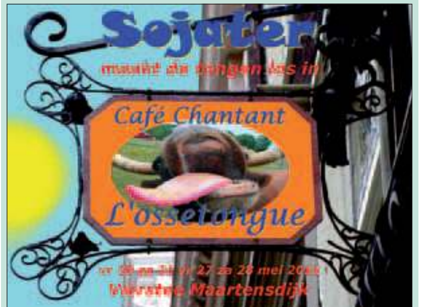
Slechts 4 voorstellingen in De Vierstee.

Vrijdag 20, zaterdag 21, vrijdag 27 en zaterdag 28 mei in De Vierstee, Nachtegaallaan 30 te Maartensdijk. Aanvang 20.30 uur, einde ca. 23.00 uur. Entree 12,50 euro. In de pauze is er een actie voor de stichting Help Mabel. Reserveer vroegtijdig via www.sojater.nl of 035 5771669.