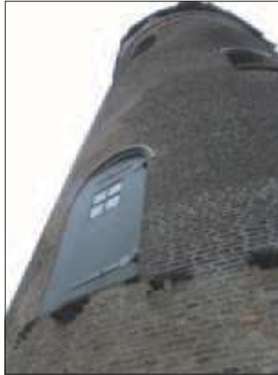
De kwaliteit van de romp is matig.

Gelukkig heeft het UL nu toch besloten De Geesina te restaureren tot een maalvaardige molen. Gezien de nu beschikbare middelen zal de molen een sobere restauratie ondergaan. Doordat de molen nog tot in de zeventiger jaren in bedrijf is geweest is een groot deel van het binnenwerk zoals spullen, assen en wielen maar ook een deel van de inventaris nog aanwezig. De kwaliteit van de romp is matig. Oorspronkelijk was het de bedoeling die in één keer grootschalig aan te pakken, maar aangezien er dan voor de rest van de restauratie (te) weinig budget zou overblijven is besloten de romp de komende jaren gefaseerd te verbeteren. Inmiddels is weer een begin gemaakt met de restauratie. De molenroeden zijn gestraald en de molen is schoongemaakt. De volgende stap zal zijn het herstel van de zoldervloeren en van het metselwerk. Het maken van de kap, het steken van de roeden, het aanbrengen van de stelling en het ophekken van de wiken volgen daarna. Sluitstuk zal zijn de restauratie van het maalkoppel. De