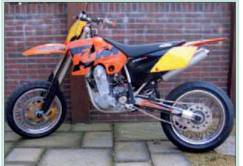
Eén van de gestolen motoren.

Op de plaats delict zelf is te zien hoe brutaal en doelbewust er te werk is gegaan. Je moet voor zo'n diefstal toch door het hek en tweemaal langs het huis waar binnen ook nog twee honden zijn. Eerst om bij de schuur te komen en daarna om het zware materiaal naar buiten af te voeren. De kans bestaat dat iemand tijdens die nachtelijke uren iets heeft gezien. Daarom wil Nagtegaal dit verhaal kwijt, want dat brengt misschien mensen op een idee. Natuurlijk heeft hij aangifte gedaan en toen bleek ook dat onlangs in Breukelen hetzelfde is gebeurd. Ook daar werden dezelfde twee types crossmotoren gestolen. Wie iets heeft gezien of denkt meer te weten over de diefstal wordt verzocht contact op te nemen met Wim Nagtegaal 06 55593309 of de politie De Bilt via 0900-8844.