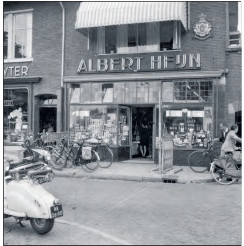
Albert Heijn jaren vijftig, naast concurrent De Gruyter.

In de oorlog voerden Engelse vliegtuigen verschillende bombardementen op Bilthoven uit. Het doel was de spoorlijn en ook het bunkercomplex van het commando van het Duitse 88ste legercorps dat belast was met de kustverdediging