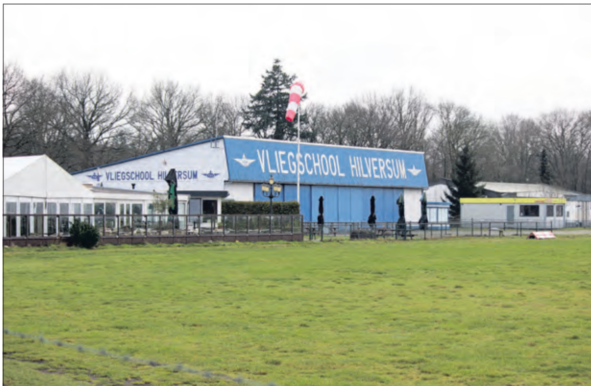
Vliegschool Hilversum zal moeten wijken als er woningbouw plaatsvindt op het vliegveld.