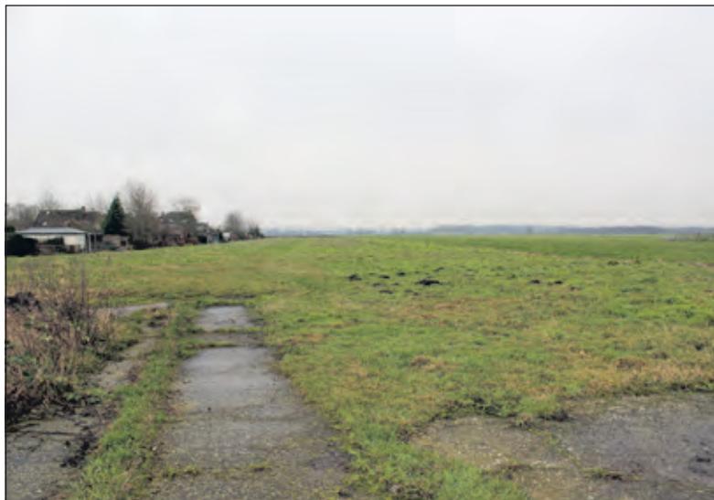
Volgens de gemeente is de locatie achter de Kerkdijk 35-37 te Westbroek al vele jaren een woningbouwlocatie; een particuliere initiatiefnemer heeft in samenspraak met de gemeente de mogelijkheden van een woningbouwontwikkeling onderzocht.

Na een instemmend besluit van de gemeenteraad, werkt de initiatiefnemer, binnen de kaders van de ruimtelijke randvoorwaarden, in het eerste halfjaar van 2022 een gedetailleerd bestemmingsplan uit. In het geval de raad niet instemt met de voorliggende ruimtelijke randvoorwaarden, heroverweegt de initiatiefnemer het voortzetten van de beoogde woningbouwontwikkeling gegeven de lange voorgeschiedenis. Gedurende de bestemmingsplanprocedure geldt de wettelijke procedure van inspraak en beroep. Na vaststelling van het bestemmingsplan kan de initiatiefnemer de benodigde omgevingsvergunning aanvragen. Vervolgens staan voor belanghebbenden ten aanzien van de vergunningprocedure nog de rechtsmiddelen van bezwaar en beroep open.