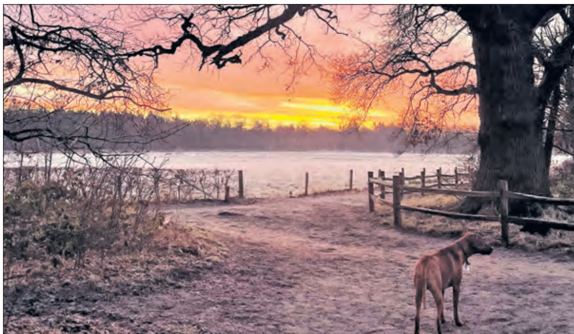
Winterochtend in Houdringe op 8 januari.