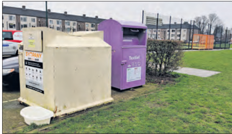
In De Bilt staan de containers op Weltevreden (Milieustraat), Biltstein, Aeolusweg (foto), Sint Laurensweg en Henri Dunantplein.