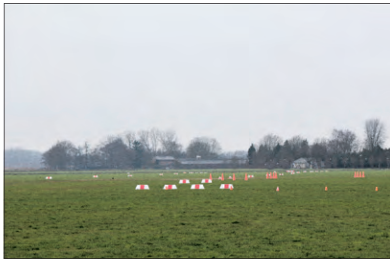
Het vliegveld van nu; op het gras zijn de circuitgebieden gemarkeerd. Op de achtergrond de contouren van het Noorderpark.

van enkelen. Door bouwing van én Ter Sype én het vliegveld zou het mogelijk zijn dat er zo'n 600 - 1000 nieuwe woningen gerealiseerd worden. Bij het voorstel van de VVD is hiervoor wel een betere en robuustere Noodweg noodzakelijk en over de gevolgen van deze plannen voor de leefbaarheid in buurgemeenten Hollandsche Rading en Maartensdijk, wordt met geen woord gerept. Wel wordt genoemd dat wellicht kan worden nagedacht om de Noodweg te verlengen en even ten noorden van Hollandsche Rading rechtstreeks op de A27 aan te sluiten. Een oud plan dat nog dateert van voor de aanleg van de A27 begin jaren '70. Dit plan is toen van tafel verdwenen. Inmiddels is de lokale situatie veranderd, omdat deze gronden in eigendom zijn gekomen van het Goois Natuurreservaat.