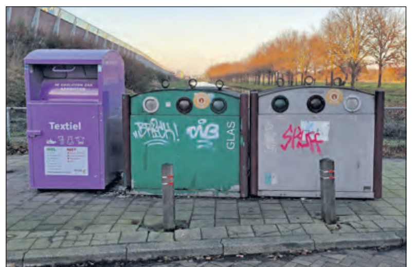
Groenekan heeft 1 container aan de Groenekanseweg.