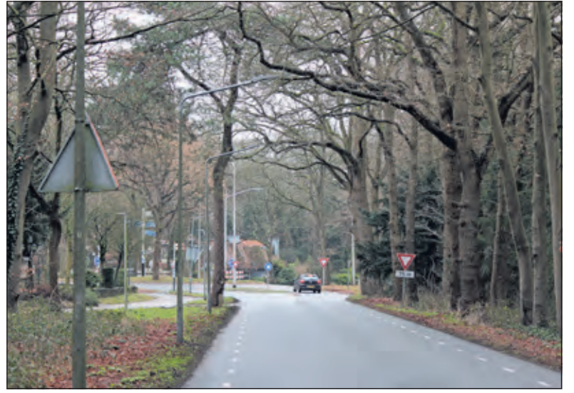
De Noodweg komt uit op de rotonde aan de Utrechtseweg. Rechtsaf richting Hollandsche Rading en de A27.

te vermijden. Voor een vliegveld dat in de randstad tussen allerlei dorpen ligt is er sprake van een laag percentage klagers. Het vliegveld wordt actief gebruikt door ca 1200 gebruikers: zweefvliegers, motorvliegers en parachutisten. Diverse gebruikers vervullen maatschappelijke diensten, zoals de ANWB-traumahelikopter, het leger, de politie en andere professionele gebruikers. Daarnaast maken o.a.