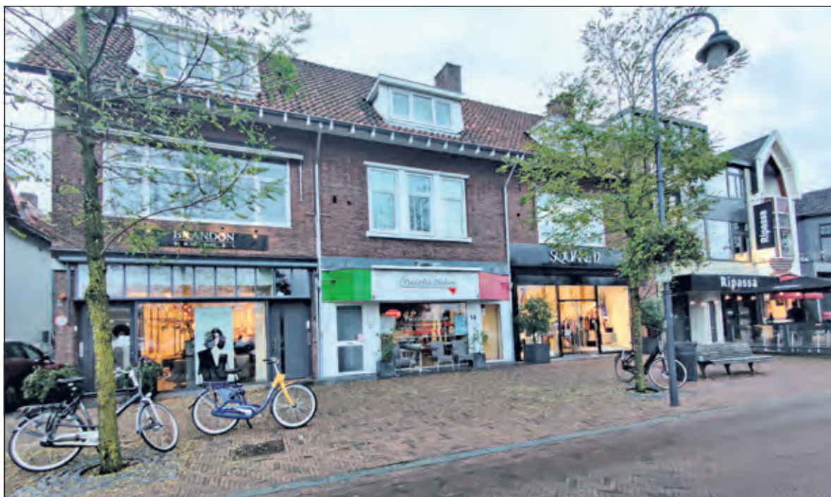
In 2021 van noord naar zuid de nrs. 18, 14 en 12.

Donderdag 6 januari gingen 2 andere activiteiten niet door en voor vrijdag 7 januari was er ook al een activiteit afgelast. Op donderdagmiddag was er bij Mens De Bilt in De Bilt een bescheiden belangstelling voor 'Kaarten maken met ecoline'. I.v.m. het besmettingsgevaar zaten de deelnemers ver uit elkaar. (Frans Poot)