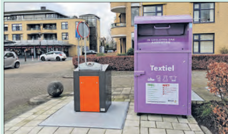
Oude kledingcontainers in de gemeente worden vervangen door grote paarse containers. Paars is de kleur van textiel, net als blauw voor papier. Vandaar de kleur van de container. (zie voor meer informatie pag. 11)