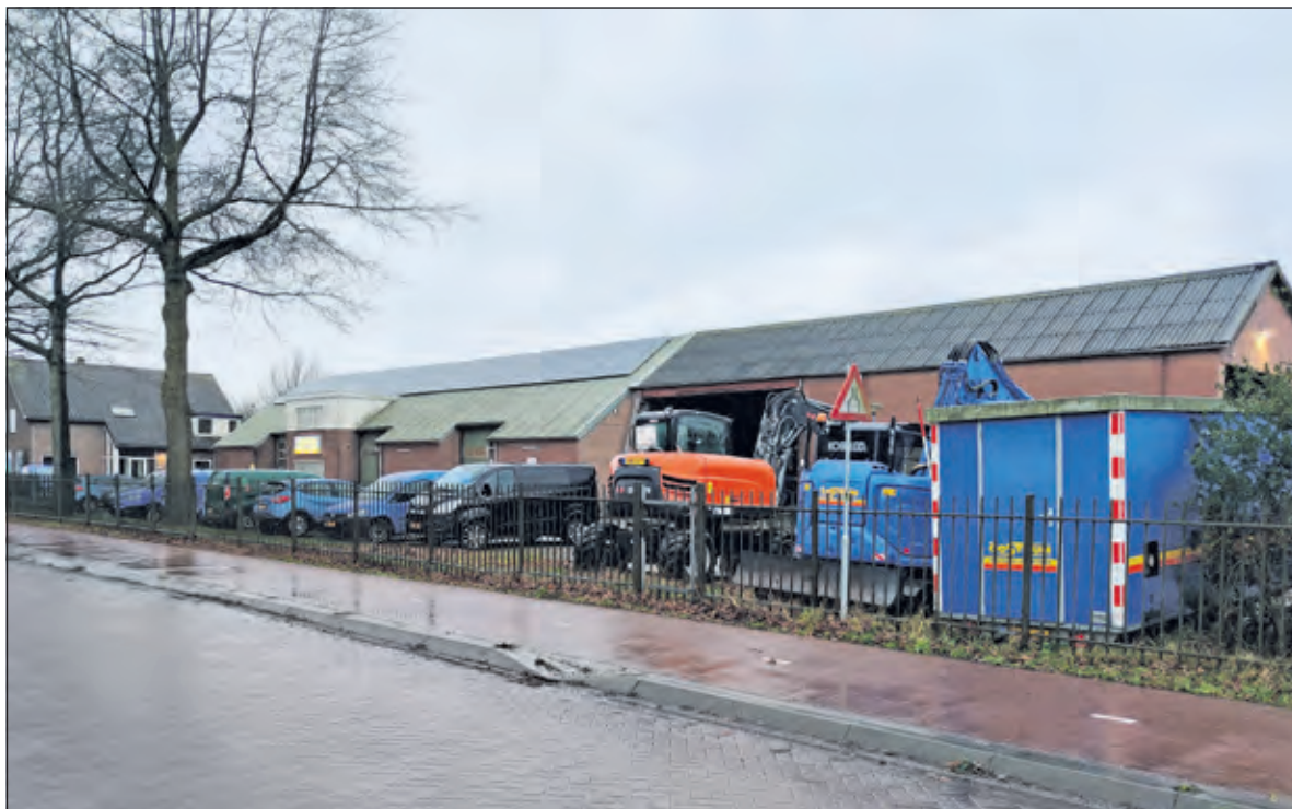
N.a.v. overleg met Fa. van Oostrum is gebleken, dat er concrete mogelijkheden zijn tot realisatie van gevarieerde woningbouw op het terrein van de Fa van Oostrum.

Het argument dat van de doelgroepenverordening kan worden afgevoerd, omdat het planproces al zo lang duurt heeft, verbaast hen zeer. 'Waarom werkt een gemeente mee aan de realisatie van zoveel villa's, terwijl een projectontwikkelaar, die de grond ooit voor een schijntje (ca. 1 miljoen euro) heeft gekocht de enige is die daar beter van wordt? Voorzien in betaalbare woningen in De Bilt is een publieke taak, het spekken van iemand zijn portemonnee niet'.