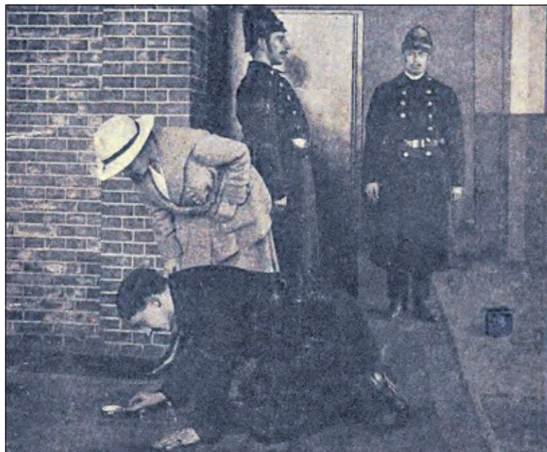
De onderzoekers bestudeerden zorgvuldig alle sporen.