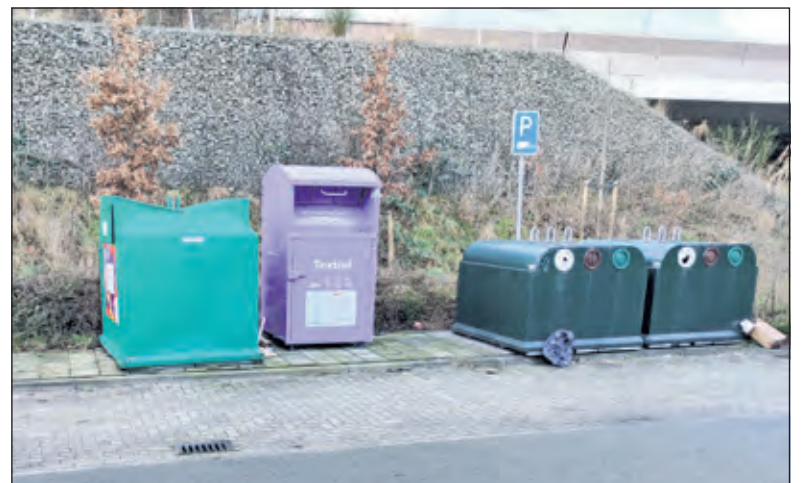
In Hollandsche Rading staat de containers aan de Spoorlaan.

genomen door de BIGA-groep. Communicatieadviseur Sander van Oorspronk vertelt: 'De 'oude' containers van Sympany worden weggehaald, maar op sommige plekken zal wat overlap zijn. We hebben liever overlap dan dat er een periode geen container staat. Dat levert snel zwerfafval op. M.b.t. de kleur: paars is de kleur van textielinzameling, zoals oranje dat voor PMD en blauw voor papier is. Textiel neemt doorgaans veel ruimte in, daarom is het inderdaad een flinke container. Als het niet (goed) mogelijk is de andere containers te gebruiken kunnen inwoners een melding hiervan maken bij de gemeente, dan kunnen we kijken hoe we dat oplossen.'