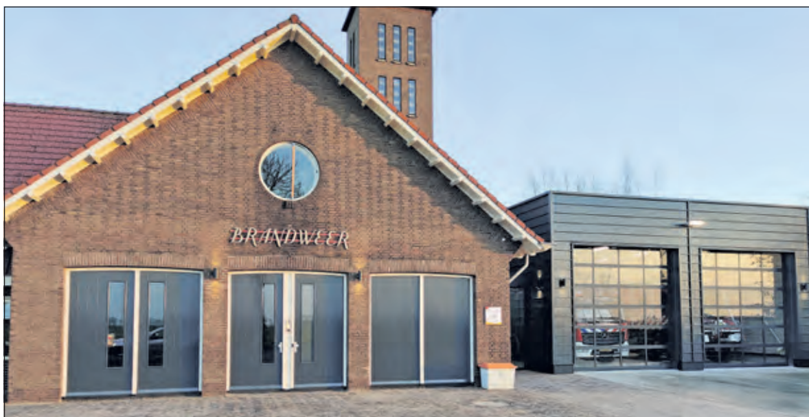
Naast de gerestaureerde oude brandweerkazerne is een nieuwe stalling voor de blusvoertuigen verzezen.

traditionalistische stijl ontworpen. Het gebouw was deels vrijstaand, deels vast gebouwd aan een voormalige dienstwoning, die buiten de bescherming valt. De kazerne is uitgevoerd met een toren ten behoeve van het drogen van de slangen. Door de landelijke ligging is de toren één van de herkenningspunten binnen de gemeente.