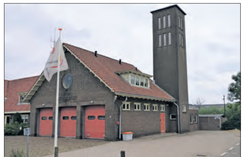
Door de landelijke ligging is de toren van de brandweerkazerne Maartensdijk één van de herkenningspunten binnen de gemeente.