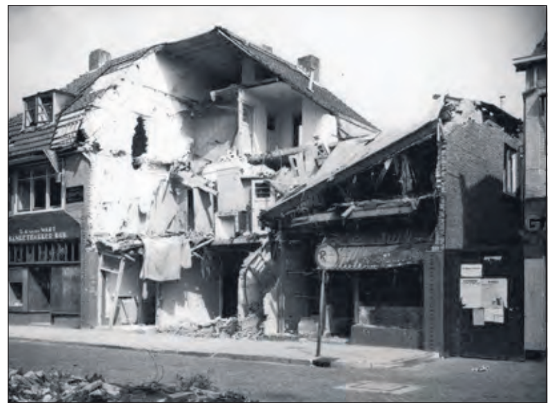
Het Emmaplein na het bombardement van 29 november 1944.

in Nederland en sinds 1 januari 1944 gevestigd was in Bilthoven-Noord (tussen Hasebroeklaan, Bolderdijklaan en Tollenslaan). Dat ging wel eens mis. Zo ook op 29 november 1944 toen met name het Emmaplein zwaar werd geraakt. De puinhopen bleven lang liggen en men sprak van 'Het Pompei van Bilthoven'. Begin jaren 50 werden de drie vernielde winkelpanden herbouwd.