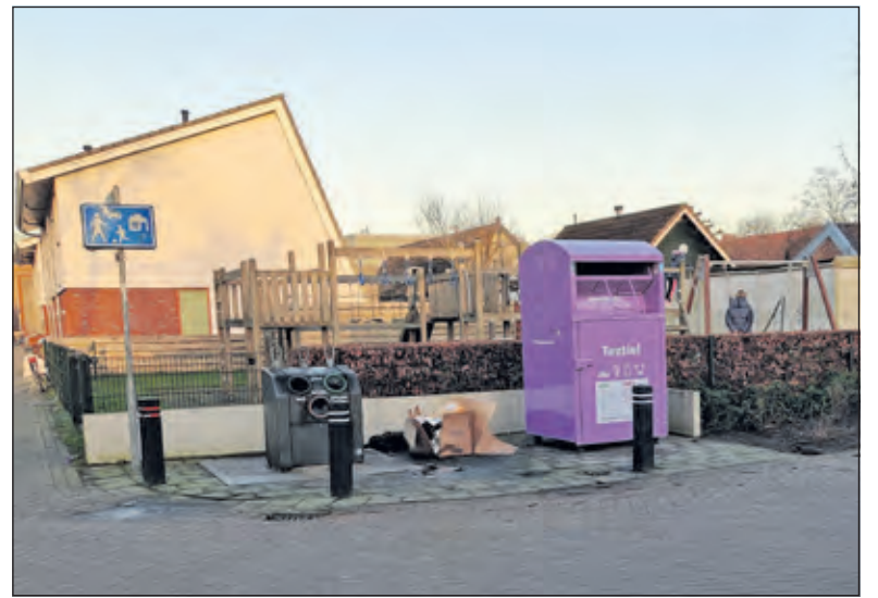
In Westbroek bevindt de container zich aan de Schutmeesterweg.

Kliniek voor gezelschapsdieren en ambulante kliniek voor paarden TOLAKKERWEG 157 - MAARTENSDIJK - WWW.DKMIDDEN.NL - 0346 725998