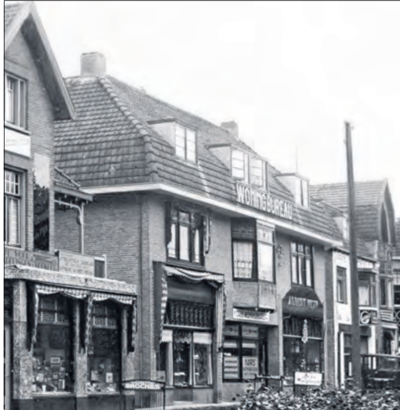
Emmaplein 12-18 voor 1934.