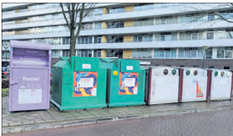
In Bilthoven staan containers aan de Planetenbaan, Neptunuslaan, Donsvlinder, Leyenseweg, Vinkenlaan, Kwinkelier (foto) en Gregoriuslaan.

In gemeente Utrechtse geldt dat kleding, gordijnen, linnengoed, dekens, schoenen, riemen, hoeden en knuffels allemaal in de textielbak mag. Ook als het kapot of versleten is. Het moet wel schoon en droog zijn. De Biga Groep komt vier keer per jaar langs om textiel aan huis op te halen. Er wordt alleen binnen de bebouwde kom ingezameld. Een