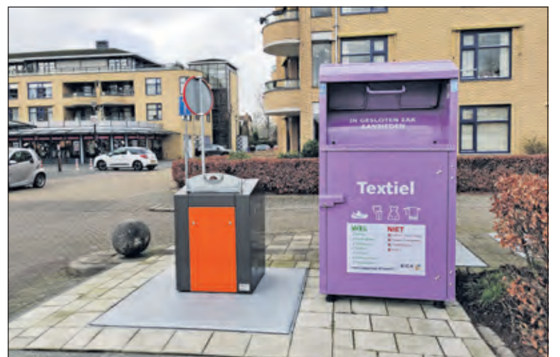
In Maartensdijk staan er 2 containers bij het Maertensplein.