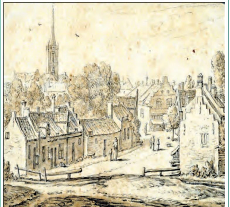
Tekening van Herman Saftleven uit de jaren 1650-1670, met de Jacobikerk linksboven.

Uit deze overdracht valt op te maken dat de capel van Westbroeck behoord heeft onder de kerspelkerk van S. Jacob binnen dese stadt.'