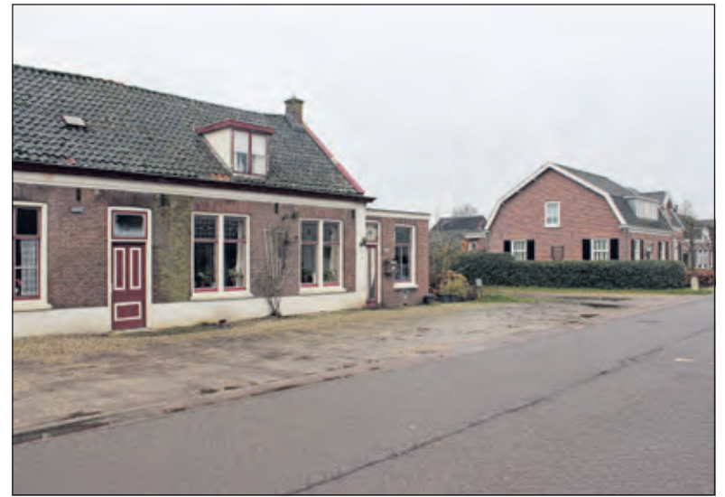
Het perceel ligt ten zuiden van Kerkdijk 35-37 in Westbroek.

Partijen die woningen willen bouwen in de gemeente De Bilt zijn verplicht om sociale woningbouw