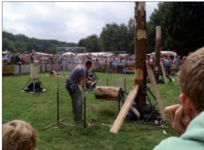
Tijdens het festival in 2010 aan belangstellenden geen gebrek bij de demonstraties.