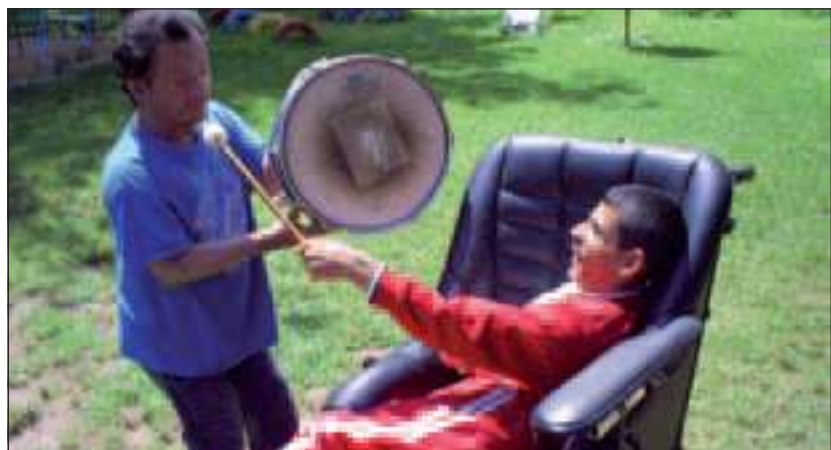
Kiro kon vier grote trommels en een compleet drumstel meegeven met het transport

Ook dit jaar is er in de zomer weer een groep vrijwilligers in beide tehuizen. Deze worden aangetrokken door de stichting Bouworde Vlaanderen. Het gaat meestal om jonge studenten, die de kinderen en jongeren aandacht geven en hen met leuke activiteiten bezighouden. Bovendien zijn er ook altijd wel plekken in of rondom het tehuis die opgevulld kunnen worden met een pot verf en een kwast. Elk jaar kijken de bewoners uit naar deze 'feestweken'. Kiro probeert ook dit jaar weer enkele raamkozijnen te laten vernieuwen in het huis in Djurkovo. Een goede isolatie verbetert het leefklimaat en verlaagt de vaak zeer hoge stookkosten. Kiro hoopt het hele huis in stappen te voorzien van betere raamkozijnen. Dit werk kan Kiro doen dankzij de steun van donateurs. Voor meer informatie: www.stichtingkiro.nl