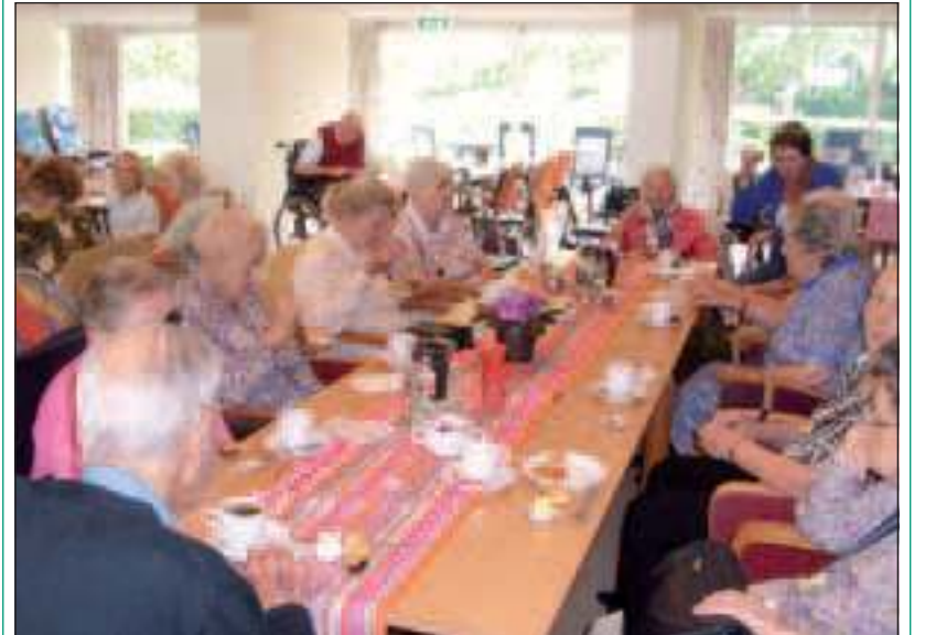
Bewoners van De Bremhorst genieten van het lekkers.