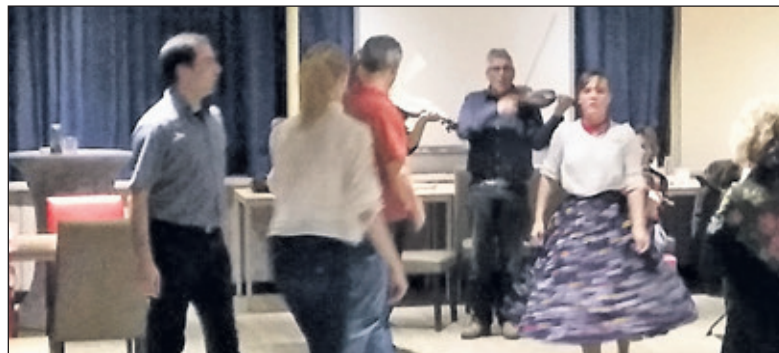
Hongaars Danshuis in De Bilt.

'Liefde is een spel voor twee, dat beiden kunnen winnen', zei de Hongaarse actrice Eva Gabor om daar aan toe te voegen: 'Ik heb Hongaars temperament; wij Hongaren zijn afstammelingen van Dziejens Khan en Attila de Hun'. Iedereen die het prachtige land weleens heeft bezocht weet hoe waar dit is: passie, hartstocht en brute oerkracht spatten je tegemoet in dit prachtige volk. Zelfs in de wat zakelijke sfeer van het H. F. Wittecentrum vulde de pure levensdrift van de Hongaarse volksdans de ruimte, afgelopen zaterdagavond tijdens het 'Hongaarse Danshuis', waar iedereen kon meedansen op levende Hongaarse muziek, die uitstekend werd verzorgd door het orkest Hajnali-Hungary, dat overrompelt met Hongaarse 'hartebreekmuziek' in