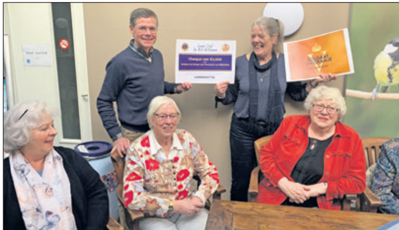
De Lions overhandigen een cheque voor Soldaat van Oranje aan de bewoners van Dijkstate.