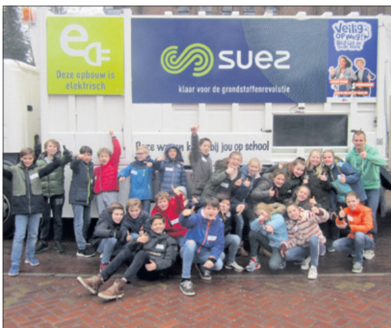
'Veilig op Weg' is het grootste dode hoek lesproject in Nederland en uniek in Europa.