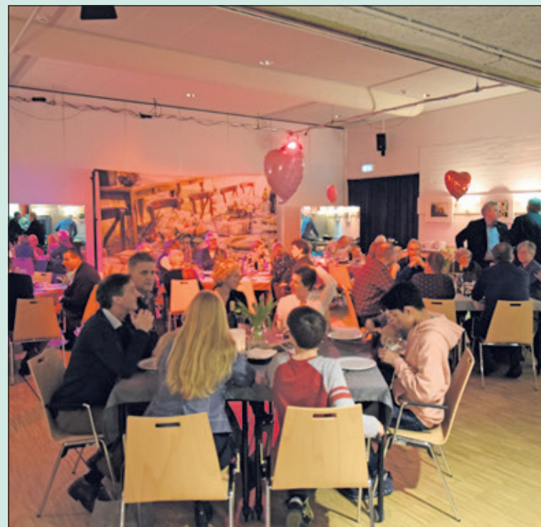
De eerste officiële keukentafel was een groot succes.

'Aan de Keukentafel' is een sociale gebeurtenis, waar dorpsgenoten elkaar ontmoeten en gezellig met elkaar kletsen over van alles en nog wat. De vrijwilligers van 'Aan de Keukentafel' hebben alvast de volgende data gereserveerd voor deelnemers aan de keukentafel: donderdag 21 maart, donderdag 11 april, donderdag 9 mei, donderdag 13 juni, donderdag 11 juli, donderdag 12 september, donderdag 10 oktober, donderdag 14 november en donderdag 12 december. Reserveren kan tot een week van tevoren, via de website of per mail naar info@vierstee.nl .