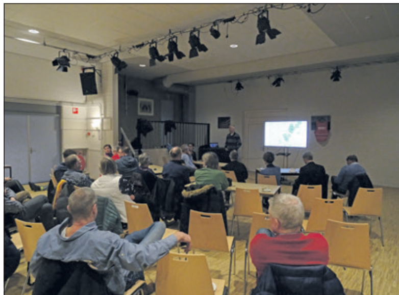
[KD] Stichting Hartslag licht de aanwezigen voor.

Het doel van de avond was om burgerhulpverleners en geïnteresseerden uit de gemeente te informeren over de activiteiten van Hartslag De Bilt. Er werd niet alleen voorlichting gegeven en vragen beantwoord, maar een bewoner uit de gemeente, die zelf gereanimeerd is vertelde zijn verhaal. De Stichting Hartslag De Bilt heeft als doel om een dekkend netwerk van AED's en getrainde burgerhulpverleners in de gemeente op te zetten. Hoe sneller de reanimatie kan worden gestart des te groter is de overlevingskans van het slachtoffer. Voor meer informatie zie www.hartslagdebilt.nl .