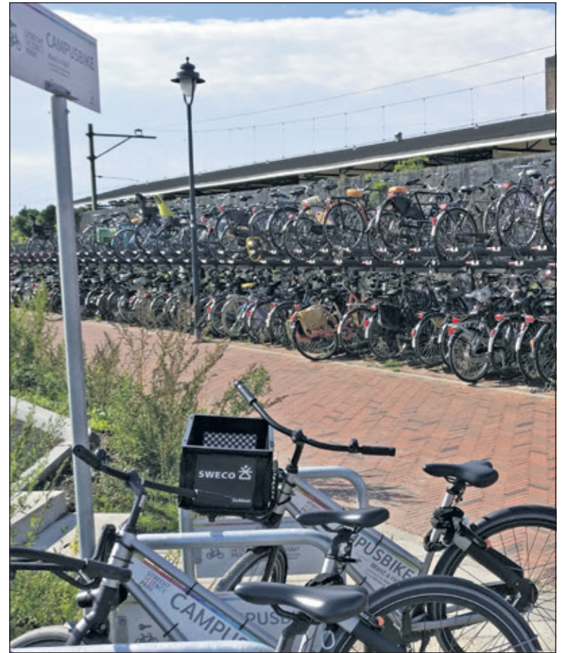
Bij station Bilthoven staan de campusbikes separaat gestald.

Wat wil U-15 komende jaren bereiken? Tussen 2021 en 2024 rijden 50.000 auto's minder op de weg, meer in- en uitstappers op het station onder andere vanuit Utrecht en minder uitstoot van CO2 en fijnstof. Quee: 'De komende tijd, wacht de automobilist nog veel hin-