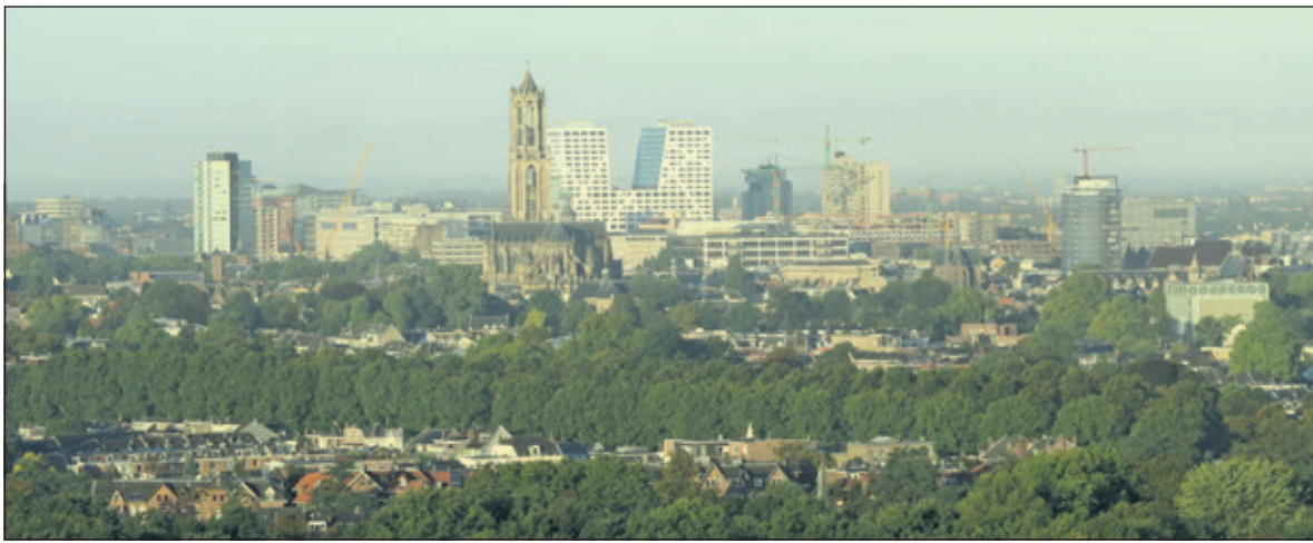
Uitzicht vanuit het provinciehuis in Utrecht.

de provinciale verkiezingen. 'Verder wil ik graag kijken naar onderwerpen waarvoor de provincie de samenwerking van de gemeenten op weg naar een sterke regio kan versterken. Vooral de ruimtelijke ordening en de verkeersproblemen. Ruimtelijke ordening is belangrijk omdat de provincie een ruimtelijk structuurplan heeft voorbereid, waarbij het groene karakter van de provincie in het geding is.' Woningbouw voor de eigen bevolking,