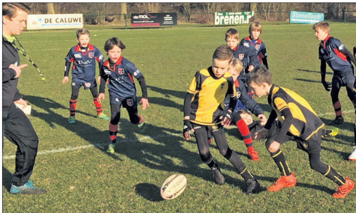
De Stichtsche Wolven spelen een fraaie pot rugby.