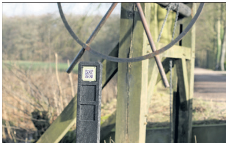
Subtiel QR bordjes leveren informatie over bijzondere plekken.

Vrijdag 8 maart onthult Stichting Dorpsraad Groenekan in samenwerking met Stichting Groenekans Landschap het project 'QR-Route Groenekan', in aanwezigheid van sponsors (Rotary De Bilt - Bilthoven, gemeente De Bilt, Rabobank Rijn en Heuvelrug, Henk van Vulpen sierbeestering) en betrokkenen (o.a. Stichting Behoud Prinsenlaantje).