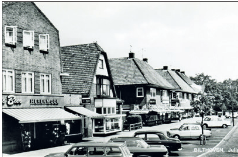
Parkeren op de Julianalaan in Bilthoven precies 50 jaar geleden.