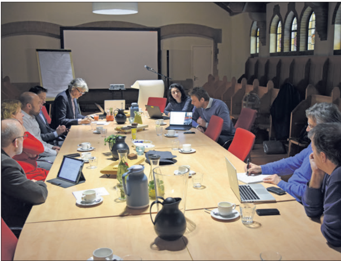
Diverse bedrijven binnen gemeente De Bilt zetten zich in voor een betere bereikbaarheid.

Tien vertegenwoordigers van Biltse bedrijven en maatschappelijke organisaties waren dinsdag 22 januari aanwezig in Berg en Bosch, op een vervolgbijeenkomst over Duurzame Bereikbaarheid en Mobiliteit. Verkeersdruk is een groot probleem in en rond De Bilt en wordt alleen maar groter. Daarom slaan diverse bedrijven de handen ineen om samen tot een oplossing te komen.