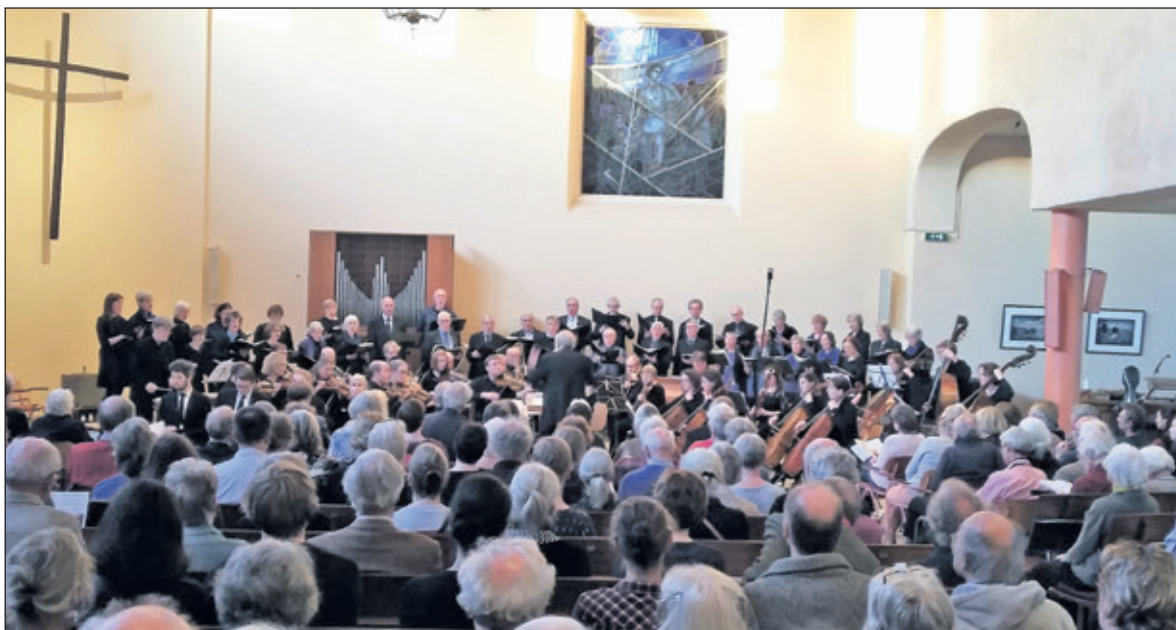
Een stampvolle Oosterlichtkerk geniet van het concert.