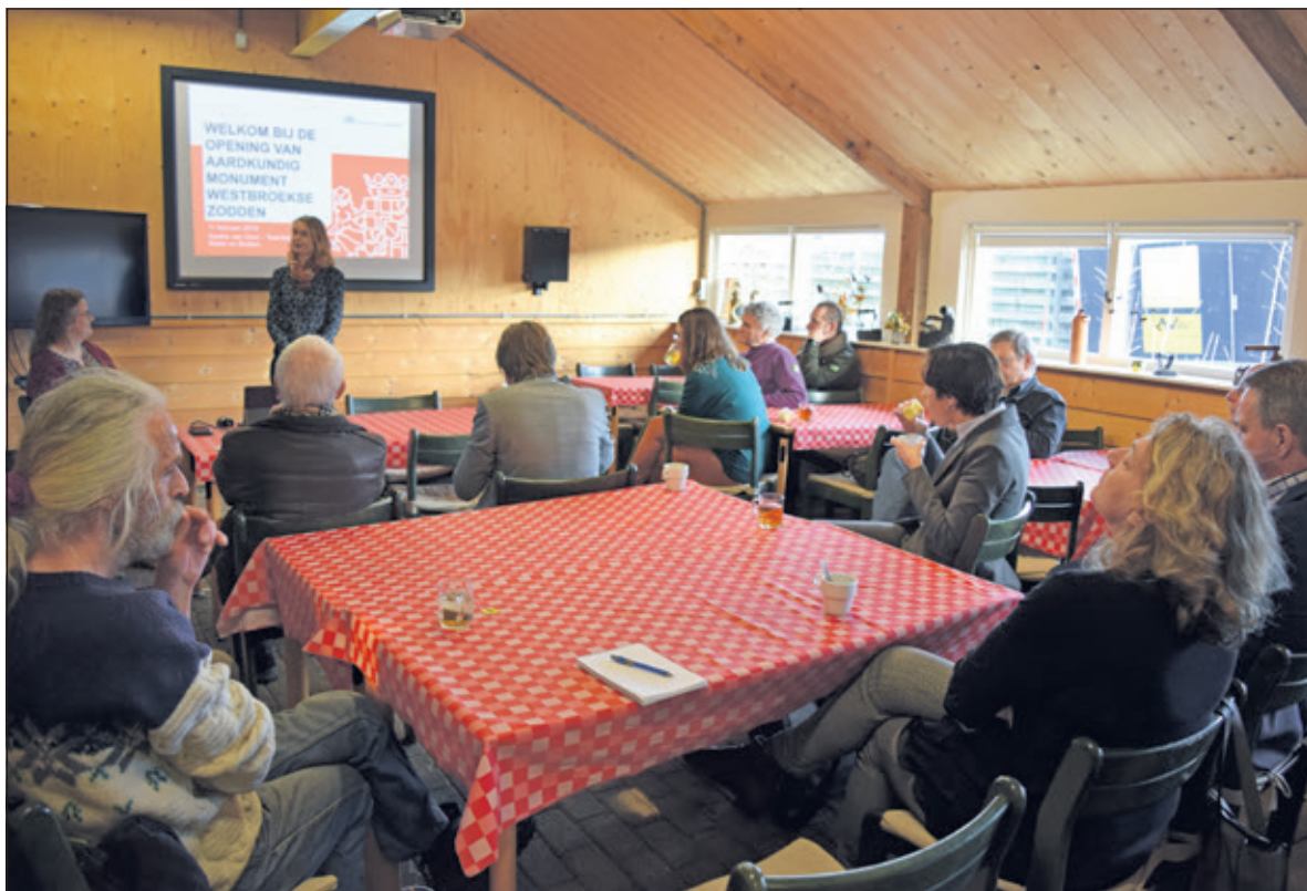
In het streekmuseum in Tienhoven wordt uitleg gegeven over aardkundige monumenten.

Maandag 11 februari werden de Westbroekse Zodden officieel uitgeroepen tot het achtste aardkundig monument in de provincie Utrecht. Namens de provincie onthulde gedeputeerde Mirjam Maasdam een informatiepaneel bij de ingang van de Westbroekse Zodden, aan de Kerkdijk in Westbroek. Het natuurgebied is in handen van Staatsbosbeheer.