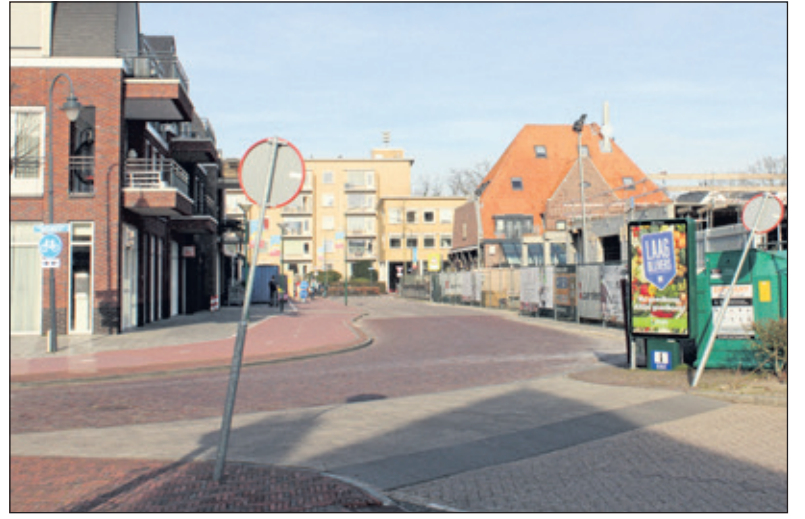
In het bouwplan dat nu wordt gerealiseerd zal de goothoogte tussen de vier nieuwe hoge puntgevels aan de Melchiorlaan ruim anderhalve meter hoger worden dan volgens het bestemmingsplan is toegestaan.

Peter Dapper vertegenwoordigt de winkeliersvereniging: 'We moeten voorkomen, dat het beeld ontstaat dat er nieuwe belangen in het spel zijn; het gaat om een goede uitwerking van de centrumplannen, zoals we dat met elkaar hebben afgesproken. Natuurlijk zijn we allerminst gecharmeerd van de wijze waarop er met ons en de andere klankbordgroep-leden wordt omgesprongen. We begrijpen ook niet waarom de bestemmingsplannen, waarvan de inkt