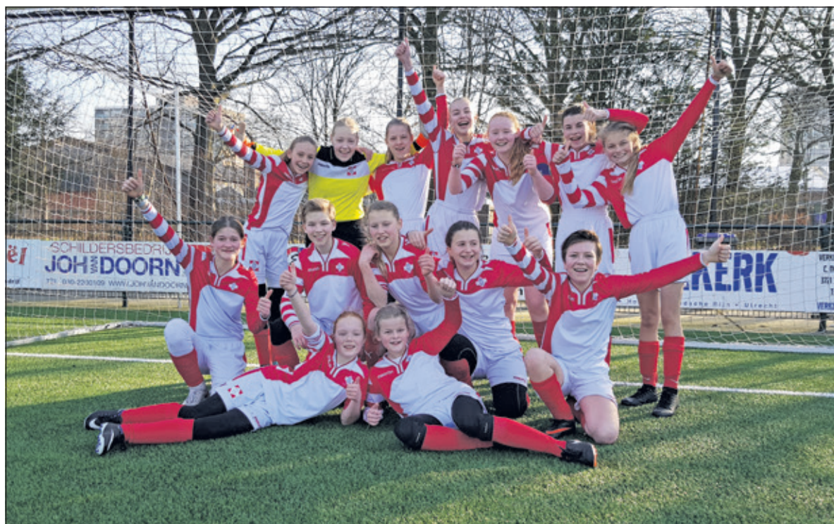
Zaterdag 16 februari speelde FC De Bilt MO13-1 de wedstrijd in de achtste finale van het KNVB-bekertoernooi in De Bilt en won daar met 2-0 van Hooglanderveen. (Sandra de Ron)