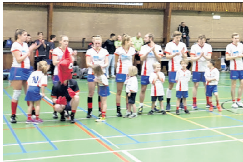
De spelers van de F1 en F2 lopen op met het eerste.

De punten van deze zaterdag zijn een beloning voor het harde werken van het afgelopen seizoen. Elke zaterdag ging Nova er volle bak in, maar elke keer zonder punten. Dan geeft het een heerlijk gevoel om voor het thuispubliek zo'n wedstrijd te spelen en daarbij de winst te pakken. De komende twee weken is er even geen korfbal. 9 maart gaat de selectie naar Maartensdijk om DOS Westbroek het vuur aan de schenen te leggen om 20.40u in De Vierstee te Maartensdijk. (Job Paauw)