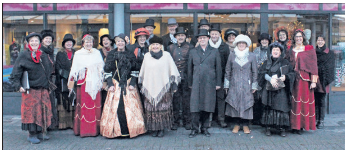
Sparks of Joy bracht vorig jaar Dickenssfeer op het Maartensplein.

Het koor Sparks of Joy uit het Westbroek bestaat 25 jaar. Wekelijk repeteren de 32 leden in het Westbroekse Dorps huis met daarna (voor de liefhebbers) een gezellige 'after party'.