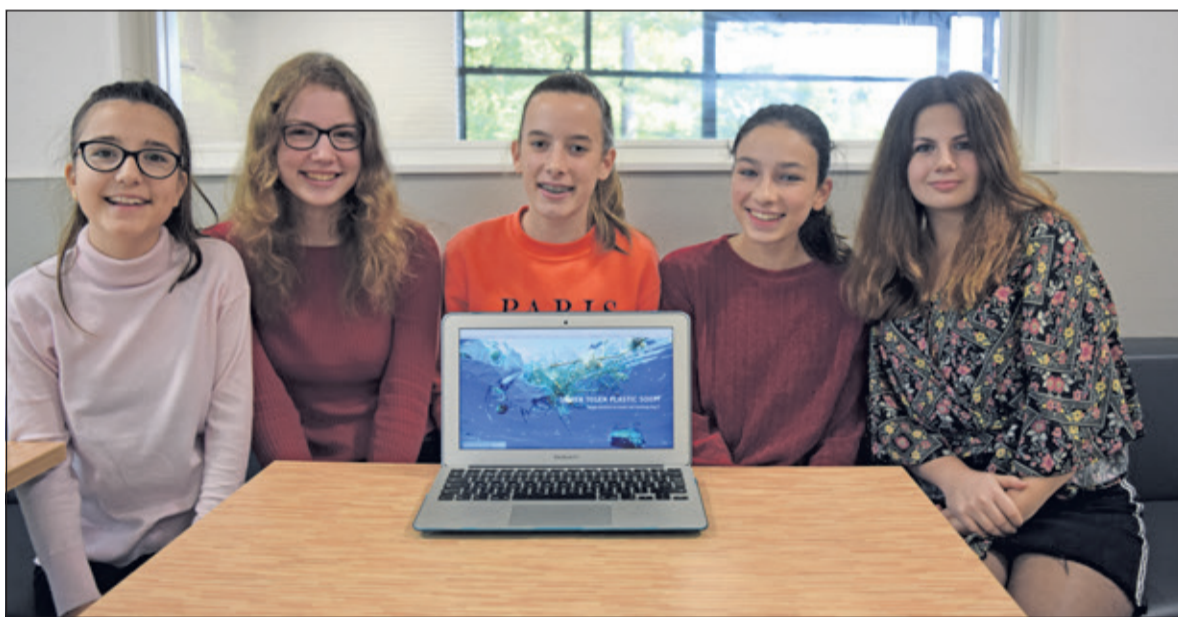
Leerlingen van HNL in Bilthoven zetten zich in voor een plastic-loze wereld.