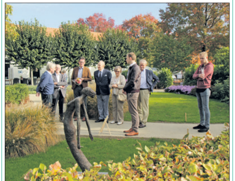
Omwonenden en belangstelden zijn onder de indruk van de tuin en de Hospice.

De tuin die is ontworpen met veel bogen om rust te geven, de grote groepen planten en struiken komen hier volledig tot hun recht; ook is er rekening mee gehouden dat de tuin vlinder-, libelle- en insectenvriendelijk is. (Wim Westland)