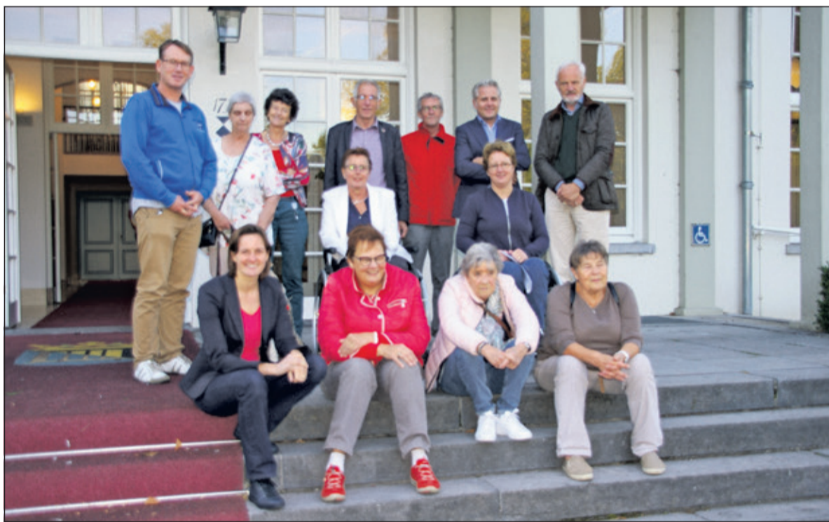
De middaggroep deelnemers met de werkgroepen Toegankelijkheid, onderdeel van de Adviesraad Sociaal Domein De Bilt.