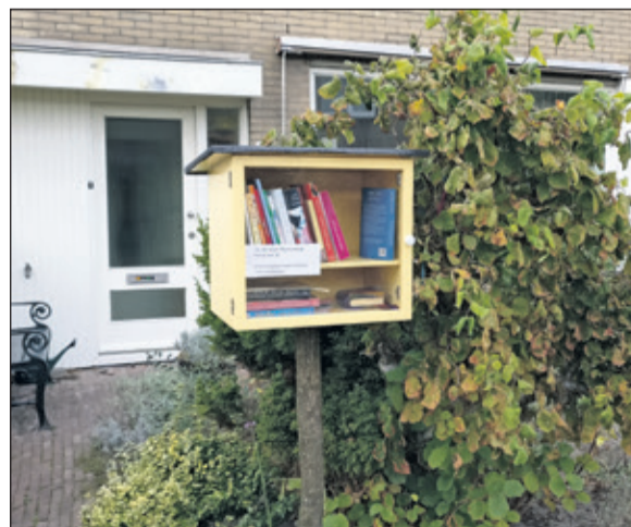
De minibieb aan de Patrijslaan in Maartensdijk.

In de minibieb Maartensdijk vind je literatuur, romans, informatieve boeken en kinder-zwerf-boeken. Kinder-zwerf-boeken zijn een initiatief van het Nationaal KinderFonds. Kinderen kunnen een boek kiezen, lezen en daarna doorgeven aan andere kinderen, zodat zoveel mogelijk kinderen boeken kunnen lezen. Of je vindt in