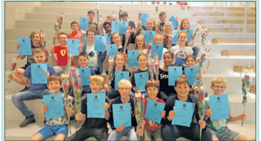
Alle kinderen van groep 8 hebben hun mediatorsdiploma ontvangen.

Ten tweede door de soms voor ons Europeanen moeilijke ritmes van de Zuid Latijns-Amerikaanse muziek. Naast de vaste AZM-leden nemen aan dit concert ook een aantal projectzangers en -zangeressen deel. Met name de Misa Criolla en Navidad Nuestra zijn bij veel Nederlandse koorzangers erg geliefd.