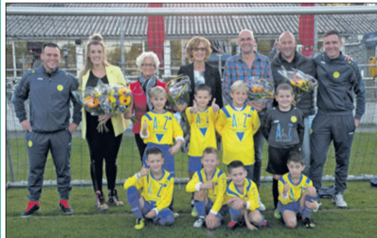
Wat zijn ze apentrots de jeugdige SVM-voetbaltalenten. Dankzij de A t/m Z adviesgroep en Slim gaan de voetballetjes veel doelpunten scoren en wedstrijden winnen. Ze zijn er klaar voor.