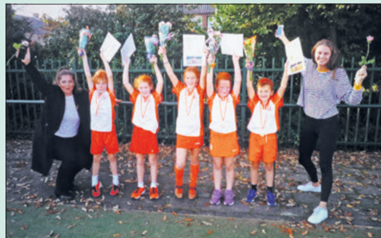
TZ E1 speelde zaterdag 13 oktober de laatste wedstrijd van het seizoen. Die was nog best spannend, maar werd gewonnen met 5-2. En dus werden zij kampioen.