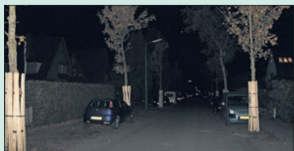
In de donkerte van de Parklaan valt het uitvallen van de verlichting van een lantaarnpaal nog extra op.

Dat de gemeente niet al te hard loopt om haar burgers te beschermen bleek in het artikeltje over de onverlichte abri op de Soestdijkseweg. Ik kan daar het verhaal van de droevige toestand in de Parklaan aan toevoegen. De lantaarnpaal tegenover ons huis brandt al sinds juni niet meer en verderop staat nog een kapotte. Onze 'Overboswijk' ligt al meer dan een jaar op de schop - heel letterlijk - en dan zou je verwach-