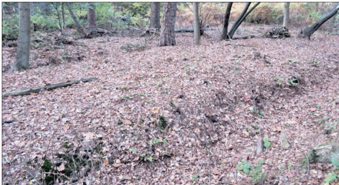
In het zelfde jaar (2014) een rabat op Landgoed Eyckenstein na opschoning.

het water af te kunnen voeren. Er ligt veel oud hout in de greppels. Vanwege de landschappelijke waarde van de rabatten worden op één van de locaties die greppels weer vrijgemaakt.