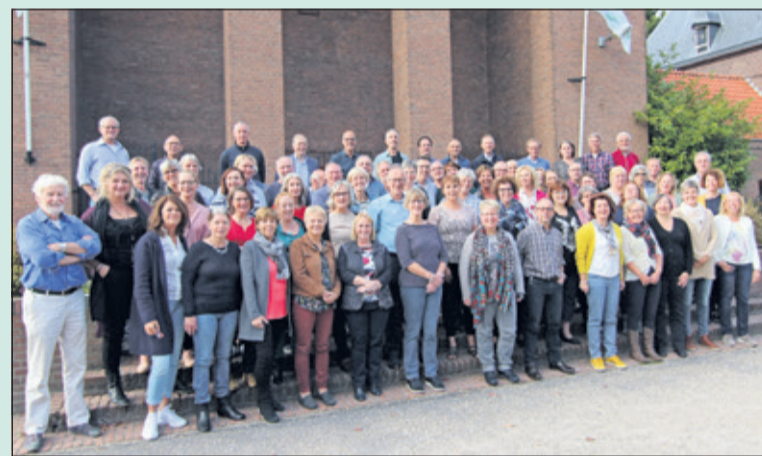
Plm. 65 (van de 85) koor- + comboleden waren zaterdag naar De Bilt terug van plm. 29 jaar weggeweest.

De voorbereidingen, om met dit koor op zondag 11 november nog eens een ouderwetse jongeren-mis te beleven zijn in volle gang. Op zaterdag 20 oktober kwamen combo en zoveel mogelijk koorleden bij elkaar voor een repetitiedag in de Michaelschool naast de kerk. Zaterdag 3 november komen ze nogmaals bijeen voor de generale repetitie; allemaal voor die eenmalige revival op 11 november om 10.30 uur in de Michaelkerk aan de Biltse Kerklaan.