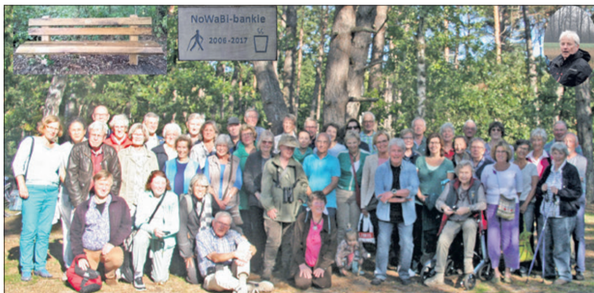
Een trouwe Nordic Walking groep heeft het bankje in het bos financieel mogelijk gemaakt.