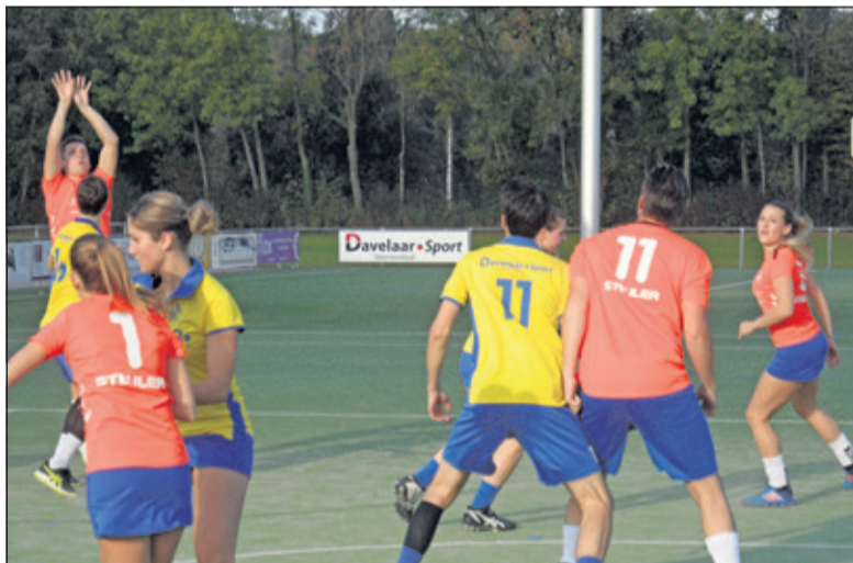
De passie en inzet van beide teams was groot en iedereen ging vol voor de winst.