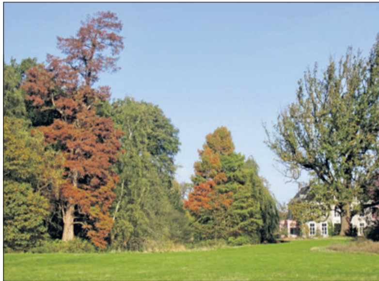
Sandwijkstraak in herfstkleuren.

Zondag 28 oktober organiseert de Werkgroep Sandwijkstraak samen met Het Utrechts Landschap een rondleiding over het landgoed. Op het landgoed staan veel boomsoorten met ieder hun eigen herfstkleur. Op Sandwijkstraak staan veel bomen die de droogte van deze zomer goed hebben doorstaan en nu volop kleuren. De wandeling begint om 14.00 uur en duurt ongeveer twee uur. Het verzamelpunt is de parkeerplaats op Sandwijkstraak aan de Utrechtseweg 301 (De Bilt), recht tegenover het Van Boetzelaerpark. Als het vochtig weer is, zijn laarzen of hoge schoenen nodig. De rondleiding is gratis. Honden zijn (ook aangelijnd) niet toegestaan op Sandwijkstraak.