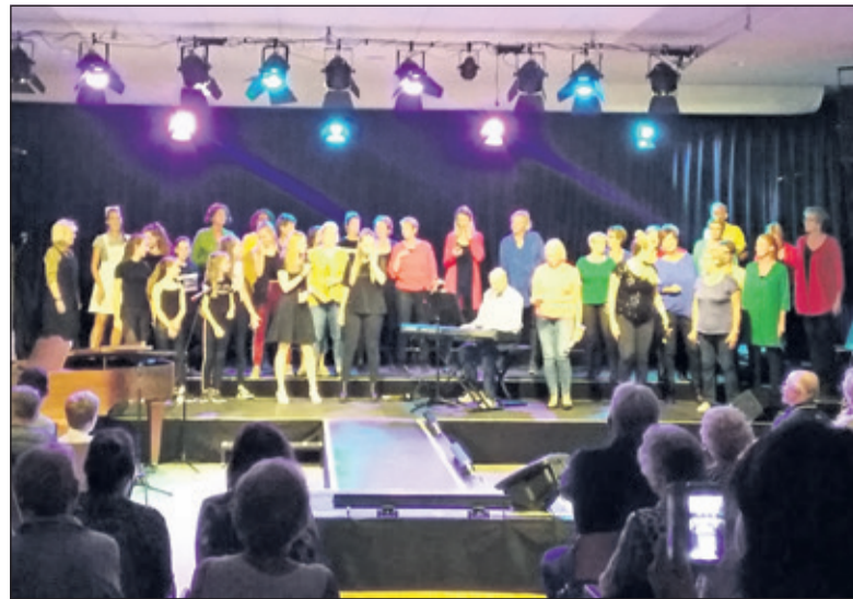
Een volgepakte Vierstee zingt lekker mee.