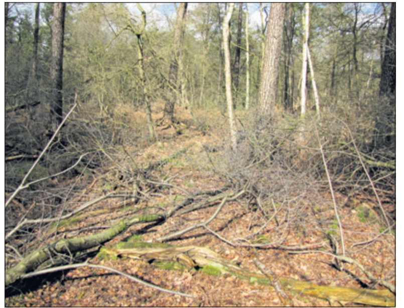
Deze rabat op Landgoed Eyckenstein was in 2014 rijp voor opschoning.

Landgoed Eyckenstein in Maartensdijk omvat ruim 400 ha bossen, landbouwgronden en cultuurgebied. Het is particulier bezit van de familie Van Boetzelaer. Het aaneengesloten historische deel van het landgoed bevindt zich in Maartensdijk bij de buitenplaats Eyckenstein. Op enkele plaatsen op het landgoed zijn historische rabatten te vinden. Dat zijn langwerpige ophogingen die gelegen zijn tussen greppels, die bedoeld waren om in natte gebieden tussen de aanplant