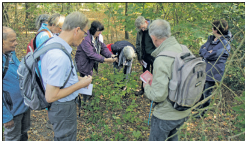
Grote belangstelling voor de paddenstoelenwandeling.

Ondanks de droogte (deze zomer) waren er toch wel redelijk veel paddenstoelen te zien, vaak niet in ideale toestand. Wat opviel was dat er redelijk wat parasolzwammen waren, verder rusula, ammonieten, boleten etc. Er werd gevoeld, geroken en geproefd - natuurlijk omdat er experts bij waren; 'doe dat niet op eigen houtje, want er zijn erg giftig onder de paddenstoelen'. Nu maar hopen op wat regen, zodat de opruimers in de natuur in grote getallen ontkiemen en hun werk kunnen doen. (Wim Westland)