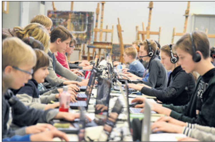
Jongeren spelen Minecraft.

Hierbij wordt niet alleen gekeken naar het eindresultaat, maar ook naar de samenwerking binnen het team. Inschrijven kan via www.ideacultuur.nl/minecraft naar de samenwerking binnen het team. (Janneke Kingma)