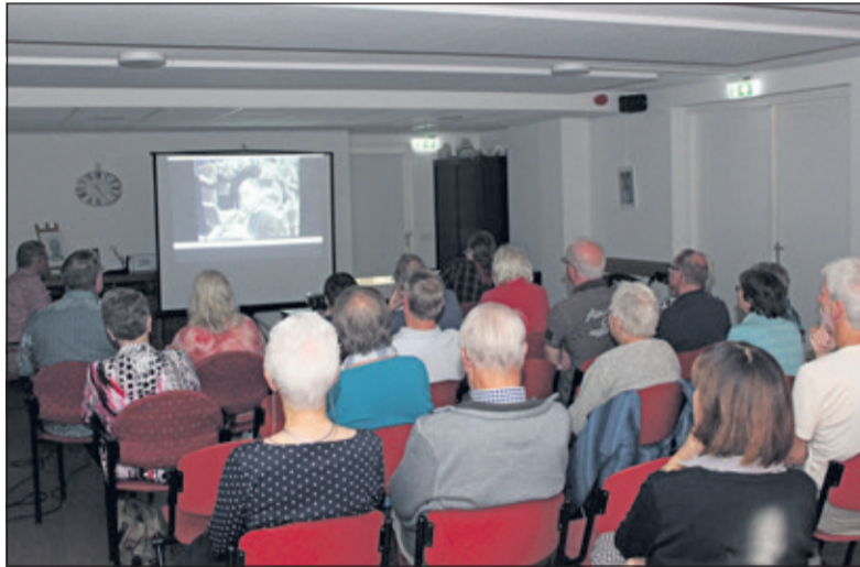
Er was ruime belangstelling voor de filmvoorstelling op 15 oktober.