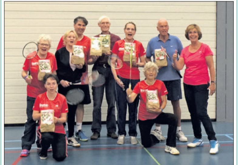
De badminton DO(nderdag)MO(rgen) groep van SV Irene speelde 18 oktober haar jaarlijkse bloembollen-toernooi. De prijzen waren deze keer voor de spelers die nog een extra steuntje in de rug kunnen gebruiken. De groep kan nieuwe leden gebruiken: aanmelden kan via secretaris@sv-irene.nl of cagterberg@hetnet.nl .