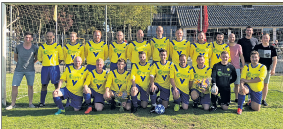
SVM 3 loopt er weer schitterend bij dankzij de nieuwe tenues van Adchieve next level PPC.