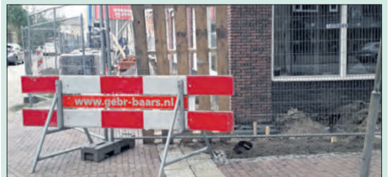
Een geleidelijn wordt onderbroken door werkzaamheden.

Vorige week was de Week van de Toegankelijkheid waar in De Vierklank aandacht voor was. De werkgroep De Bilt voor Iedereen gaf aan dat er verbeteringen in de toegankelijkheid gekomen zijn, maar dat er ook nog plaatsen zijn waar wat aan gedaan moet worden. De werkgroep stelt dat gedrag van mensen vaak de oorzaak is van belemmeringen.