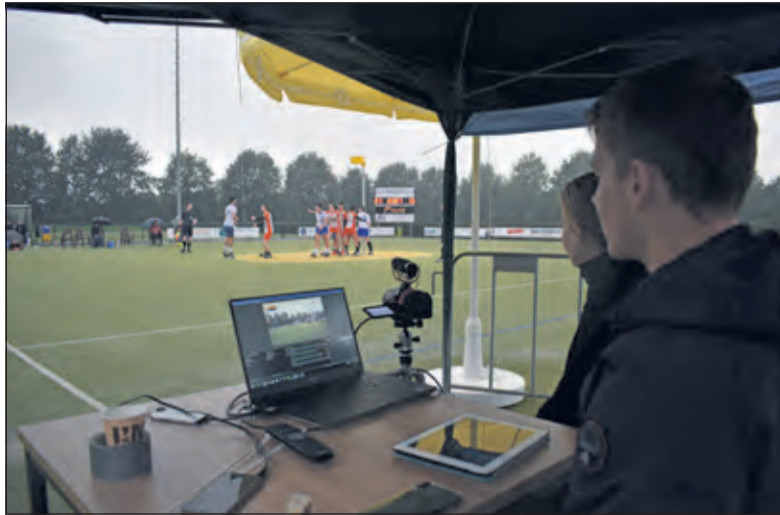
Supporters konden thuis, droog, de wedstrijd via livestream volgen.

De zaterdag begon in Maartensdijk zonnig, maar naarmate de middag vorderde leken de donkere wolken zich alleen maar boven het veld van TZ te verzamelen. Vanaf het eerste tot het laatste fluitsignaal heeft het geregend. Dat is voor korfballers vaak een groot nadeel. Ondanks dat er vorige week ook in de regen gespeeld is, slaagde Tweemaal Zes er niet in om er beter mee om te gaan. De doelpunten waren erg schaars aan Maartensdijkse kant, en Wit-Blauw schoot een beter percentage. De rust werd ingegaan met een schamele 4 doelpunten: 4-9.