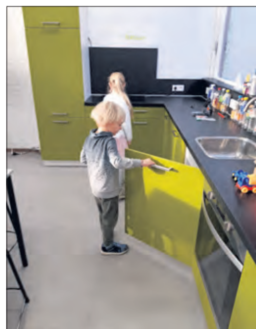
Nieuwsgierig kijken de kinderen rond in het nieuwe lokaal.

Na het wegtrekken van een doek door de kinderen kwam de naam van het lokaal tevoorschijn.