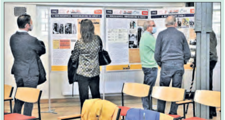
Belangstellenden bezoeken de tentoonstelling 75 jaar vrijheid.

De tentoonstelling is nog te bezoeken op 17 en 24 oktober, telkens van 11.00 uur tot 15.00. Aanmelden kan via secretaris@ historischekringdebilt.nl .