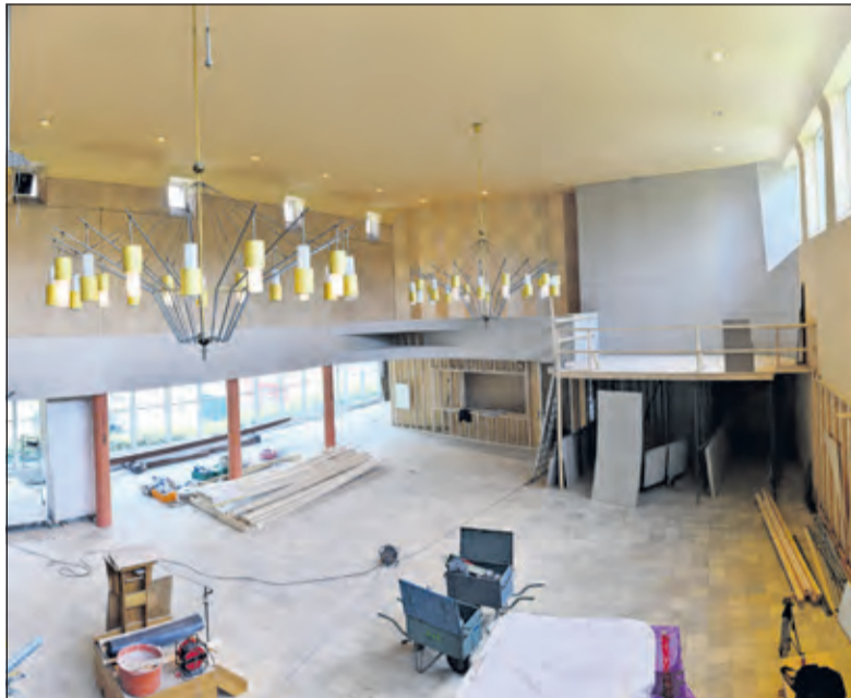
Van buiten blijft het gebouw zoals het is, maar het interieur ondergaat een complete gedaanteverandering.