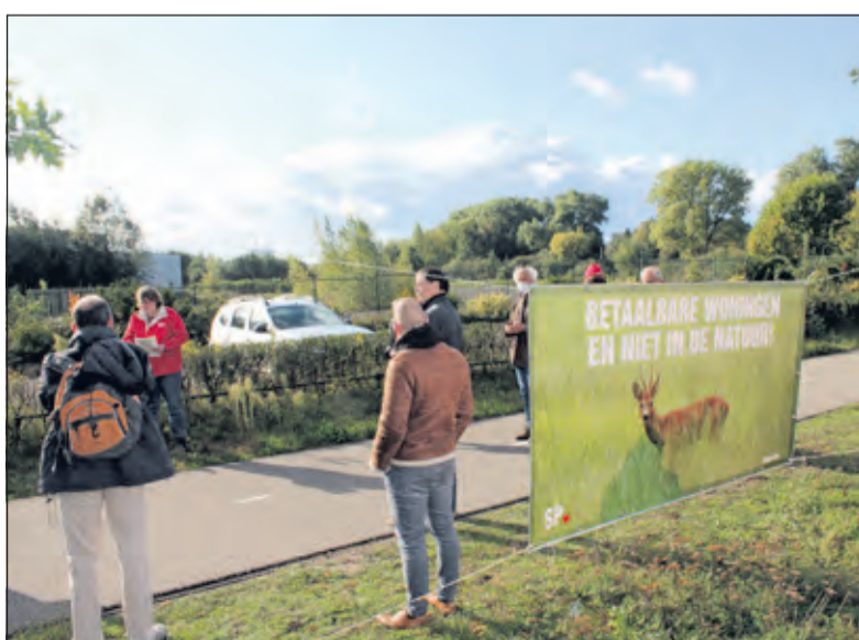
De boodschap wordt duidelijk verwoord.

Hessenweg 4 * 3731 JK, De Bilt hazekampparket.nl * 030 - 633 26 91