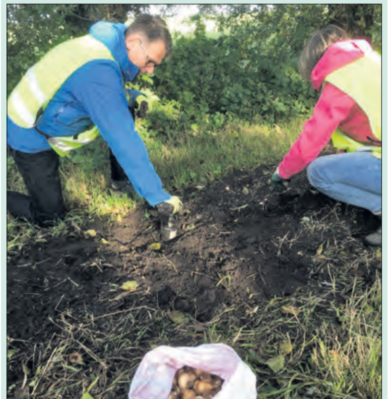
Bollen poten langs de Korssesteeg.