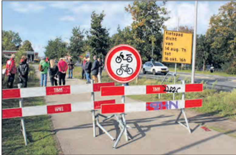
In verband met de bouw van de faunapassage is het fietspad afgezet.

‘De faunapassage komt er nu en dat is fantastisch. Maar wat niet zo fantastisch is, is dat een projectontwikkelaar hier 120 huizen gaat bouwen, hier, pal naast de faunapassage. Dat is zonde van het geld en zonde van de natuur. In 2015 kocht een bouw-