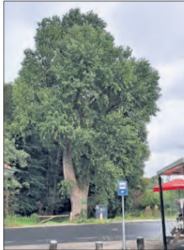
De zwarte populier in Hollandsche Rading.

Volgens Jørn Copijn betreft het hier een zwarte populier, officieel de Populus nigra : 'Een geweldige boom, een monument voor zijn omgeving. Meestal met een zeer goede standvastigheid, mits er niet te veel aan gesnoeid wordt. Dat de boom nu ca 70 jaar oud is kan goed mogelijk zijn. Dergelijke populieren zijn er weinig, omdat men in Nederland slecht tegen grote bomen kan'. Volgens gegevens van internet kunnen deze bomen wel 100 tot 150 jaar oud worden met uitschieters tot 300 jaar'.