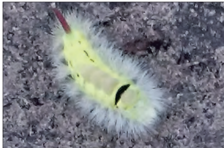
De meriansborstel op Beerschoten.

De meriansborstel komt overal in Nederland voor. De vlinder vliegt vooral in het voorjaar. Nu is de rups veel aanwezig en wordt vooral gevonden onder de zomereik. Ook de komende weken kan men ze nog tegenkomen.