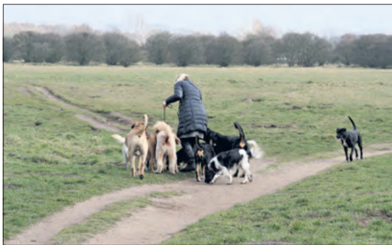
Vanaf volgend jaar zomer mogen er maximaal drie honden per begeleider mee de natuur in.

Ook bij natuurbeheerder Staatsbosbeheer hanteren ze de regel van maximaal drie honden per persoon. Dit is niet een zomaar gekozen getal. Met drie honden is er nog geen sprake van een roedel en blijven de honden onder appèl. Dit betekent dat de hond goed moet luisteren naar zijn baas, geen overlast mag veroorzaken en moet zoveel mogelijk op de paden blijven.