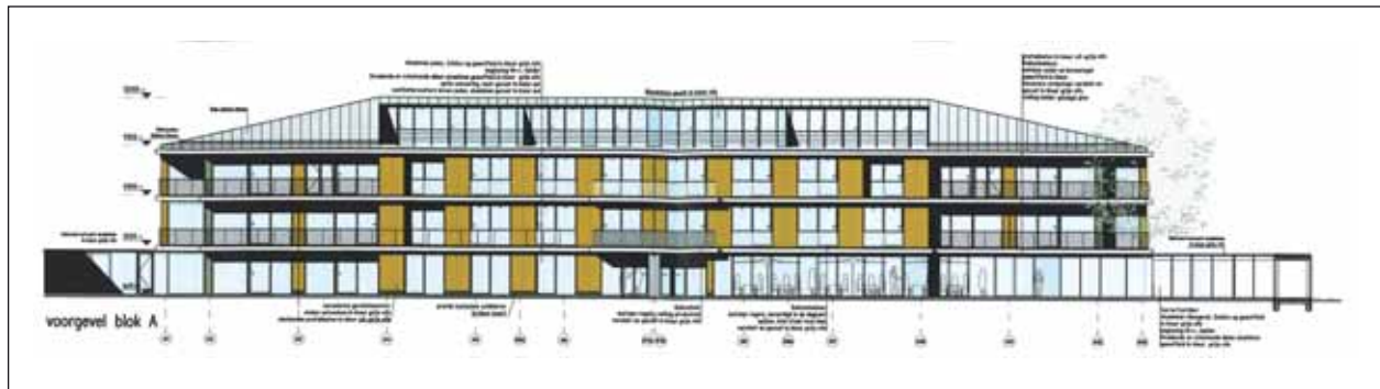
Zo komt de voorzijde van het gebouw er uit te zien.

gebruikt. De gemeente heeft aan de benaming 'verpleeghuis' een eigen invulling gegeven. Burgland Projectontwikkeling heeft een voorstel bij de gemeente ingediend voor het bouwen van een zorgcomplex in bos Beukenburg op de plek van de houten gebouwen. Dit complex bestaat uit drie gebouwen, die ieder vier verdiepingen tellen. De hoogte van de gebouwen bedraagt twaalf meter. In de gebouwen worden vijftien één- en tweepersoons luxe appartementen