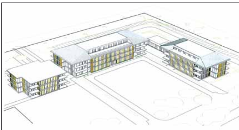
Artist Impression van het complex.

Op de informatieavond van 8 januari jl. werd door de gemeente aangegeven