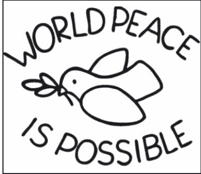
De kaart zoals die in Maartensdijk en De Bilt wordt verspreid.

Met deze actie wil 'World Peace is Possible' helpen om het scepticisme wat er is onder de mensen als het om wereldvrede gaat te overwinnen. Onze wereld wordt steeds kleiner. We worden door de moderne communicatiemiddelen steeds meer geïnformeerd over wat er overal gebeurt. Door de steeds snellere transportmiddelen wonen we ogenschijnlijk steeds dichterbij elkaar. Daardoor ontstaan, zo denkt 'World Peace is Possible',