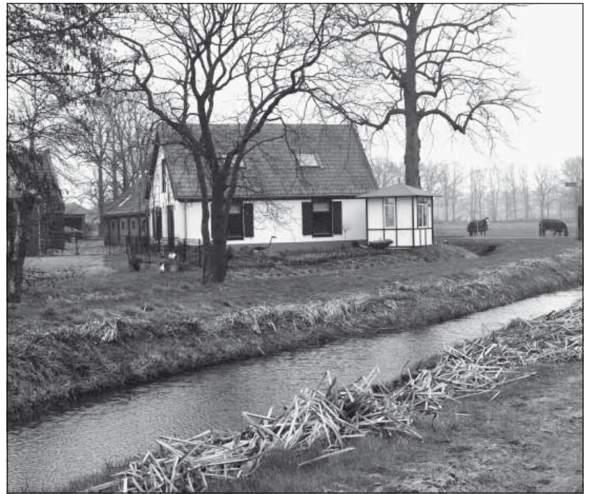
De zuidzijde van de boerderij.

Bladgroen bevattende planten nemen dagelijks op een ingenieuze wijze hun voedsel uit de lucht op. Dit wordt koolzuurassimilatie genoemd. De groene kleur van de plant wordt veroorzaakt door een groene kleurstof, chlorofyl- of bladgroenkorrels genoemd, die zich voornamelijk in de bladeren bevindt. Met dit bladgroen kunnen de planten met behulp van zonlicht en water uit het koolzuurgas (CO 2 ) in de lucht stoffen aanmaken die voor het leven van de plant essentieel zijn. Eerst wordt er door de plant in het blad suiker (glucose) gevormd hetgeen daarna wordt omgezet tot zetmeel. Dit proces kan alleen over-