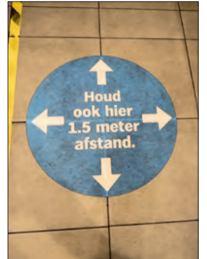
Het coronajaar bracht de anderhalvemeter samenleving.