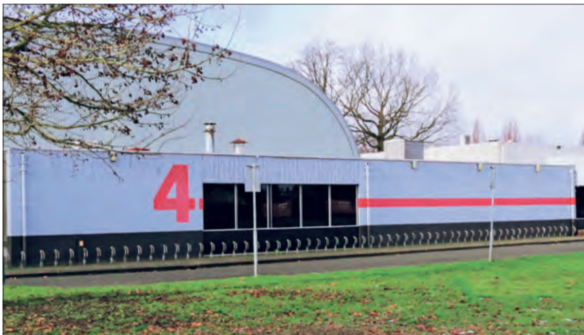
De af te breken sporthal wordt vervangen door een nieuwe met zonnepanelen.

'Wonen is niet alleen wonen het heeft ook een sterk sociaal aspect en spreiding van sociale woningbouw over de gemeente betekent dat juist in de wijk met uitsluitend koop, waar hier sprake van is, het uitermate geschikt is om sociaal toe