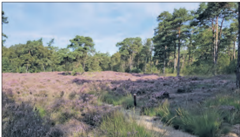
Met de heideterrein is een belangrijke stap gezet in de natuurlijke verbindingroute tussen het Gooi en de Utrechtse heuvelrug.

Woudloper wandelt bijna wekelijks in de bossen aldaar en heeft de werkzaamheden vanaf het begin op de voet gevolgd: ‘Van kaalslag tot een weer langzaam opbloeiend gebied. En nu, anno 2021, vlak voor de eindstreep, is juist dit gebied bij de gemeente De Bilt in beeld gebracht als één van de mogelijke locaties voor het plaatsen van 240 meter hoge windmolens. Ik vind de keuze van dit gebied als mogelijke locatie onbegrijpelijk; na al die tijd, geld en energie welke erin is gestopt om er een rijk natuurgebied van te maken zonder hindernissen. Voor de aanleg van deze turbines zal er bos moeten worden gekapt en worden er bouwplaatsen aangelegd. Dat gebeurt allemaal in het leefgebied van das, marter, vos en ree. En dat terwijl er toch meer rust in de natuur zou ontstaan doordat er geen landbouwwerktuigen meer over de paden zouden rijden? Alle bovenstaande doelen worden zo ondermijnd. Als deze locatie wordt gekozen is dat een pure verspilling van geld en natuur’.