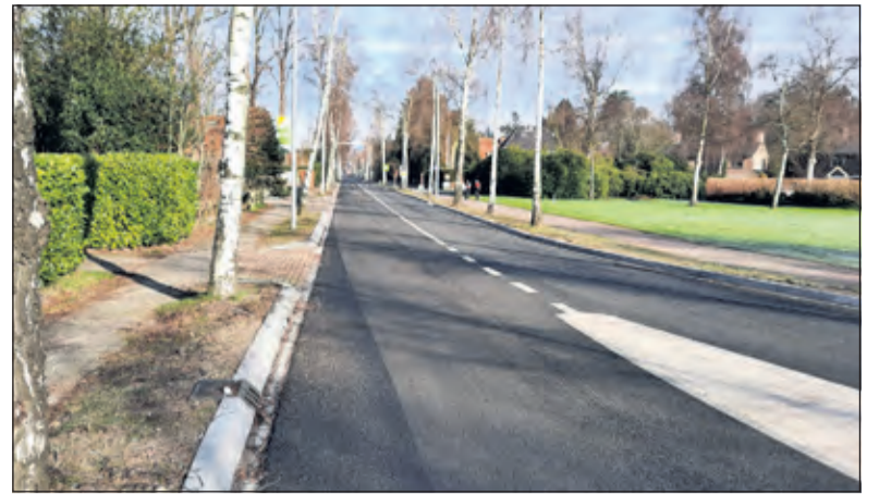
Vooralsnog wordt er geen boom onnodig gekapt.

Voorgesteld wordt om een kleine werkgroep te vormen, waarvan ook de deskundige namens de bewoners de heer Jørn Copijn deel van zal uitmaken. Uitgangspunt van de werkgroep is en volgens de provincie ook was, dat er geen enkele boom onnodig gekapt zal worden. De rapportages van de deskundigen van de provincie zullen hierbij ook aan de orde komen. Tevens zal er een plan worden opgesteld hoe er zal worden omgegaan met de huidige boomlocaties. De provincie spreekt daarbij haar vertrouwen uit