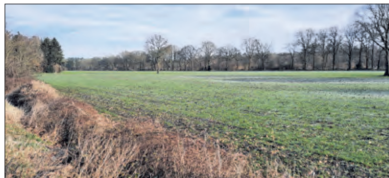
Hollandsche Rading komt in actie voor behoud van de natuur.

'Uit onderzoek gedaan in Zeeland blijkt dat dit soort windturbines fungeren als een soort gehaktmolen onder de vogels en vleermuizen, die hierdoor een wrede dood sterven. Door de enorme grootte en hoogte zal ieder huis in de kern van Hollandsche Rading, maar ook veel huizen buiten die kern last gaan ondervinden van de slagschaduw