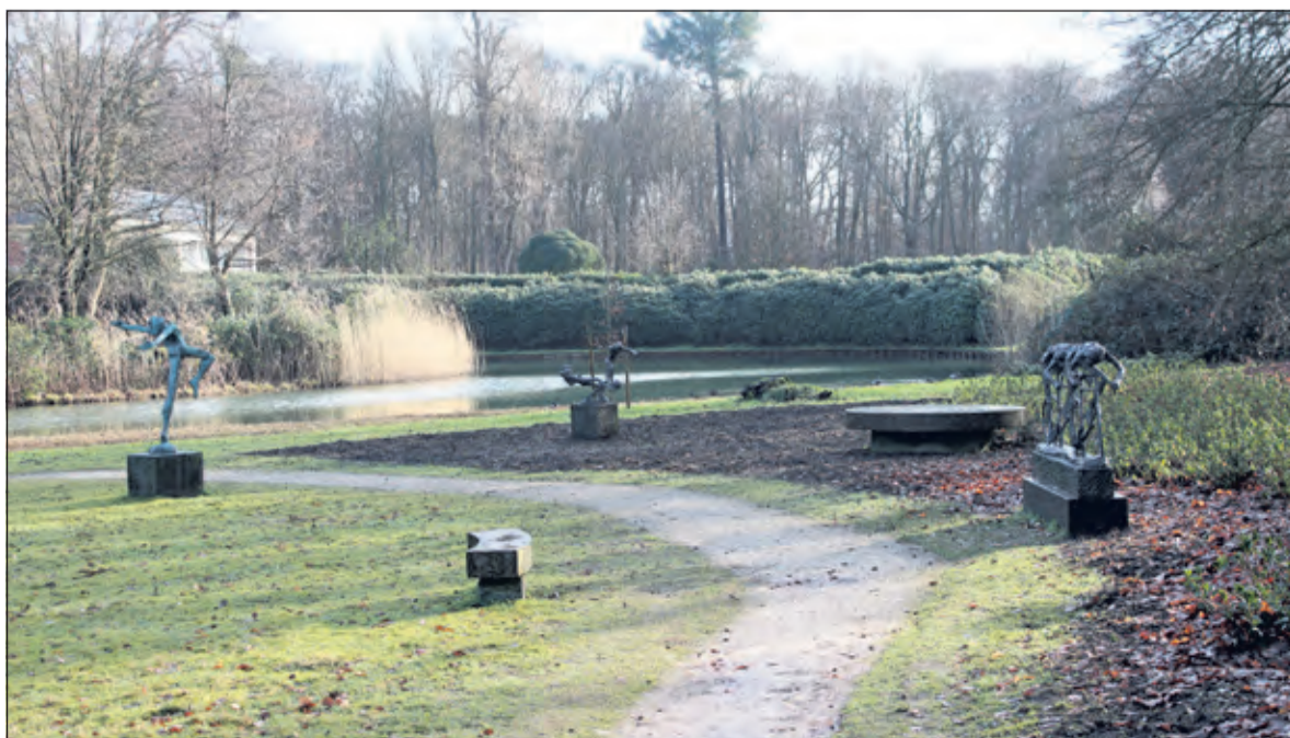
Via speels aangelegde paden kunnen bezoekers het veelzijdige oeuvre van de kunstenaar ontdekken.

Op Landgoed Houtringe trotseren de lakenvelders de winterse omstandigheden.