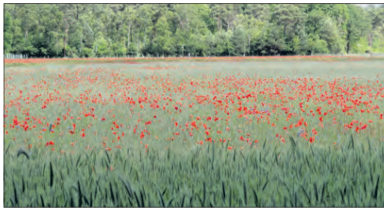
De landbouwgronden zijn omgevormd in kruiden- en faunarijke akkers en graslanden. (foto Lex van Boetzelaar)

De Gemeente De Bilt ging dinsdag 26 januari in gesprek met inwoners van met name Lage Vuursche en Hollandsche Rading over een onderzoek dat tot onrust onder inwoners heeft geleid. In een verkennende studie naar mogelijke locaties voor windmolens is onder andere het Maartensdijkse Bos Noord onderzocht. In het gebied zijn windmolens wettelijk gezien op voorhand niet uit te sluiten, maar er zijn ook belemmeringen die weggenomen of gecompenseerd moeten worden. Wethouder Brommersma: ‘Het betreft hier slechts een studie naar de wettelijk toegestane locaties voor windmolens. Gezien de belemmeringen liggen andere locaties meer voor de hand’.