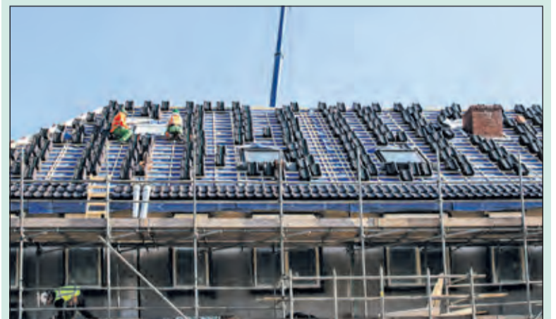
Er wordt al het nodige gebouwd, maar er is behoefte aan meer.

'Tot half februari heeft iedereen de tijd om een advies in te dienen. Dan gaat het redactieteam aan de slag. Tussen half februari en half april komen we meerdere avonden bij elkaar. Naar verwachting gaat het om vier avonden. Zoals het er nu uit ziet gebeurt dit digitaal. Daarnaast zult u nog wat tijd nodig hebben voor de voorbereiding van de avonden. De gemeente organiseert de avonden en zorgt dat alle adviezen inzichtelijk zijn aangeleverd. Samen bepalen we wat de beste aanpak en opzet is van de redactiebijeenkomsten is. Om het gesprek op gang te helpen zal de gemeente hiervoor een eerste voorstel doen. Wanneer we het hierover eens zijn werken we dit verder uit. Wilt u graag deelnemen in het redactieteam? Ook als u hierover nog vragen heeft. Stuur een e-mail naar samenwerkenaanwonen@debilt.nl , dan nemen wij contact met u op'.