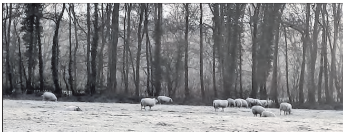
Winterlandschap in Hollandsche Rading.