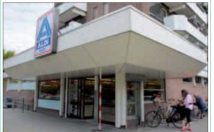
In de loop van de middag was alles weer rustig bij de Aldi.

De vrouw ging toen boodschappen doen en kreeg het volgende van een kassamedewerker te horen: 'Hij zei dat de mannen de chef van de Aldi met een pistool hadden bedreigd, dat mogelijk niet een echt wapen was. Ze probeerden hem de code van de kluis te ontfutselen, maar hij was zo in shock, dat hij zich de combinatie niet meer kon herinneren. Elke keer zei hij wat anders, maar steeds de verkeerde cijfers. Toen zijn die overvallers ergens van geschrokken en ze zijn er vandoor gegaan. Ze hebben alleen een paar pakjes sigaretten meegenomen.' De buurtbewoonster is blij dat het nog redelijk goed is afgelopen: 'Gelukkig zijn er geen ongelukken gebeurd.' Zij weet hoe het de vorige twee keer dat er ingebroken werd in de Aldi is toegestaan: 'De overvallers zijn steeds erin gekomen via een ruitje links van de entree. Dat gooiden ze in. Het is groot genoeg dat ze er net doorheen kunnen. Dan kwam de politie en iemand van de glashandel, die het ruitje weer snel vervangt.' Zij voelt zich niet angstiger dan daarvoor, maar het voorval drukt wel een stempel op haar veiligheidsbeleving: 'Ze slaan nu al toe op klaarlichte dag. Die lui zijn nergens meer bang voor. En om de slachtoffers geven ze niets, ook al houden die er psychische klachten aan over.'