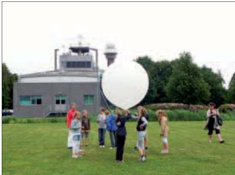
Leerlingen van de Van Dijkschool lieten een weerballon op.

De kinderen die mee zijn gegaan naar het KNMI hebben in de klas een presentatie gehouden over de activiteiten die ze bij het KNMI mochten beleven. De kinderen waren heel erg enthousiast en vonden het een zeer leerzaam en geslaagd bezoek. Dit blijkt ook uit