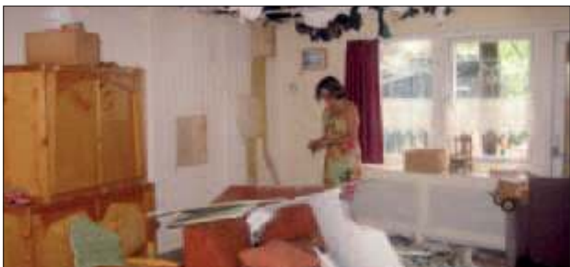
De ravage in het lokaal van de Rudolf Steinerschool.