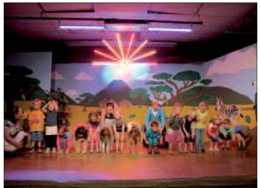
De kleintjes van groep Rood zongen met hun leidsters Hoofd, schouders, knie en teen. Het was nog een beetje moeilijk voor sommigen om op het goede moment het juiste lichaamsdeel aan te wijzen, maar plezier hadden ze allemaal.