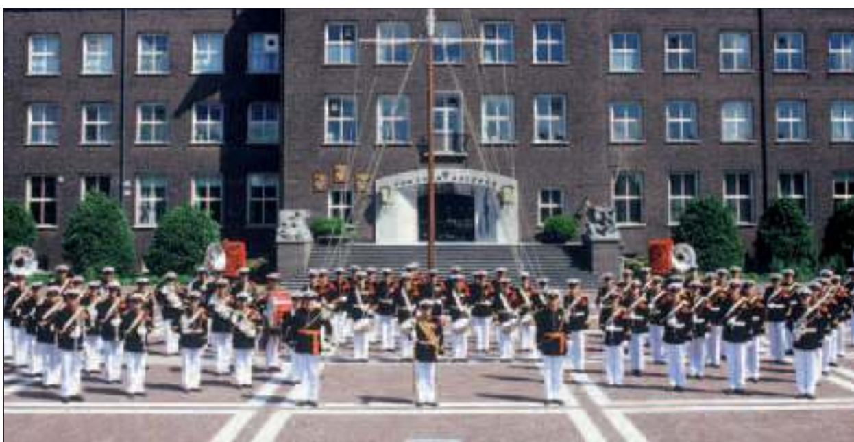
Absoluut hoogtepunt is de komst van de marinierskapel op 17 juli.

te doen: dat is de top van Nederland. Een orkest dat wereldwijd zijn kwaliteiten ten gehore brengt.' Het concert is op zondagmiddag van 14.00 tot 16.00 uur, achter paviljoen Beerschoten, De Holle Bilt 6A in De Bilt en gratis toegankelijk. Er zijn 500 stoelen beschikbaar.