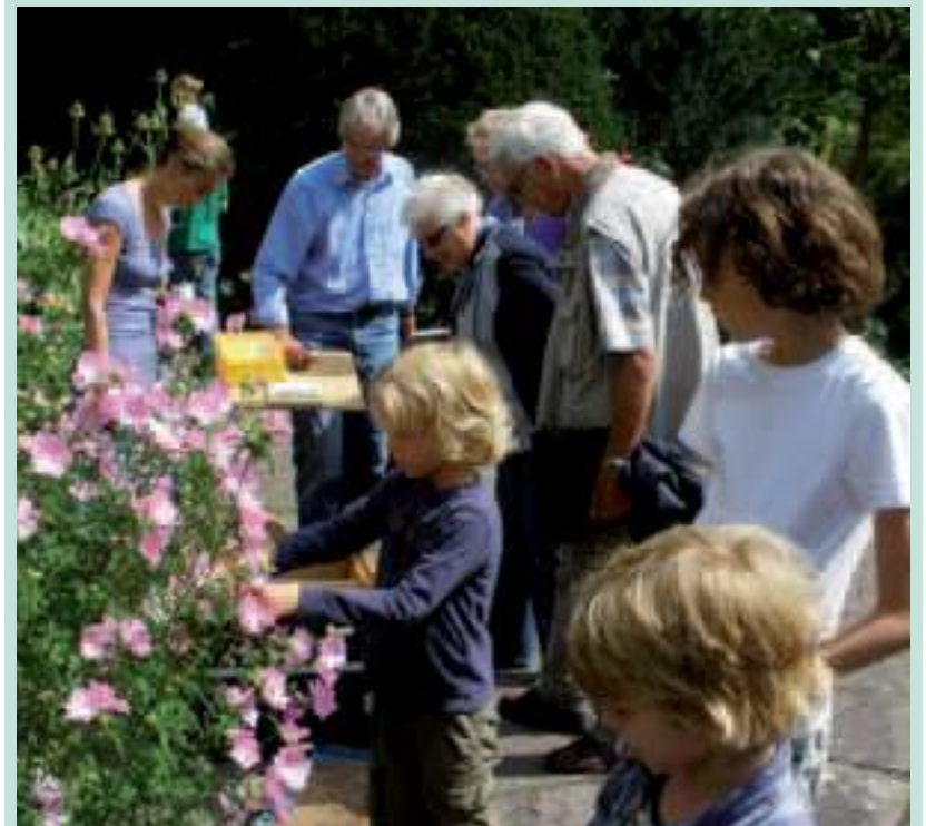
De open Imkerijdag in Groenekan mocht zich in een forse belangstelling verheugen. Het prachtige weer - en natuurlijk het enthousiasme van de betrokken imkers - maakte van een 'bijenstudiedag' in de prachtige tuin aan de Kastanjelaan voor veel bezoekers een bijna idyllische onderneming.