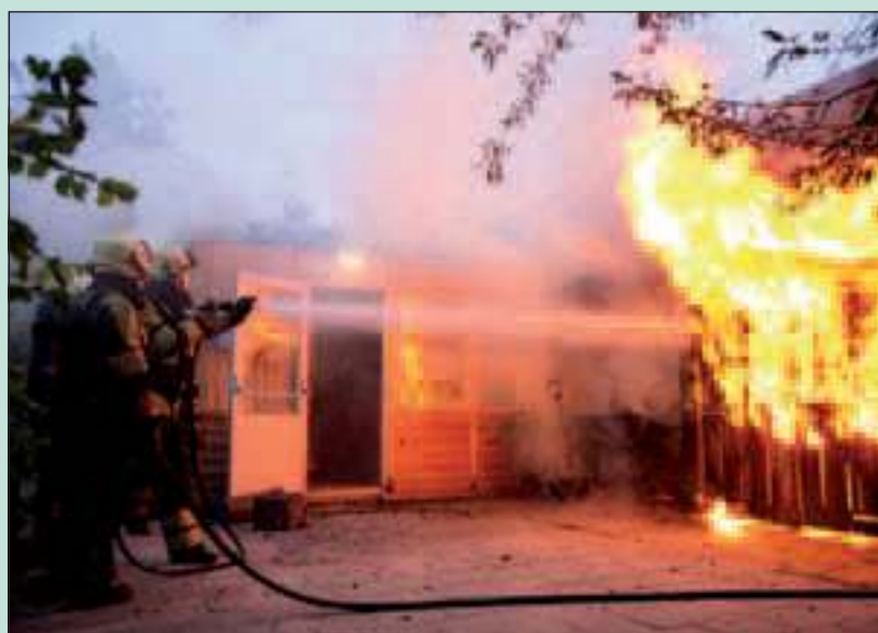
Afgelopen weekend woedde er o.a. een forse brand bij de Rudolf Steinerscholen in De Bilt. Meer hierover op p. 3