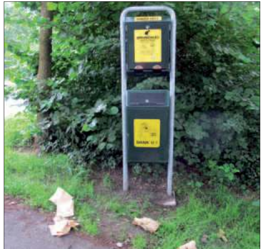
Een hondenhalte in De Leijen, waar stevige papieren zakjes kunnen worden getrokken om de hondenpoep in te doen en weg te werpen.

De Vierklank sprak met enkele hondeneigenaren over het probleem. Een vrouw die haar hond meestal in het bos uitlaat, verzekert: 'Als mijn hond op de stoep of op straat poept, ruim ik het altijd op. Ik erger me dood aan