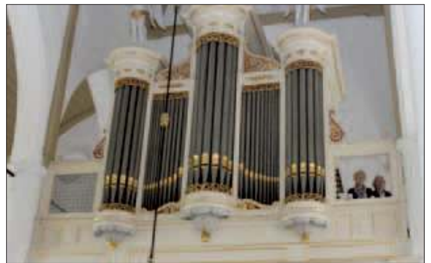
Het Westbroekse orgel is één van de vier Flaes & Brünjes-orgels binnen de provincie Utrecht.

Ook de orgels van de Hervormde Kerk van Westbroek (1879) en van Lage Vuursche (1881) worden besproken. Beide orgels zijn in hun vormgeving nog geënt op 18e-eeuwse tradities. Het orgel in Lage Vuursche is gemaakt door de firma Petrus van Oeckelen & Zn te Harenmolen (Groningen). Het front heeft een klassieke vijfdelige indeling met een geronde middentoren, twee lagere, eveneens geronde zijtoren en gedeelde, licht geholde tussenvelden waaraan als eigen element twee vlakke torenvelden ter weerszijden van de middentoren zijn toegevoegd. Het Westbroekse orgel is één van de vier Flaes & Brünjes-orgels binnen de provincie Utrecht. Deze orgelmakers ontvingen hun opleiding bij de firma J. Bätz & Co in Utrecht. De orgels van Flaes & Brünjes hebben veelal eenzelfde aanblik: drie ronde torens en met onge-