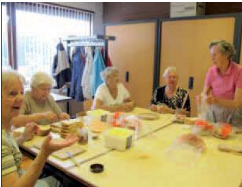
Samen brood smeren is zo gezellig dat de tijd omvliegt.

Dit jaar moesten kinderen worden afgewezen omdat de ouders hen te laat hadden aangemeld, toen de groepsindeling al was gemaakt, meldt Ruud Bos. 'Als de Kindervakantieweek volgend jaar doorgaat - en dat hangt af van wat de gemeente in september gaat besluiten over de bezuinigingen in de sociale sector - kunnen ouders hun kinderen in april aanmelden. Dat is mogelijk tijdens aparte gesprekken, die we evenals de precieze data via de media bekend zullen maken, maar ook door een formulier op onze website www. http://www.vvsowvt.nl in te vullen.'