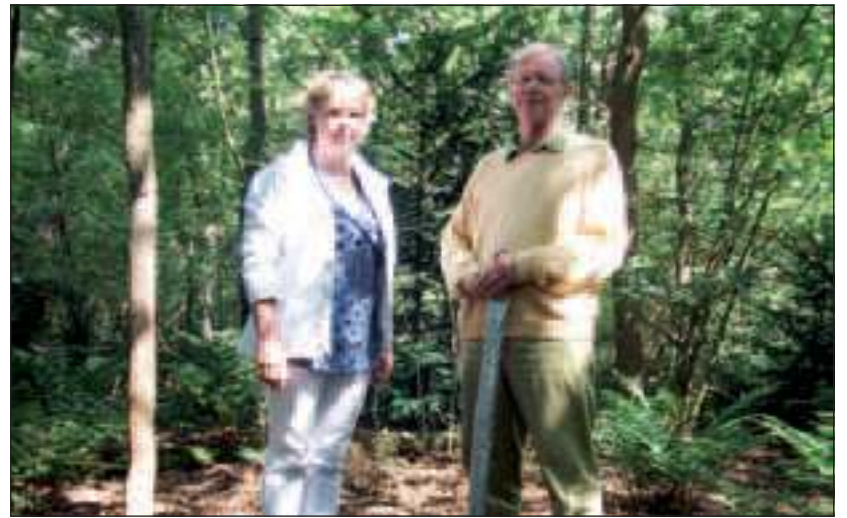
Bewoners vrezen dat de natuurbegraafplaats een rigoureuze ingreep in de natuur betekent.