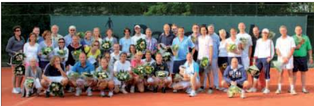
De prijswinnaars die hun finales op de zondag speelden.

Van 25 juni tot en met 3 juli werd op de tennisbanen van TV Hollandsche Rading het traditionele Open Bosbergtoernooi georganiseerd. De vernieuwde Advanced Red Court banen