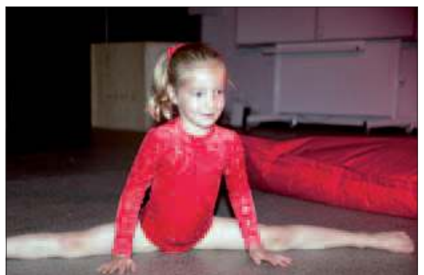
In de finale van 'BSO Got Talent'.