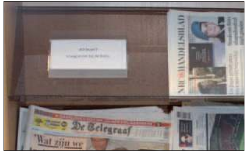
Op de plek waar de krant normaliter lag, was met forse letters de aankondiging te lezen: AD Lezen? Vraag erom bij de balie.

Je mag de krant meenemen, maar ... je moet wel een onderpand geven! Je portemonnee met daarin naast wat kleingeld ook je rijbewijs? Je succesagenda of misschien zelfs je colbert? Na een heldere ingeving vraag je: 'Mag het ook een visitekaartje zijn?' Dat mag en met een hoofd vol vraagtekens en een handvol AD ga je naar