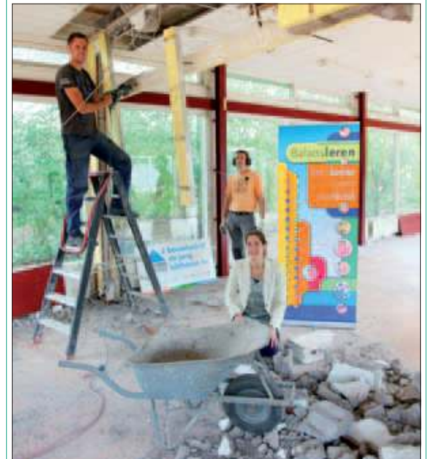
Op 15 augustus opent Balansleren, groep 1,2,3, in Bilthoven zijn deuren.