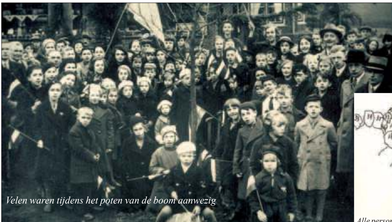
Velen waren tijdens het poten van de boom aanwezig