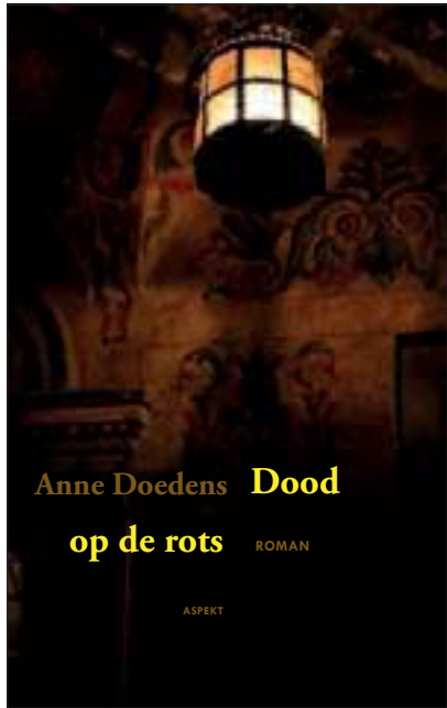
De omslag van het boek dat in juli uitkomt.

Doedens bestudeerde een wetenschappelijke dissertatie over Orvieto. 'Daarin wordt uiteengezet wat er met het stadje gebeurt als in 1348 de pest toeslaat. Er vallen zoveel doden, dat er een complete verandering in de stad komt. Als meer dan de helft van de bevolking wegvalt heb je een totale doorstroom. Bij het zien van de plaatjes bij het verhaal werd mijn fantasie geprikkeld en ging ik me verder