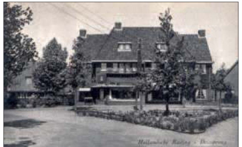
Foto uit 1950 van de winkels met er voor het plantsoentje waarin de lindeboom staat