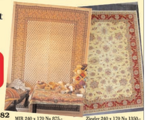
MIR 240 x 170 Nu 875,-

Steenhoffstraat 64, Soest, tel. 035 - 533 86 82