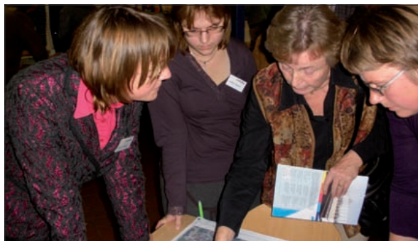
Omwonenden in discussie met RWS over de situatiekaart van de verbrede A27.

Op dit moment lijken de ruimtelijke offers die Groenekan moet brengen voor de verbreding van de A27 beperkt. RWS stelt dat de ruimte op het bestaande tracé voldoende is om de verbreding naar 2x3 rijstroken te realiseren. Wellicht dat hier of daar het bestaande talud zal moeten wijken voor een steilere damwand. Verder zal er misschien een aanpassing van