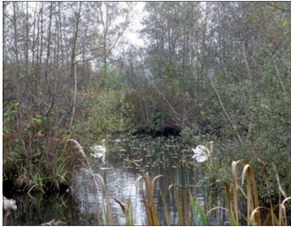
Een prachtig natuurreservaat doorklief je niet met een recreatiepad.

Uiteraard leggen wij ons oor ook te luister bij de gedachte veroorzaker van het mogelijke leed. We bellen op vrijdag 30 oktober met boswachter Corien Koreman van Staatsbosbeheer