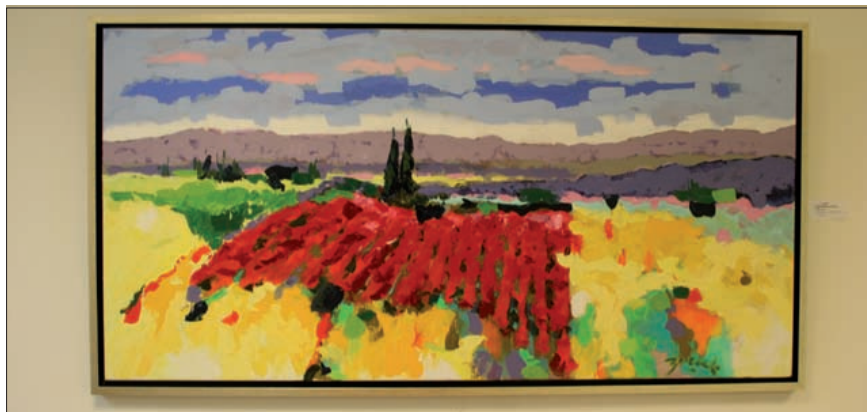
'Paysage en midi' van kunstenaar Brauck.

De expositie loopt tot 1 januari 2010 en de expositieruimte is elke donderdag van 12.00 tot 18.00 uur; elke vrijdag van 12.00 tot 21.00 uur en elke zaterdag van 11.00 tot 17.00 uur geopend.