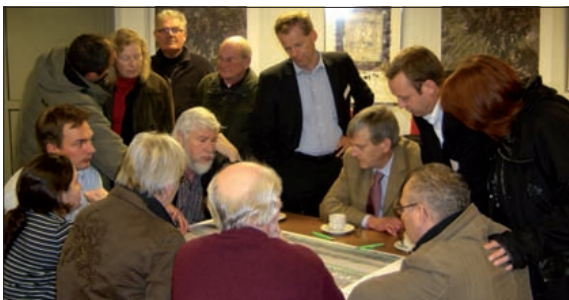
Bewoners konden slechts op tafels uitgestalde foto's bekijken waarop het tracé van de voorkeursvariant betreffende de verbreding van de A27 was ingetekend.