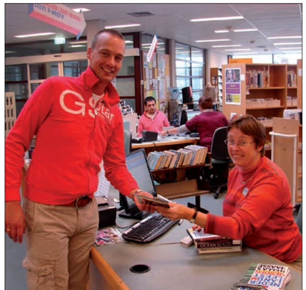
Mannen lezen andere boeken dan vrouwen.

In de gemeente De Bilt zijn veel mensen actief bij een leeskring, waar boeken besproken worden. Voor iedereen die op zoek is naar een leeskring, organiseren de bibliotheken een informatiebijeenkomst. Tijdens deze bijeenkomst wordt informatie gegeven