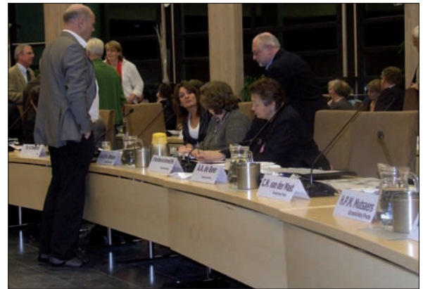
Een schorsing tijdens de behandeling van het vervolgtraject voor de bunker.

de bunker. 'Als dit op korte termijn tot een vruchtbaar gesprek leidt en er snel gewerkt kan worden aan een oplossing, is dat iets waar de gemeenschap bij gebaat is.' Hij noemt dit geen stellingname tegen ontploffen, maar een zaak van voortschrijdend inzicht.