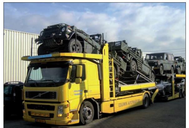
Een trailer met jeeps van defensie.

'Wij zijn niet aan grenzen gebonden. Onze transportafdeling zit niet alleen in Nederland maar ook in België, Duitsland en Frankrijk. Vandaag halen we een gestrande vrachtwagen uit Straatsburg op en nemen een vervangende auto mee. We hebben net twee trailers met jeeps en zo binnen van defensie en die komen waarschijnlijk uit Afghanistan. Wij brengen die van hier dan weer naar Roosendaal. We doen vandaag ook een klus voor een dealer die geen eigen transport heeft