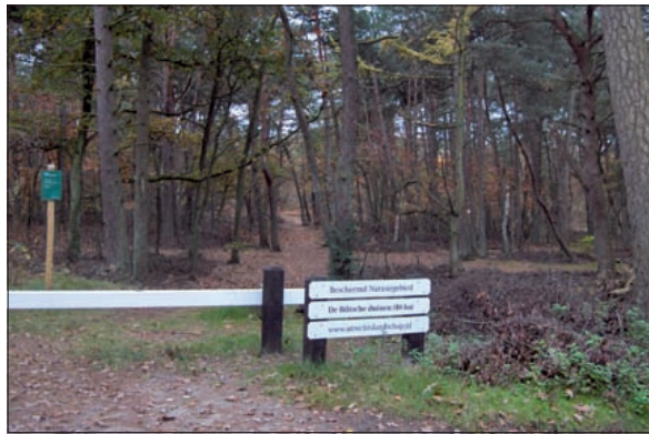
Het college van burgemeester en wethouders van de gemeente De Bilt heeft het natuurgebied De Biltse Duinen aangewezen als gemeentelijk landschapsmonument.

Belangrijkste argumenten voor aanwijzing zijn: De afwisseling van bos, heiderestanten en open zand verte-