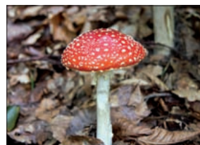
Vervolg op pagina 13

De verordening ligt tijdens kantooruren ter inzage bij het informatiecentrum van het gemeentehuis, Soestdijkseweg zuid 173 in Bilthoven. Tegen betaling van een legesbedrag kunt u een kopie verkrijgen. Daarnaast treft u de verordening aan op de website van de gemeente De Bilt www.debilt.nl en www.overheid.nl .