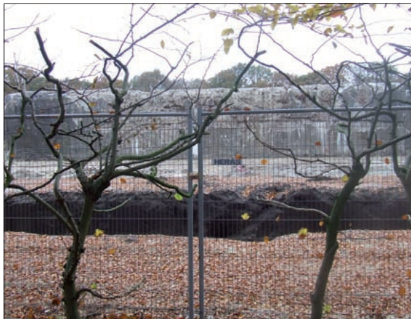
De bunker blijft geschiedenis schrijven.