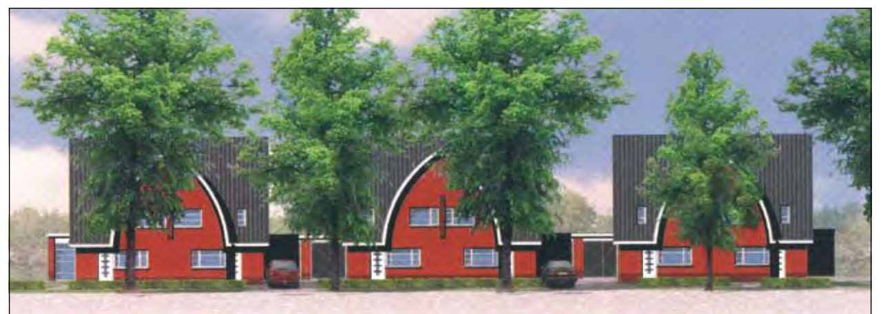
Architect Hans van den Dobbelsteen liet zich voor de gebogen kappen in zijn ontwerp inspireren door de vorm van de betonnen bovenleidingpalen van de spoorweg Utrecht-Hilversum.

Een kleine week na de afstempling van de kaart op zondag 29 juli 1928 opende Prins Hendrik namens koningin Wilhelmina de IXe Olympiade in het Olympisch Stadion te Amsterdam. Vrijdag 8 augustus a.s. vindt dit weer plaats, maar nu in China.