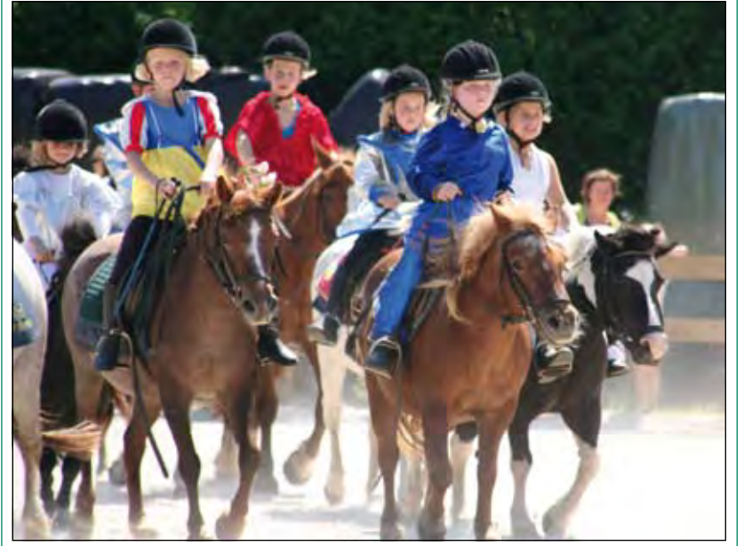
Best moeilijk om tijdens een carousel naast elkaar te rijden.

Bij Stal van Brenk worden dit jaar 3 weekkampen georganiseerd. Twee dagkampen en een slaapkamp. Kijk voor meer informatie op www.stalvanbrenk.nl