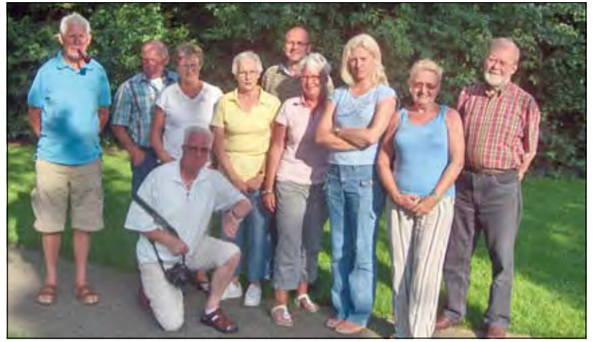
De meest betrokken bewoners aan de Prins Bernhardlaan zijn niet erg opgetogen over de te verlenen kapvergunning.